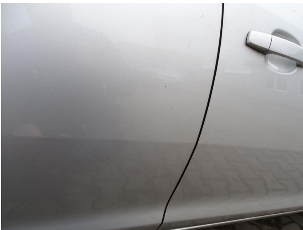
Fot. 36. drzwi pt