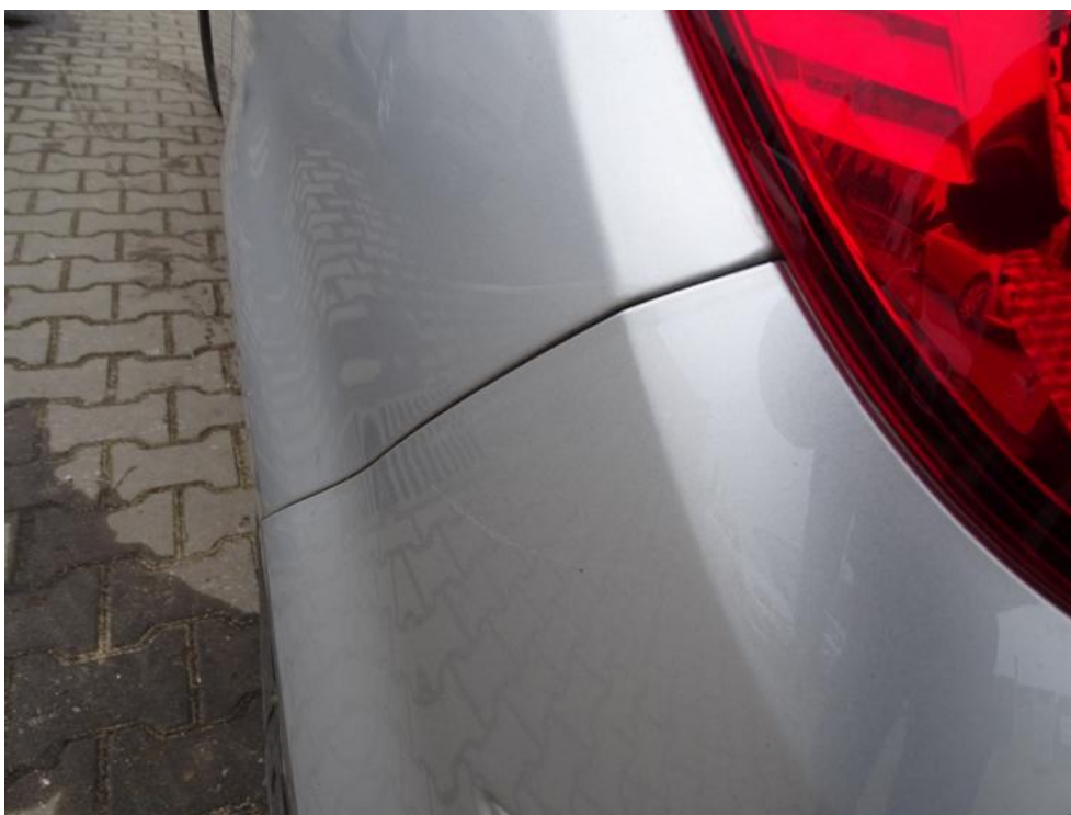
Fot. 45. zderzak t