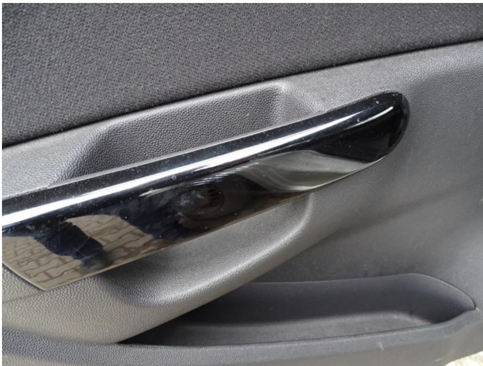
Fot. 17. drzwi lt