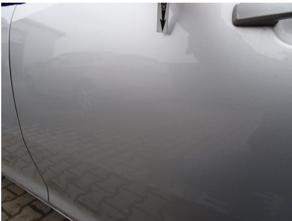
Fot. 48. drzwi lt