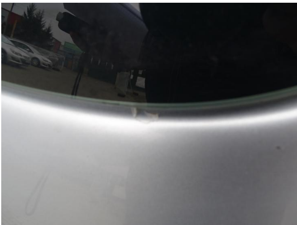
Fot. 40. pokrywa t