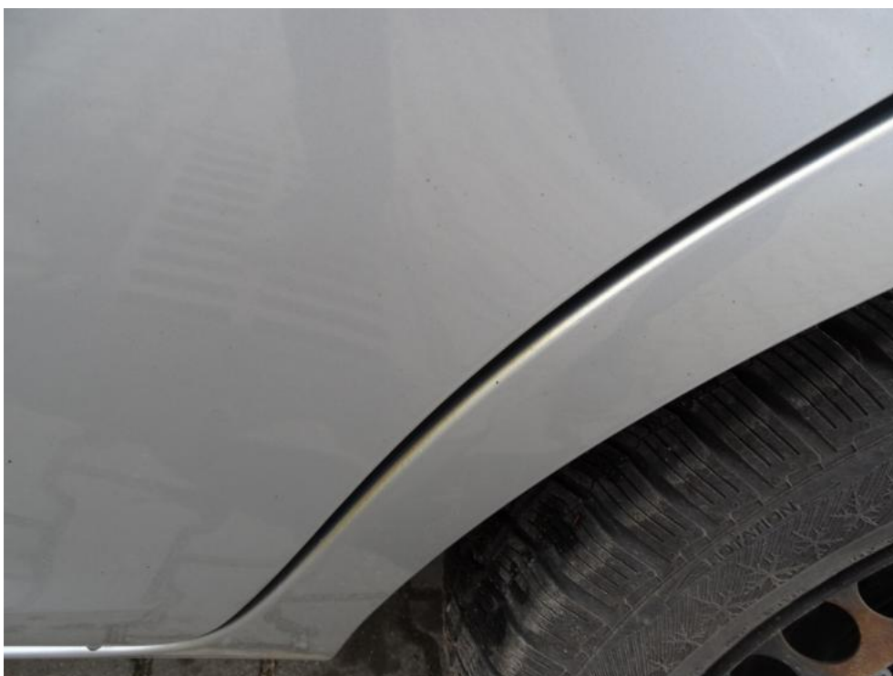
Fot. 30. błotnik lt