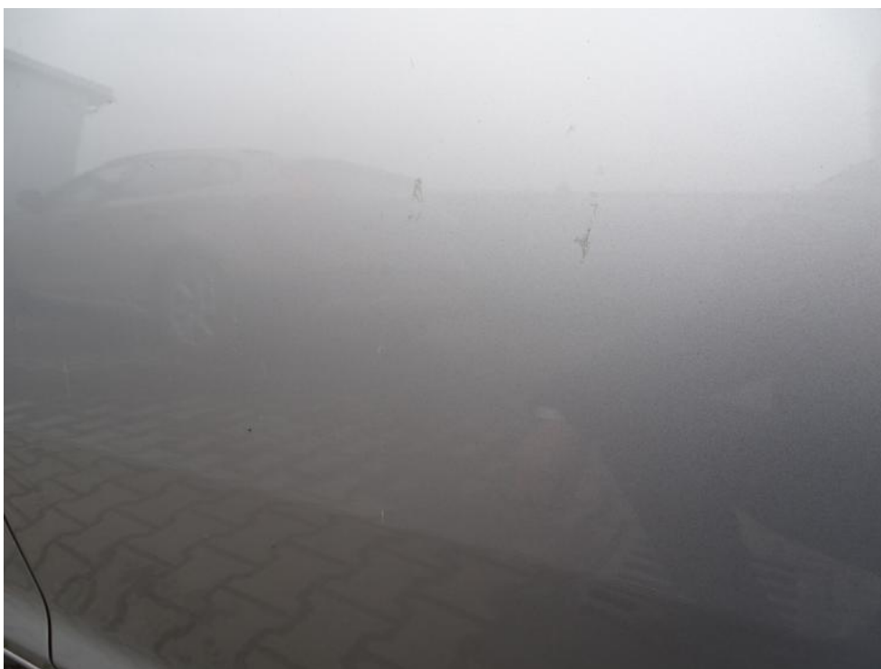
Fot. 46. drzwi lt