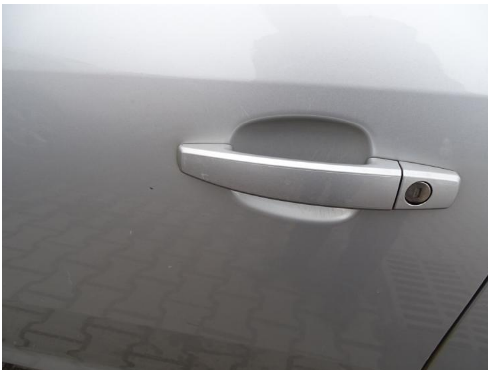
Fot. 49. drzwi lp