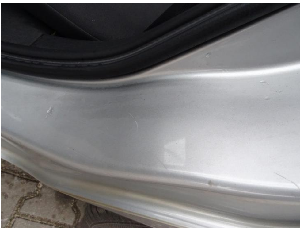
Fot. 31. słupek lt