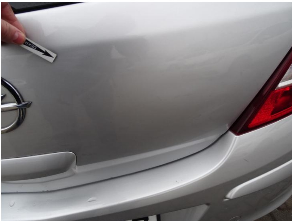
Fot. 41. pokrywa t