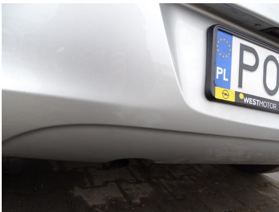
Fot. 44. zderzak t