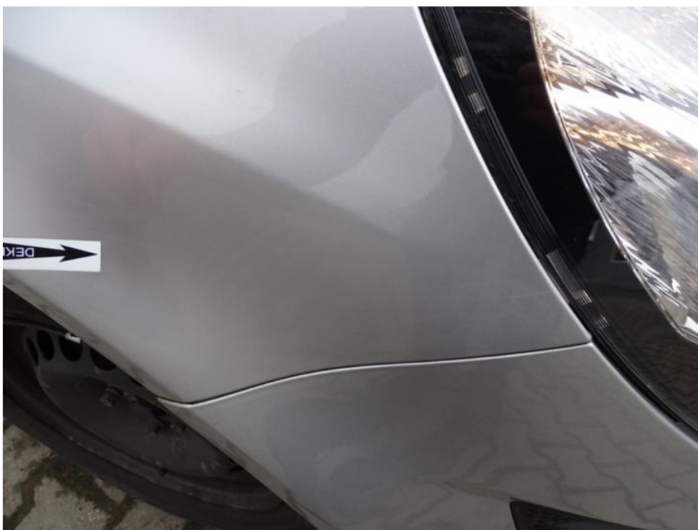
Fot. 34. błotnik pp