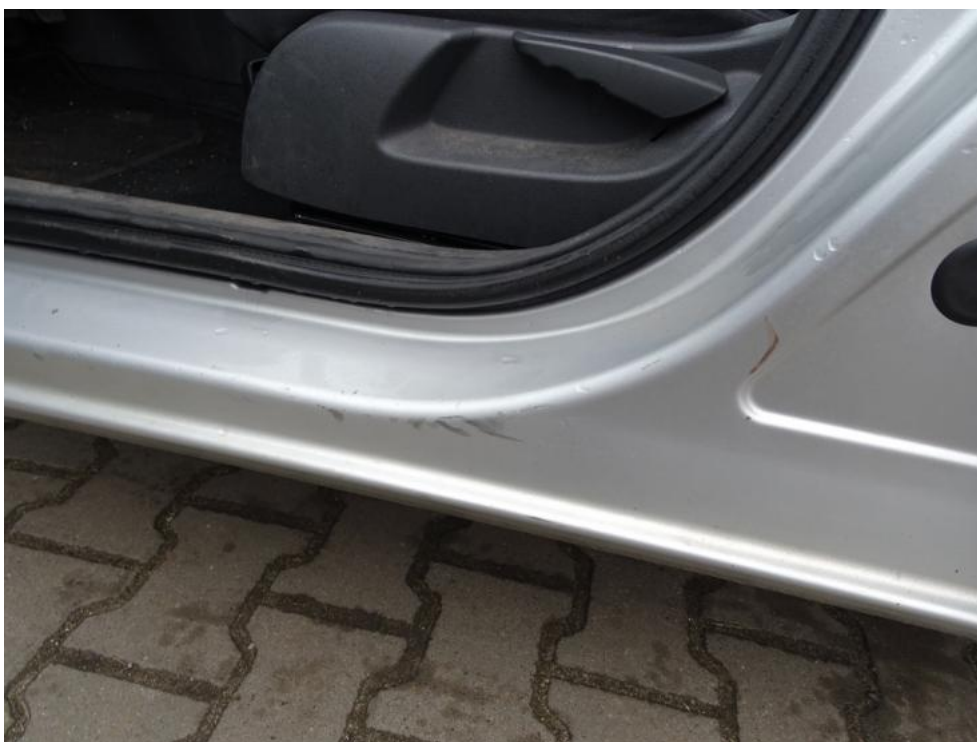
Fot. 14. próg I