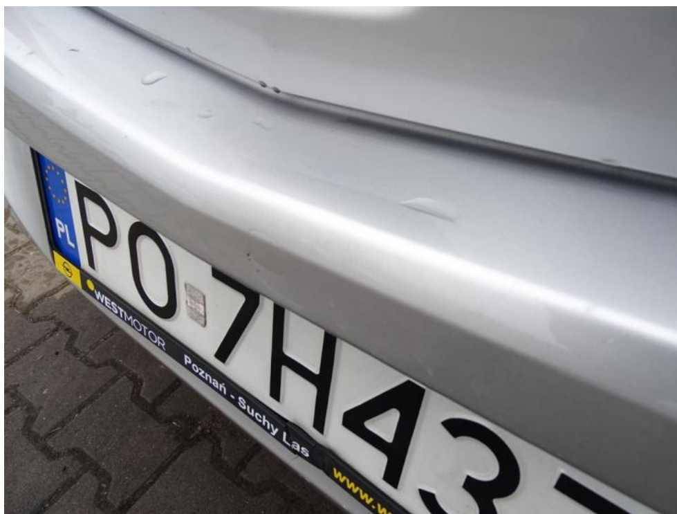
Fot. 43. zderzak t