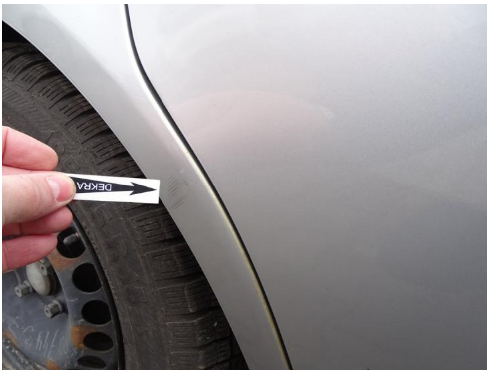
Fot. 38. błotnik pt