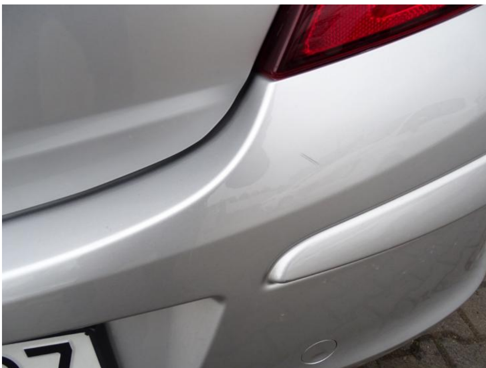
Fot. 42. zderzak t