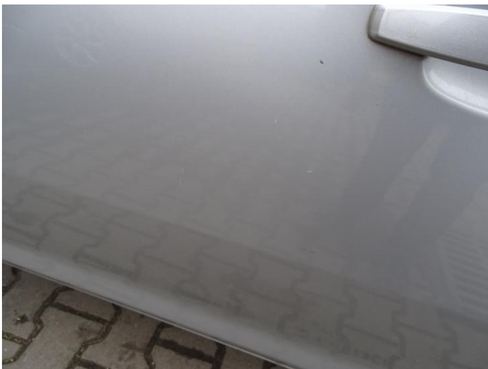
Fot. 50. drzwi lp