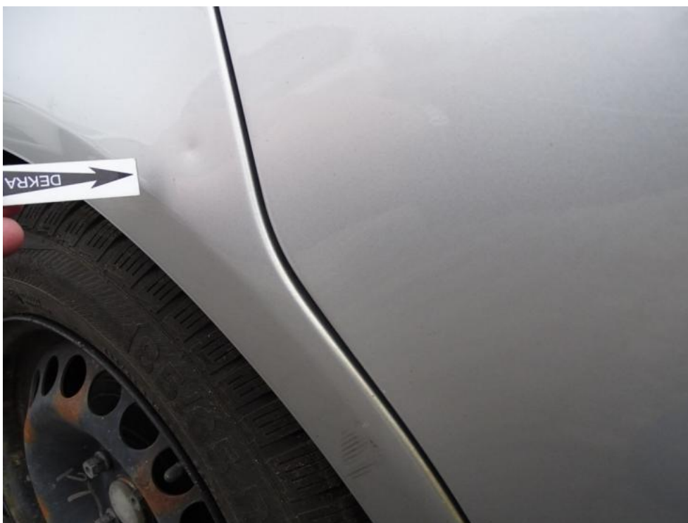
Fot. 37. błotnik pt