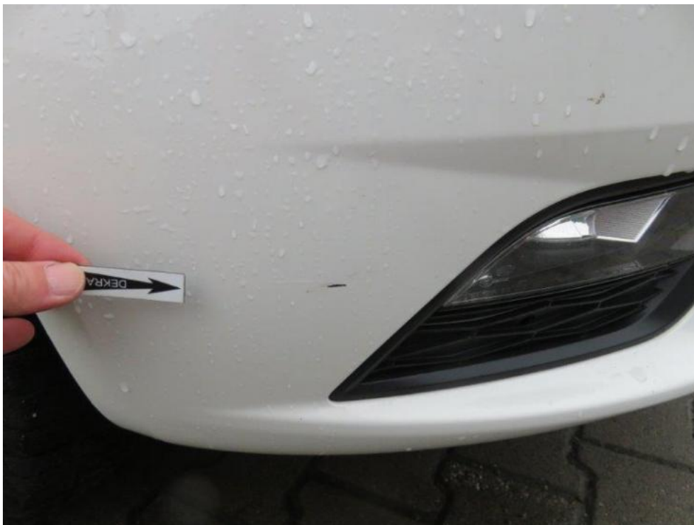
Fot. 39. zderzak przedni