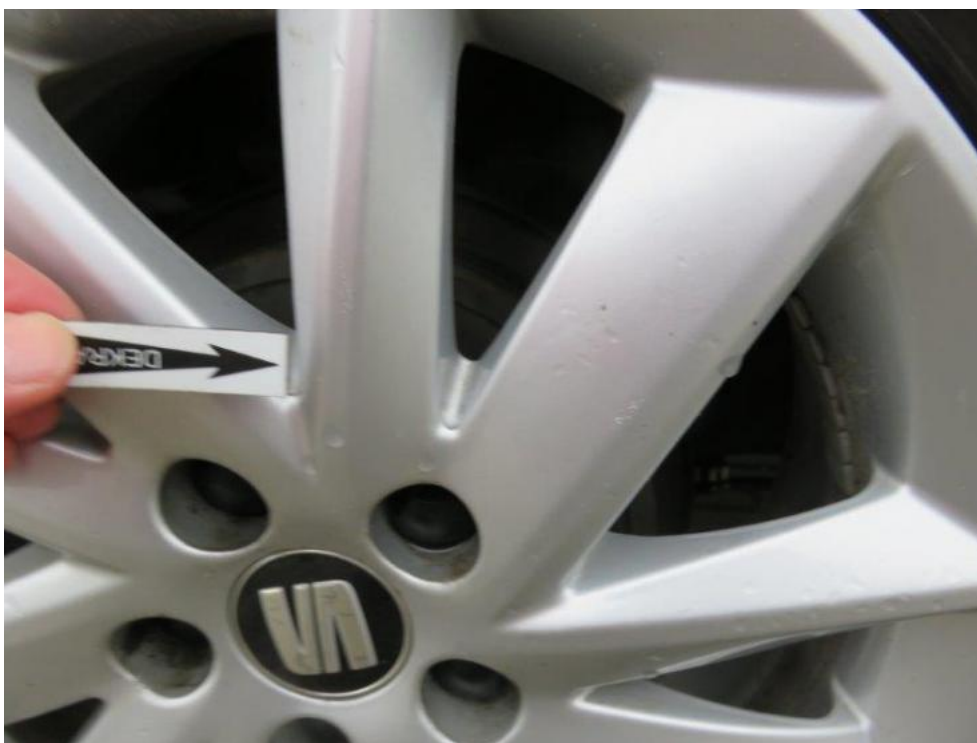
Fot. 59. tarcza koła TR