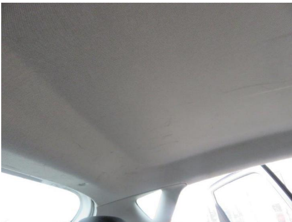
Fot. 28. podsufitka