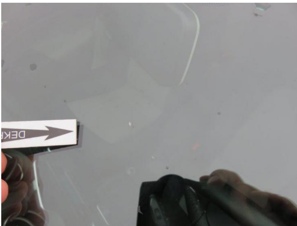
Fot. 44. szyba czołowa