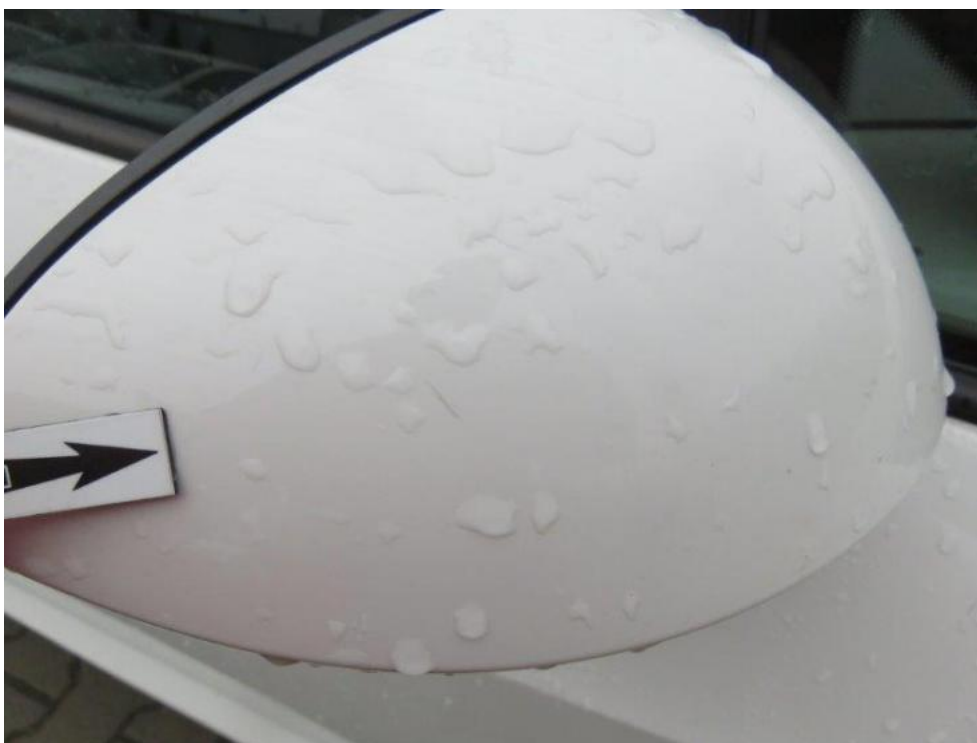
Fot. 65. lusterko zew. prawe