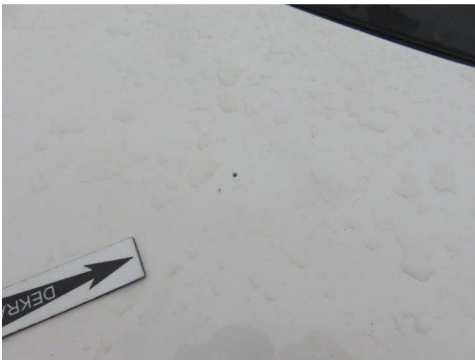
Fot. 37. pokrywa komory silnika