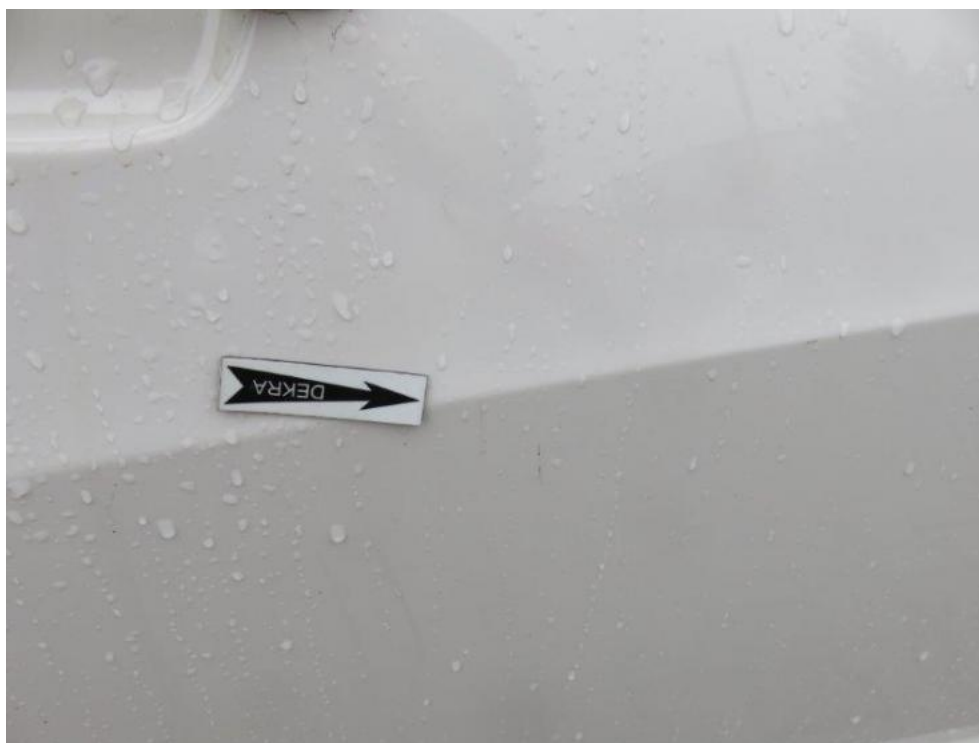
Fot. 63. drzwi PR