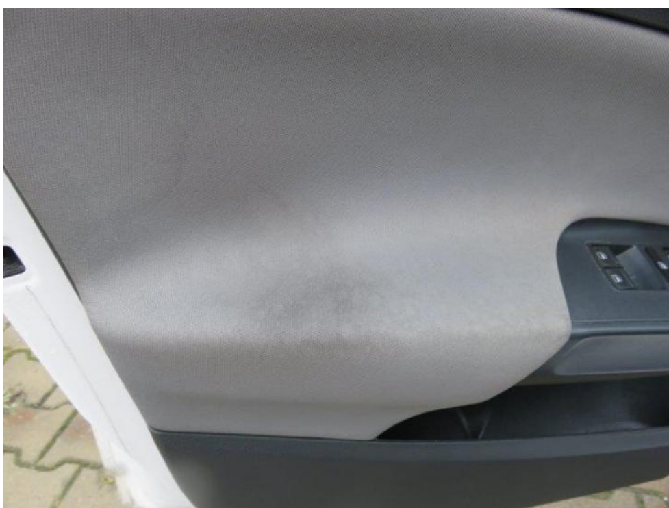
Fot. 32. drzwi PL