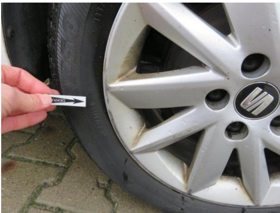
Fot. 68. tarcza koła PR