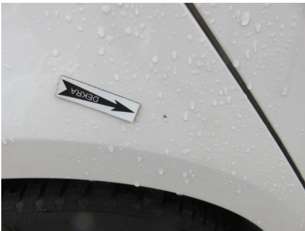
Fot. 58. błotnik TR