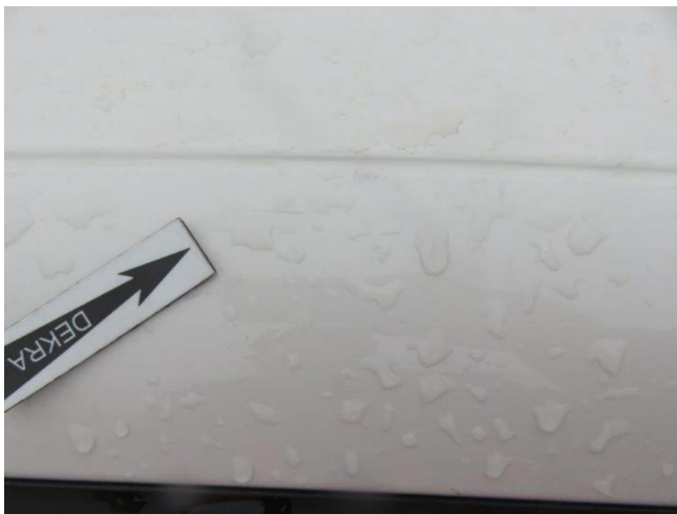
Fot. 53. rama lewa dachu