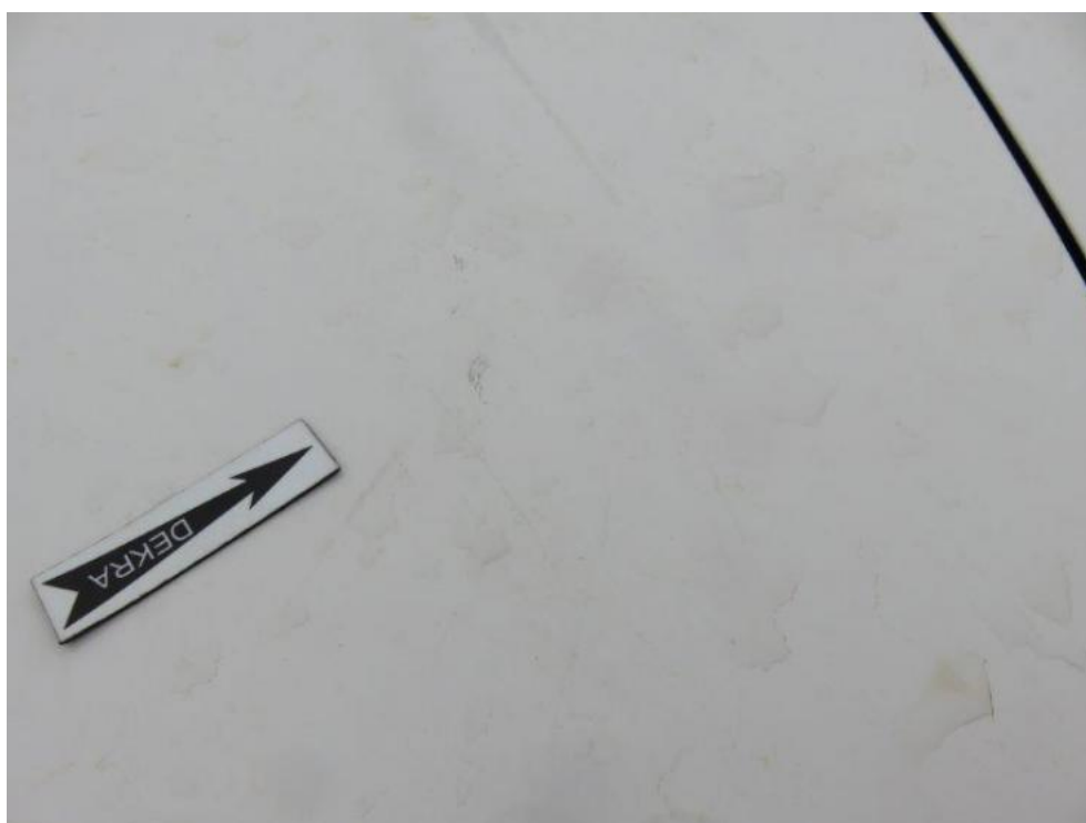
Fot. 54. dach