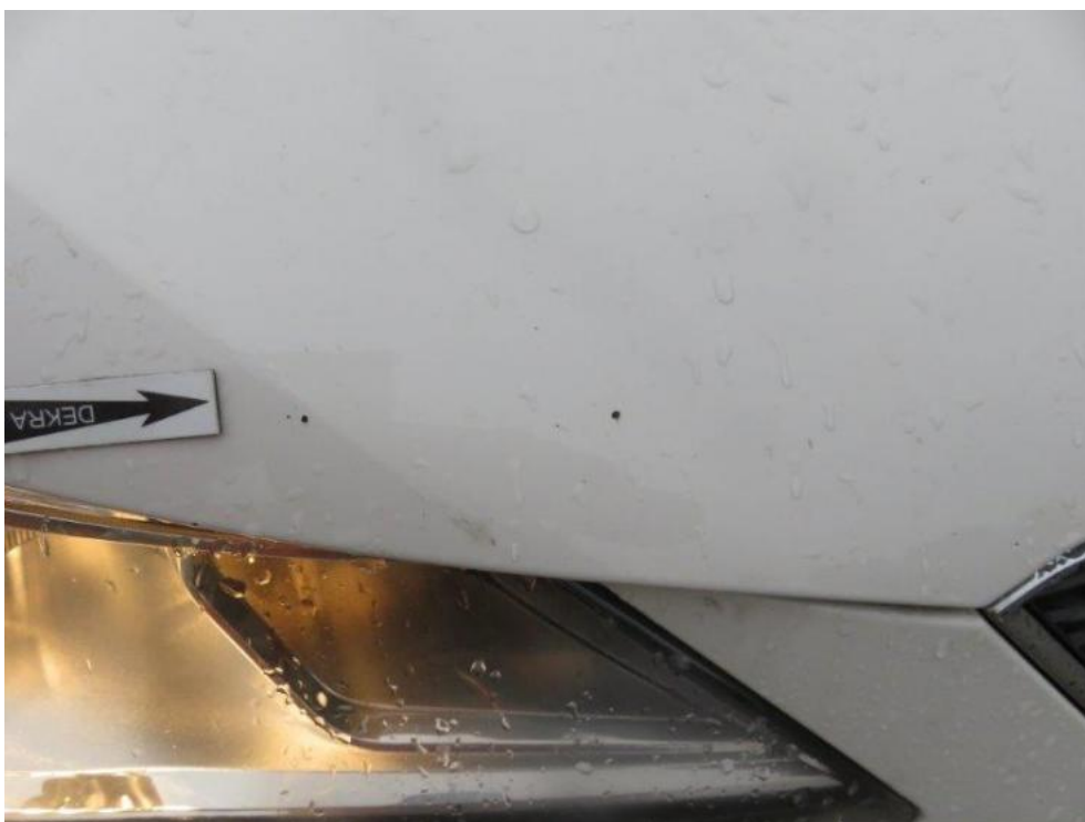
Fot. 38. pokrywa komory silnika