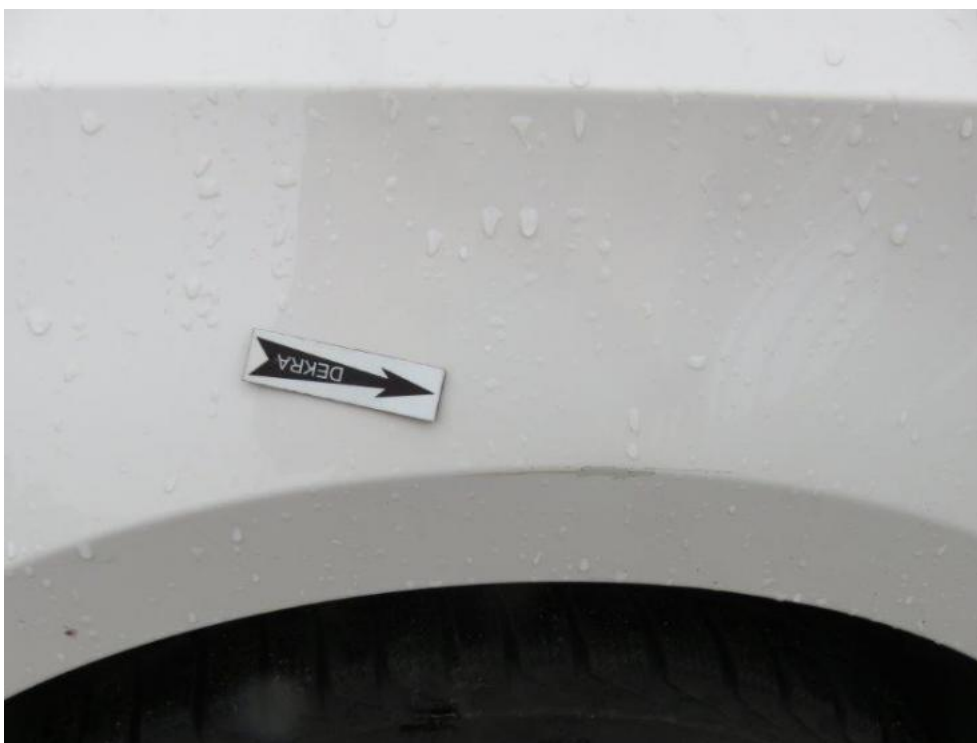
Fot. 41. błotnik PL