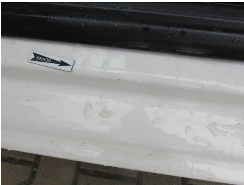
Fot. 34. próg lewy