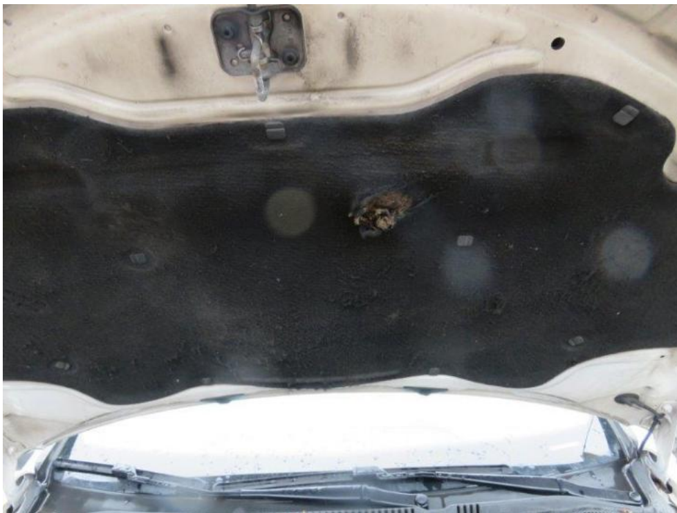
Fot. 17. pokrywa komory silnika