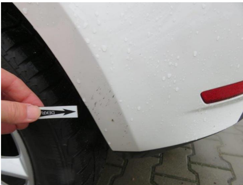
Fot. 56. zderzak tylny