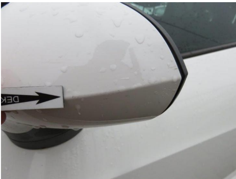
Fot. 43. lusterko zew. lewe