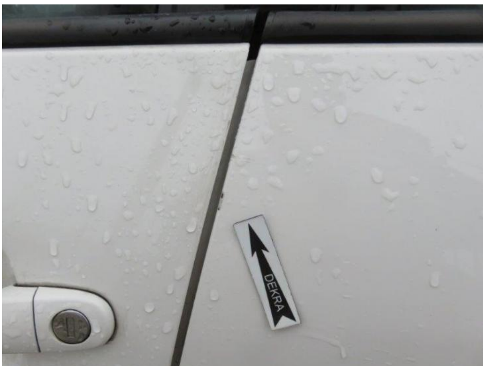
Fot. 48. drzwi TL