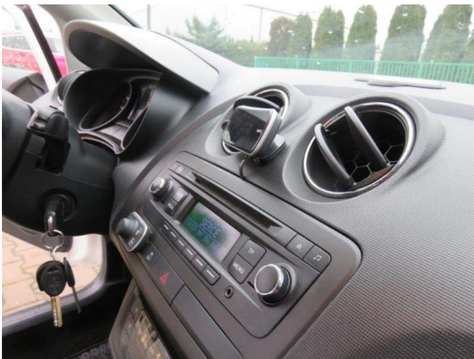
Fot. 24. deska rozdzielcza