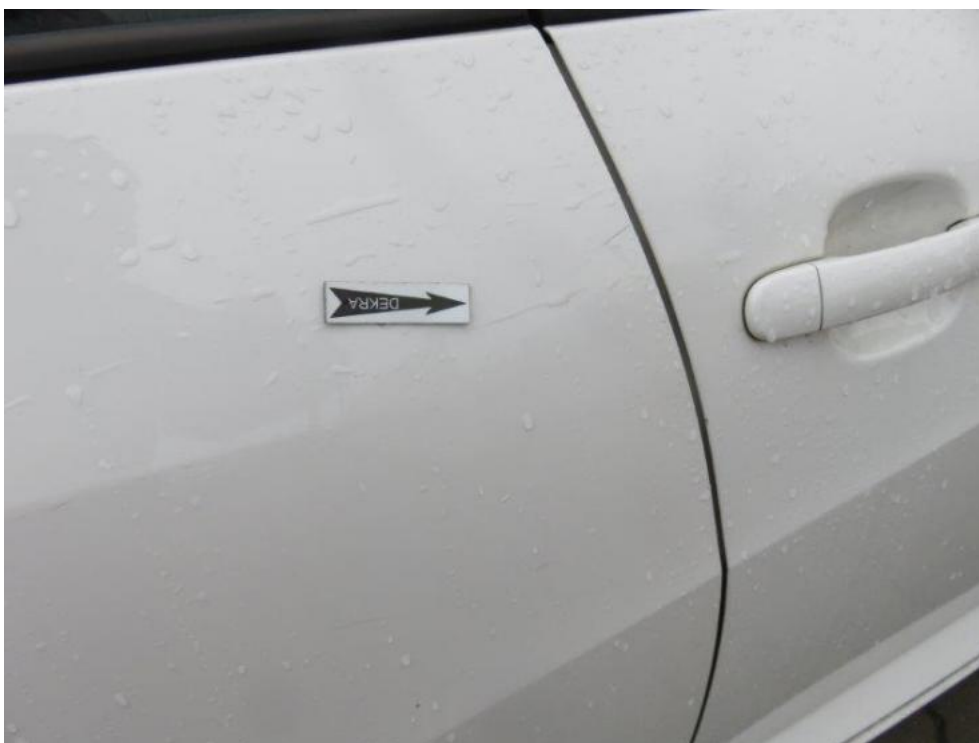
Fot. 61. drzwi TR