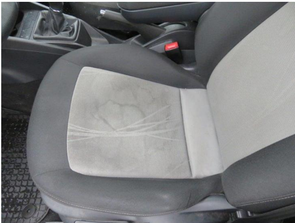
Fot. 35. fotel PL