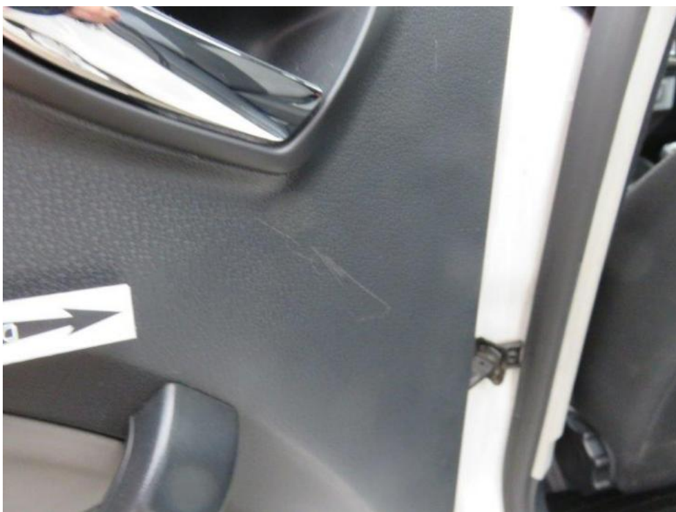
Fot. 30. drzwi TL