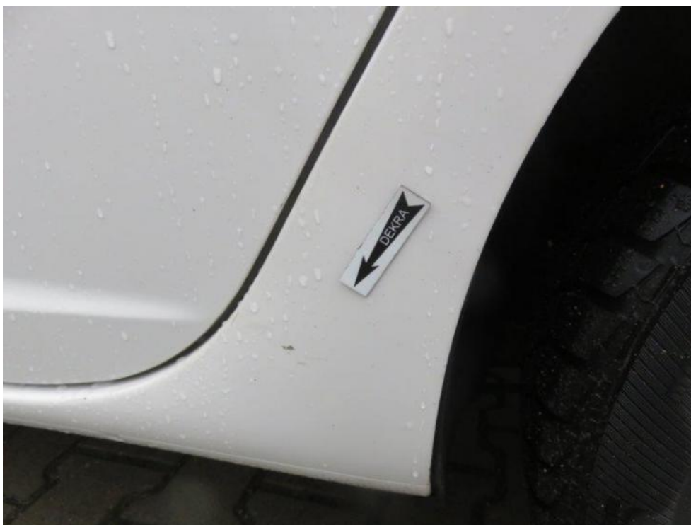
Fot. 50. błotnik TL