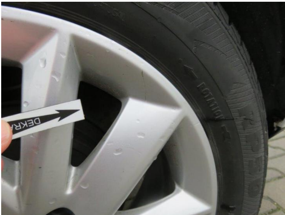
Fot. 51. tarcza koła TL