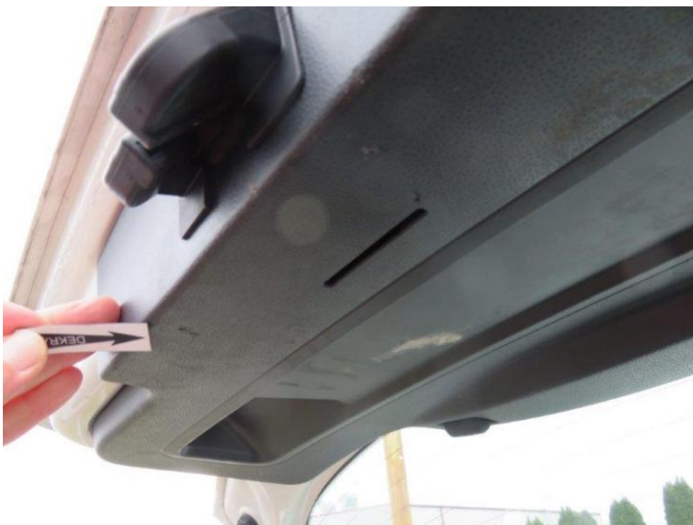
Fot. 19. pokrywa bagażnika