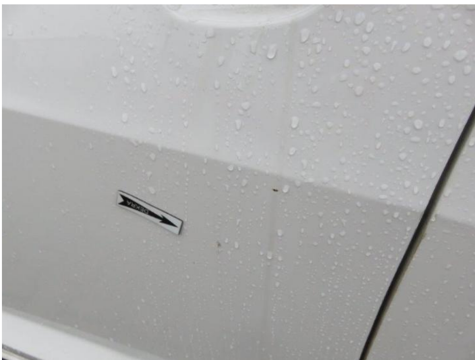
Fot. 46. drzwi PL