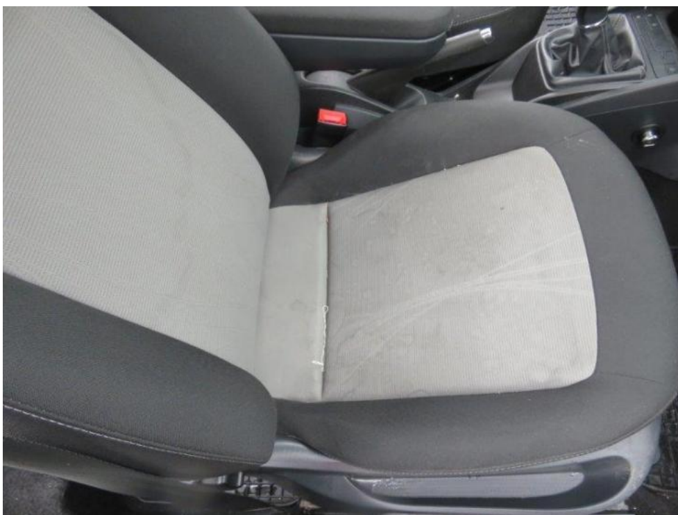
Fot. 22. fotel PR