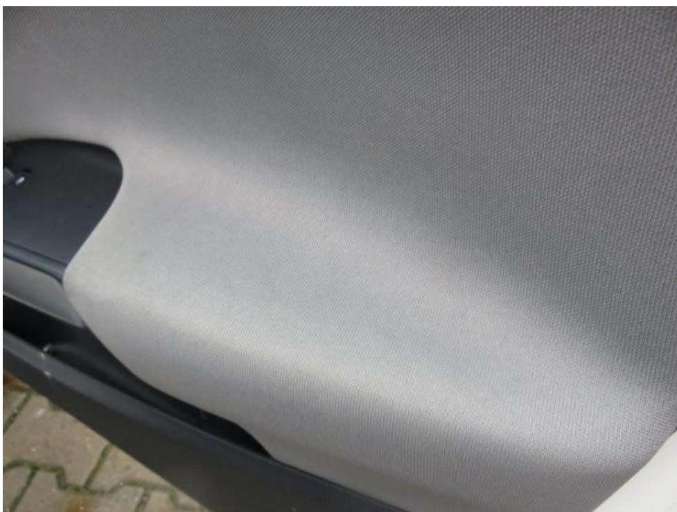
Fot. 26. drzwi PR