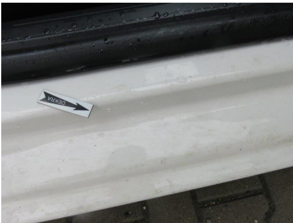
Fot. 21. próg prawy