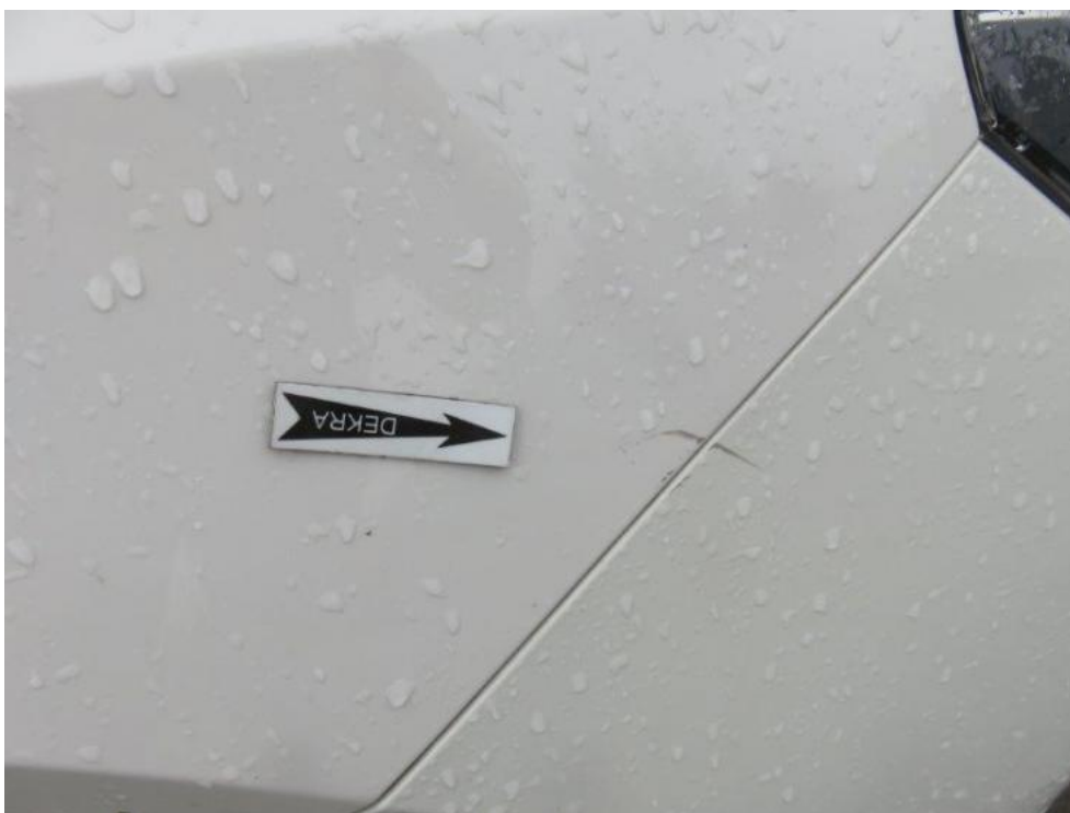
Fot. 67. błotnik PR