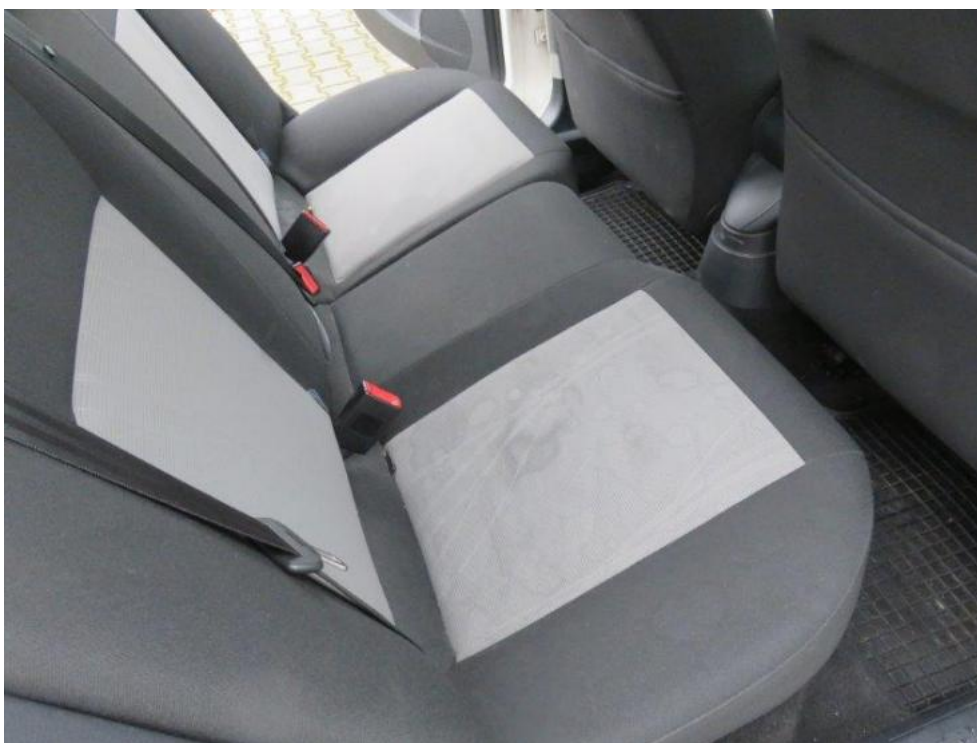
Fot. 27. kanapa tylna