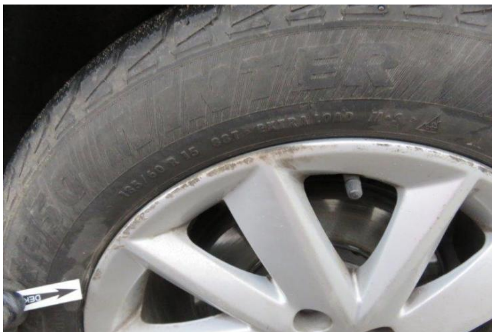
Fot. 62. tarcza koła PR