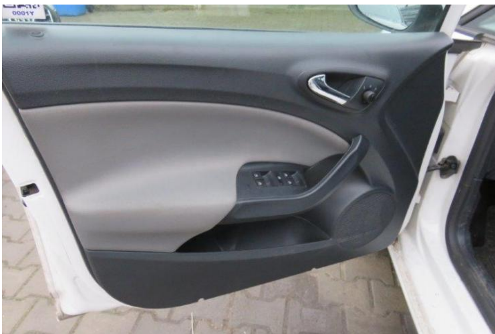
Fot. 26. drzwi PL