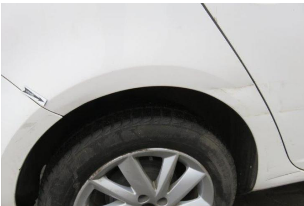
Fot. 53. błotnik TR