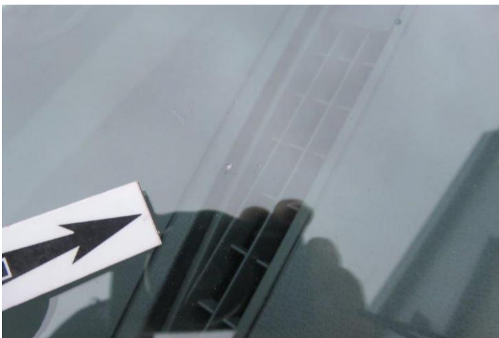
Fot. 59. szyba czołowa