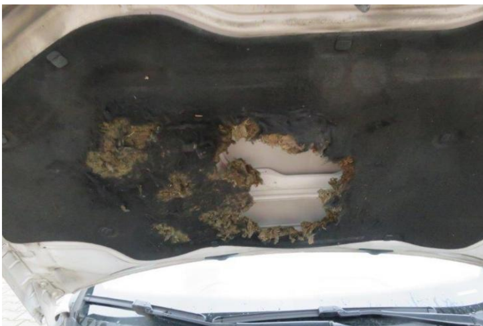
Fot. 30. mata pokrywy komory silnika