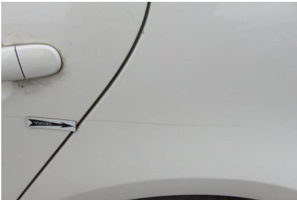
Fot. 45. błotnik TL