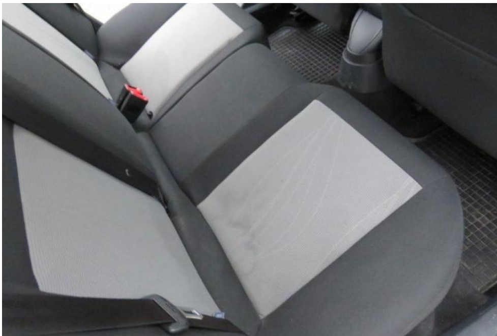
Fot. 21. kanapa tylna