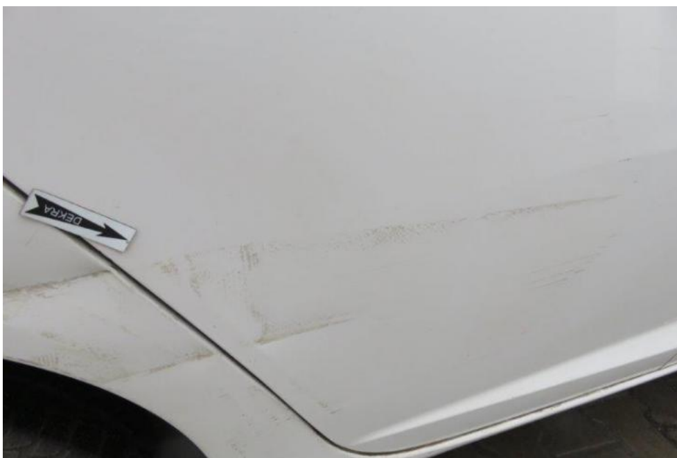
Fot. 55. drzwi TR