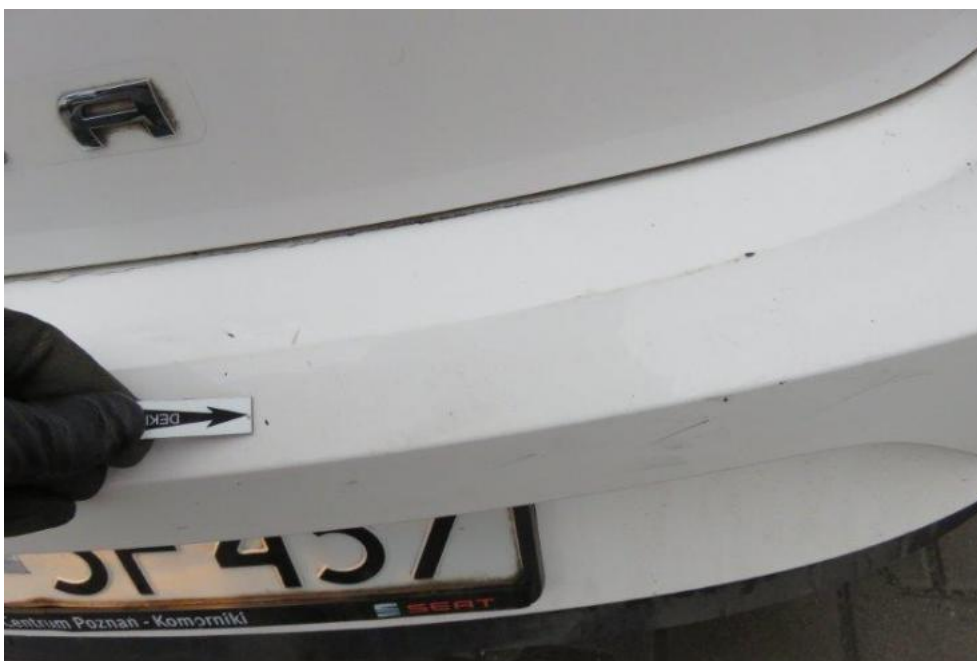
Fot. 50. zderzak tylny