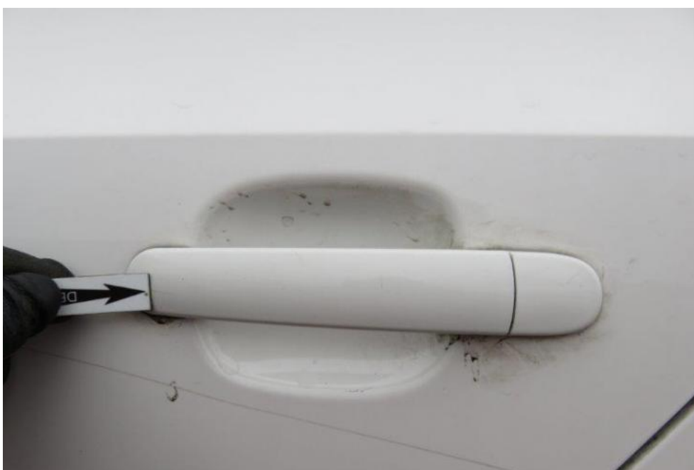
Fot. 44. drzwi TL