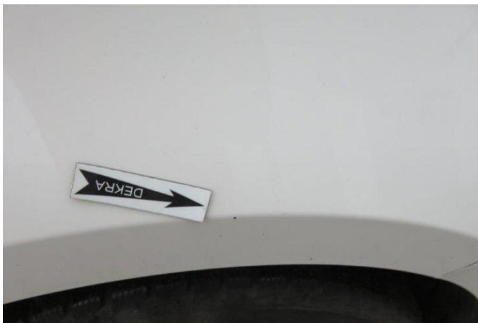
Fot. 61. błotnik PR