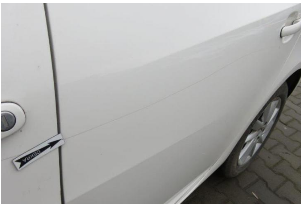
Fot. 42. drzwi TL