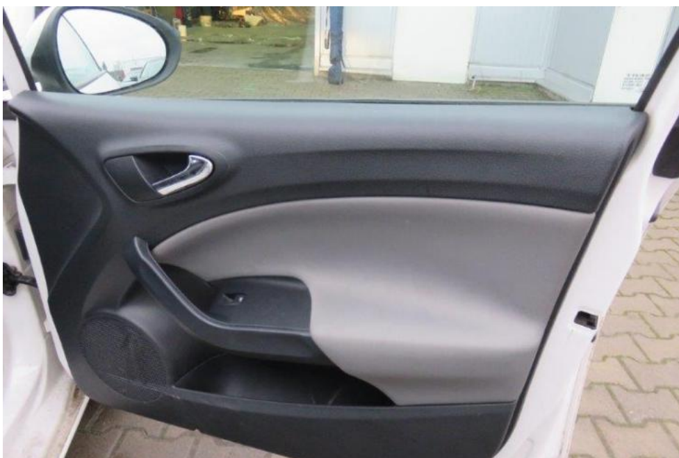
Fot. 20. drzwi PR