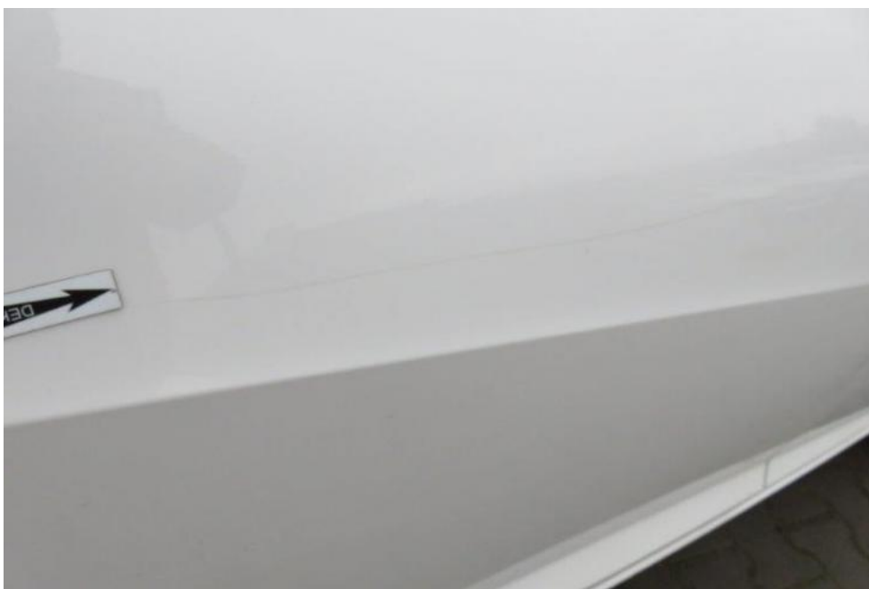
Fot. 39. drzwi PL