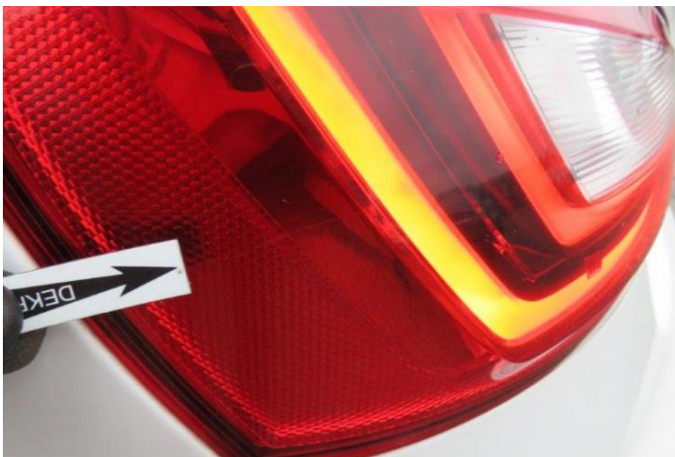
Fot. 49. lampa TL