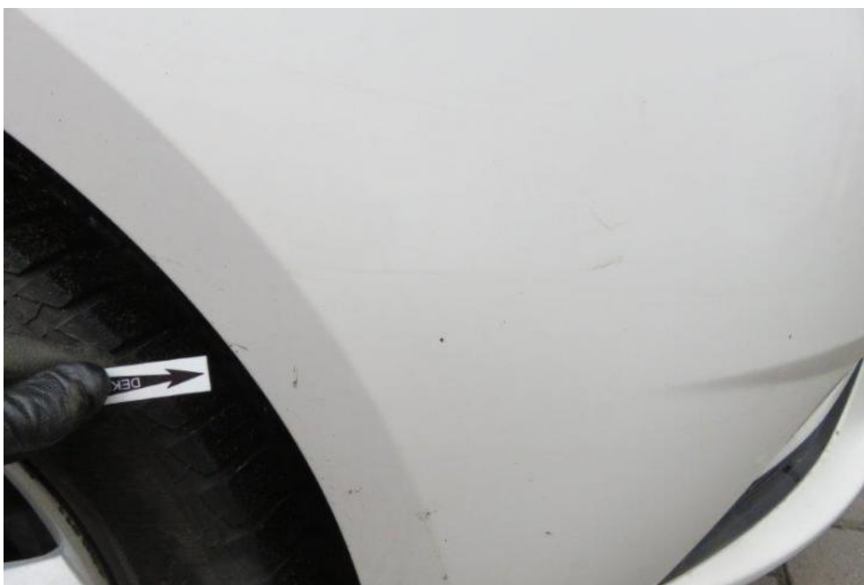
Fot. 33. zderzak przedni