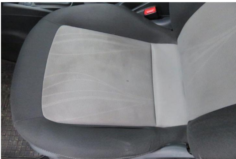
Fot. 28. fotel PLO