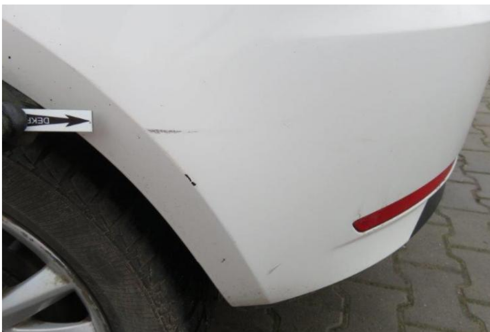
Fot. 48. zderzak tylny