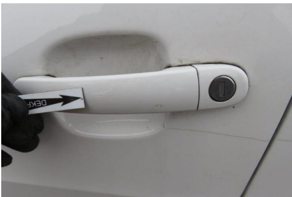
Fot. 40. drzwi PL