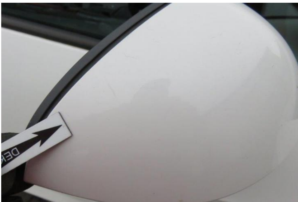
Fot. 57. lusterko zew. prawe