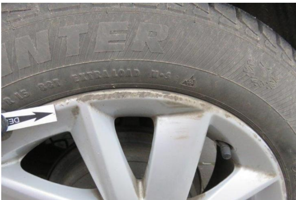
Fot. 46. tarcza koła TL