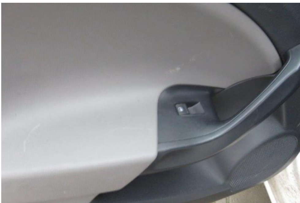
Fot. 25. drzwi TL