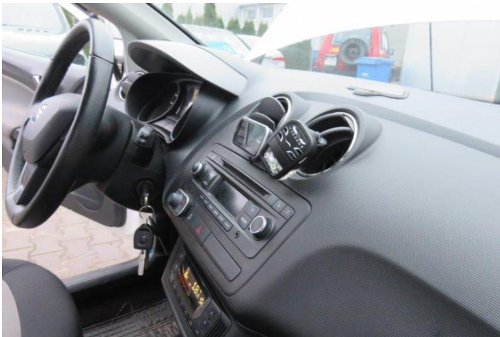
Fot. 19. deska rozdzielcza