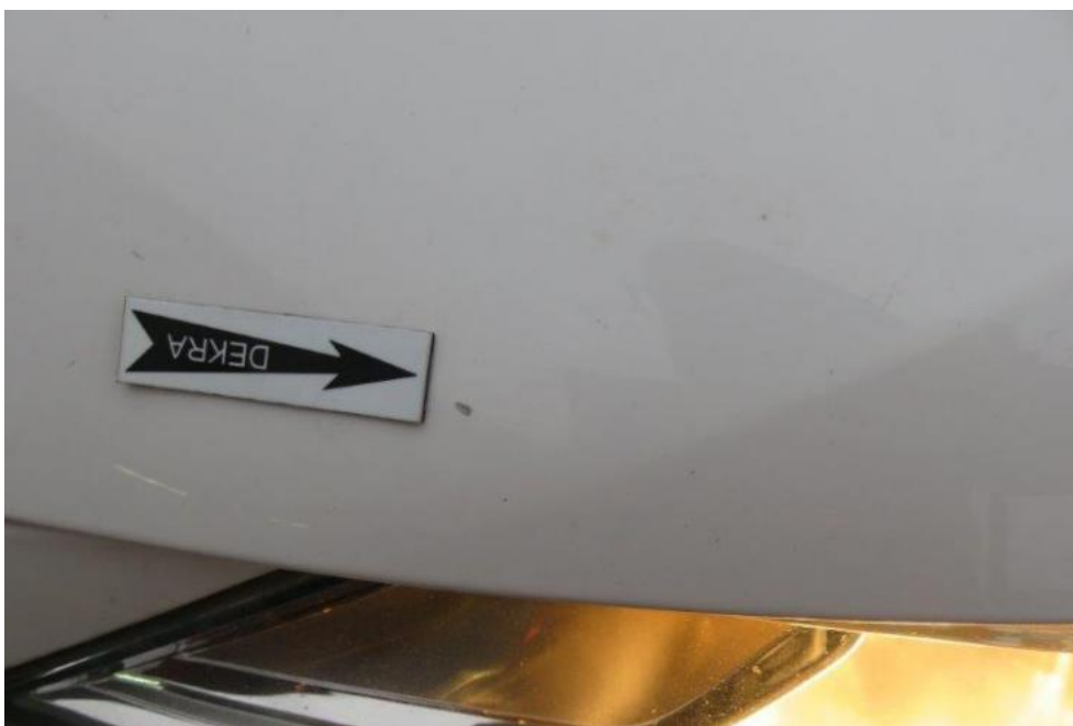
Fot. 32. pokrywa komory silnika