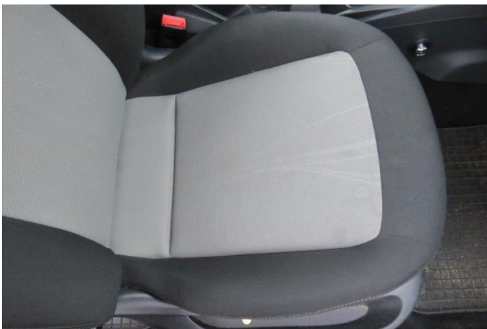
Fot. 18. fotel PR