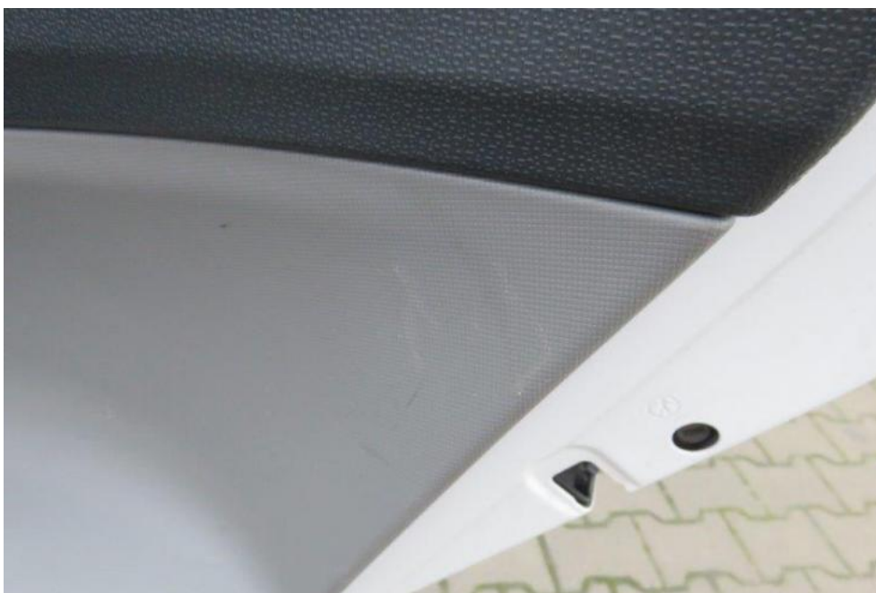
Fot. 23. drzwi TR