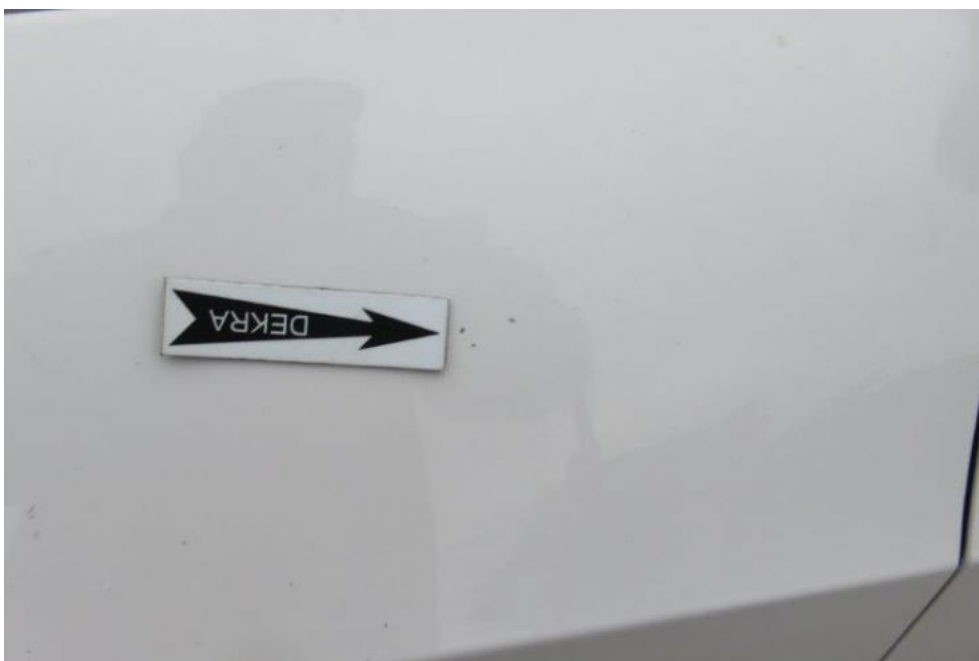
Fot. 36. błotnik PL