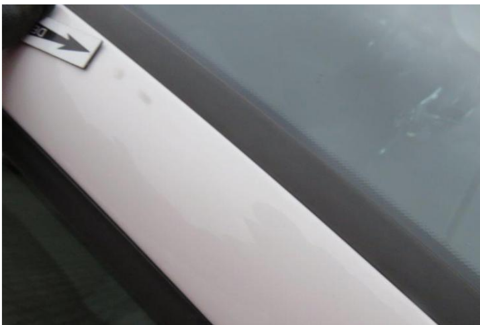
Fot. 58. słupek PR