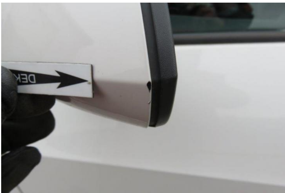
Fot. 37. lusterko zew lewe