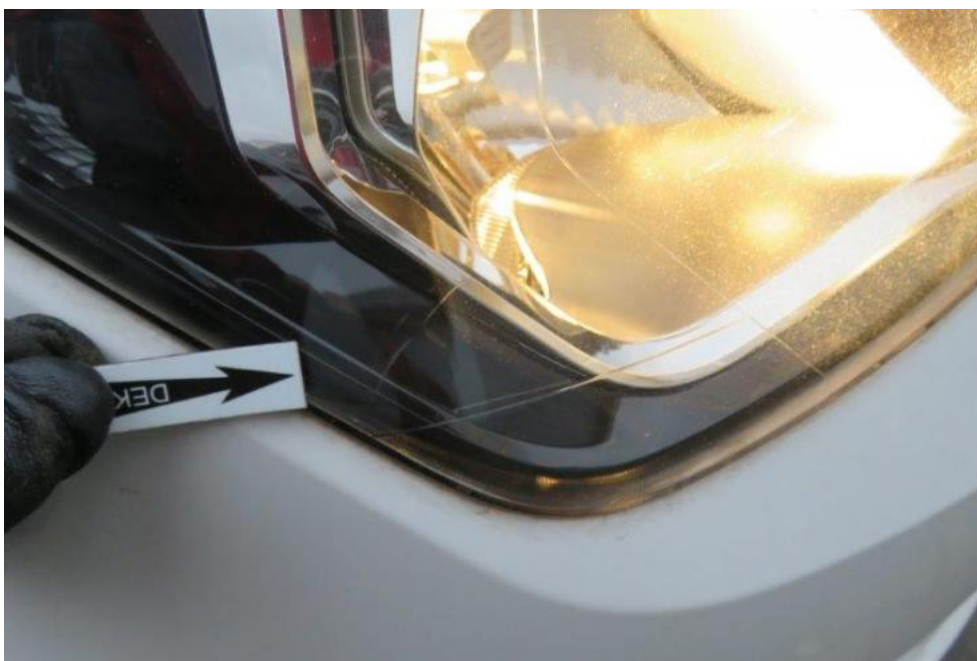
Fot. 34. reflektor prawy