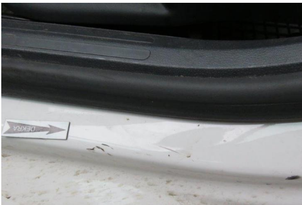
Fot. 29. próg lewy