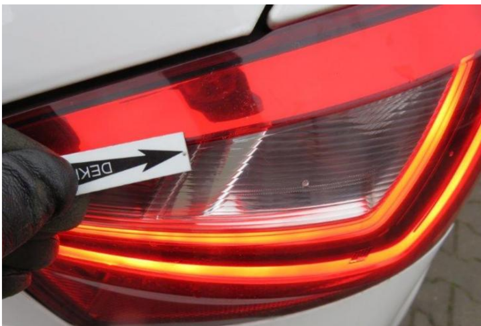
Fot. 51. lampa TR