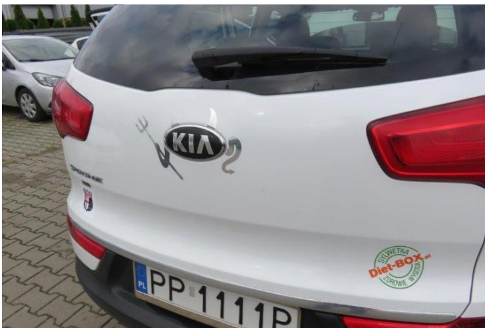
Fot. 19. okleina