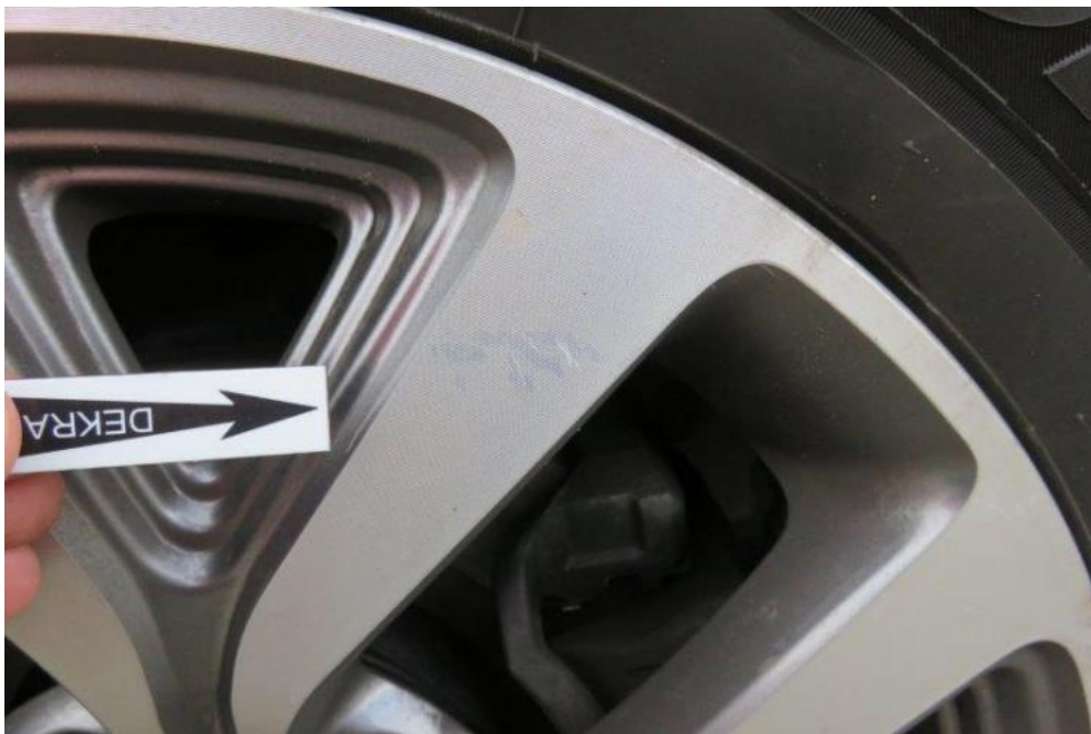
Fot. 33. tarcza koła PR