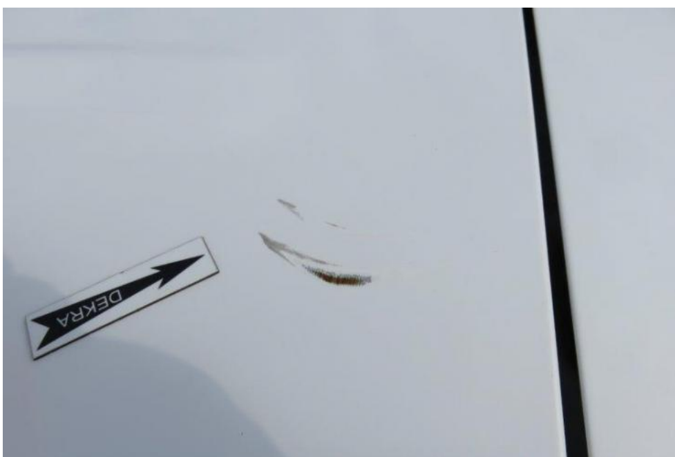
Fot. 54. dach