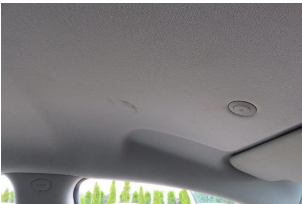
Fot. 28. podsufitka