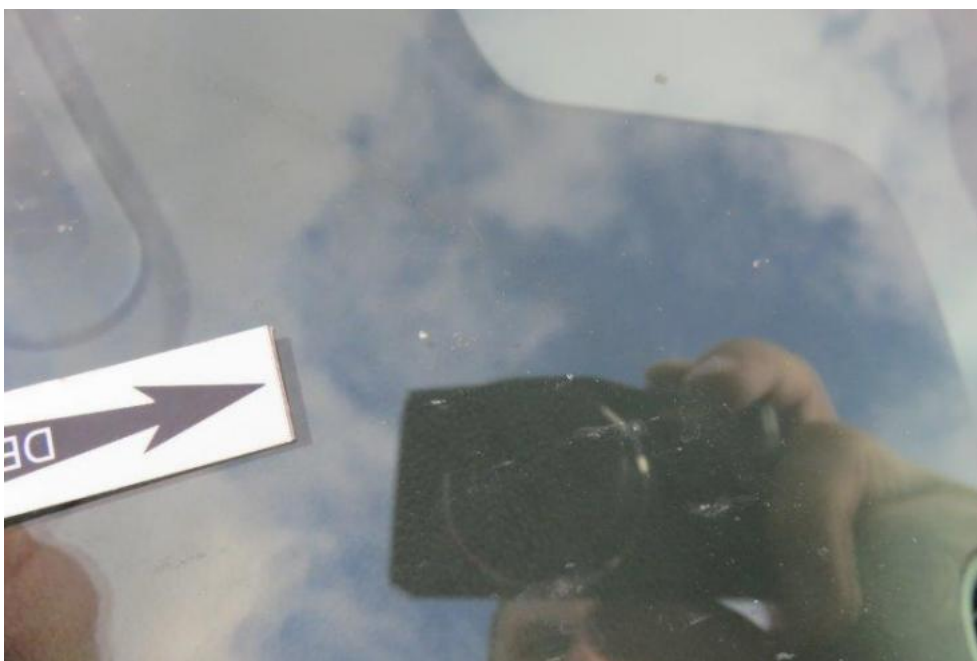
Fot. 44. szyba czołowa