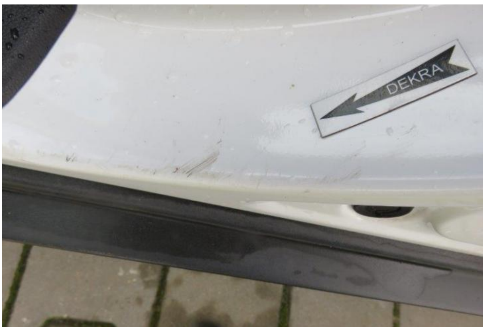
Fot. 56. próg lewy