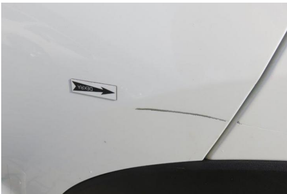
Fot. 48. drzwi TL