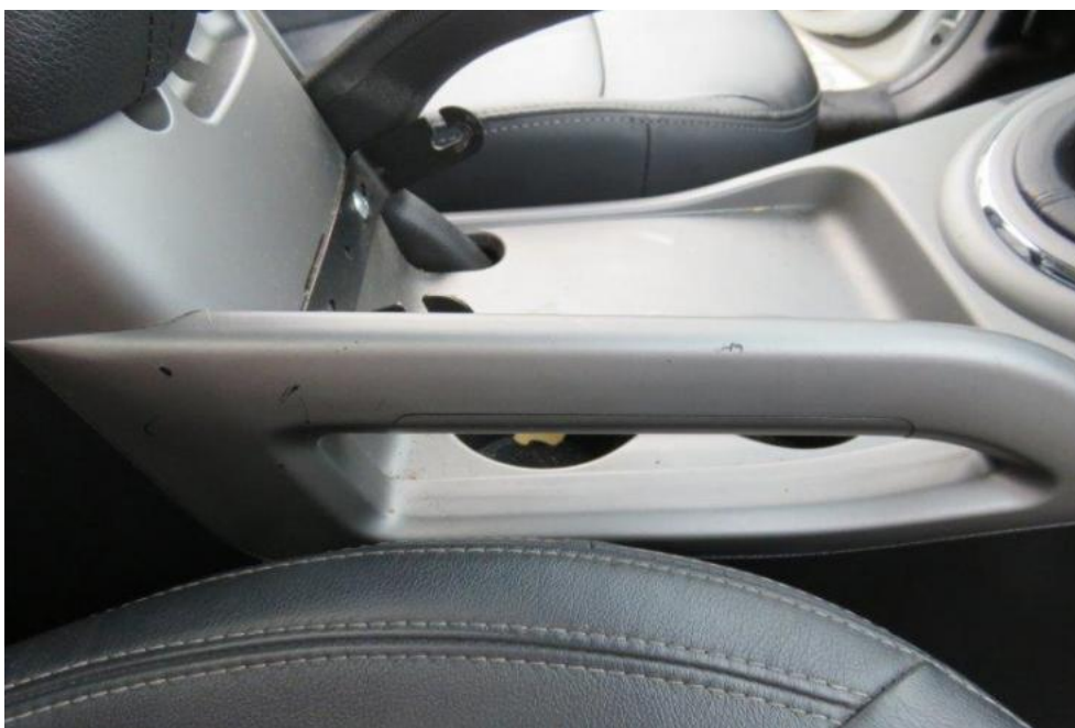
Fot. 27. konsola środkowa