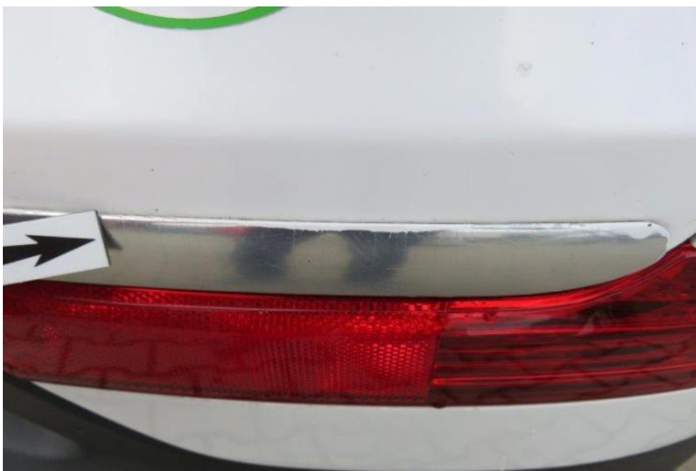
Fot. 20. listwa chromowa pokrywy bagażnika