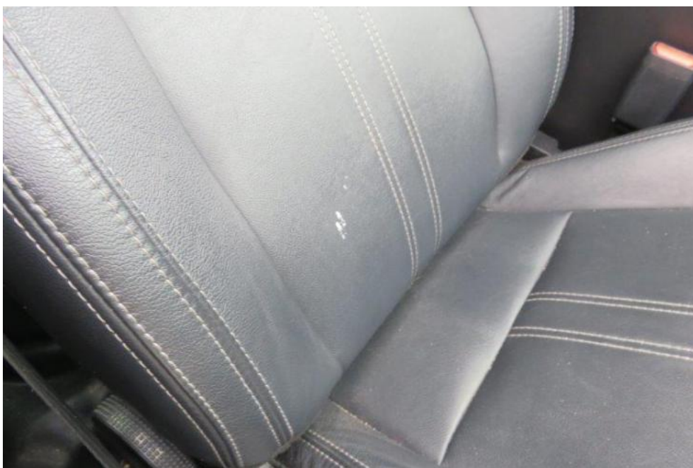
Fot. 26. fotel PR