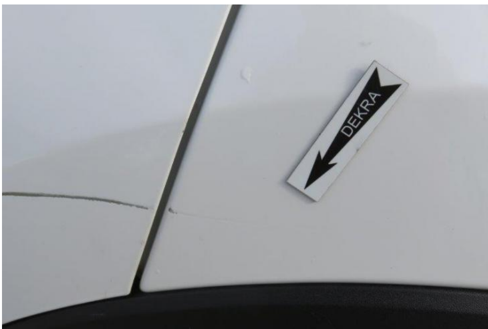
Fot. 50. błotnik TL