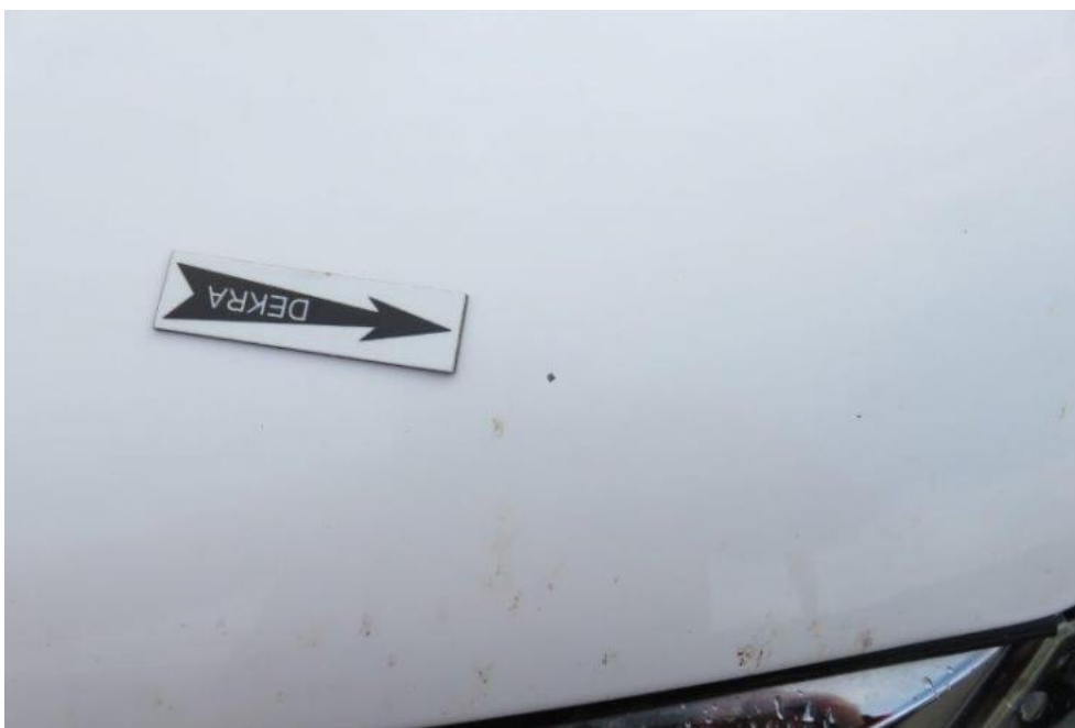
Fot. 39. pokrywa komory silnika