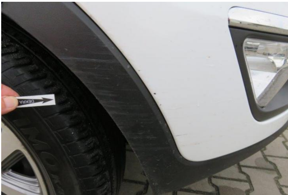
Fot. 37. wykrój nadkola PR