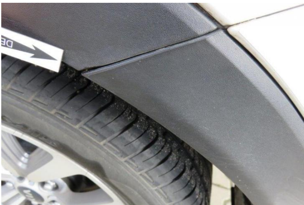
Fot. 52. zderzak tylny