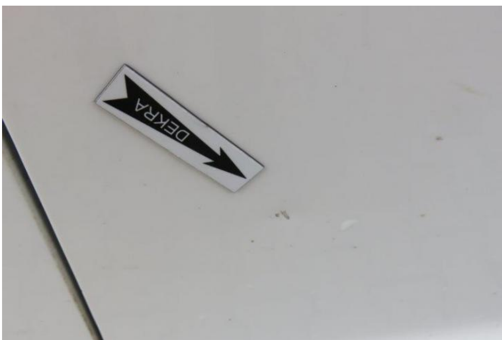
Fot. 30. drzwi PR