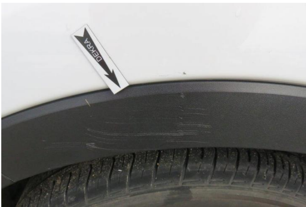
Fot. 41. wykrój nadkola PL