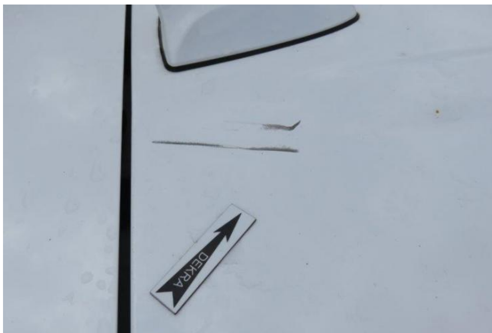
Fot. 23. dach