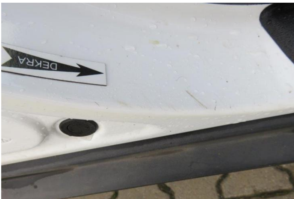
Fot. 25. próg prawy