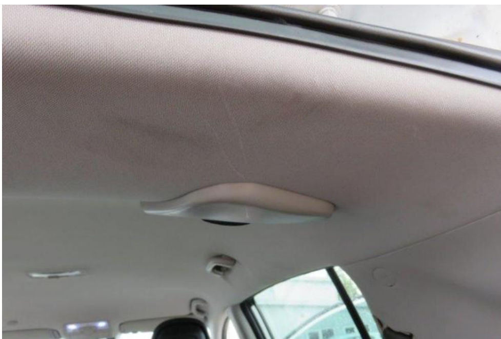
Fot. 17. podsufitka