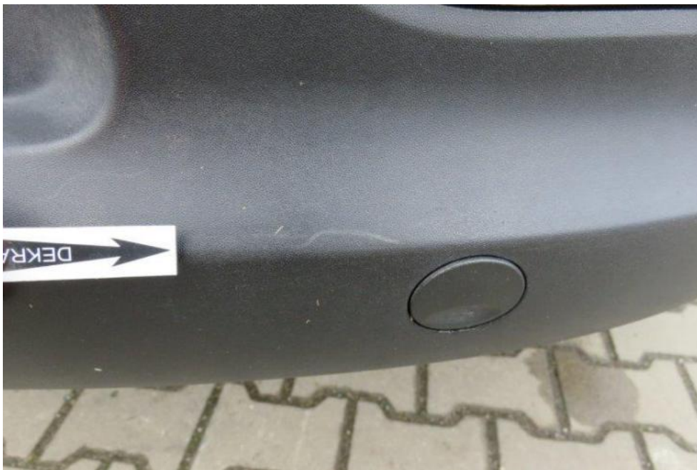
Fot. 21. zderzak tylny