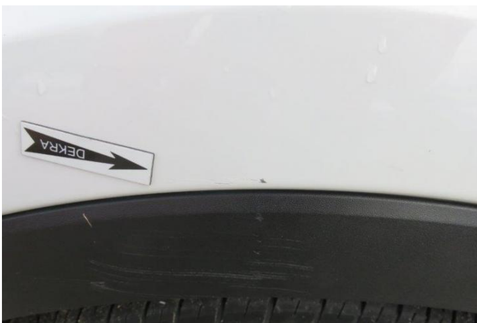
Fot. 42. błotnik PL