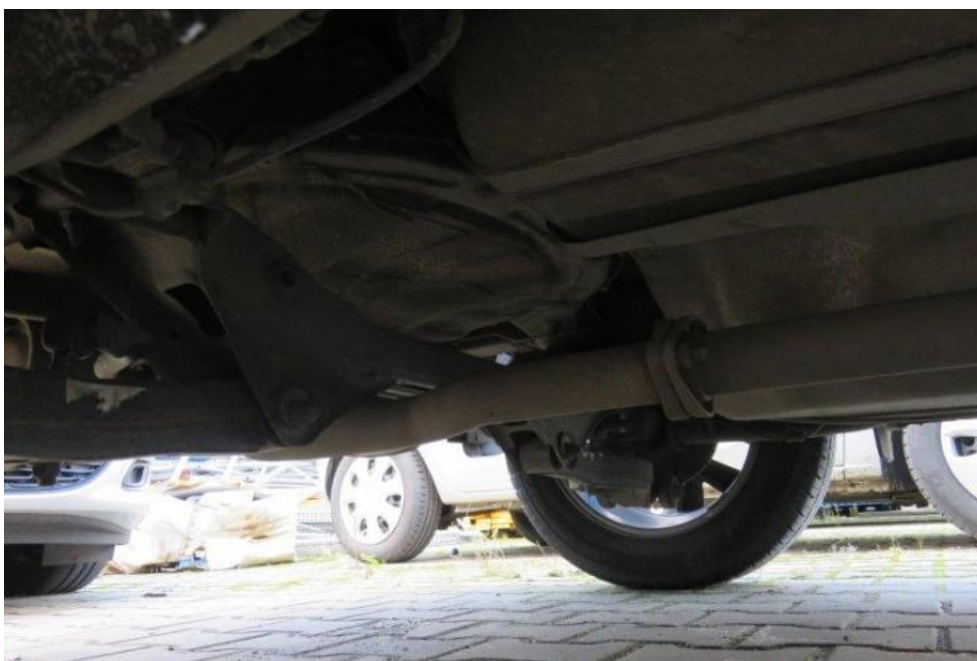
Fot. 58. zbiornik paliwa