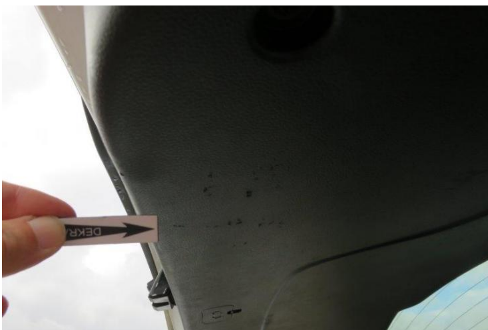
Fot. 18. pokrywa bagażnika