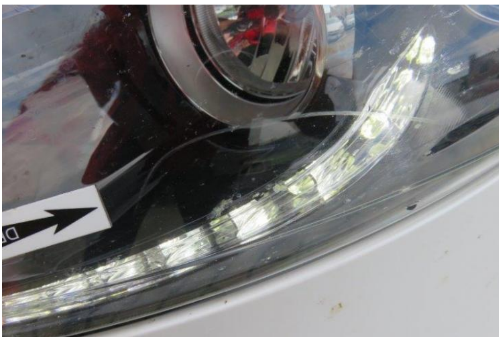
Fot. 36. reflektor lewy