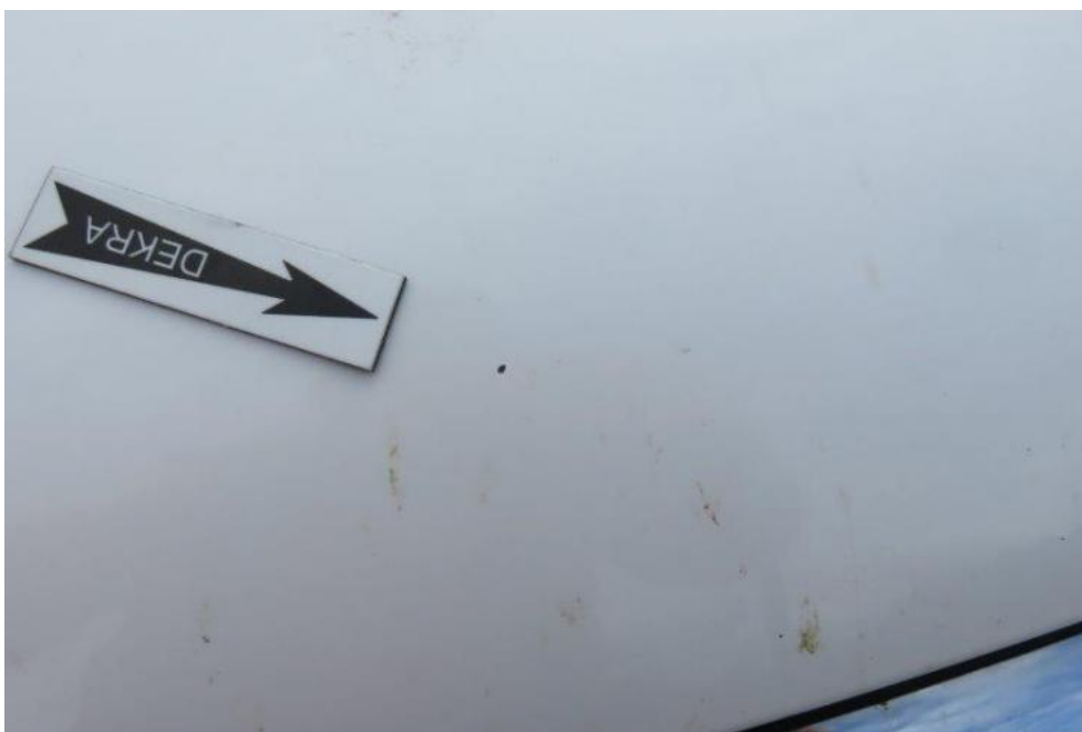
Fot. 38. pokrywa komory silnika