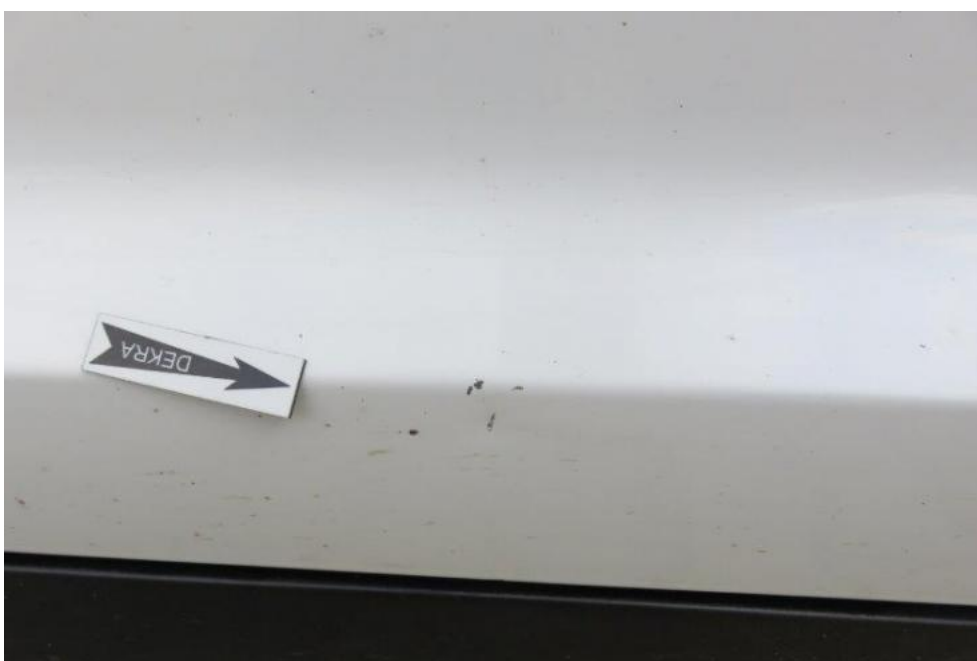
Fot. 46. drzwi PL