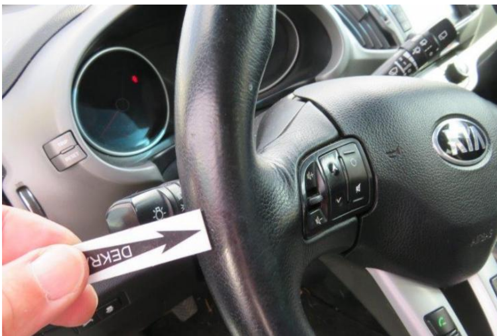
Fot. 57. koło kierownicy