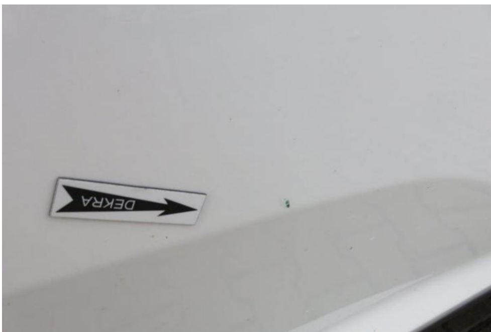
Fot. 31. drzwi PR