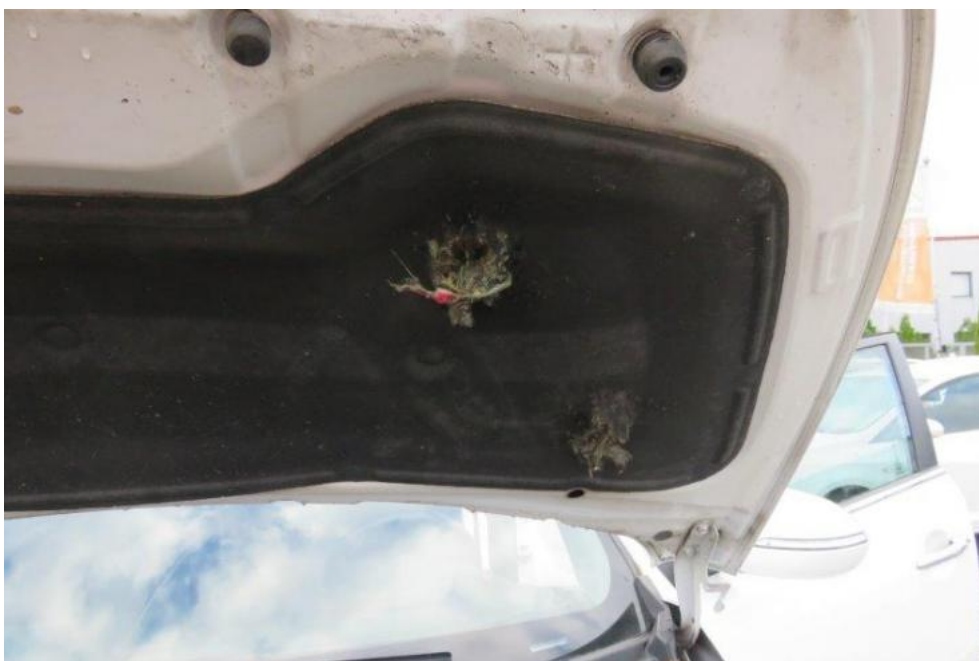
Fot. 34. wykładzina pokrywy silnika