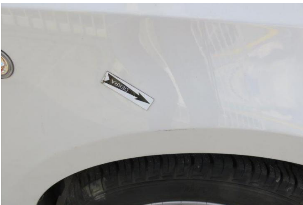
Fot. 59. błotnik PR