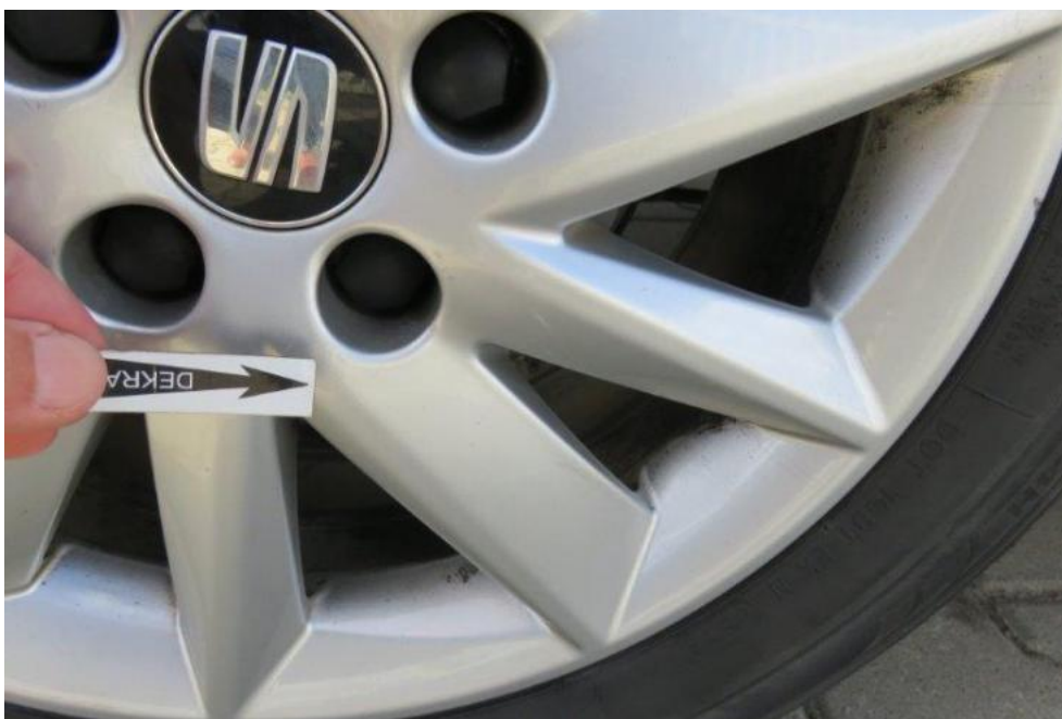
Fot. 51. tarcza koła TR