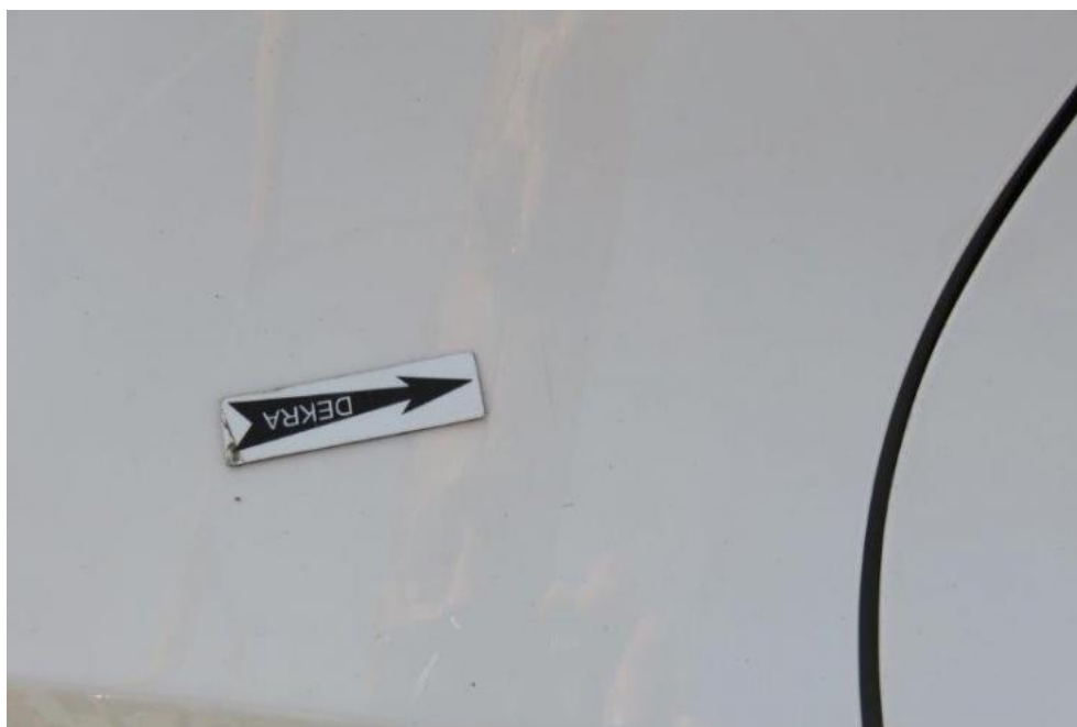
Fot. 50. błotnik TR