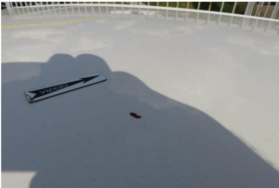
Fot. 41. dach