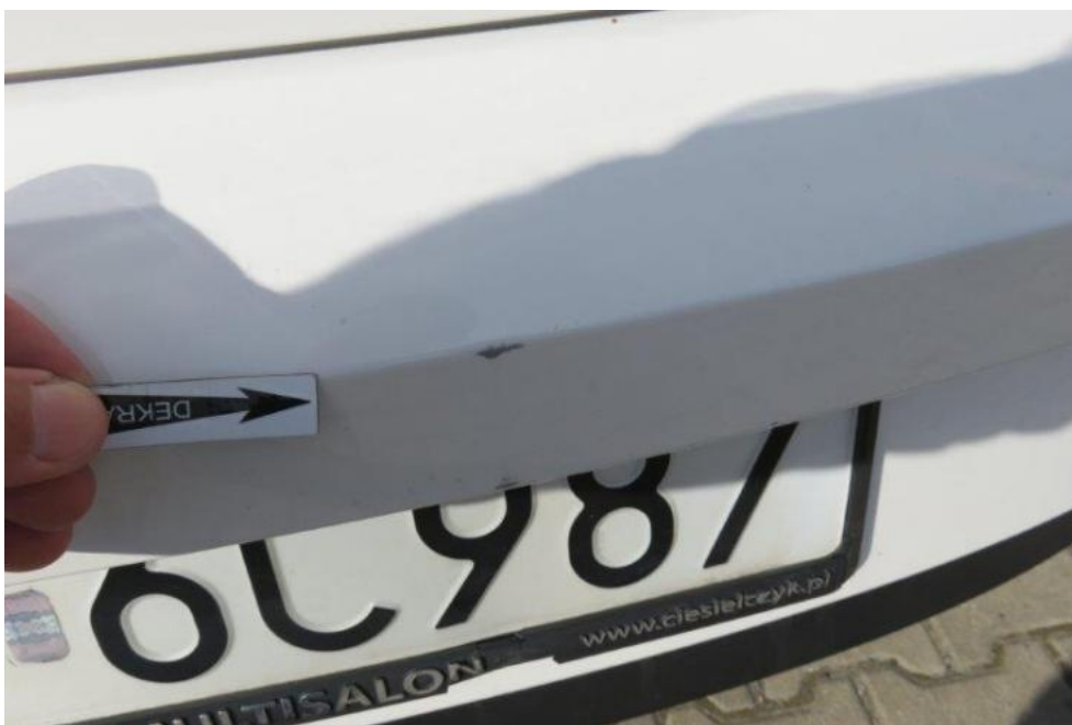
Fot. 46. zderzak tylny