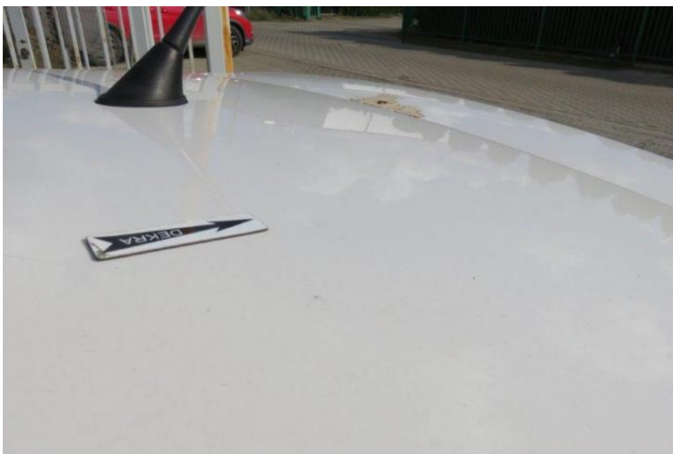
Fot. 42. dach