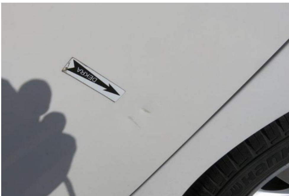
Fot. 39. drzwi TL