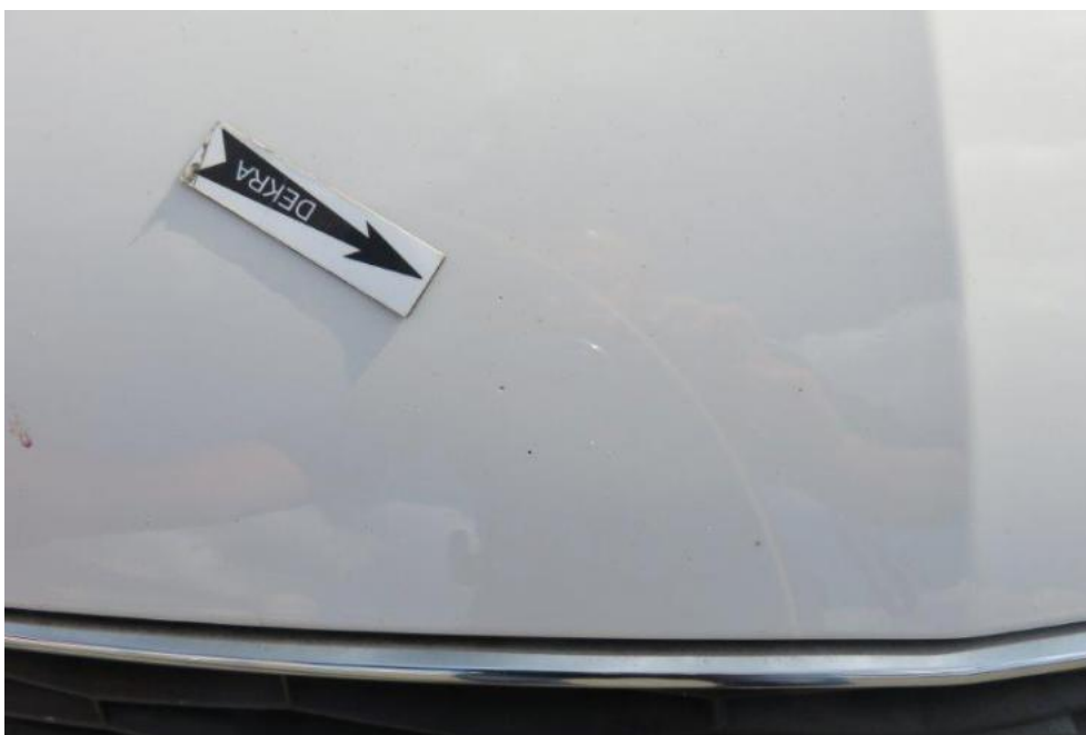
Fot. 26. pokrywa komory silnika