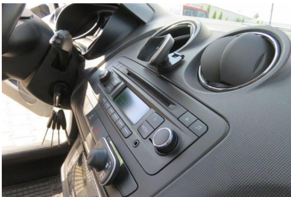
Fot. 18. deska rozdzielcza