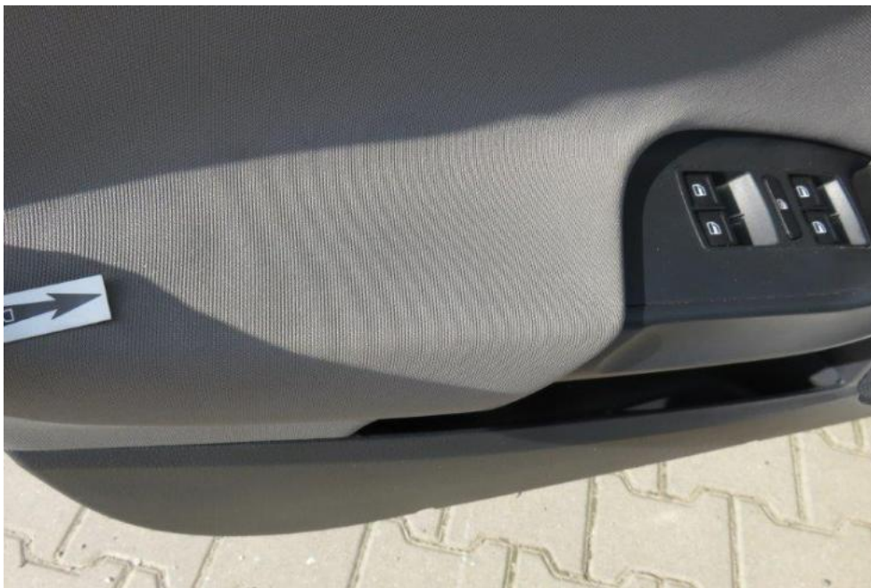
Fot. 23. drzwi PL