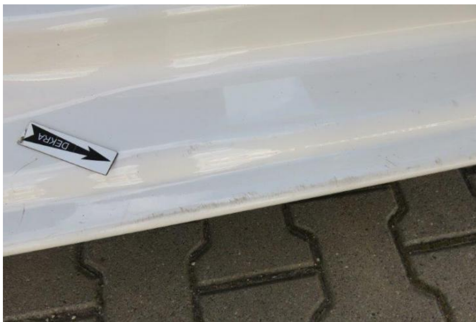
Fot. 17. próg prawy