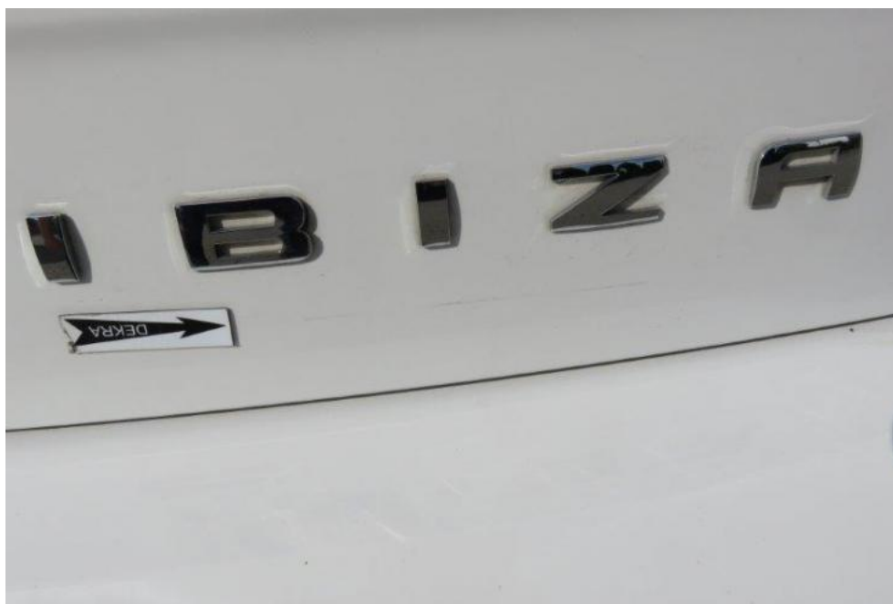
Fot. 47. pokrywa komory bagażnika