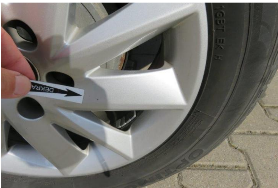
Fot. 44. tarcza koła TL