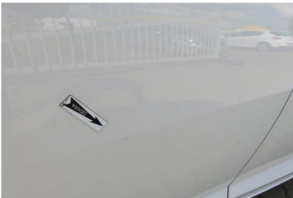
Fot. 53. drzwi TR