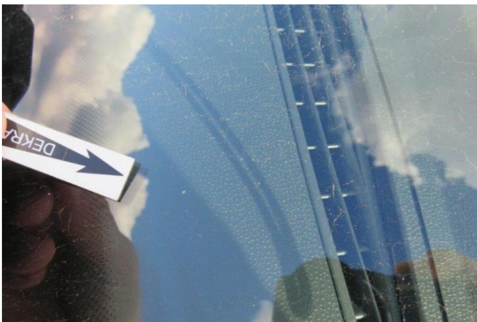
Fot. 34. szyba czołowa