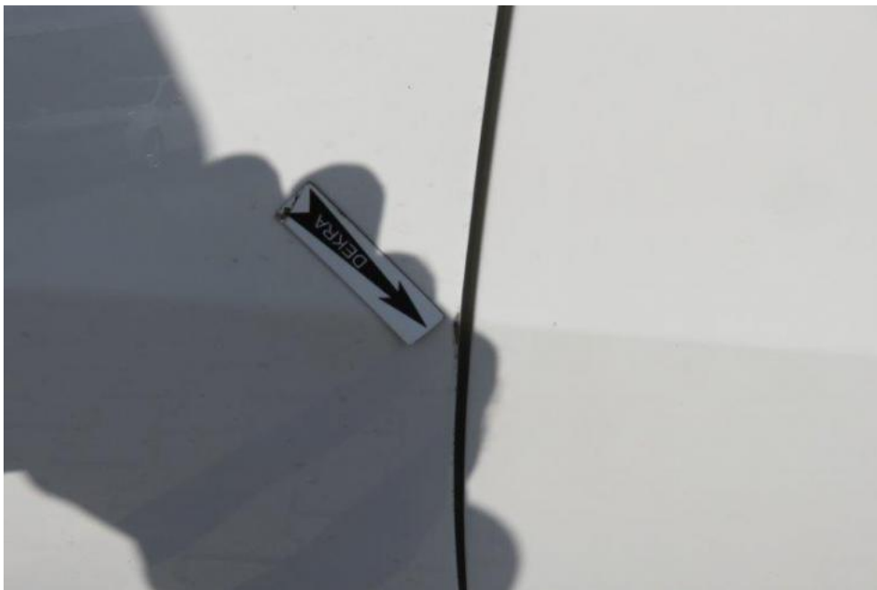
Fot. 37. drzwi PL