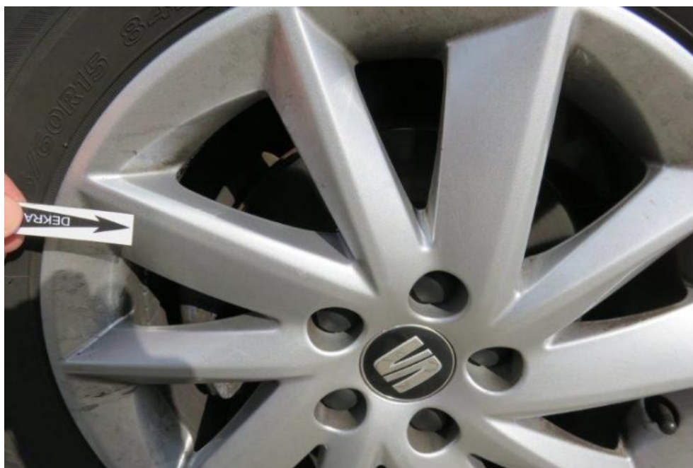
Fot. 31. tarcza koła PL