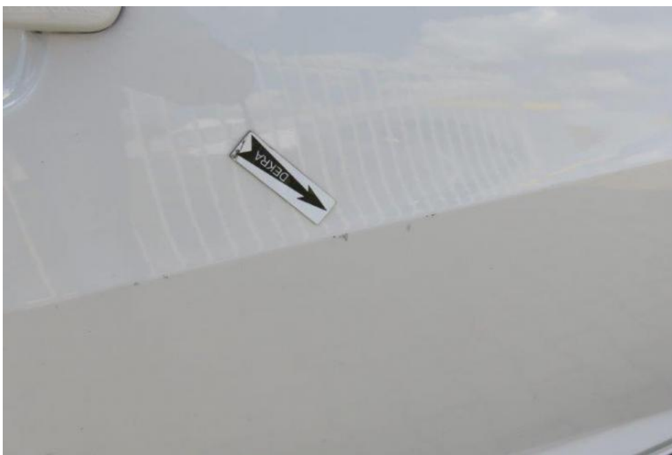
Fot. 55. drzwi PR