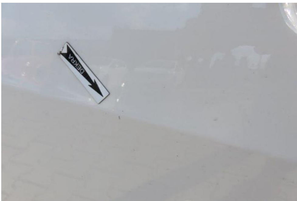
Fot. 36. drzwi PL