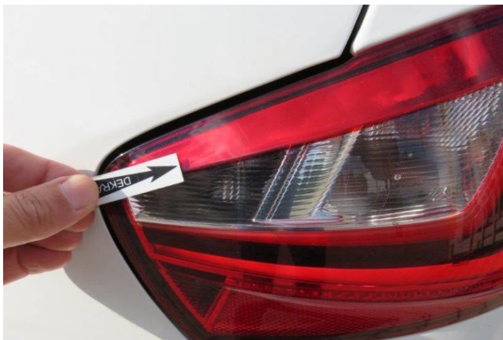
Fot. 48. lampa TR