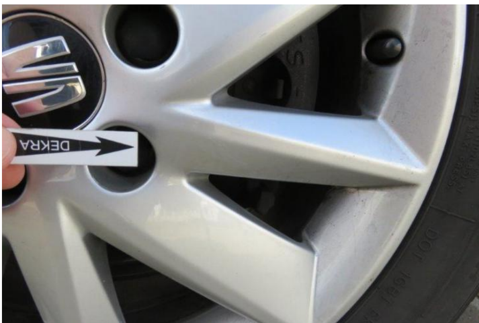
Fot. 60. tarcza koła PR