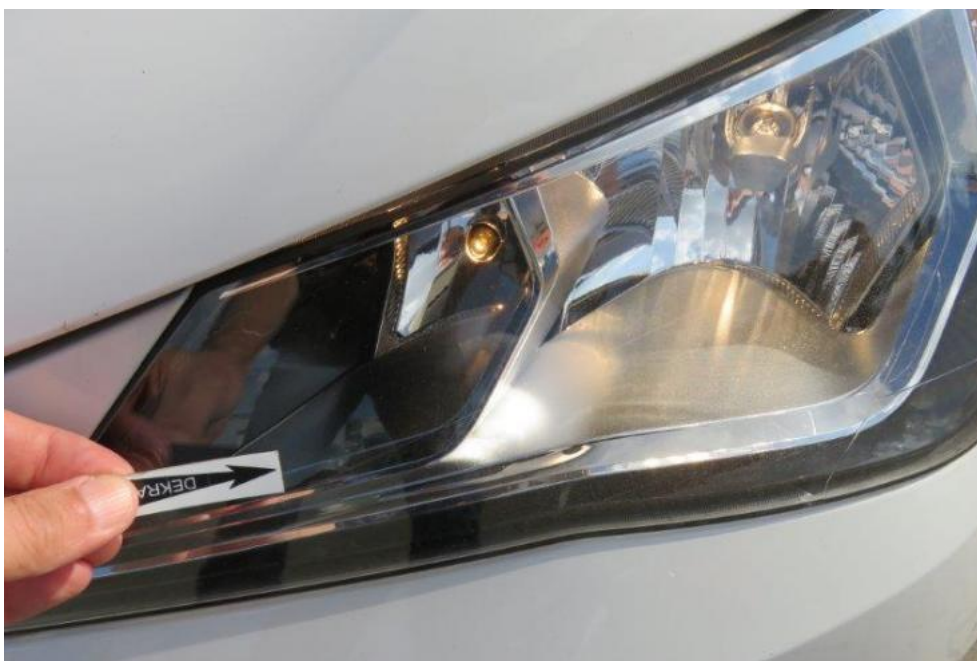
Fot. 28. reflektor lewy