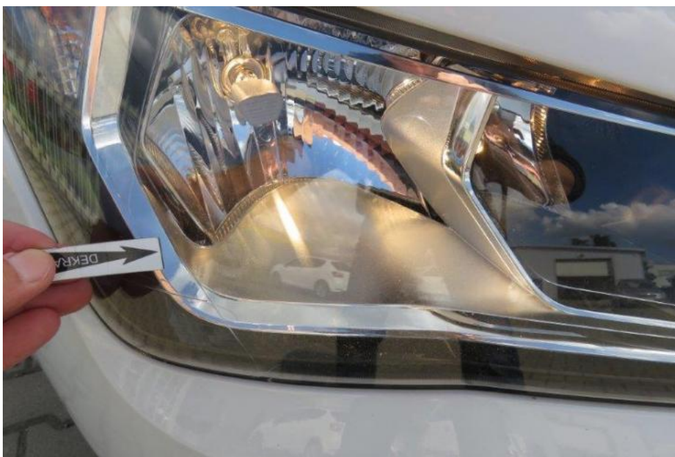
Fot. 27. reflektor prawy