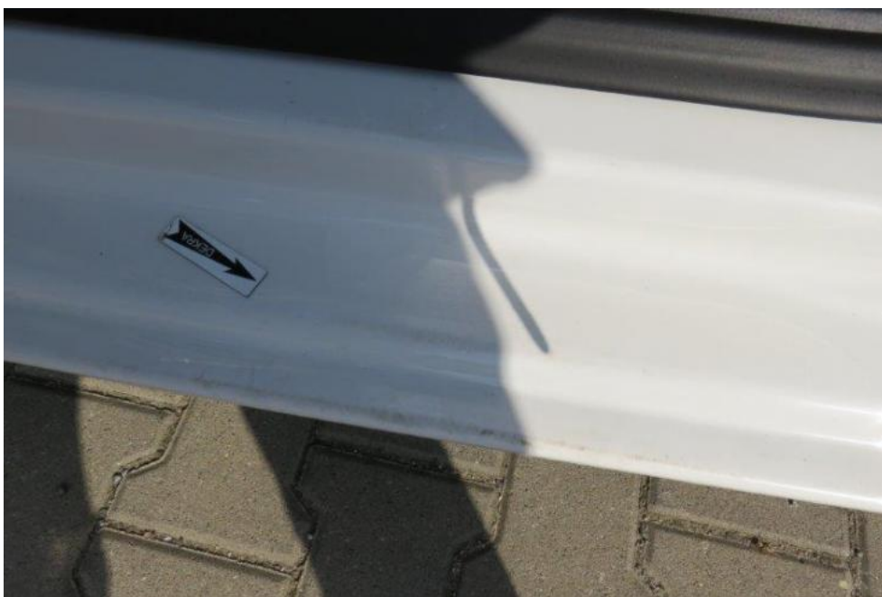
Fot. 20. próg lewy