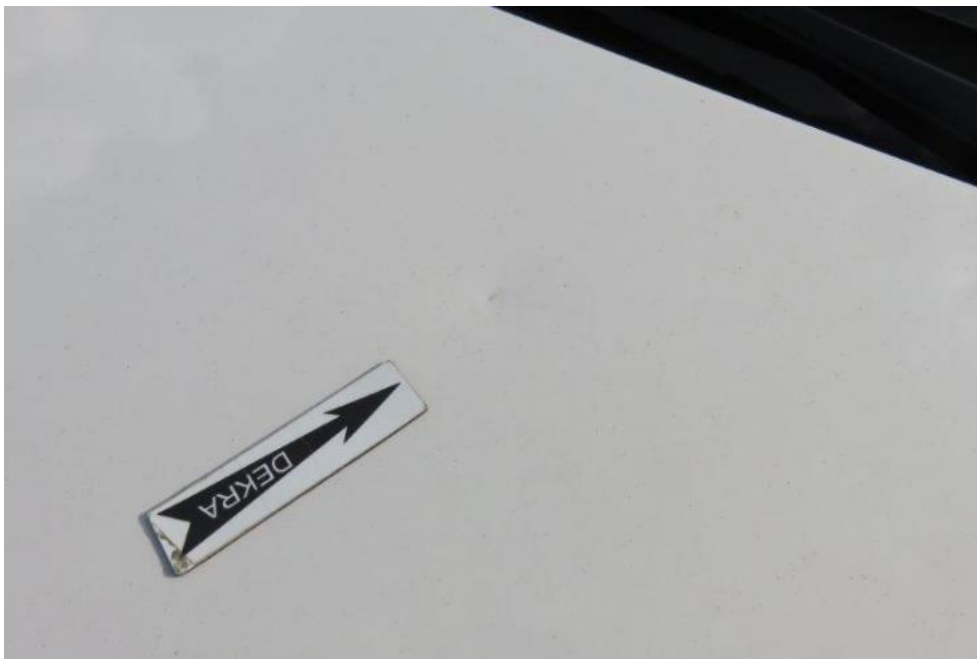
Fot. 25. pokrywa komory silnika