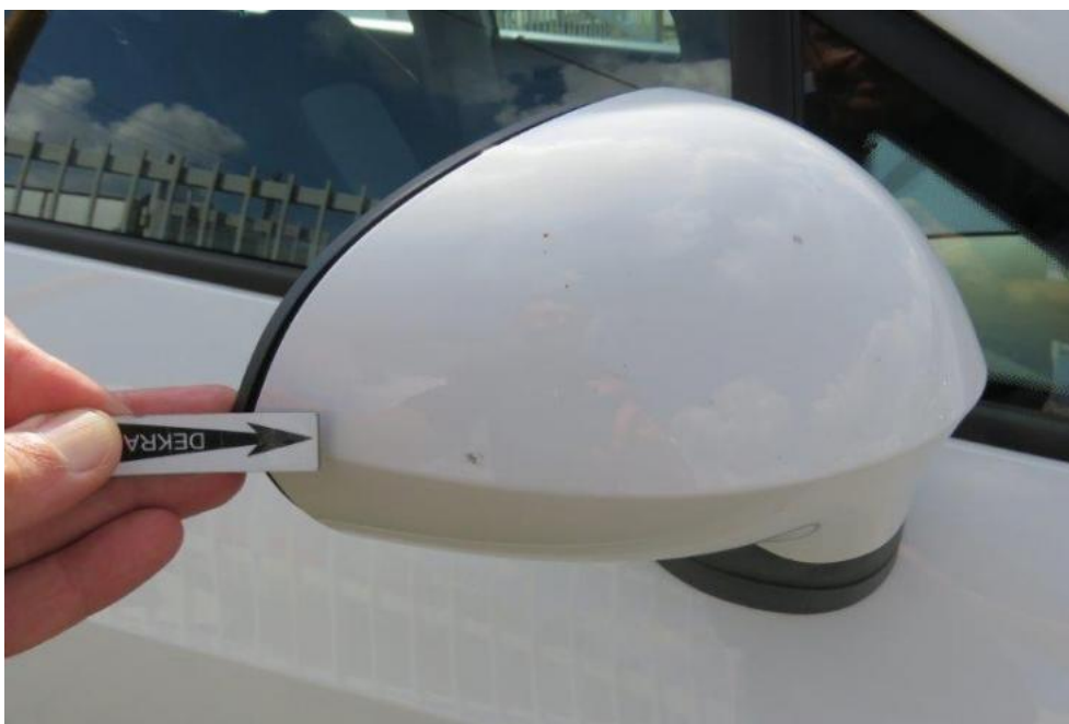
Fot. 57. lusterko zew. prawe