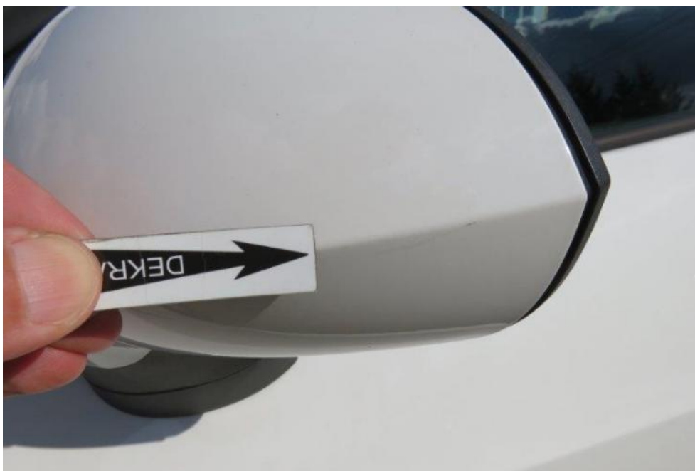
Fot. 33. lusterko zew. lewe