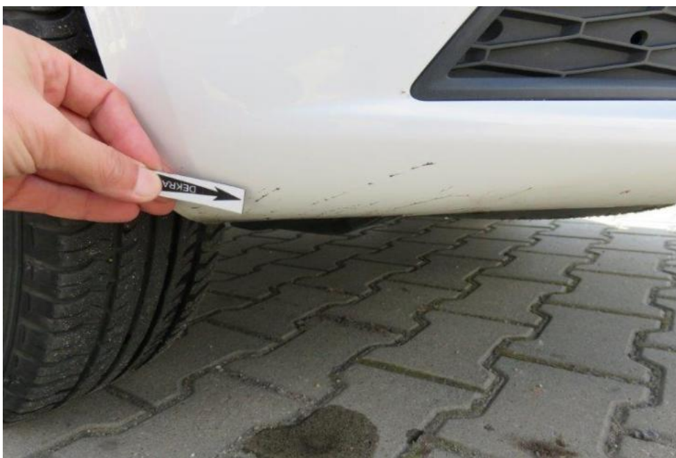
Fot. 29. zderzak przedni