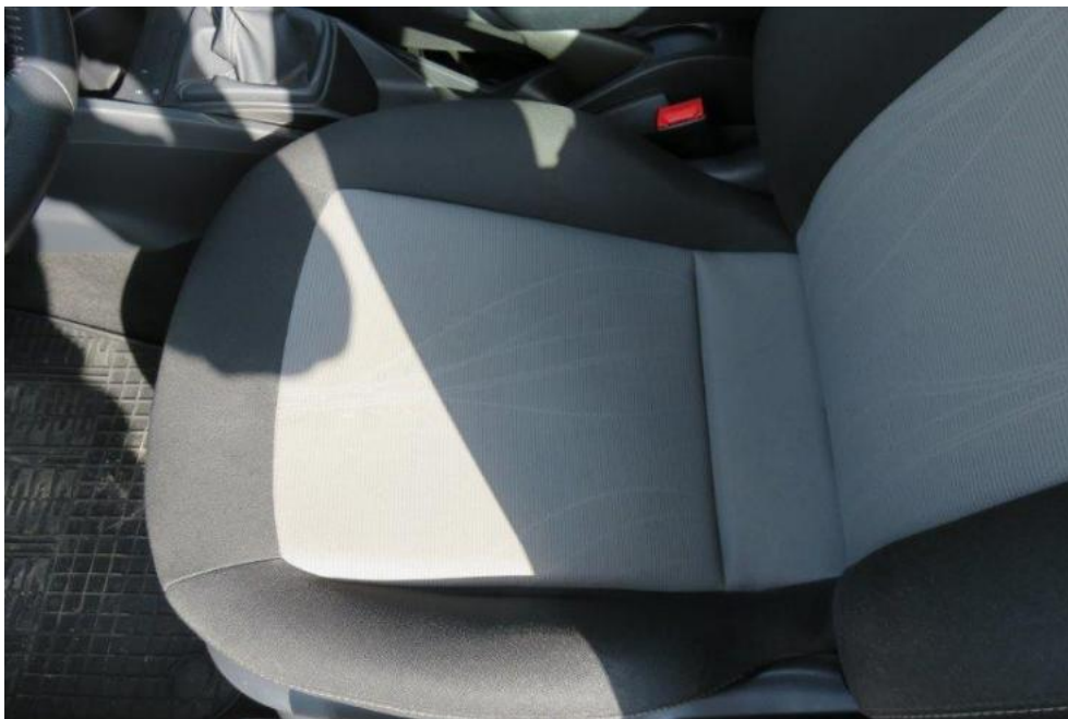
Fot. 21. fotel PL