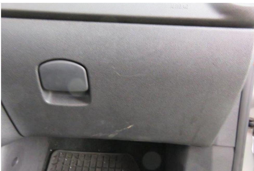
Fot. 20. pokrywa schowka