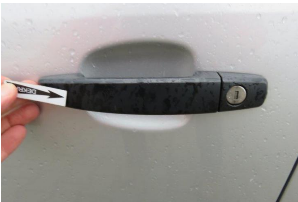
Fot. 35. drzwi PL