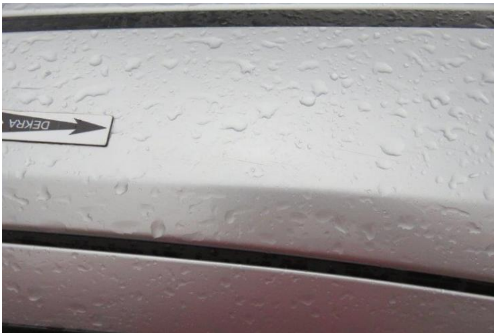
Fot. 39. rama lewa dachu