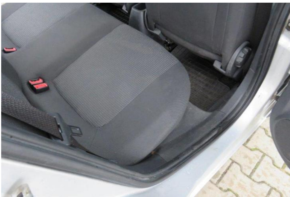
Fot. 21. kanapa tylna