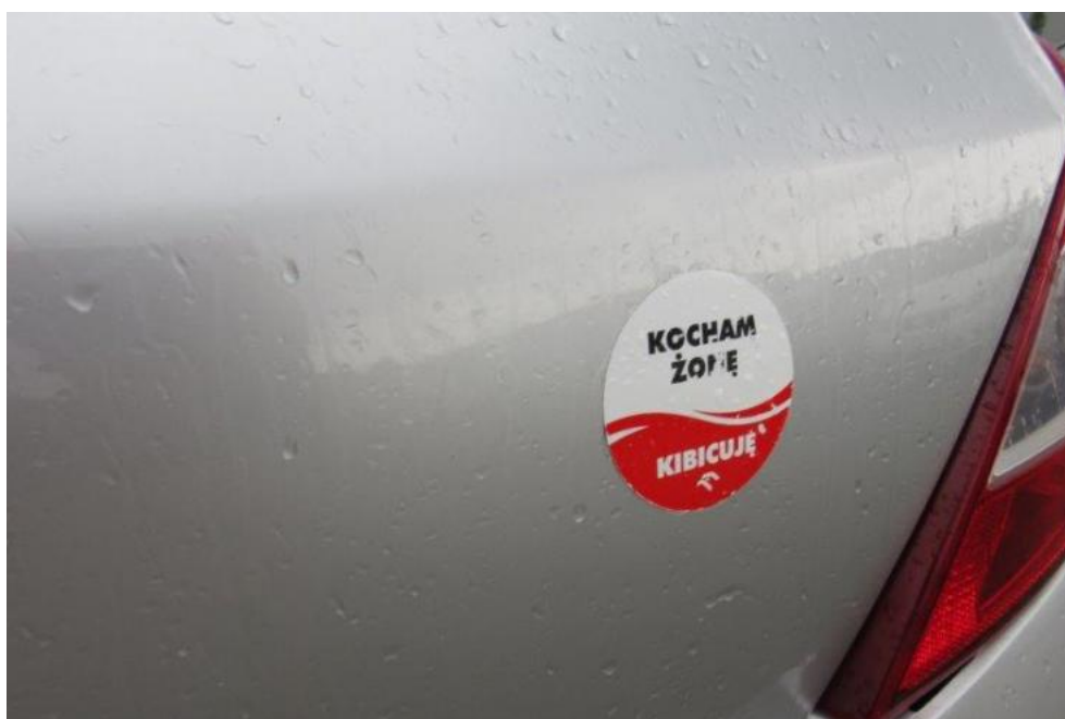
Fot. 42. pokrywa komory bagażnika