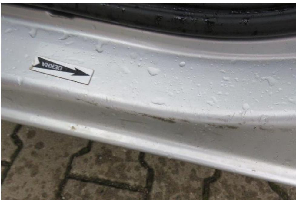
Fot. 26. próg lewy