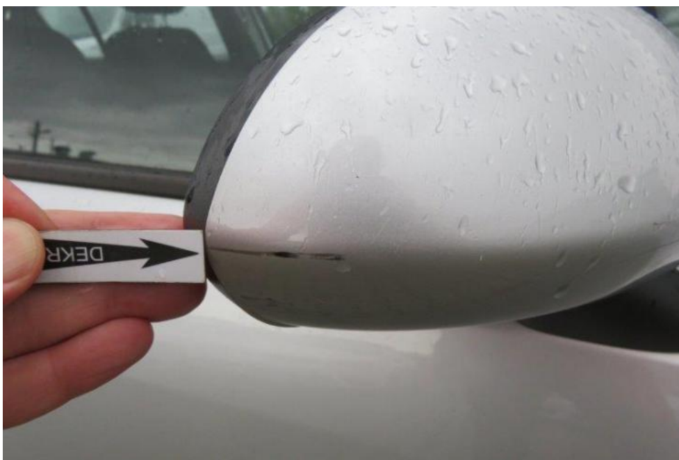
Fot. 55. lusterko zew. prawe