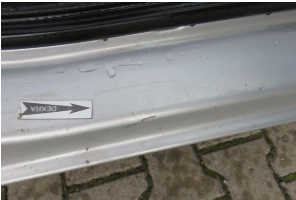
Fot. 17. próg prawy