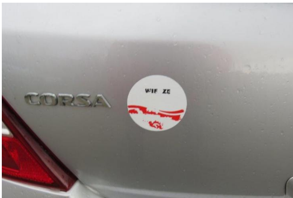
Fot. 41. pokrywa komory bagażnika