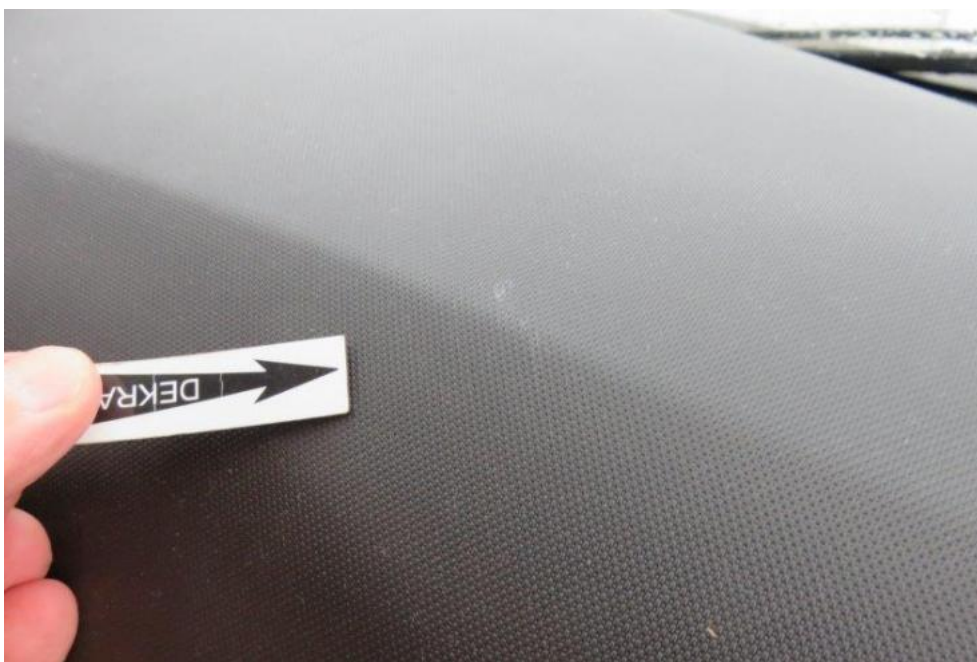
Fot. 19. deska rozdzielcza