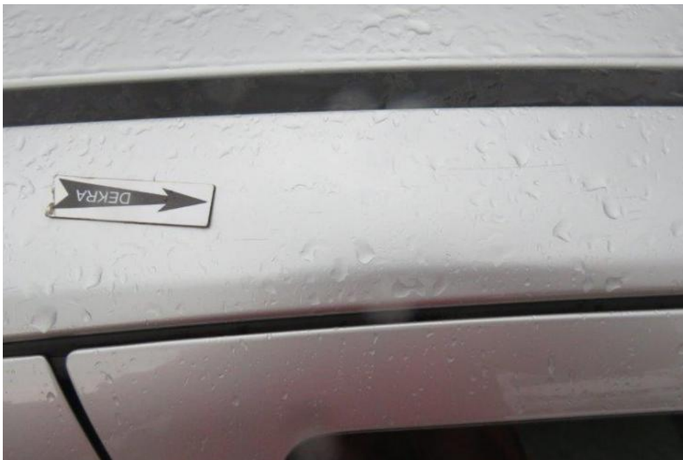
Fot. 57. rama prawa dachu