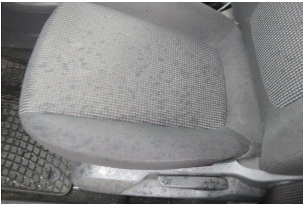
Fot. 27. fotel PL