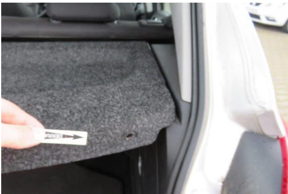
Fot. 24. półka tylna