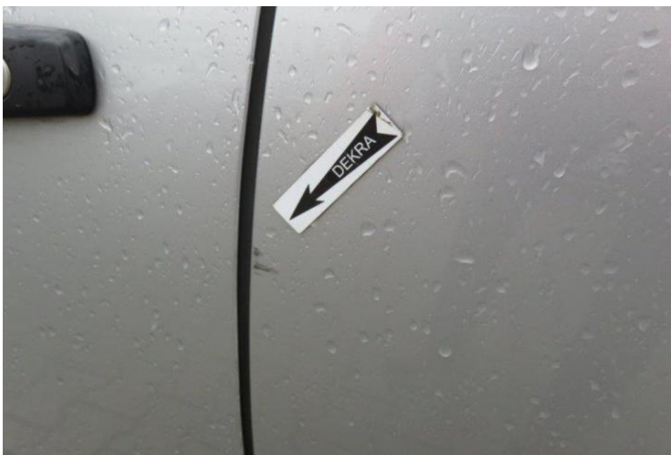
Fot. 37. rzwi TL