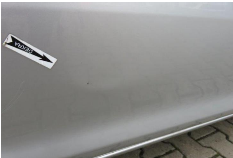
Fot. 51. drzwi PR