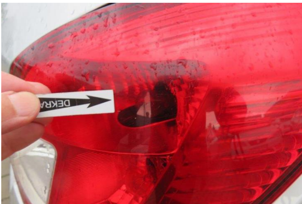
Fot. 44. lampa TR