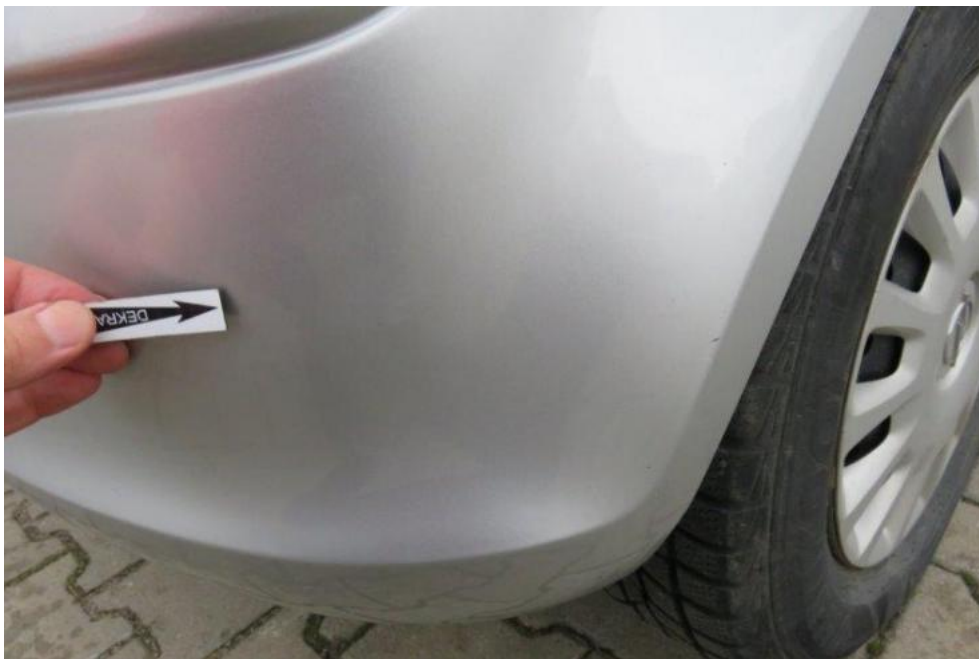
Fot. 43. zderzak tylny