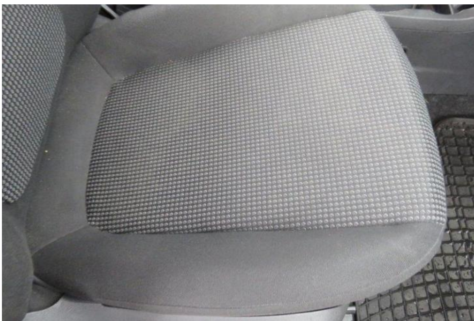
Fot. 18. fotel PR