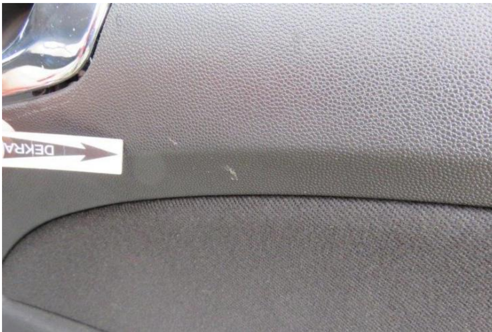
Fot. 23. drzwi TR