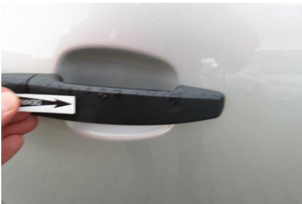
Fot. 49. drzwi TR