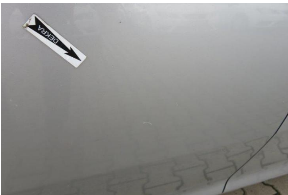
Fot. 48. drzwi TR