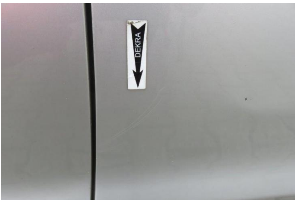
Fot. 52. drzwi PR