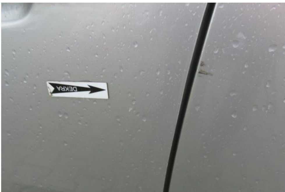
Fot. 34. drzwi PL