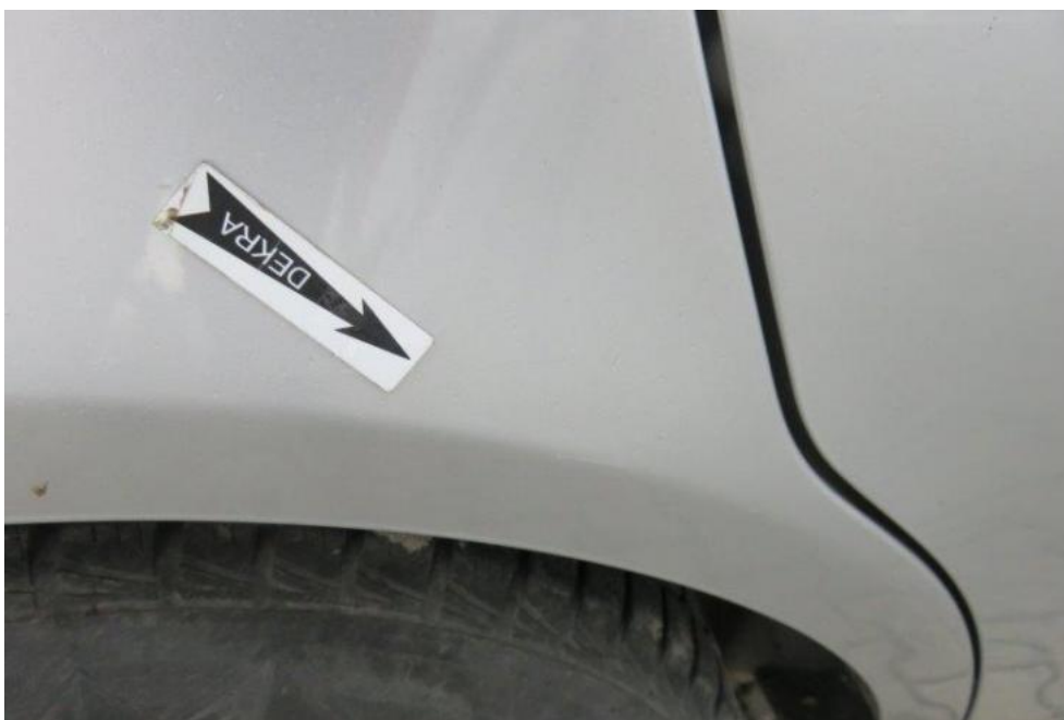
Fot. 46. błotnik TR