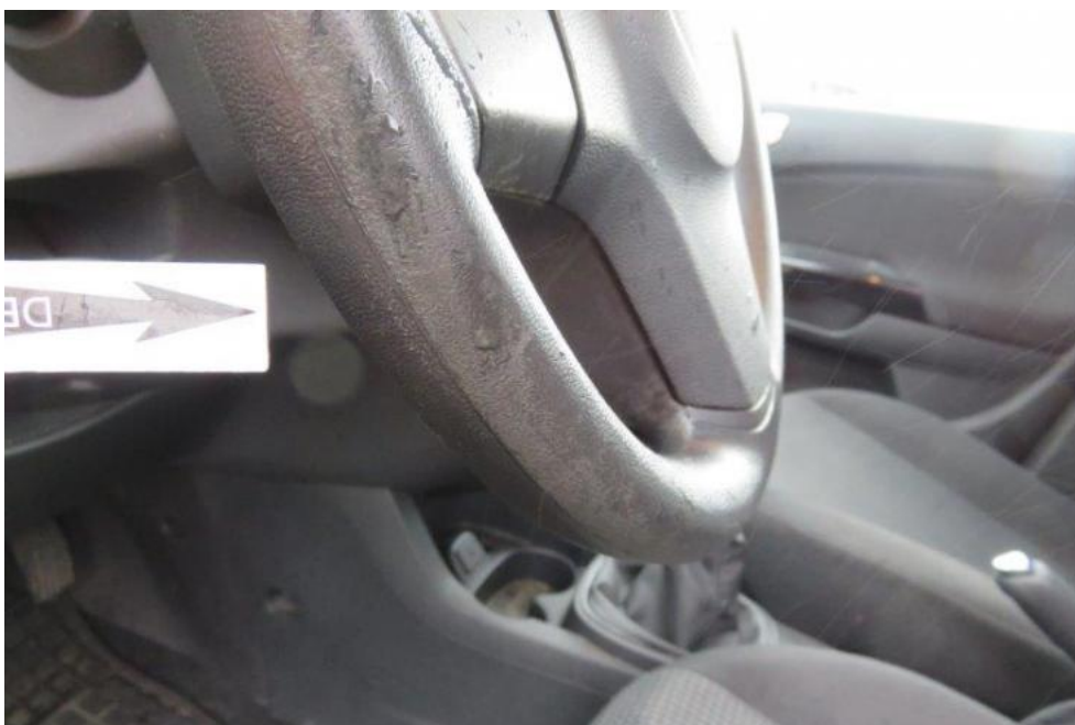
Fot. 28. koło kierownicy