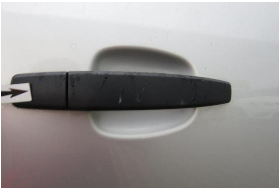
Fot. 53. drzwi PR