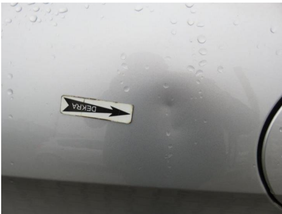
Fot. 38. błotnik TR