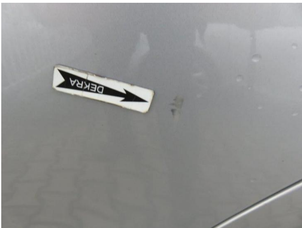
Fot. 30. drzwi TL