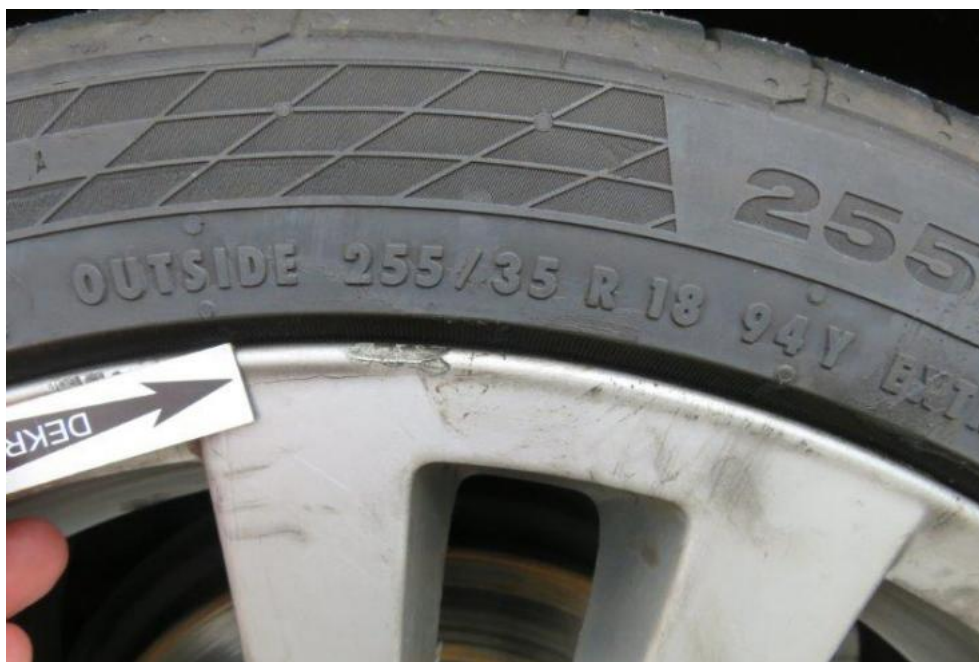
Fot. 35. tarcza koła TL