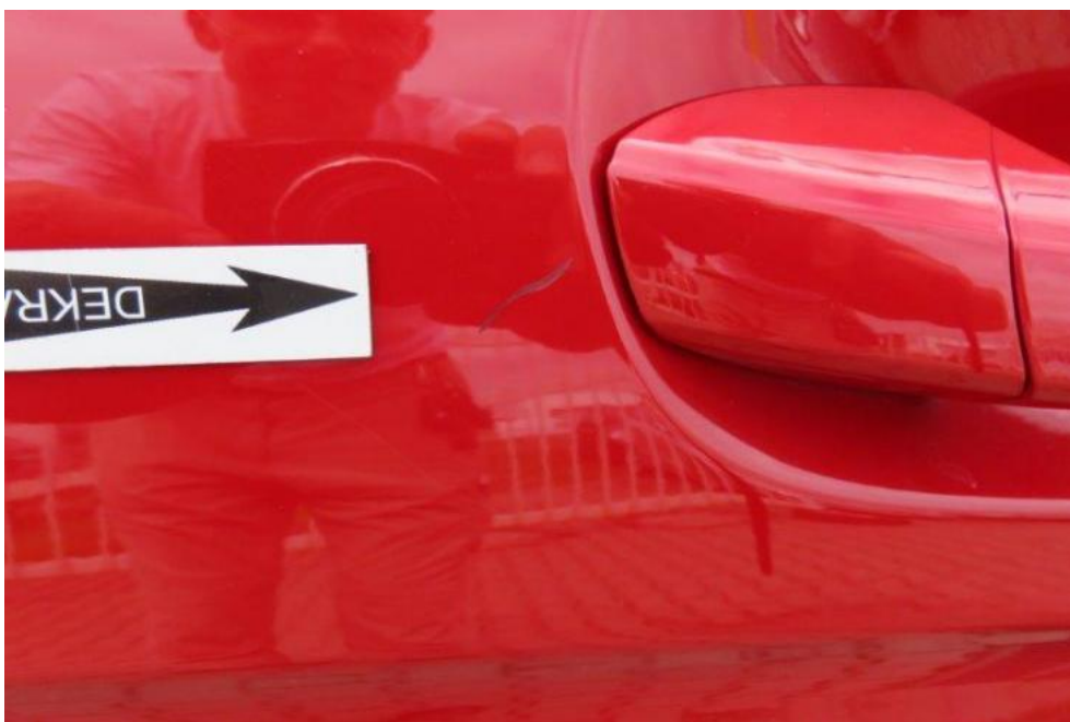
Fot. 44. drzwi prawe