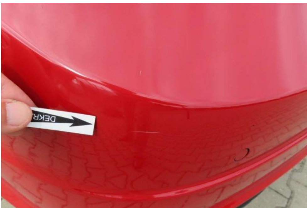
Fot. 39. zderzak tylny