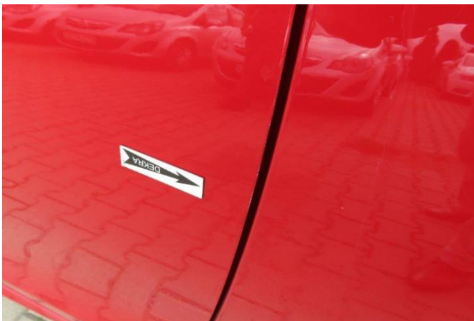
Fot. 33. drzwi lewe