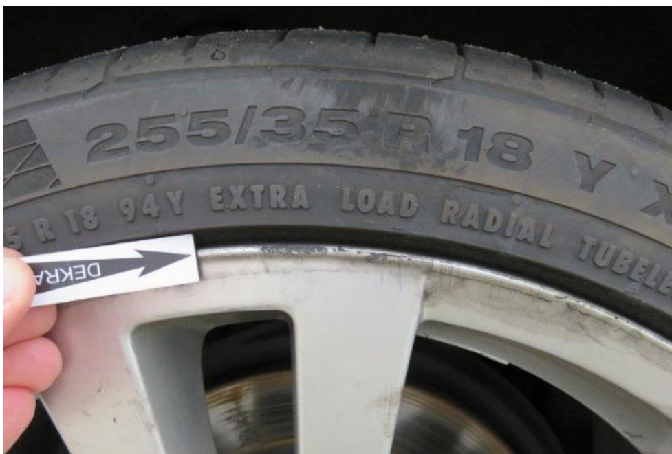
Fot. 42. tarcza koła TR