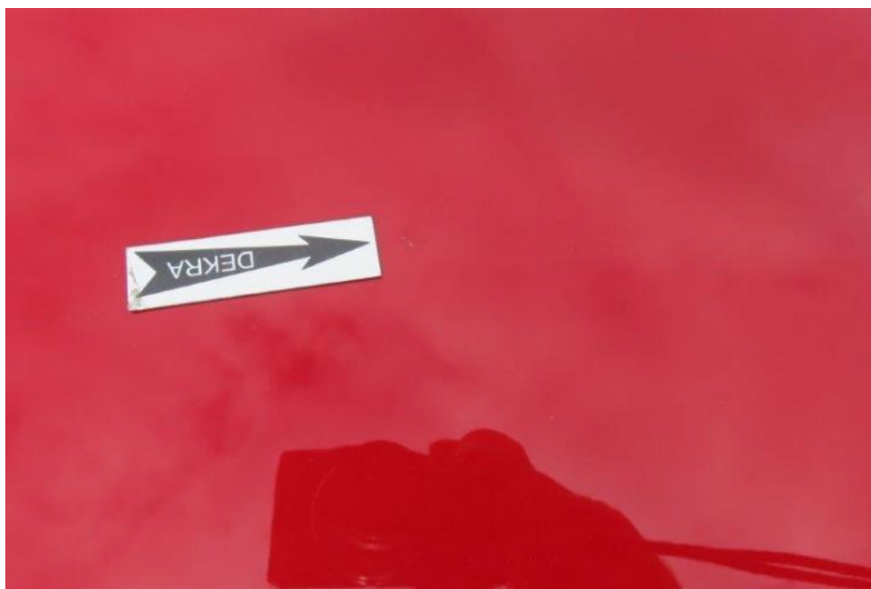
Fot. 37. dach