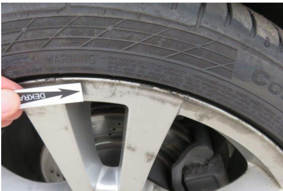
Fot. 28. tarcza koła PL