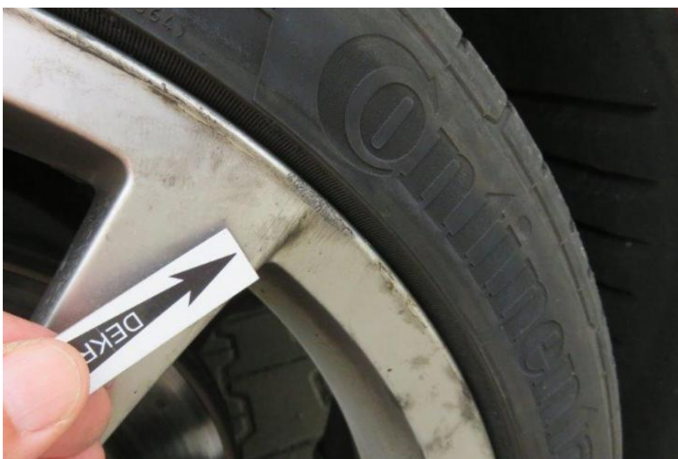
Fot. 48. tarcza koła PR