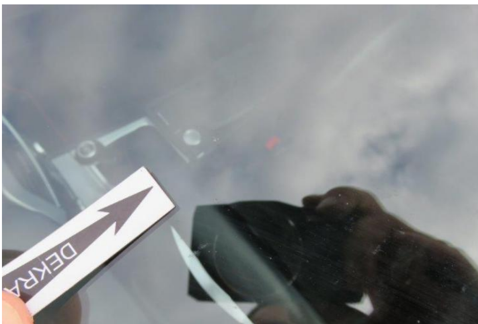
Fot. 31. szyba czołowa