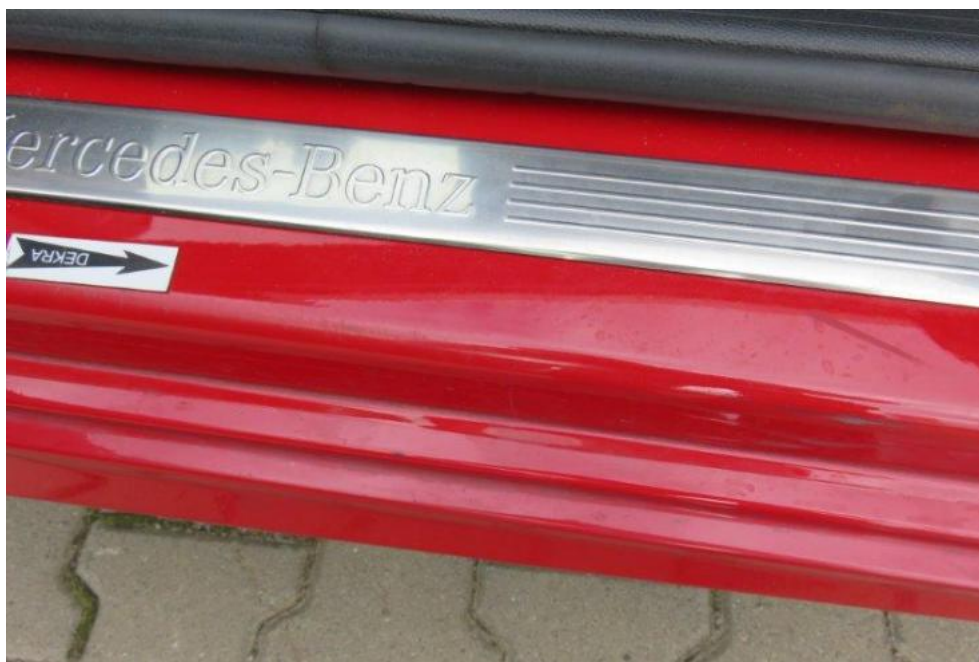
Fot. 23. próg lewy