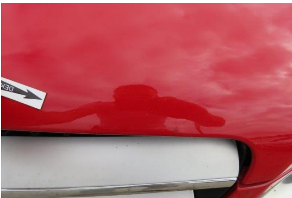
Fot. 25. pokrywa komory silnika