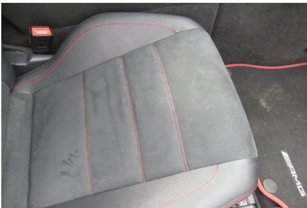
Fot. 21. fotel PR