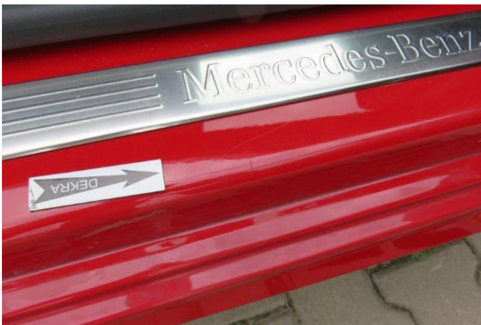
Fot. 20. próg prawy