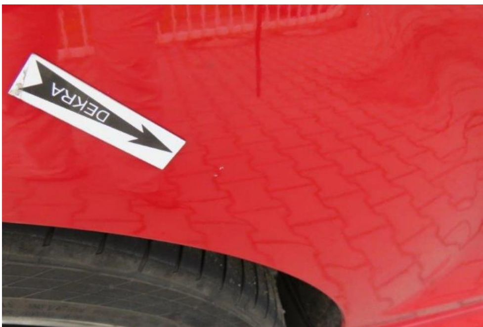
Fot. 41. błotnik TR