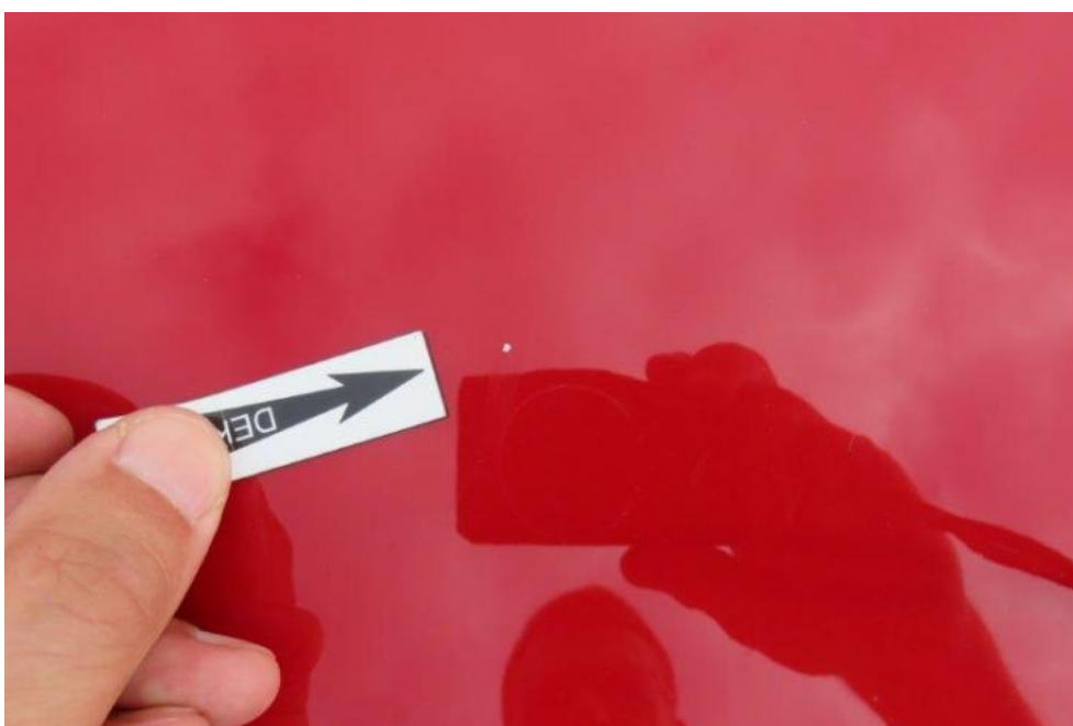
Fot. 26. pokrywa komory silnika