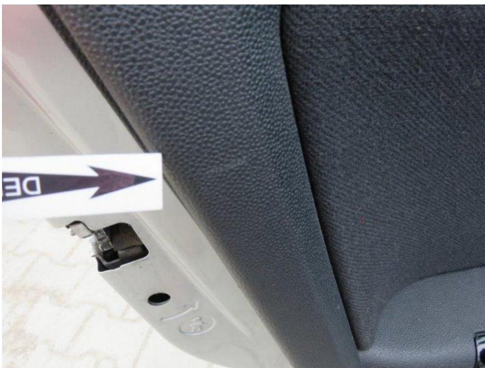
Fot. 26. drzwi TL