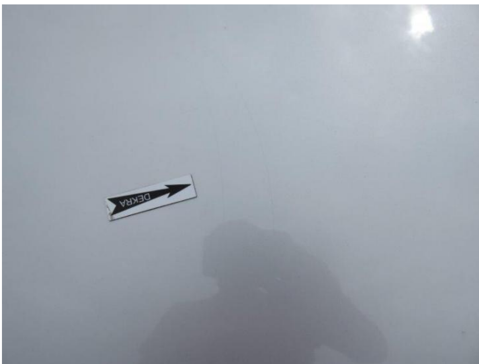
Fot. 32. pokrywa komory silnika