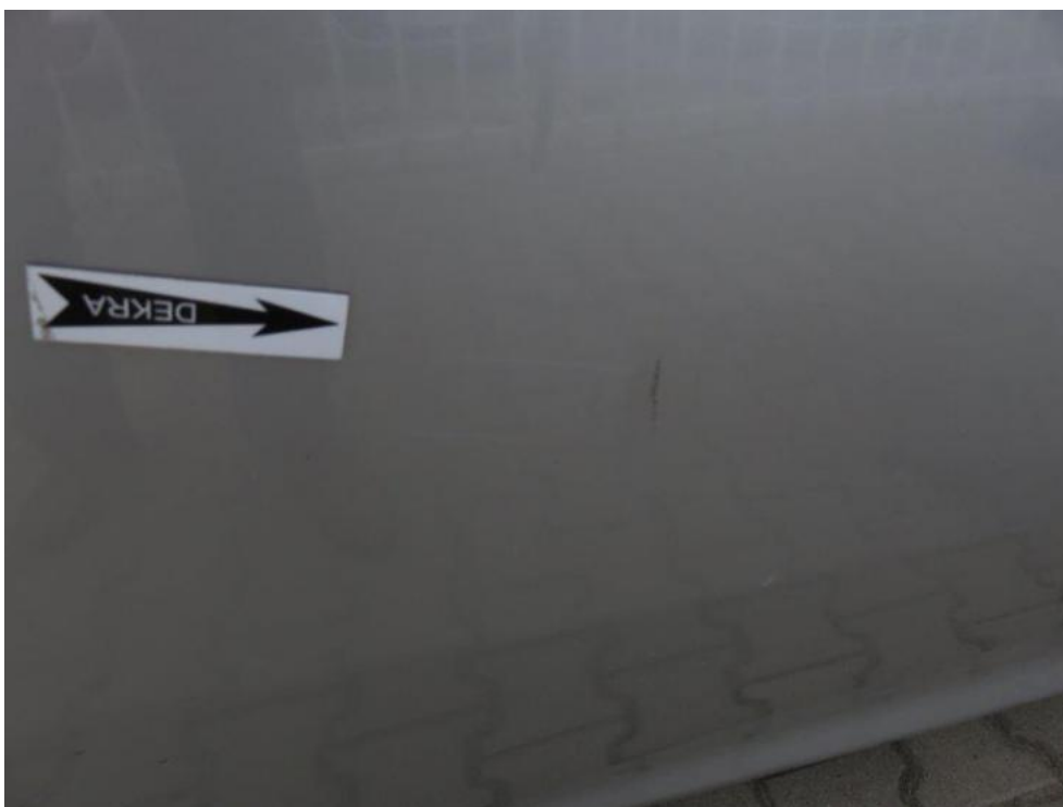
Fot. 56. drzwi TR