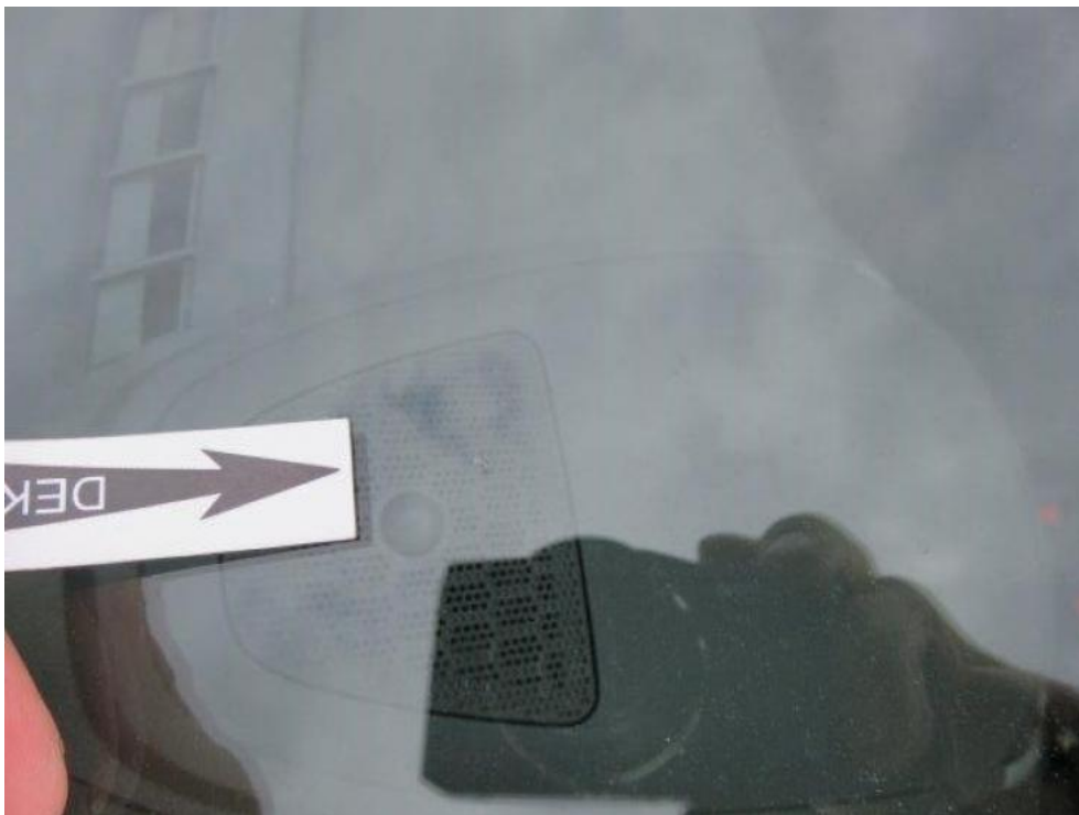
Fot. 39. szyba czołowa