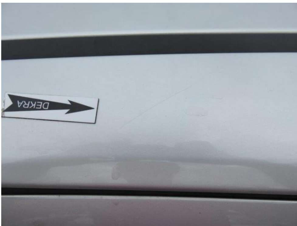
Fot. 45. rama lewa dachu