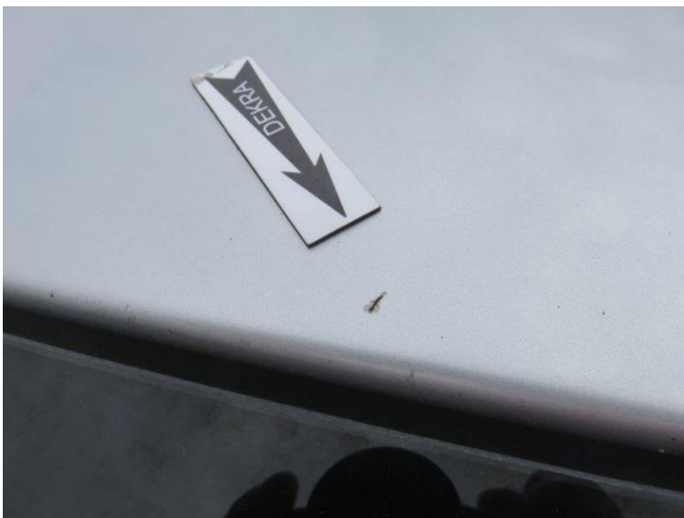
Fot. 38. dach