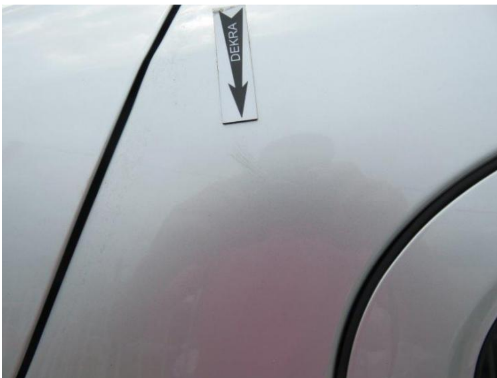
Fot. 54. błotnik TR