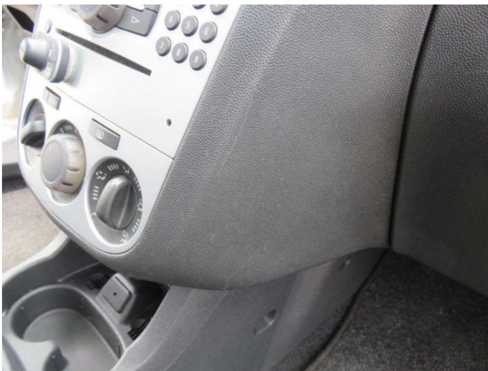
Fot. 19. konsola środkowa