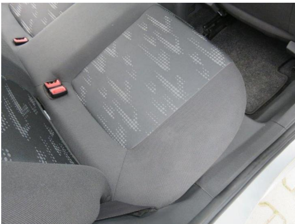
Fot. 20. kanapa tylna