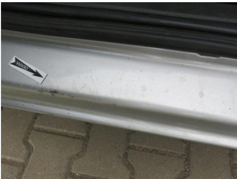
Fot. 28. próg lewy