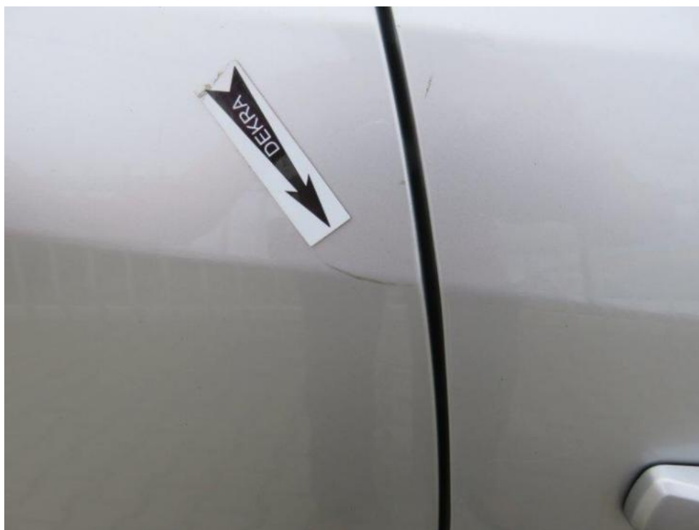
Fot. 57. drzwi TR