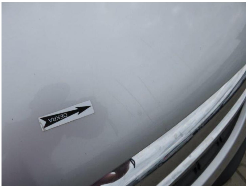
Fot. 34. pokrywa komory silnika