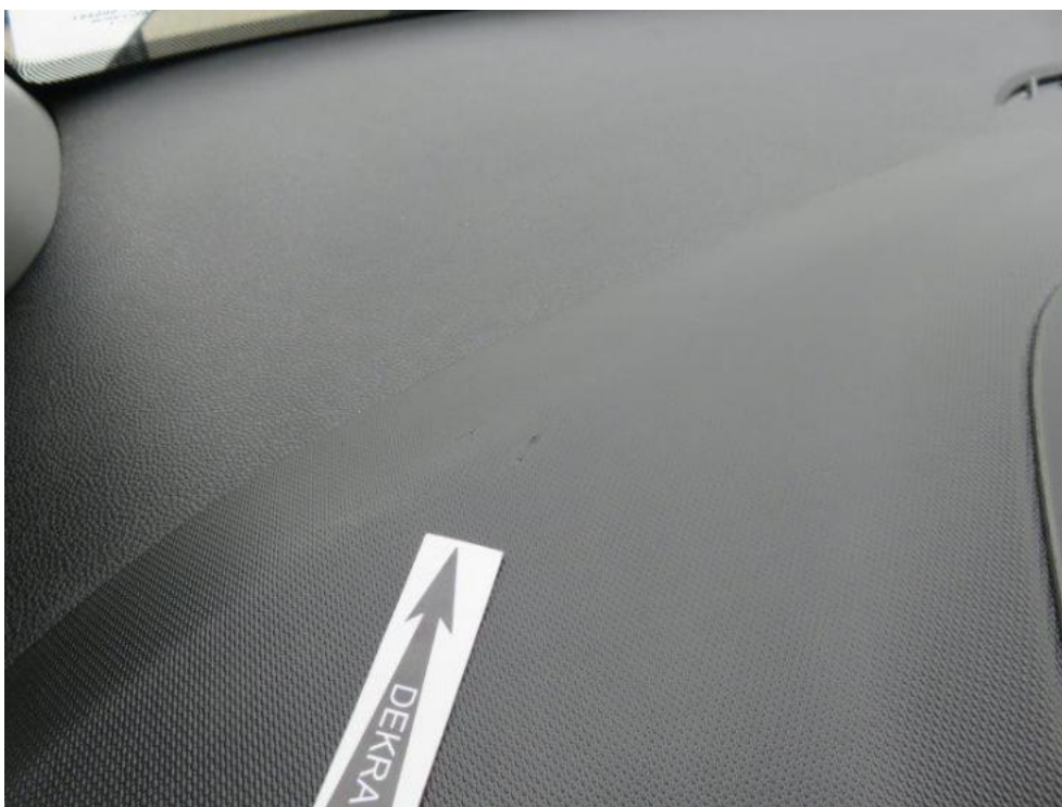
Fot. 30. deska rozdzielcza