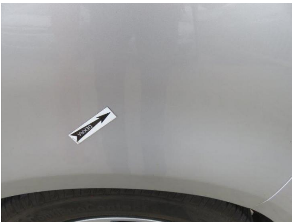
Fot. 48. błotnik TL