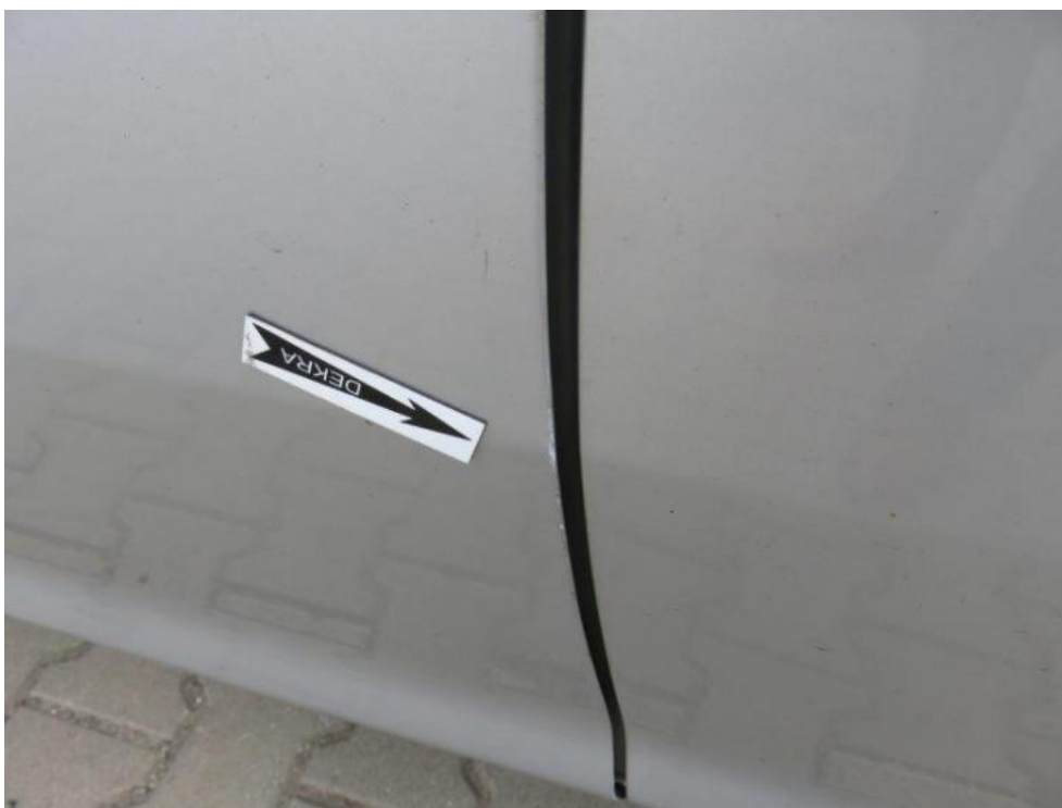
Fot. 41. drzwi PL