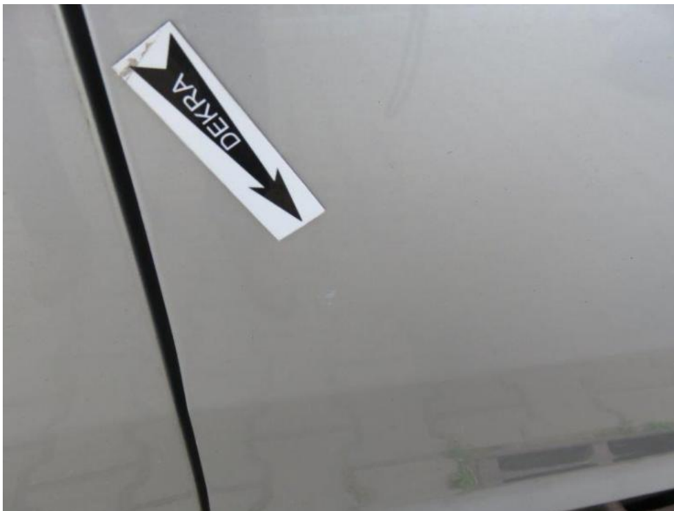
Fot. 59. drzwi PR