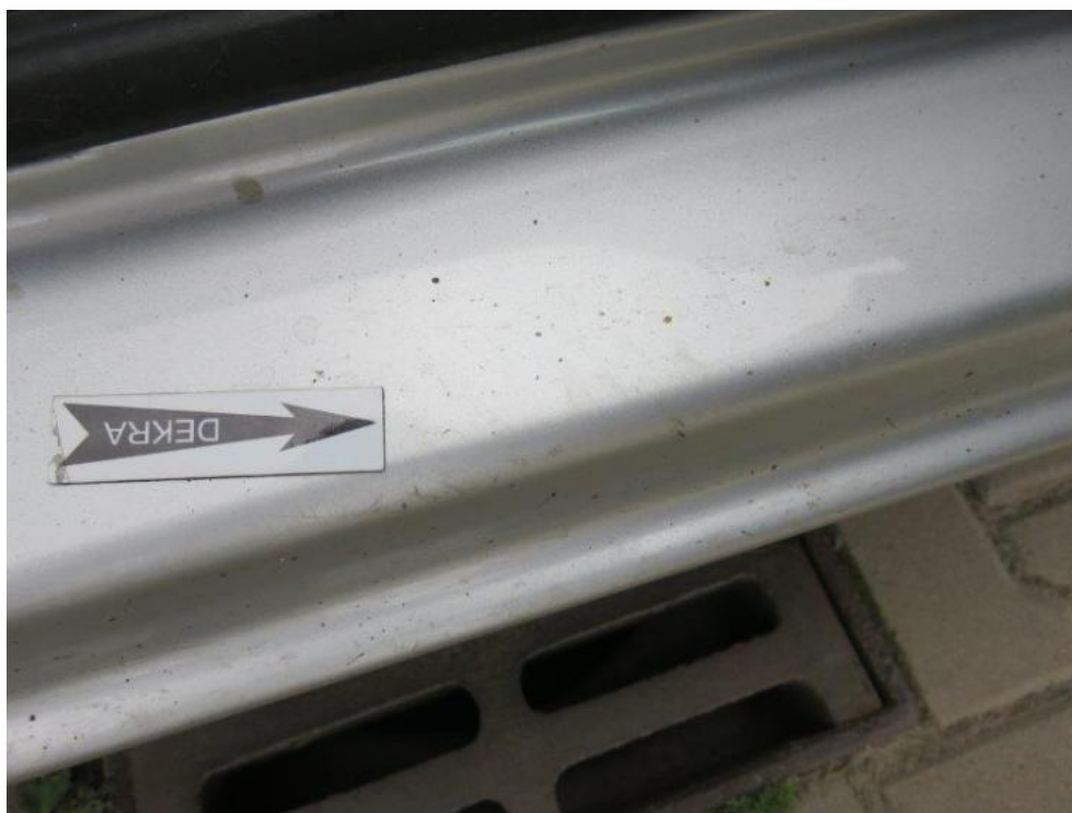
Fot. 17. próg prawy