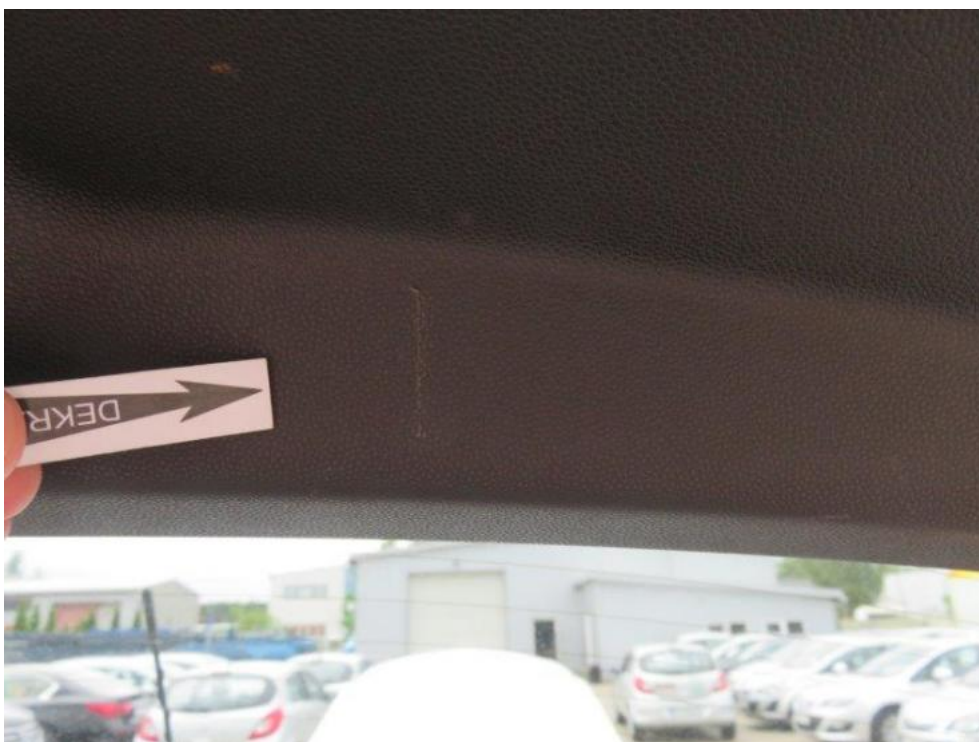
Fot. 24. pokrywa komory bagażnika