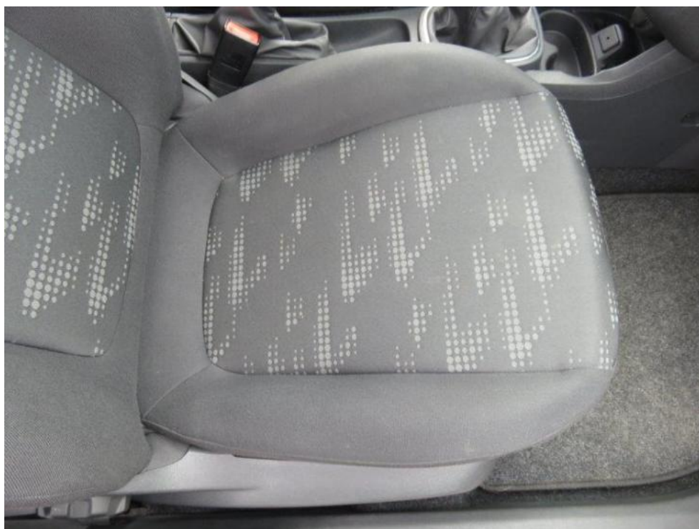
Fot. 18. fotel PR