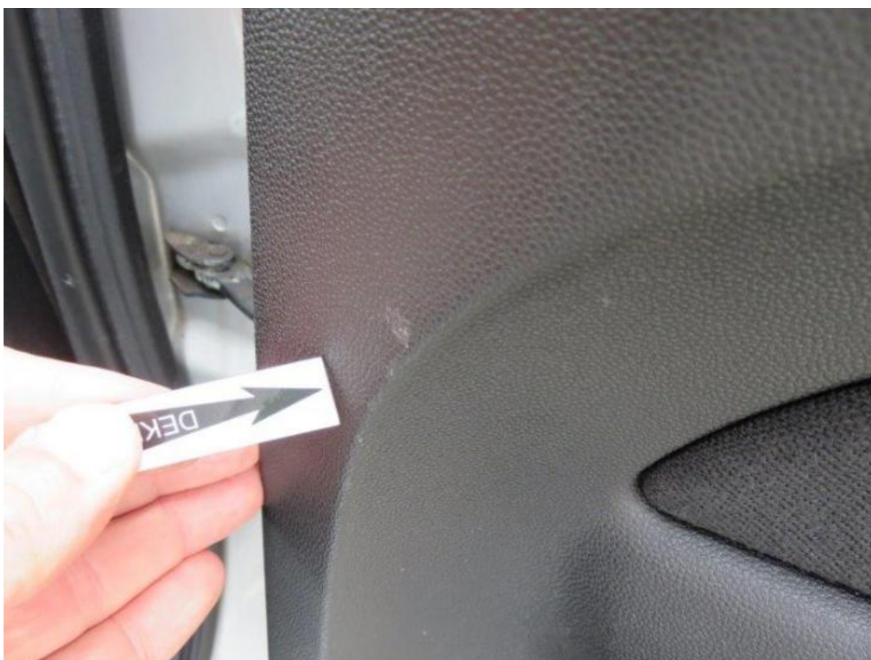
Fot. 22. drzwi TR