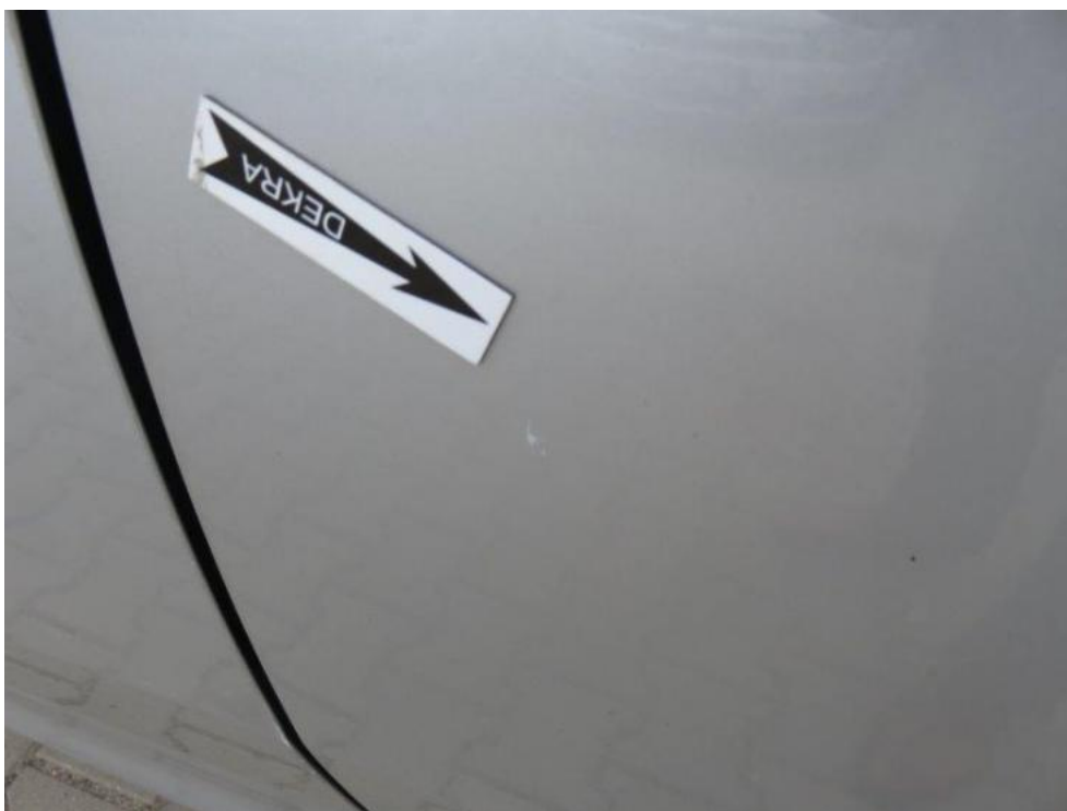
Fot. 43. drzwi TL