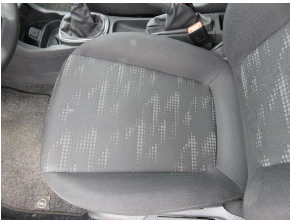
Fot. 29. fotel PL