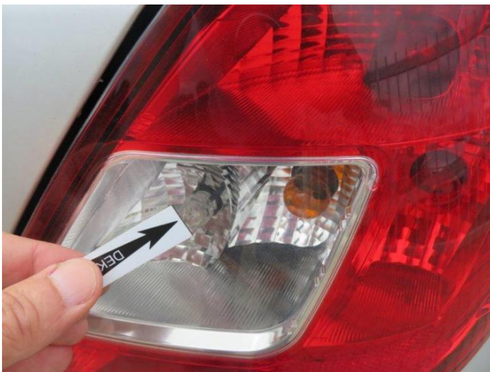
Fot. 51. lampa TR