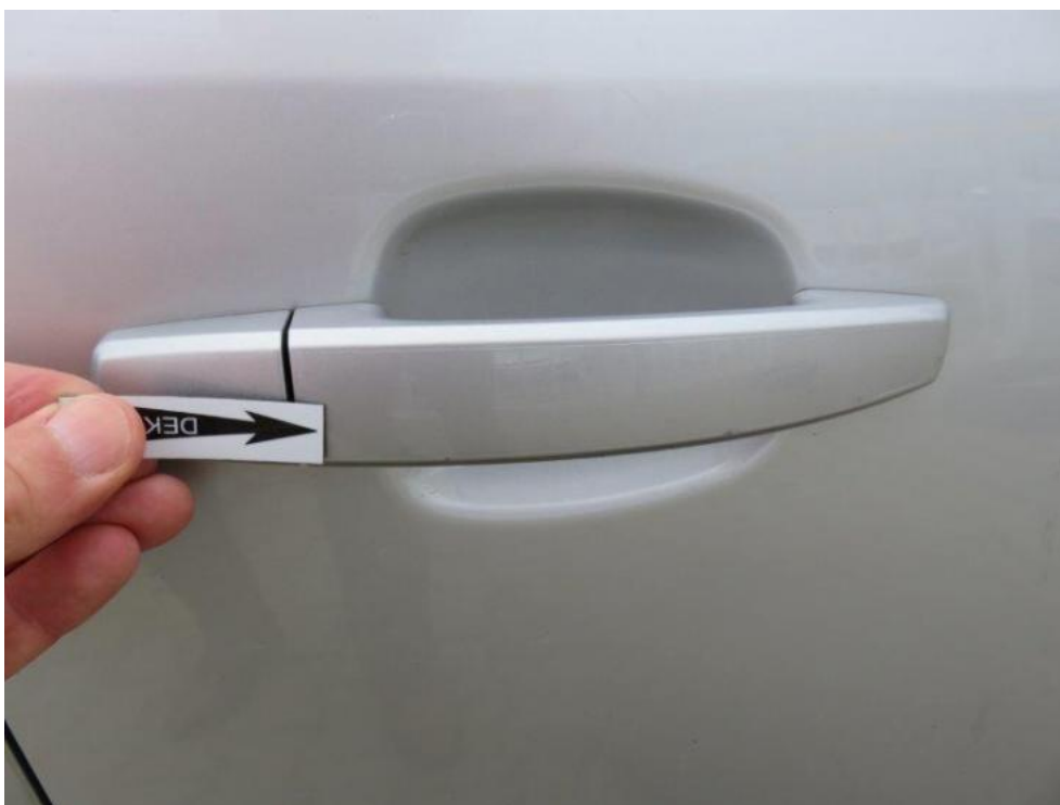
Fot. 60. drzwi PR