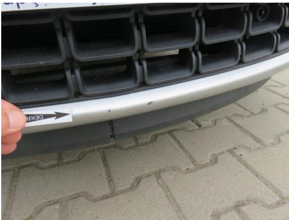
Fot. 35. zderzak przedni