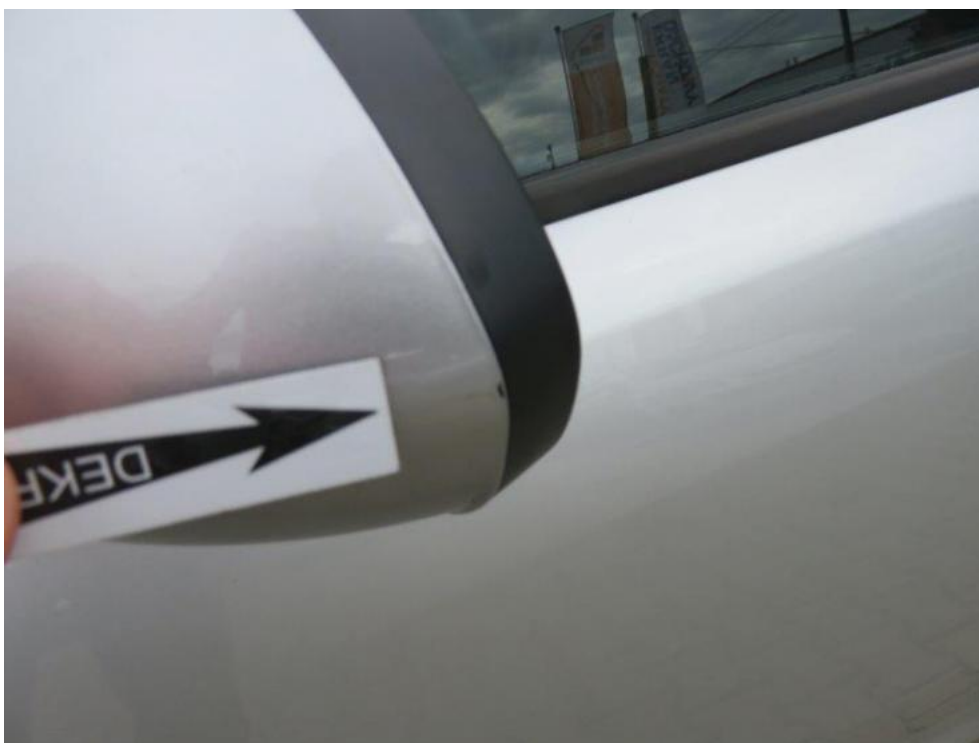
Fot. 37. lusterko zew. lewe