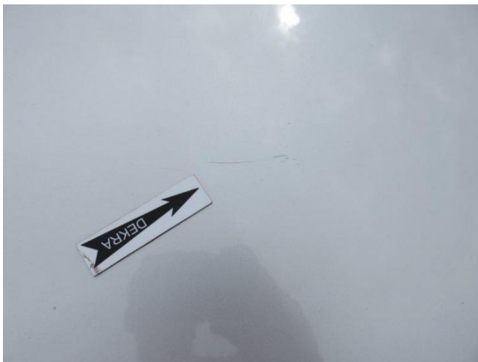
Fot. 33. pokrywa komory silnika