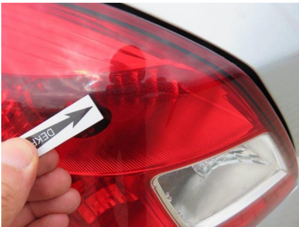
Fot. 50. lampa TL