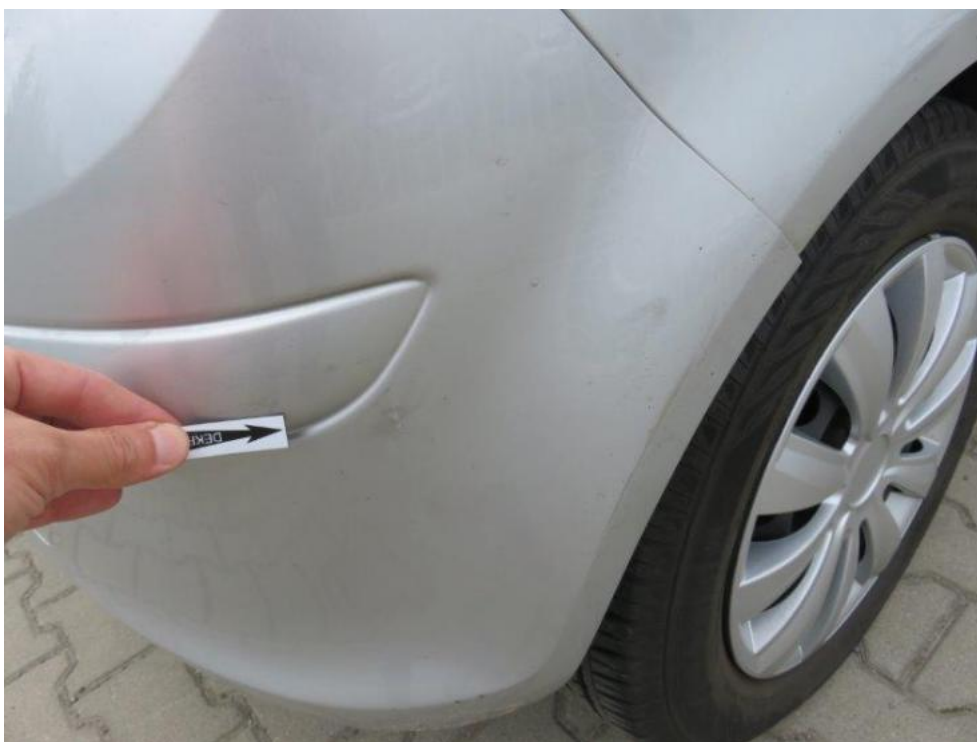
Fot. 52. zderzak tylny