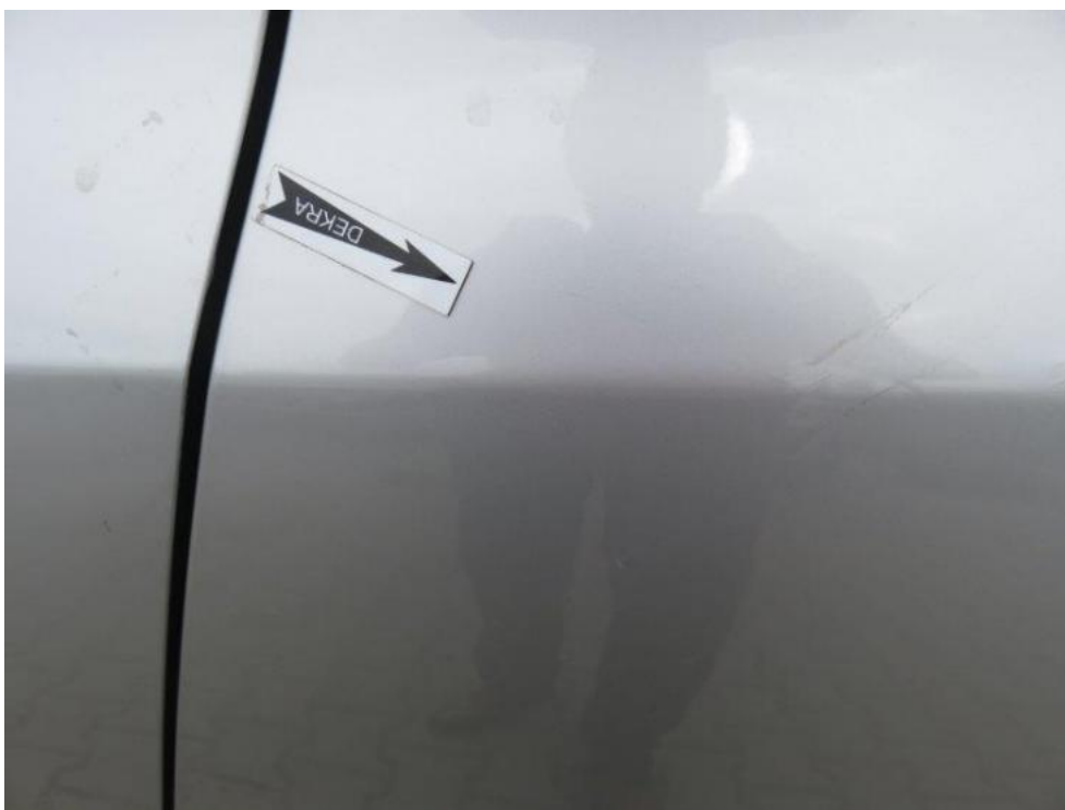
Fot. 47. błotnik TL