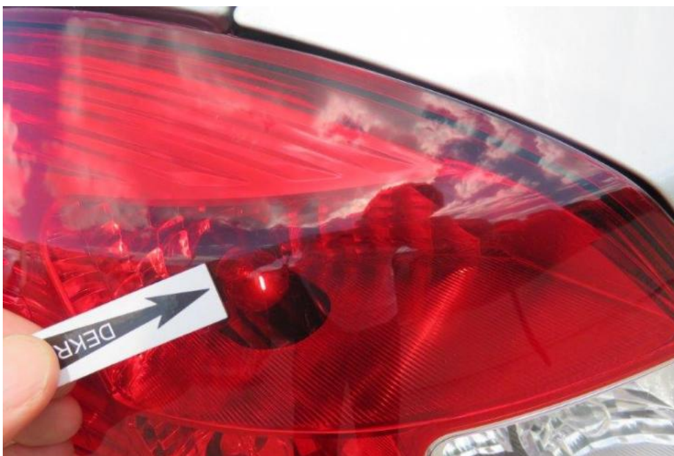
Fot. 44. lampa TL