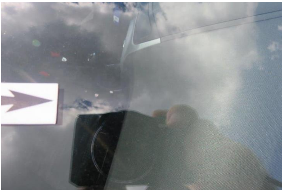
Fot. 51. szyba czołowa