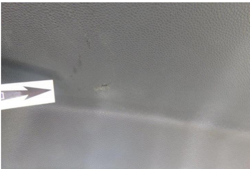
Fot. 24. pokrywa komory bagażnika