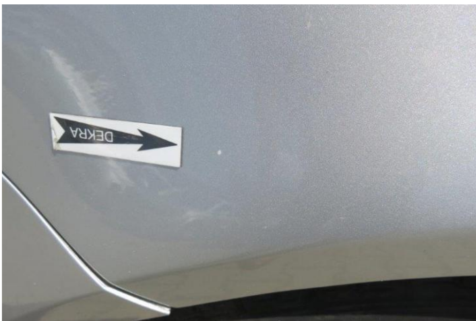
Fot. 36. błotnik PL