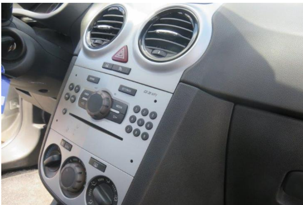
Fot. 19. konsola środkowa