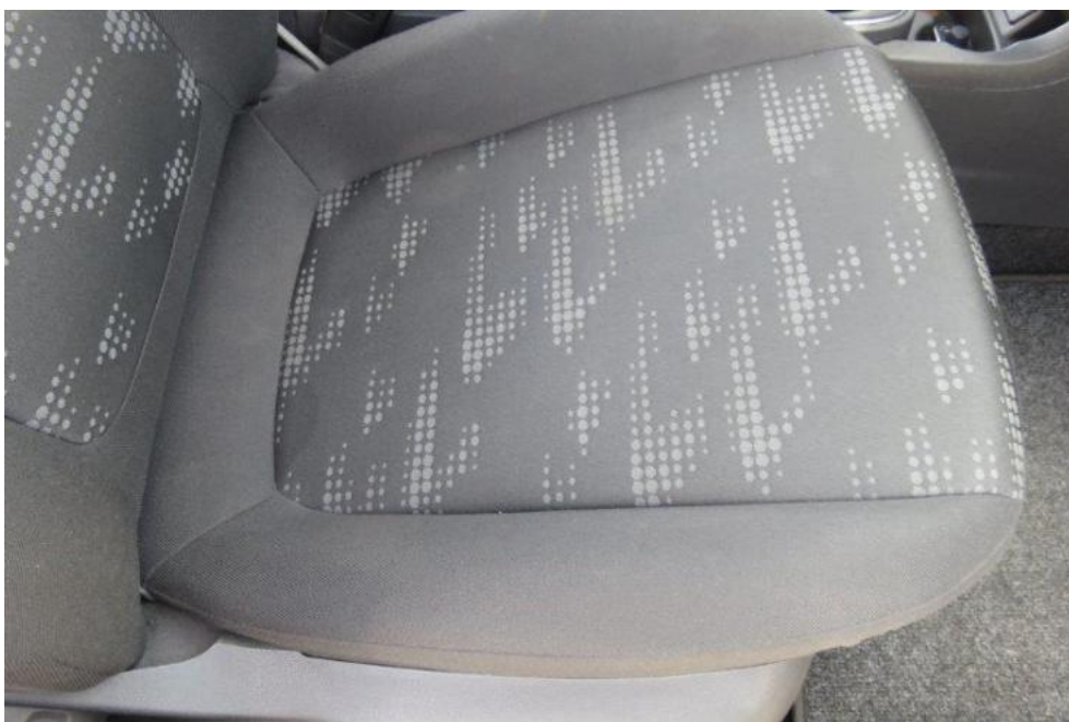
Fot. 18. fotel PR