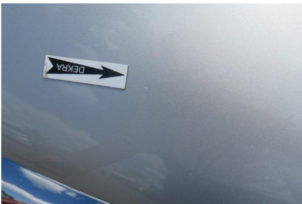
Fot. 34. pokrywa komory bagażnika