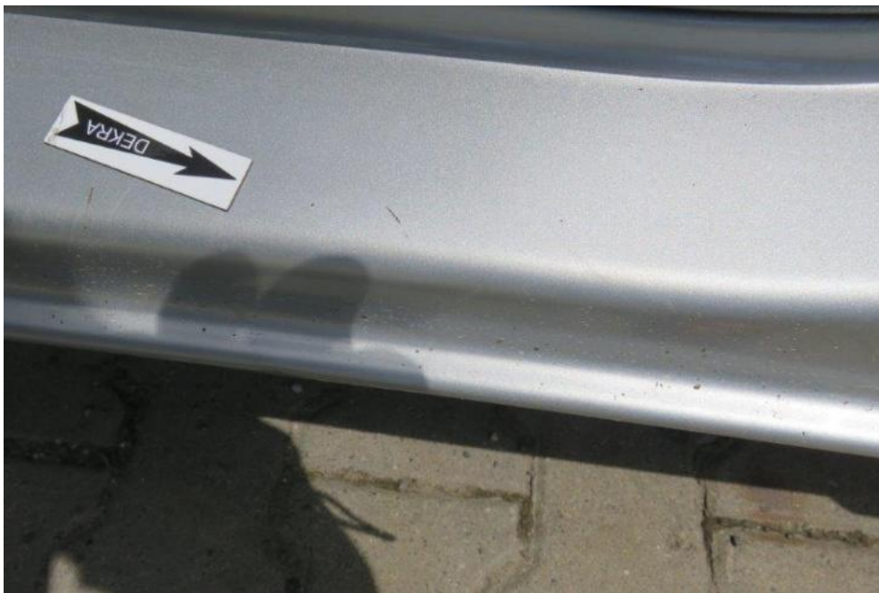
Fot. 31. próg lewy