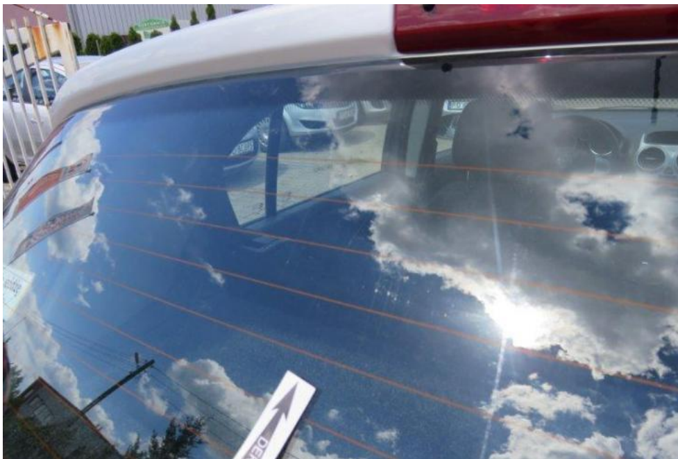
Fot. 45. szyba tylna