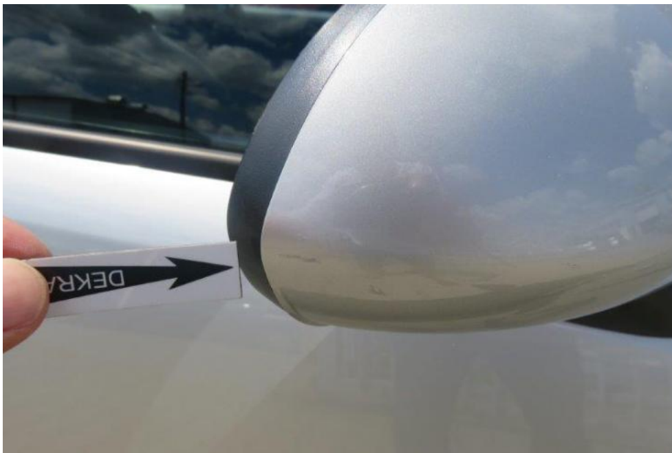
Fot. 49. lusterko zew. prawe