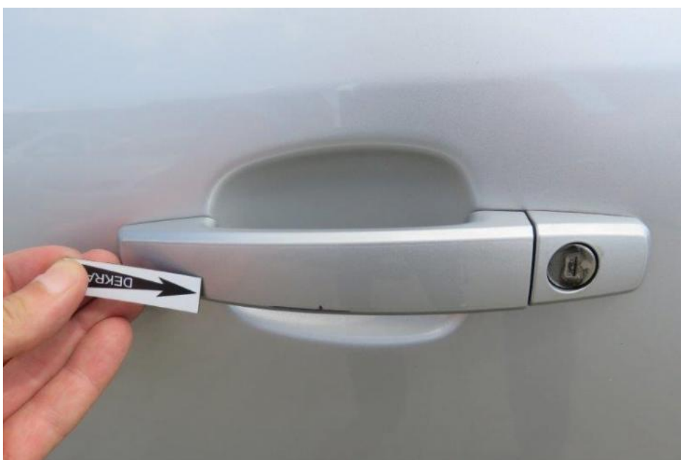
Fot. 42. drzwi PL