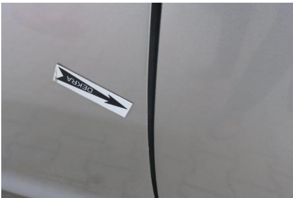
Fot. 41. drzwi PL