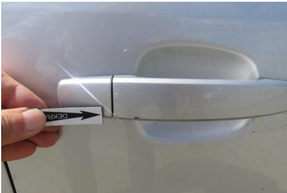
Fot. 47. drzwi PR