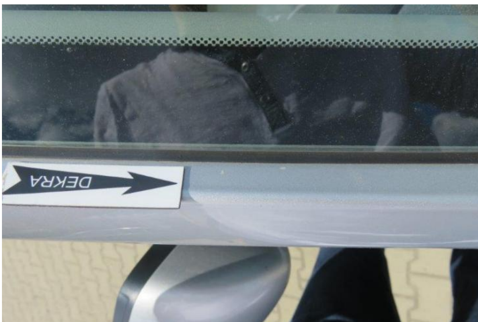
Fot. 50. słupek PR