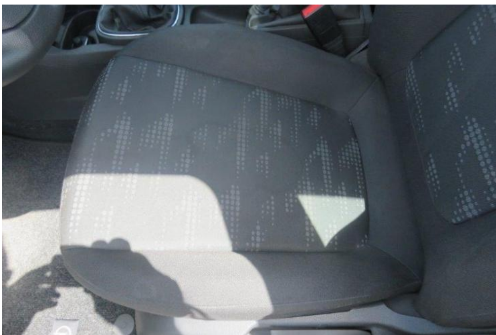
Fot. 30. fotel PL