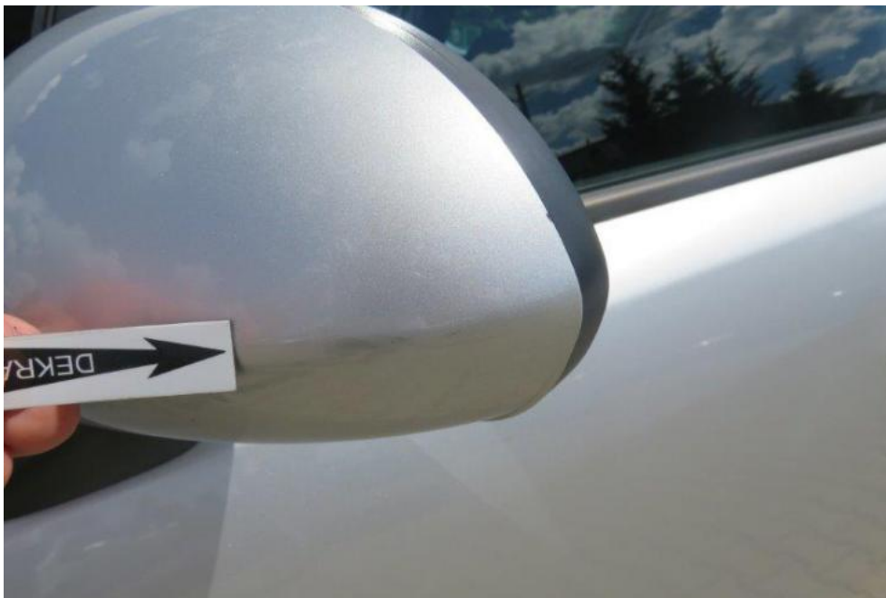
Fot. 39. lusterko zew. lewe