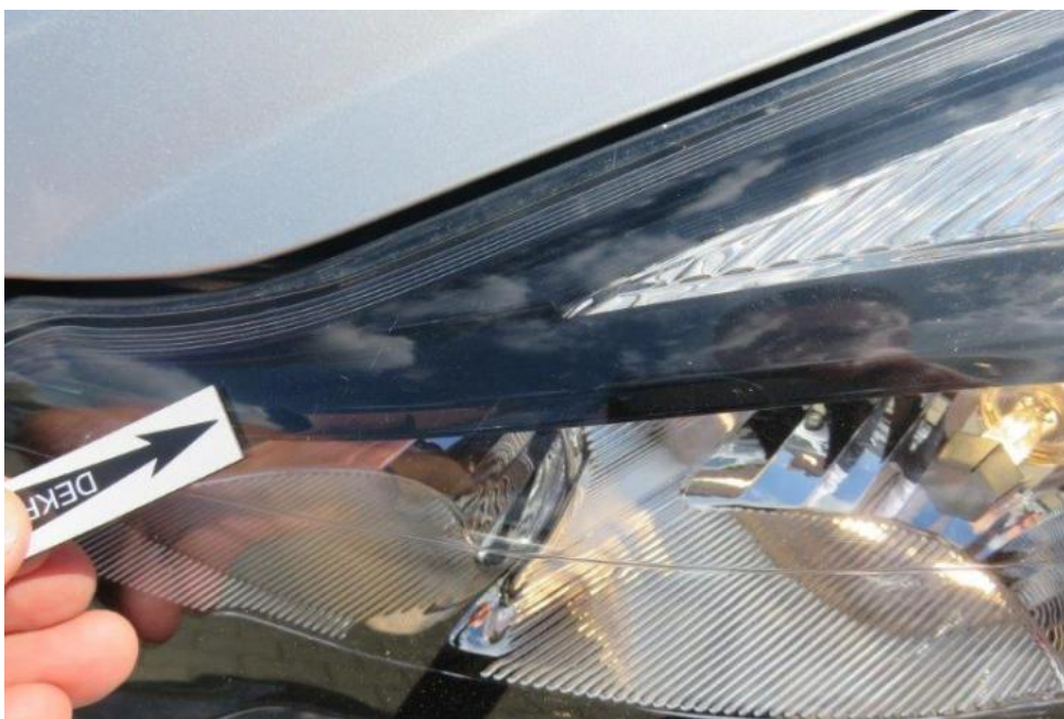
Fot. 33. reflektor lewy