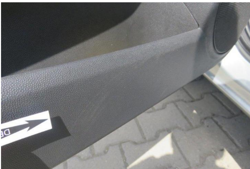
Fot. 28. drzwi PL