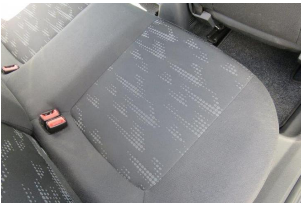
Fot. 20. kanapa tylna