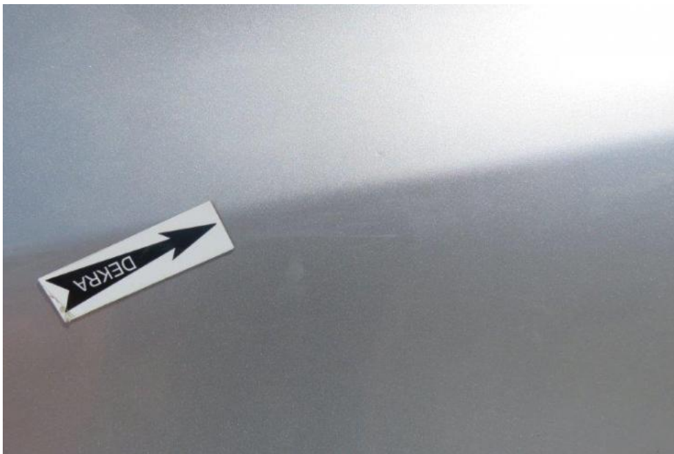
Fot. 37. błotnik PL