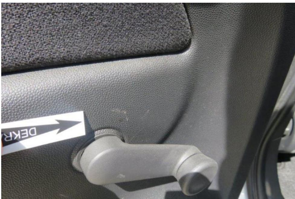
Fot. 26. drzwi TL