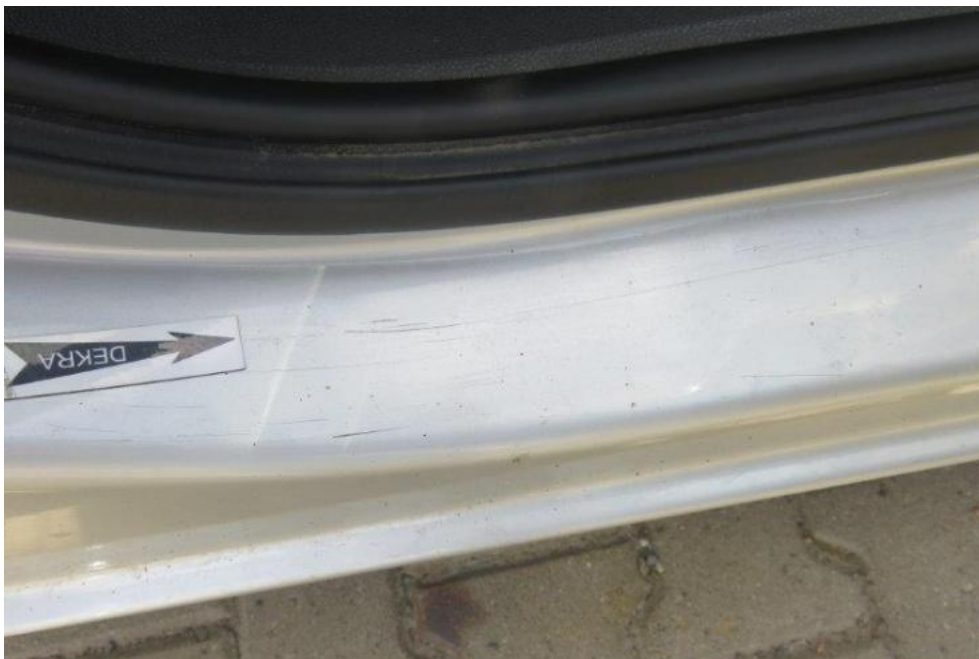
Fot. 17. próg prawy