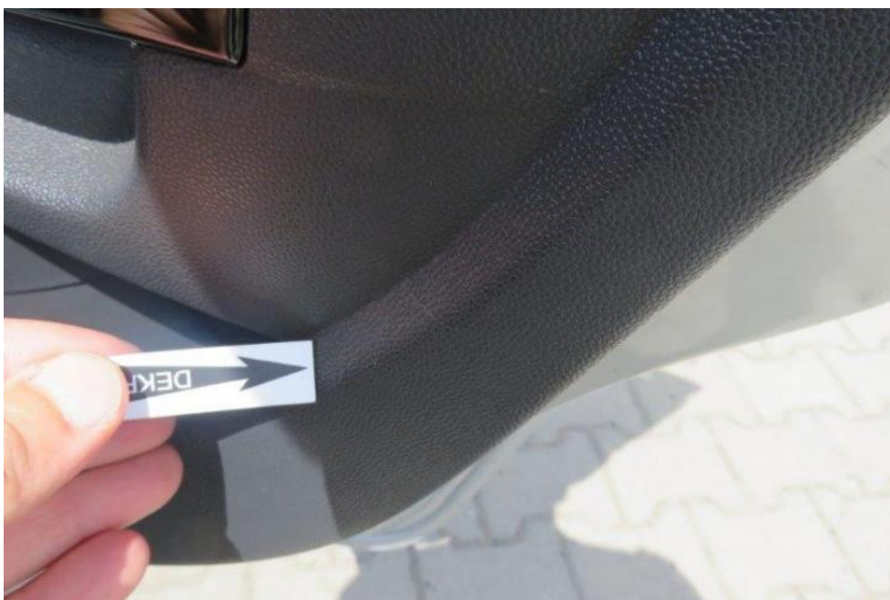
Fot. 22. drzwi TR