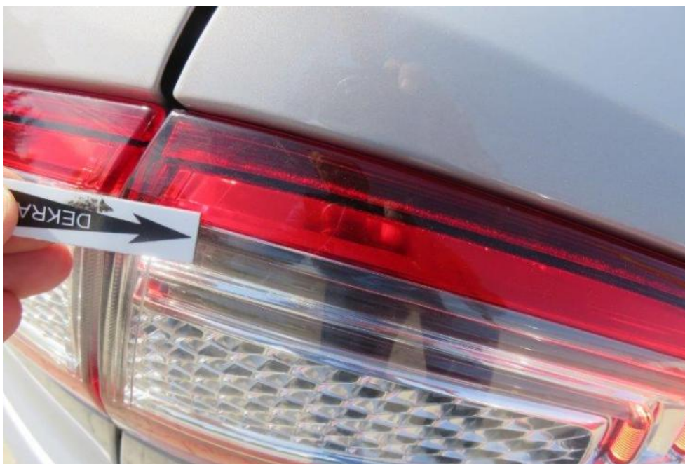
Fot. 41. lampa TR