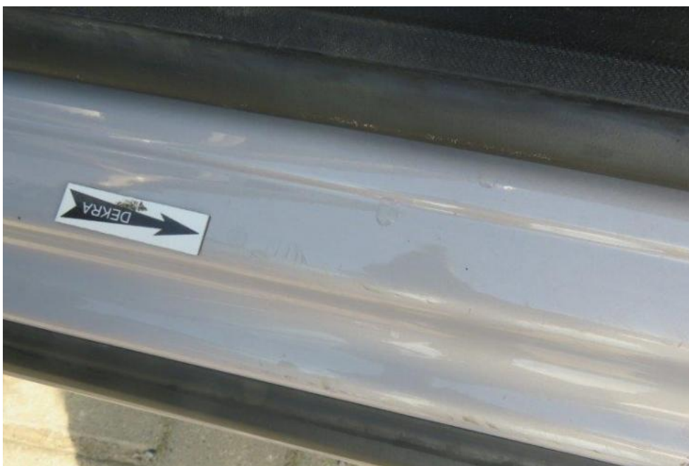
Fot. 23. próg lewy