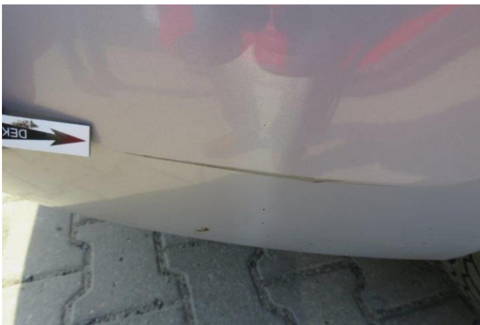
Fot. 42. zderzak tylny