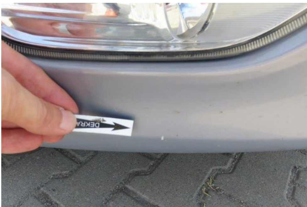
Fot. 26. zderzak przedni