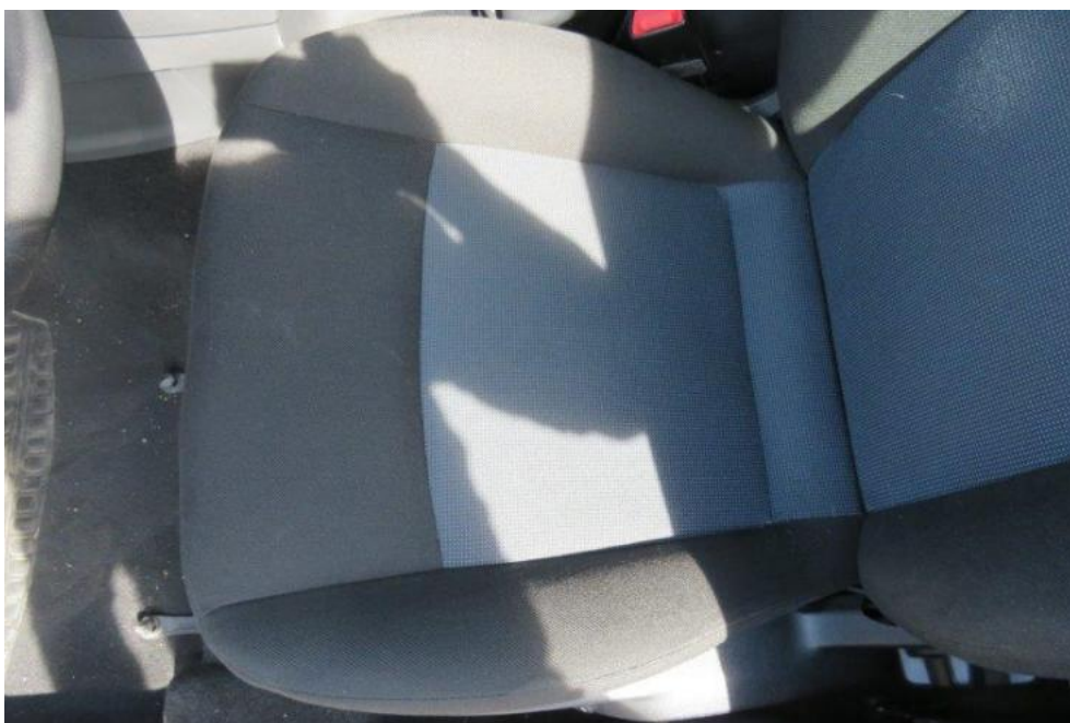
Fot. 22. fotel PL