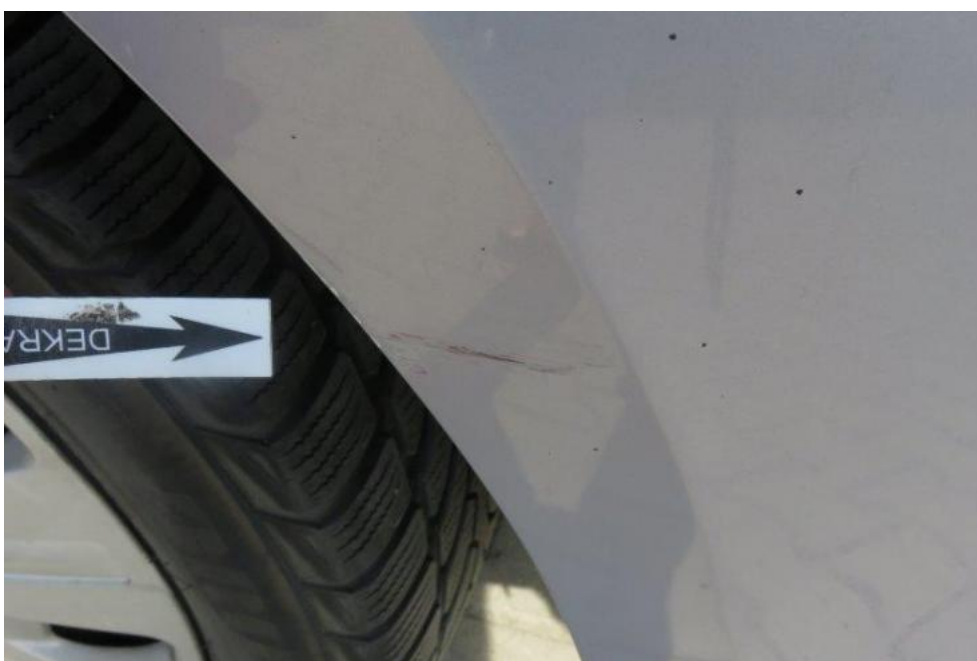
Fot. 38. zderzak tylny