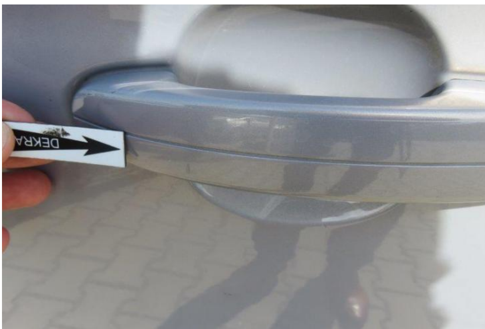
Fot. 31. drzwi PL