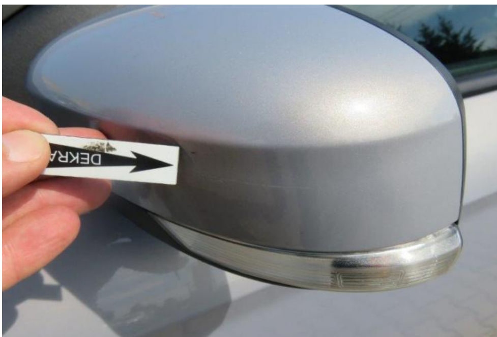
Fot. 29. lusterko zew. lewe