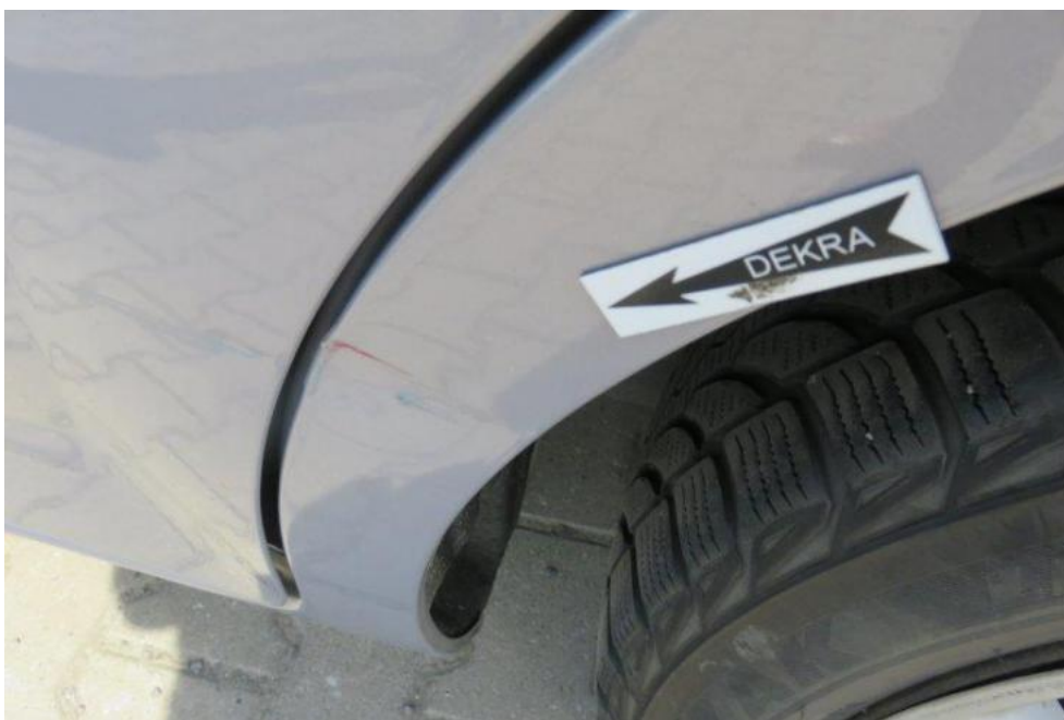
Fot. 36. błotnik TL