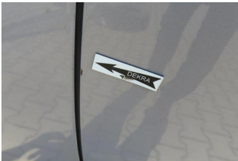
Fot. 33. drzwi TL