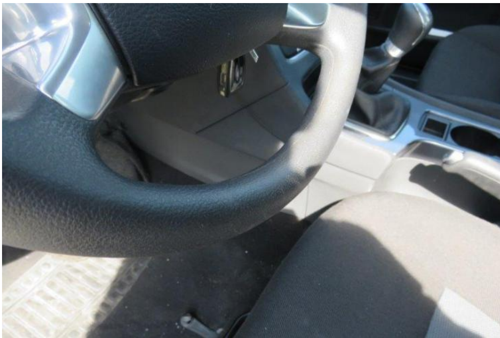
Fot. 21. koło kierownicy