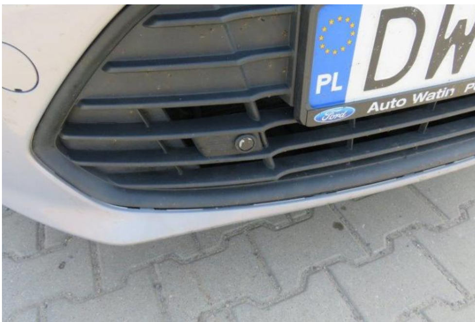
Fot. 25. krata wlotu powietrza w zderzaku