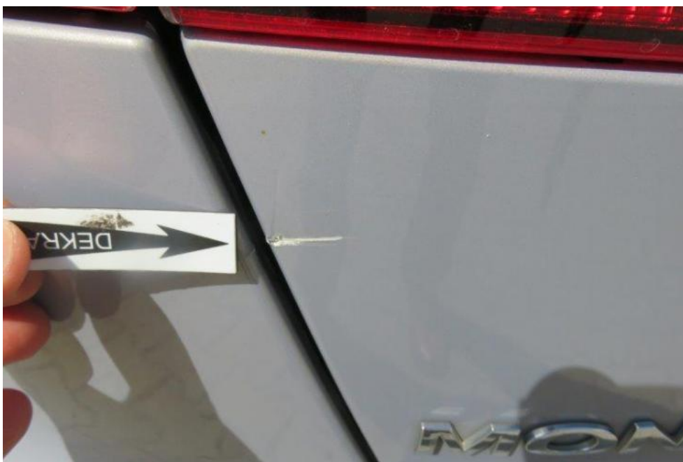
Fot. 39. pokrywa komory bagażnika