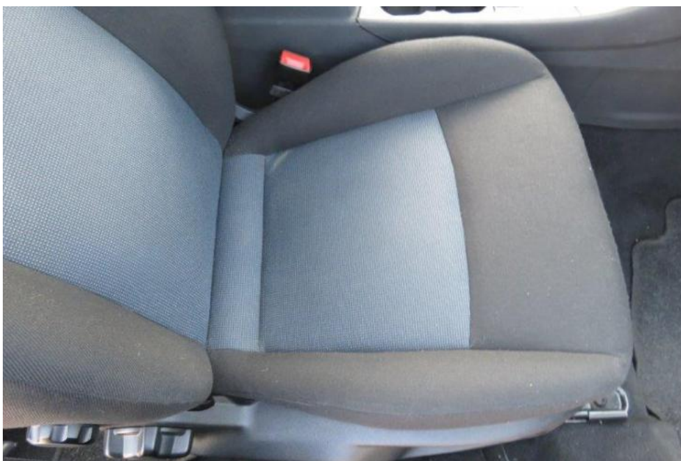
Fot. 18. fotel PR