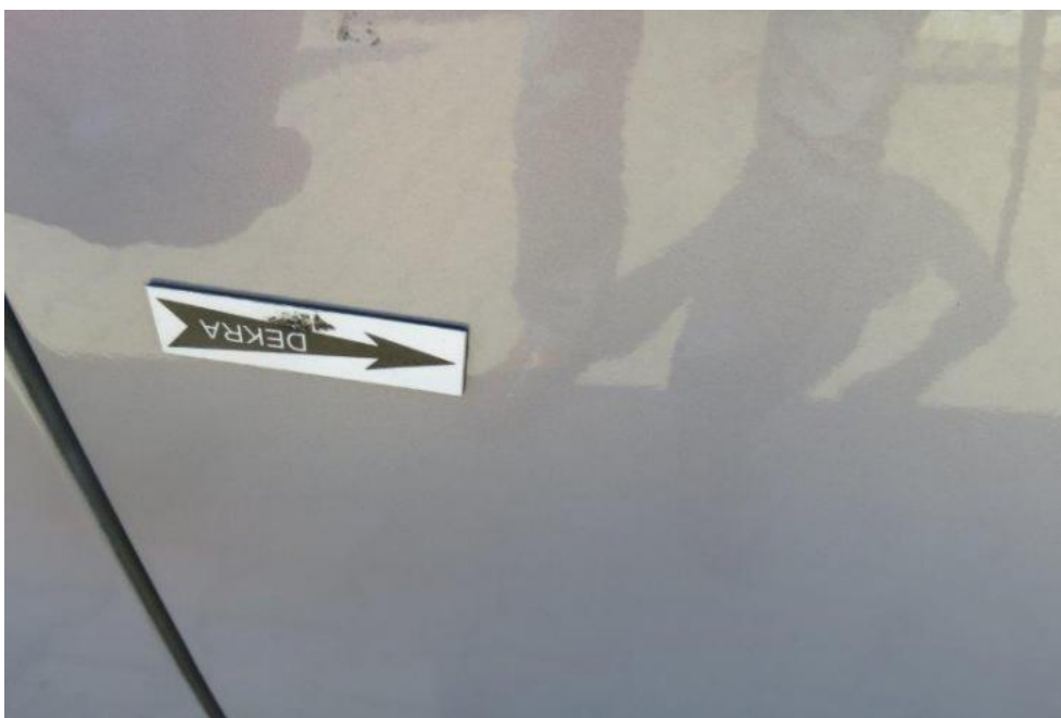
Fot. 48. drzwi PR