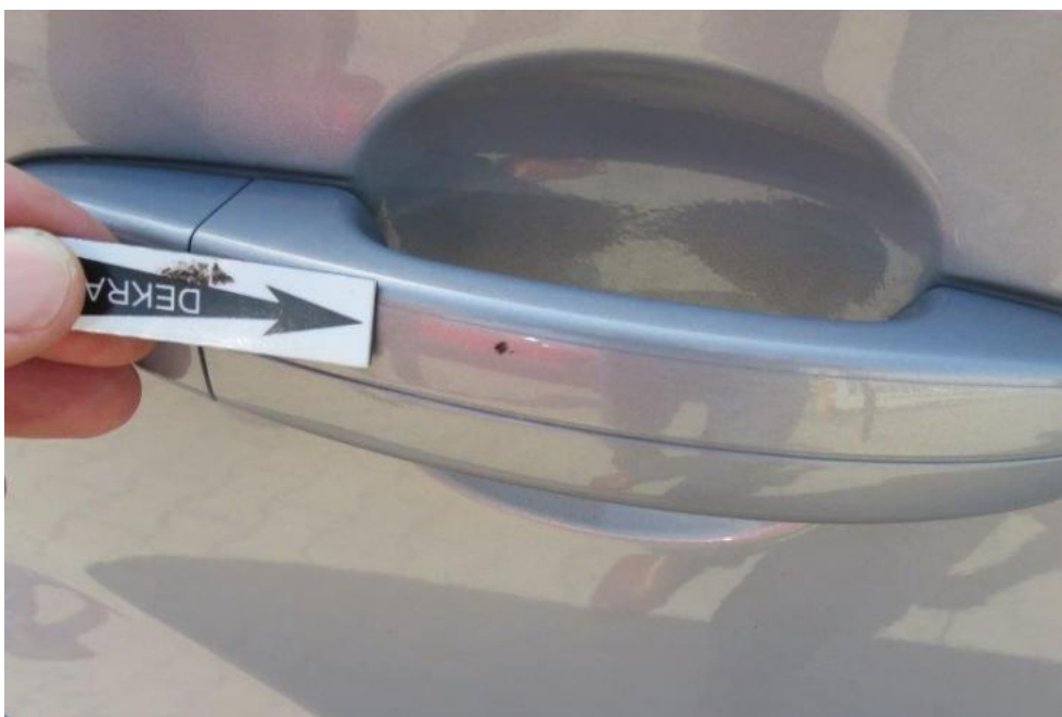
Fot. 46. drzwi TR