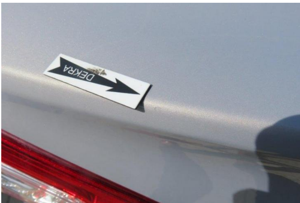
Fot. 40. pokrywa komory bagażnika