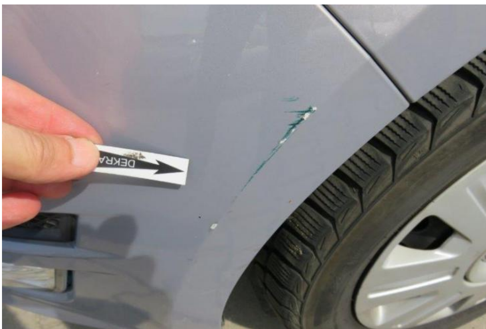
Fot. 27. zderzak przedni