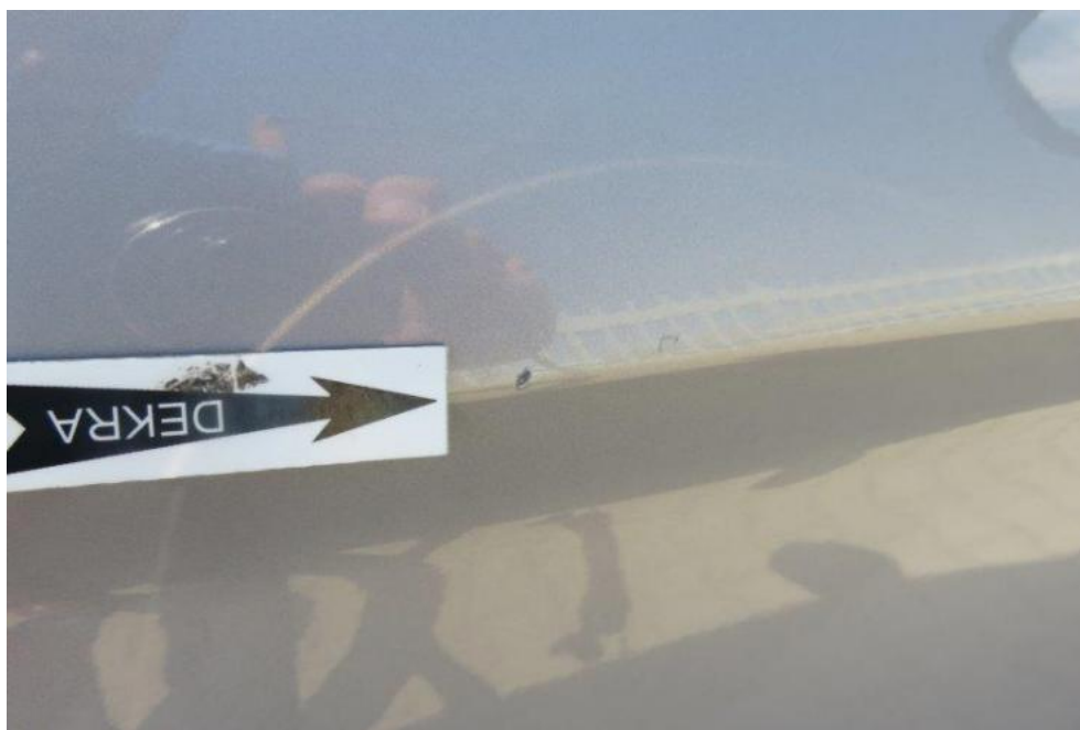
Fot. 49. drzwi PR