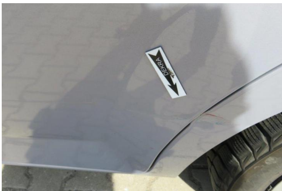
Fot. 34. drzwi TL