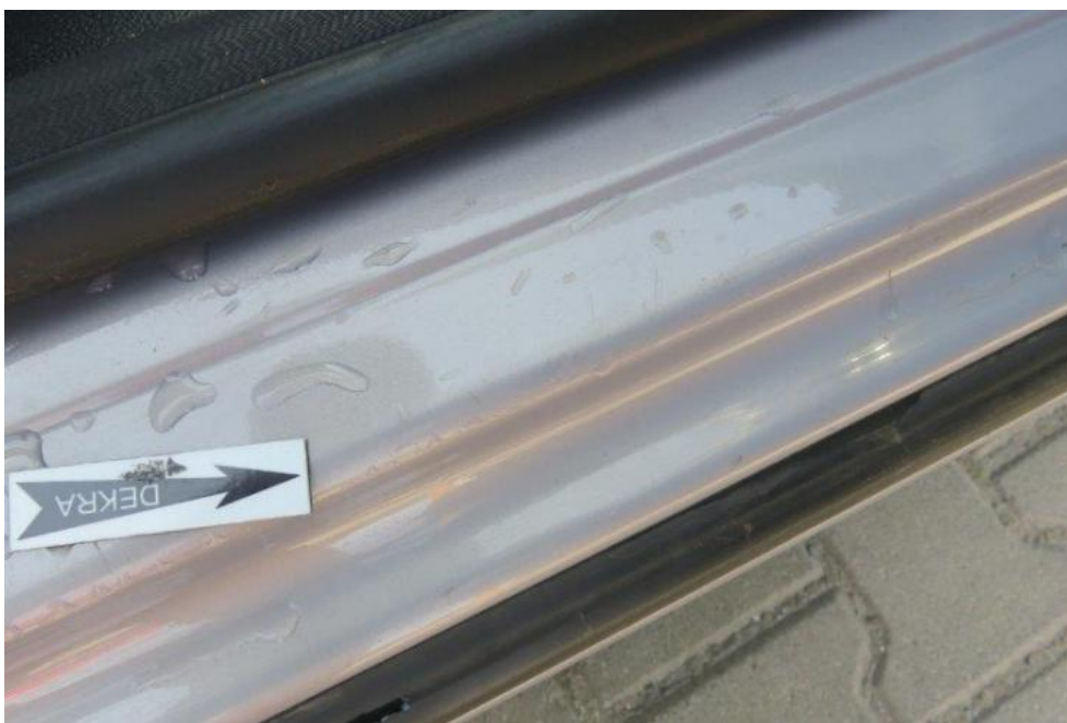
Fot. 19. próg prawy