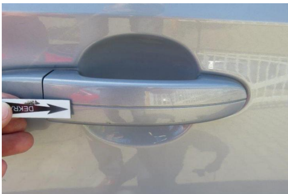
Fot. 50. drzwi PR