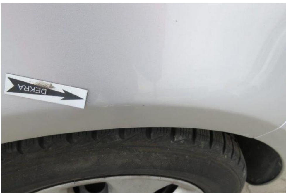
Fot. 64. błotnik PR