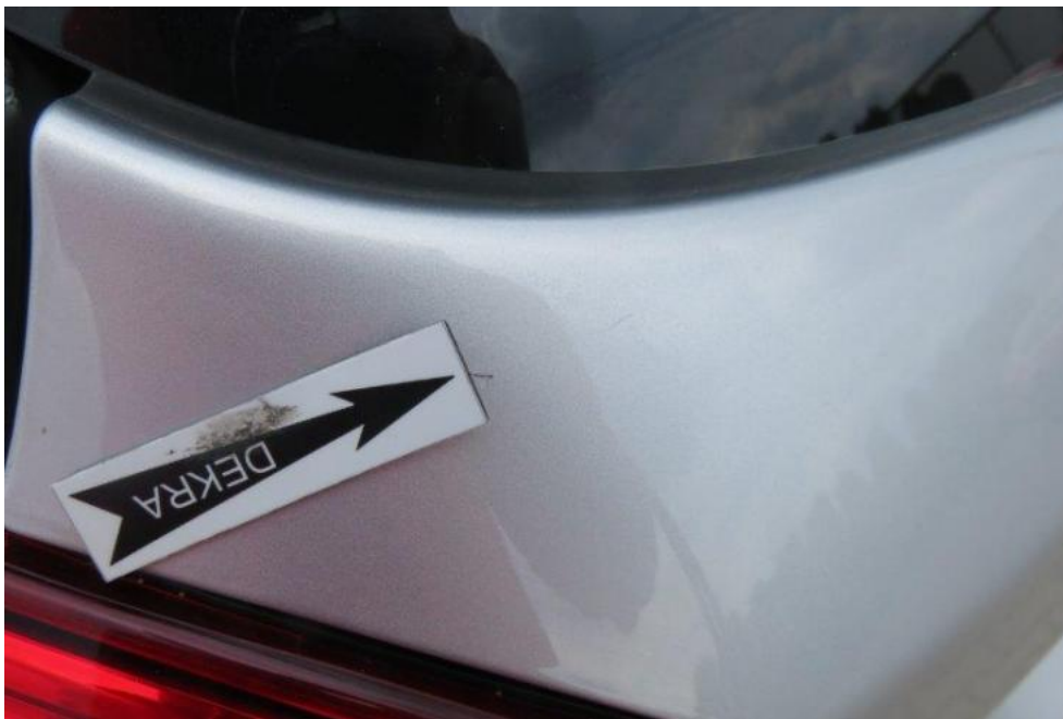
Fot. 51. pokrywa komory bagażnika