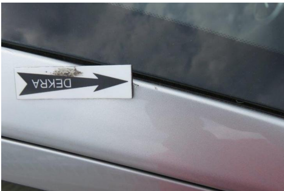
Fot. 62. słupek PR