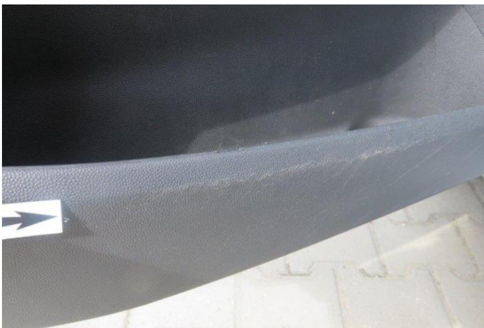
Fot. 25. drzwi PL