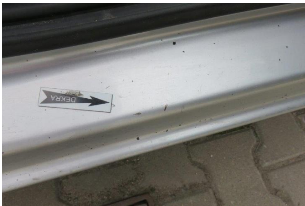
Fot. 17. próg prawy