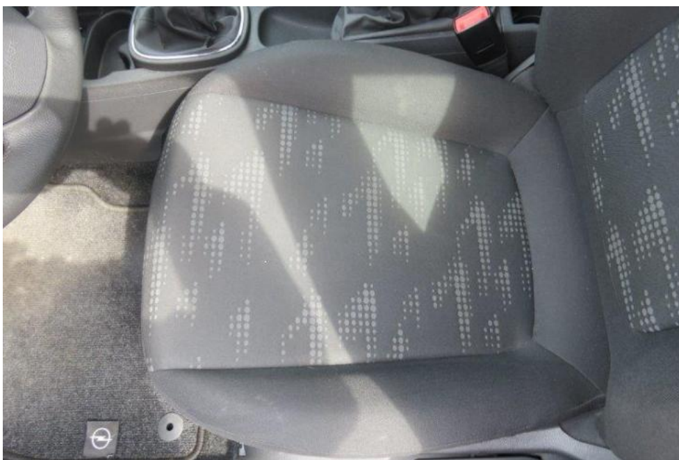
Fot. 29. fotel PL