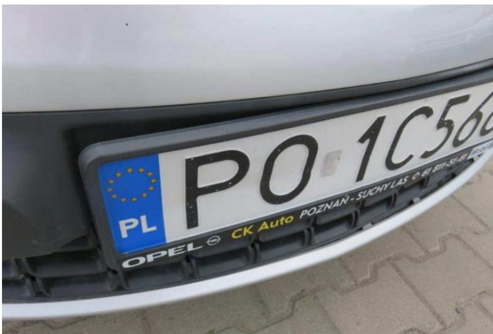
Fot. 65. tablica rej. przednia