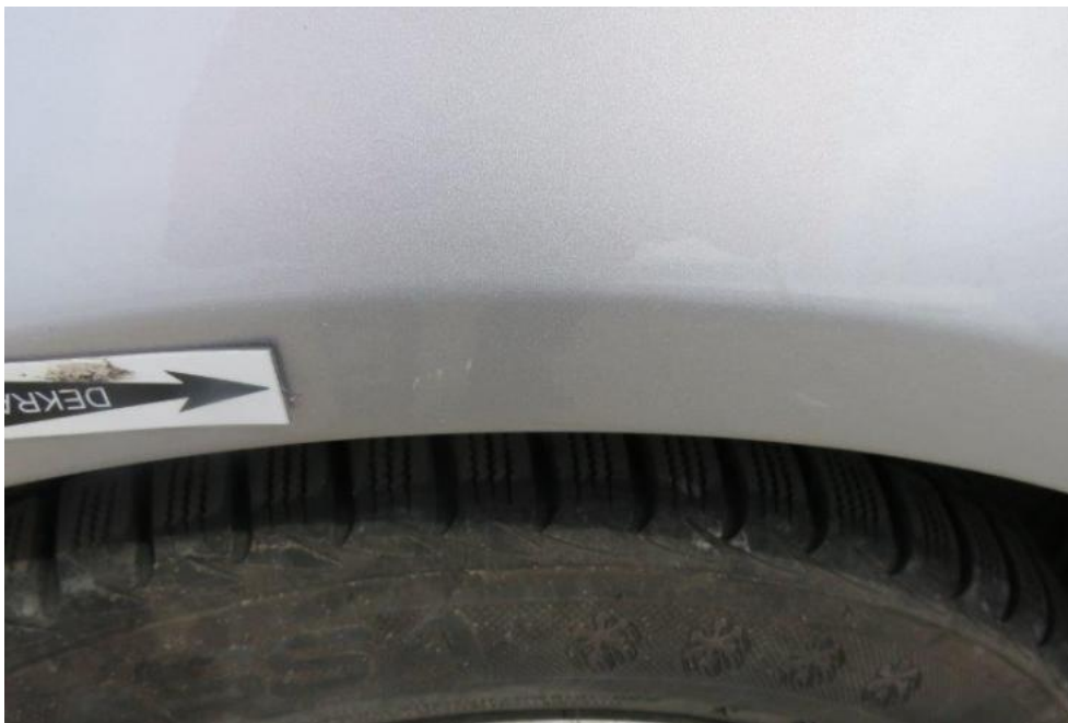
Fot. 37. błotnik PL