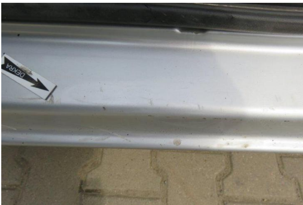
Fot. 27. próg lewy