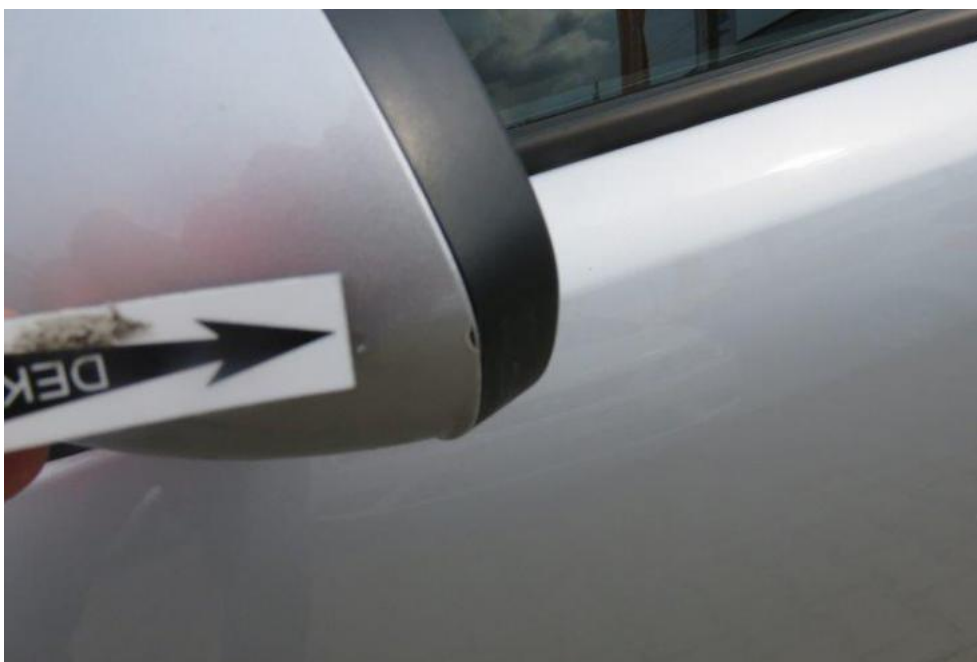
Fot. 39. lusterko zew. lewe