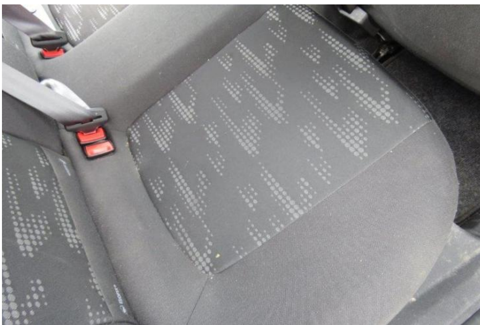
Fot. 21. kanapa tylna