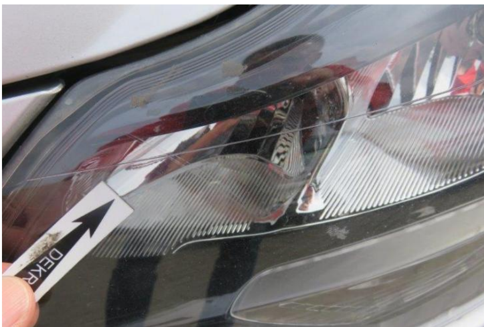
Fot. 34. reflektor lewy