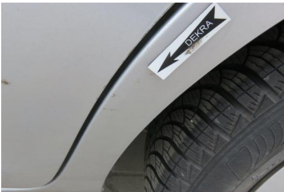
Fot. 48. błotnik TL