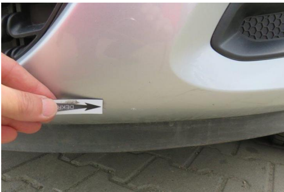
Fot. 33. zderzak przedni