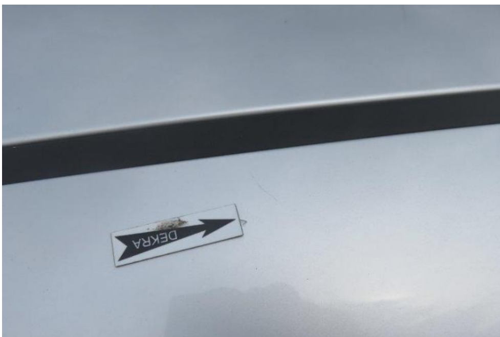
Fot. 46. rama lewa dachu