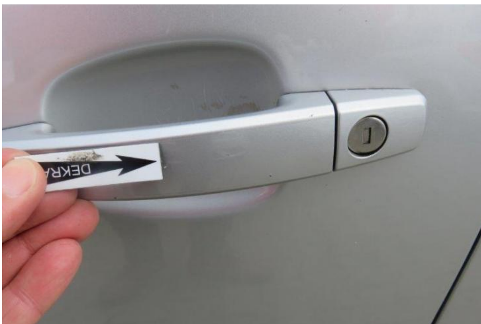
Fot. 42. drzwi PL