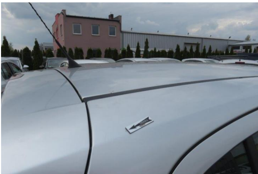
Fot. 54. rama prawa dachu