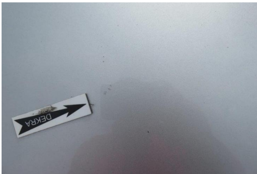
Fot. 35. pokrywa komory silnika