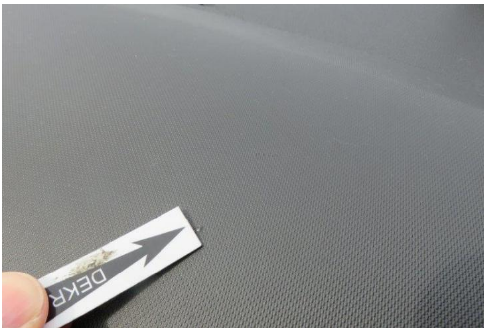
Fot. 19. deska rozdzielcza