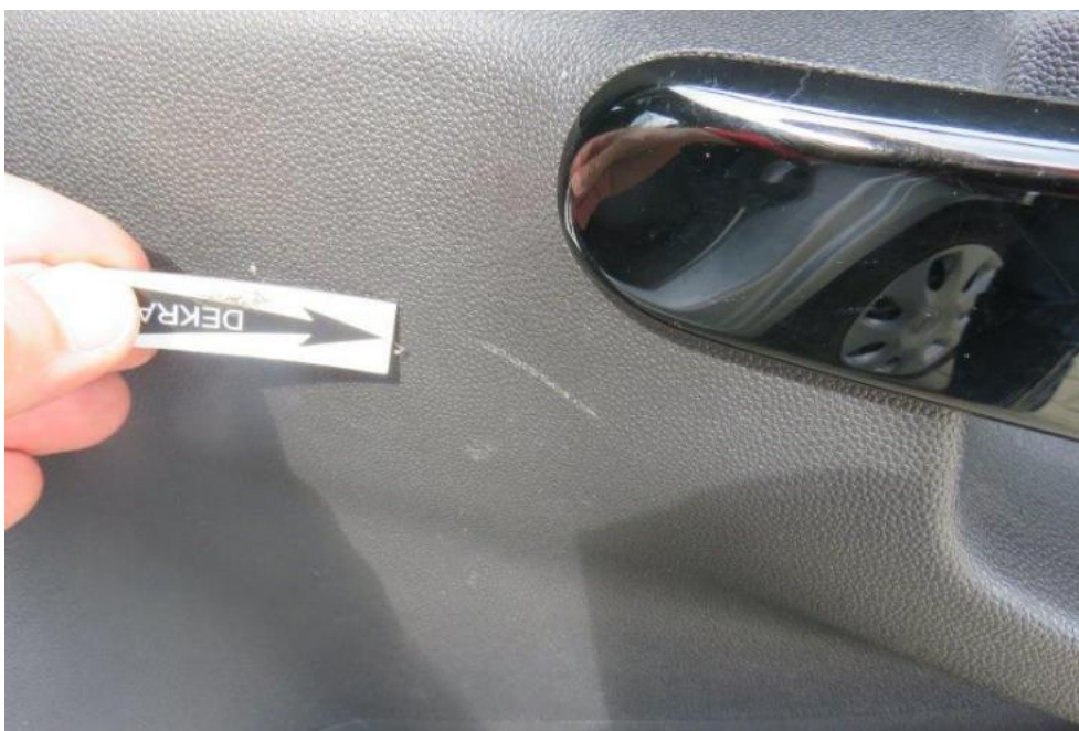
Fot. 23. drzwi TR