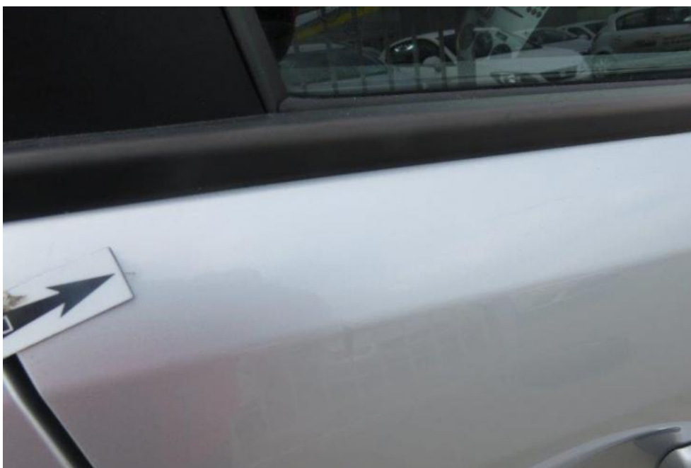
Fot. 60. drzwi PR