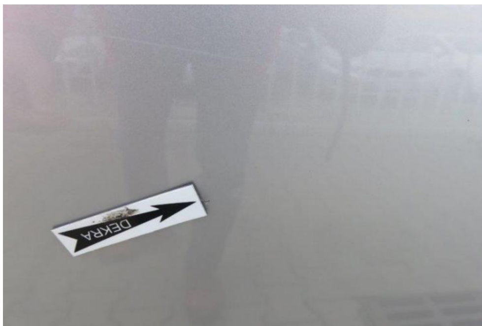
Fot. 57. drzwi TR