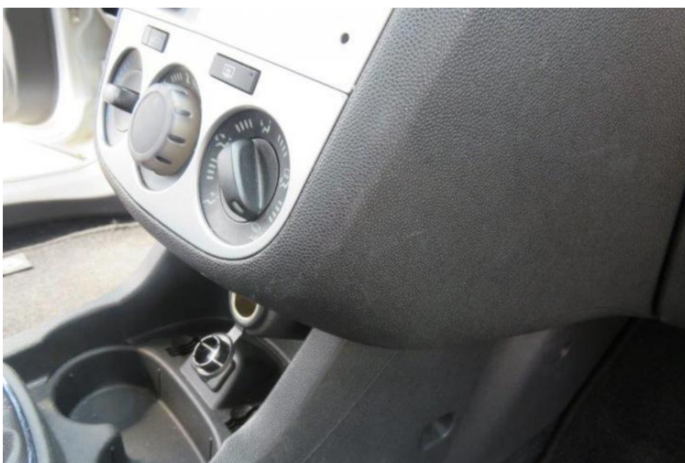
Fot. 20. konsola środkowa