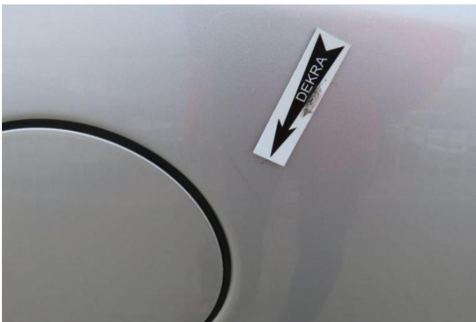
Fot. 53. błotnik TR