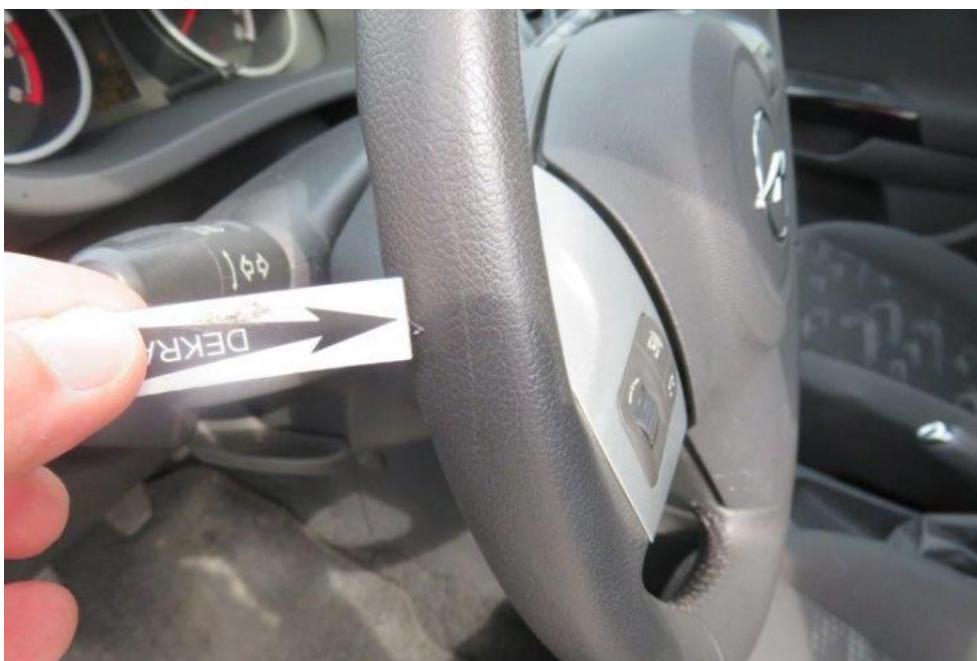
Fot. 30. koło kierownicy