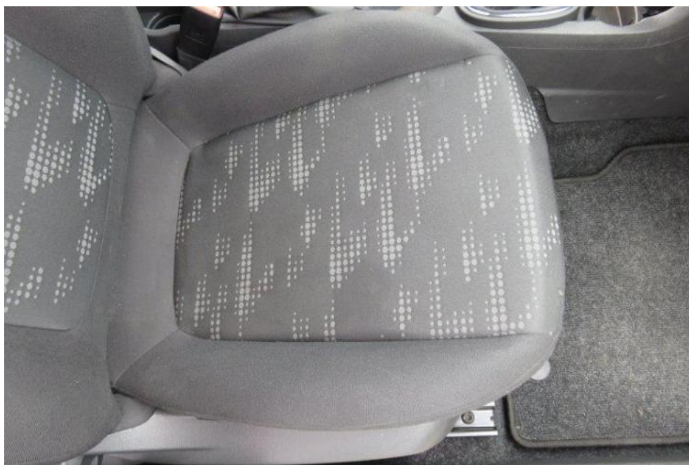
Fot. 18. fotel PR