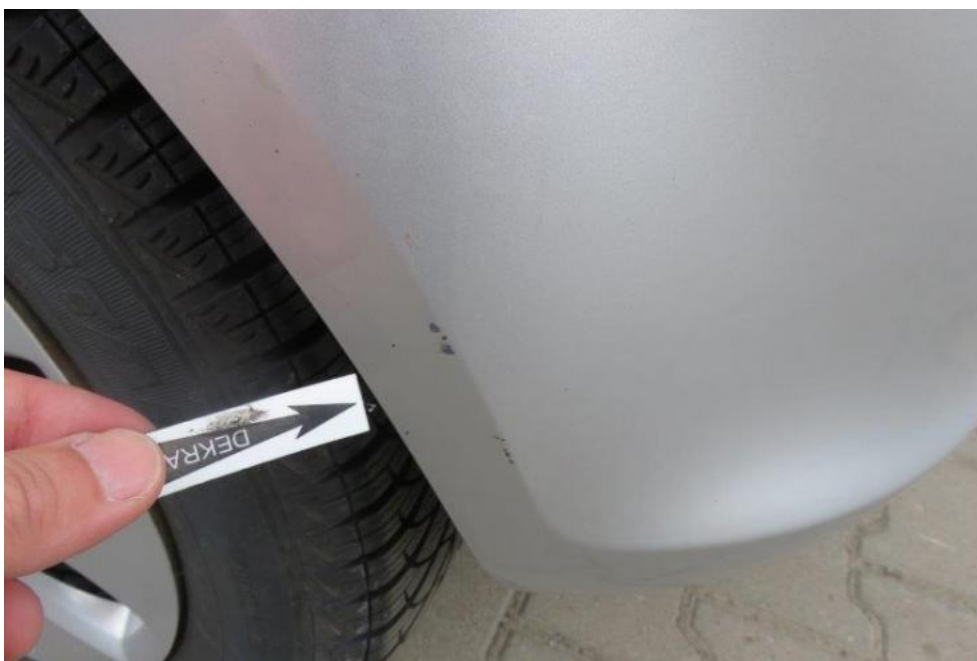
Fot. 50. zderzak tylny