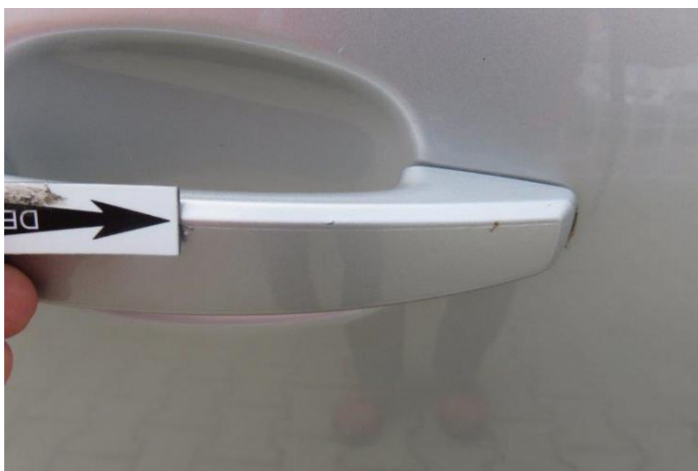
Fot. 58. drzwi TR