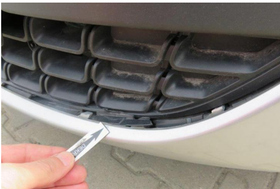
Fot. 32. zderzak przedni