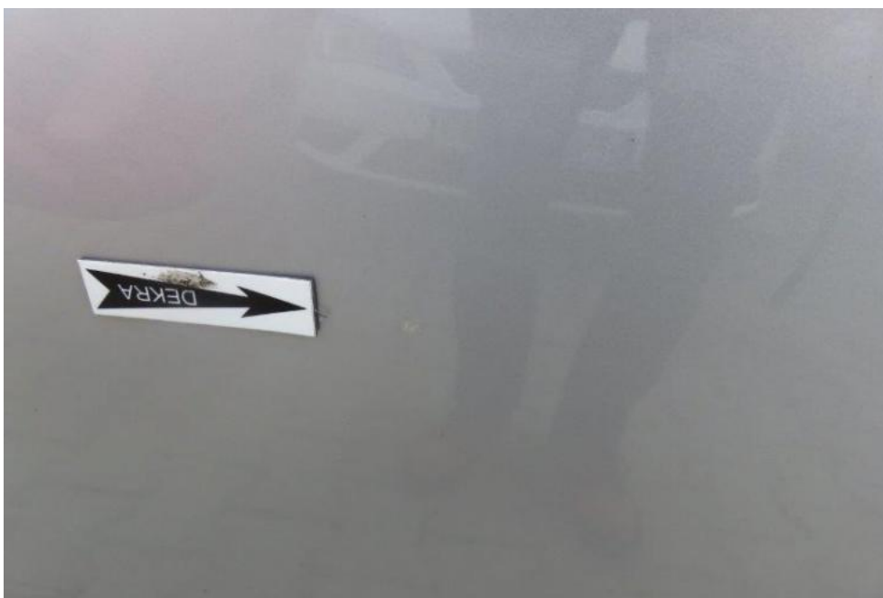
Fot. 41. drzwi PL