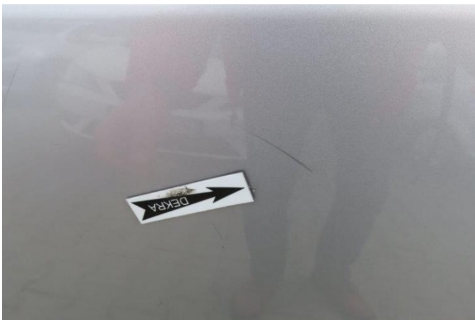
Fot. 44. drzwi TL