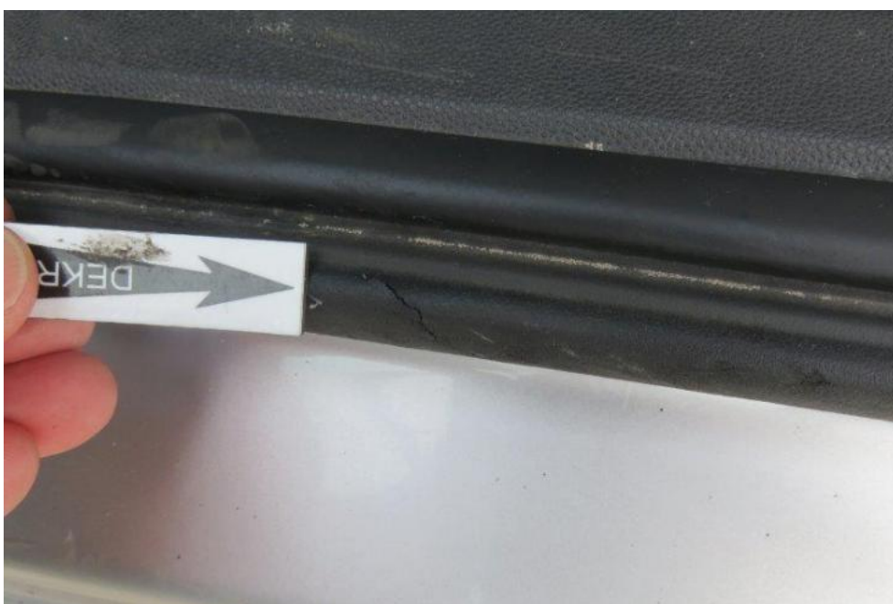
Fot. 28. próg lewy