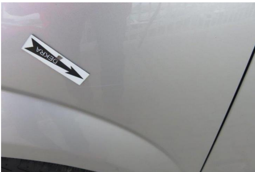
Fot. 28. błotnik PL