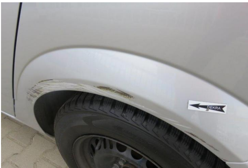
Fot. 42. błotnik TL