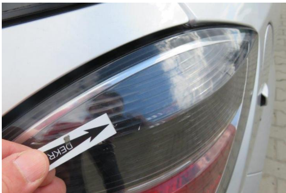
Fot. 46. lampa TR