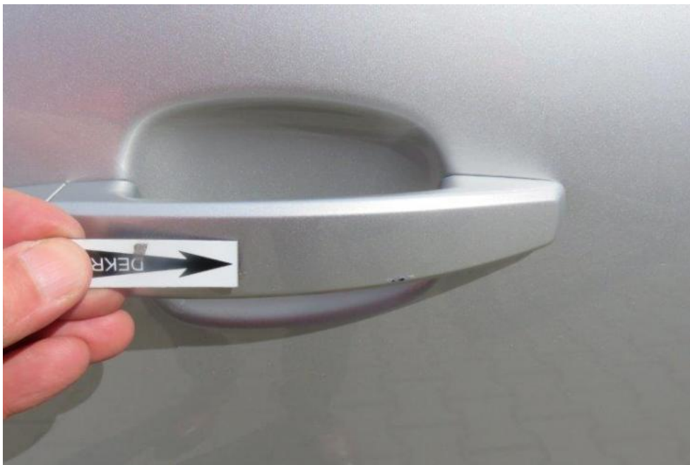
Fot. 55. drzwi PR