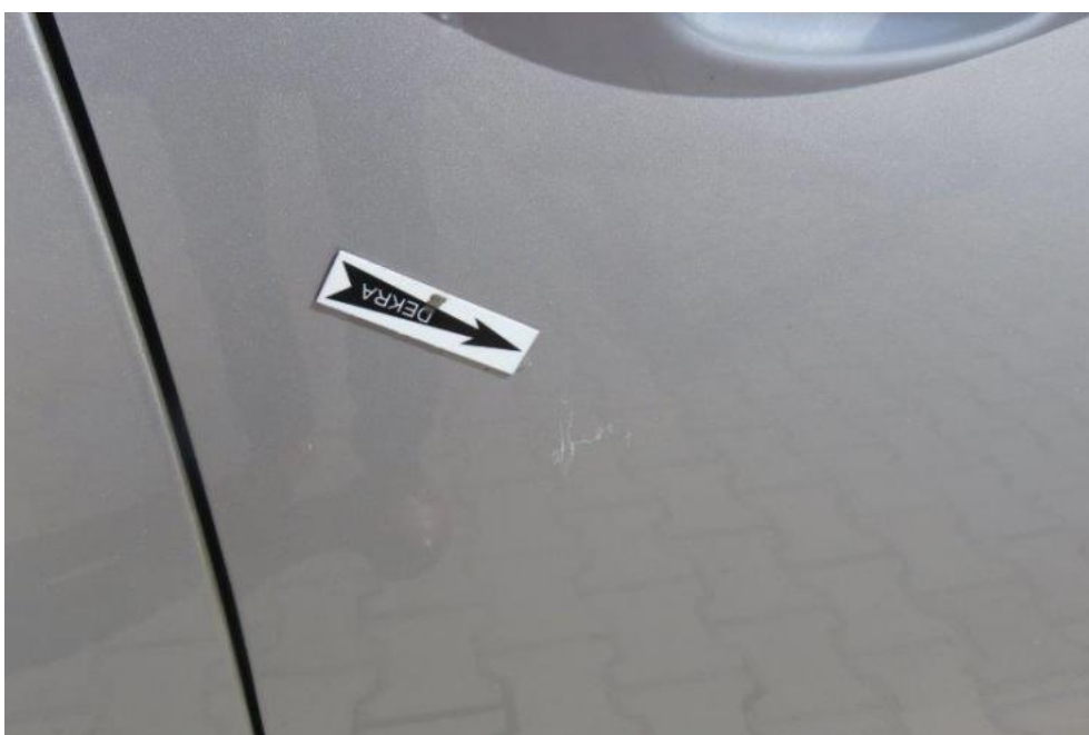
Fot. 54. drzwi PR