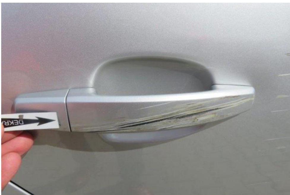
Fot. 52. drzwi TR