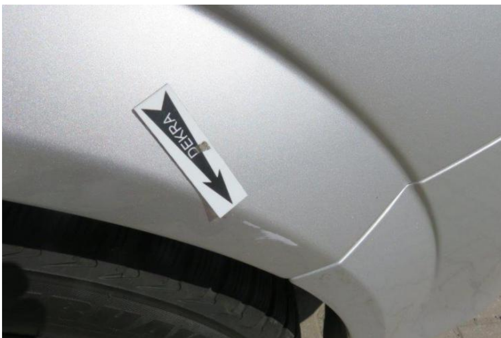
Fot. 60. błotnik PR