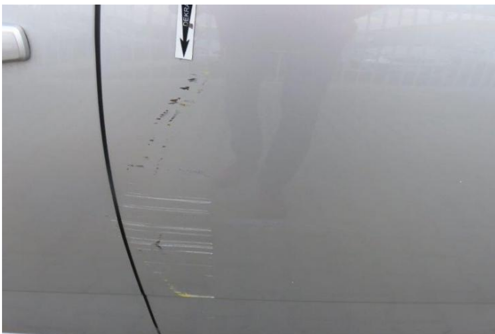
Fot. 36. drzwi TL