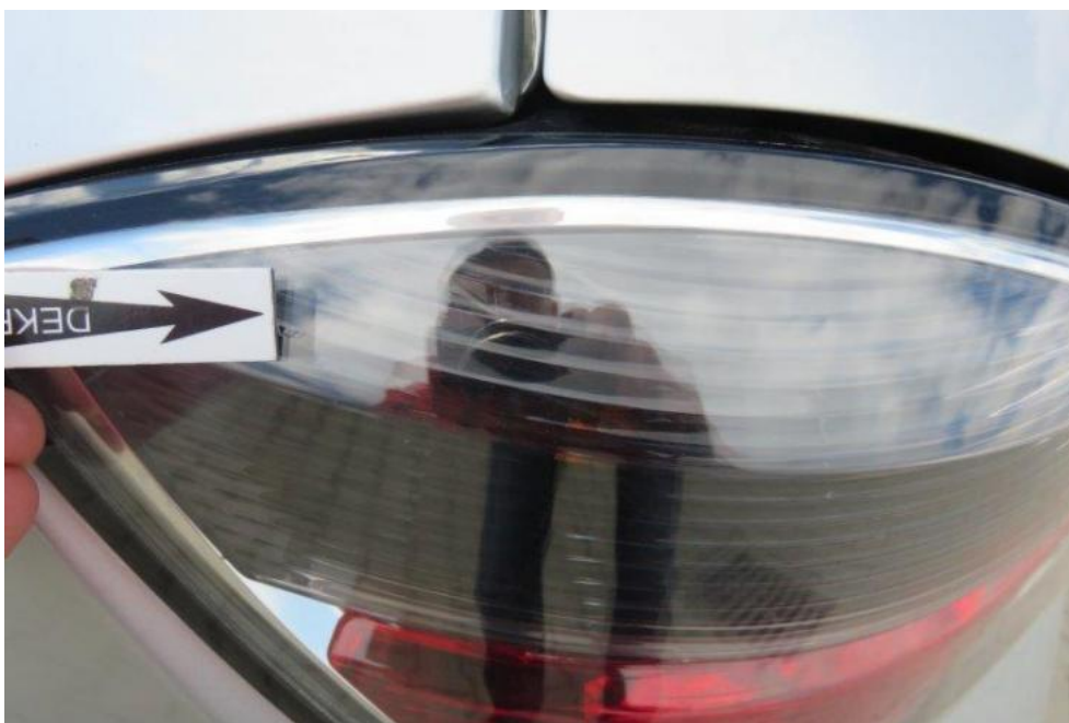
Fot. 44. lampa TL