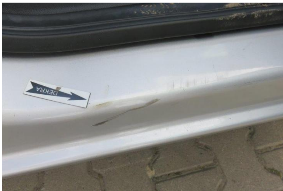
Fot. 17. próg prawy