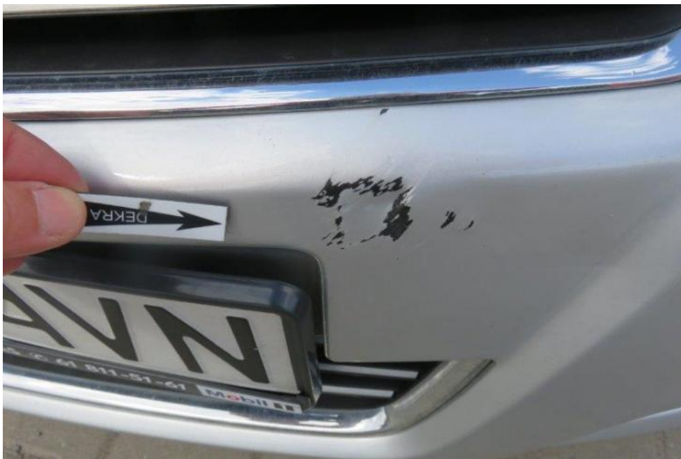
Fot. 25. zderzak przedni