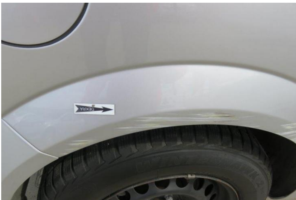
Fot. 48. błotnik TR