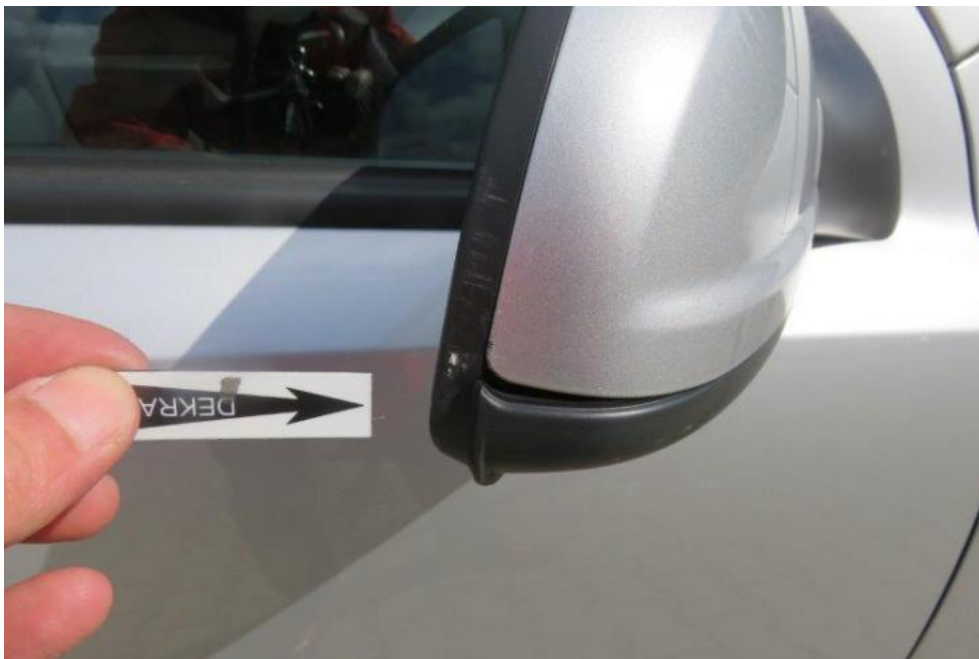
Fot. 57. lusterko zew. prawe