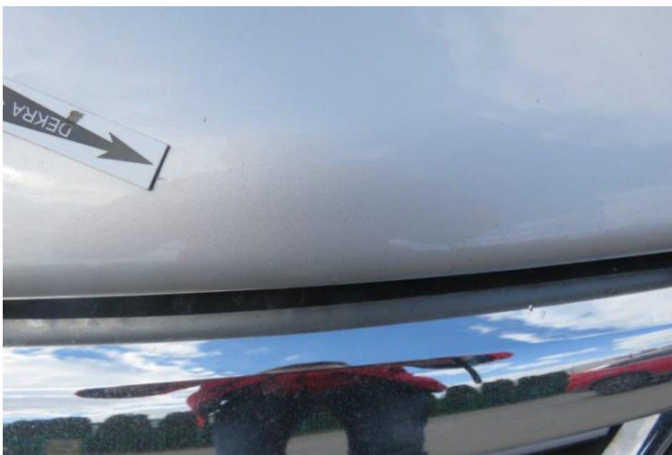
Fot. 26. pokrywa komory silnika