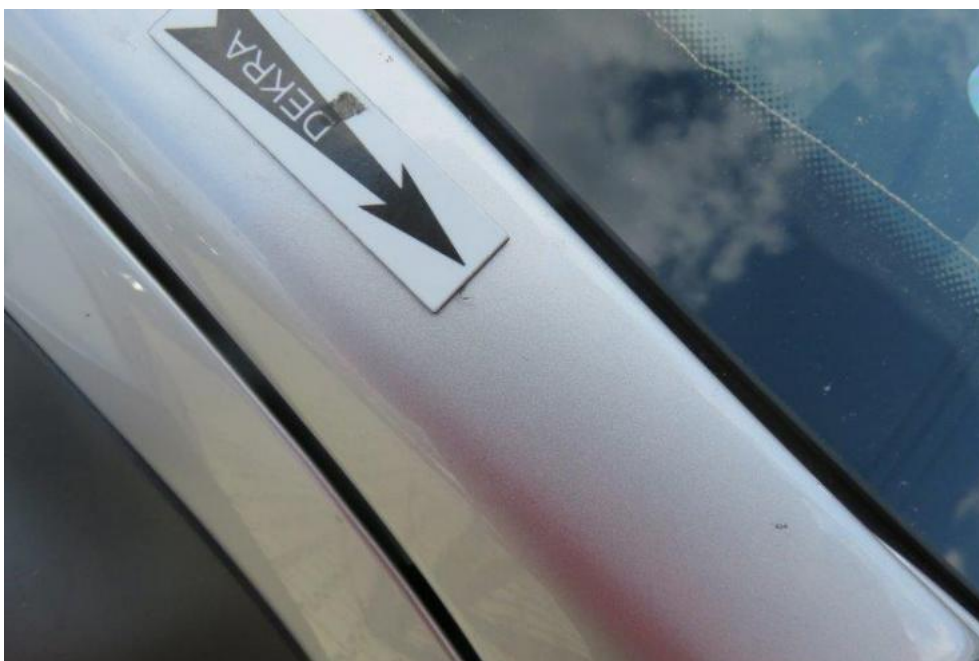
Fot. 58. słupek PR