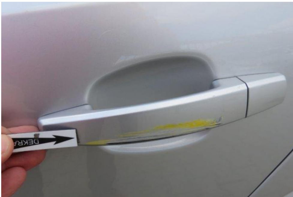
Fot. 37. drzwi TL