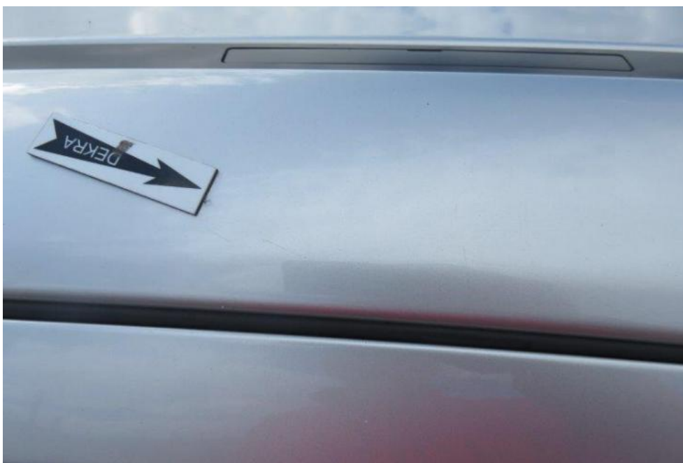
Fot. 39. rama lewa dachu