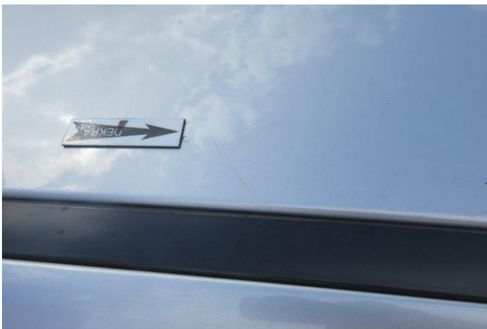
Fot. 40. dach