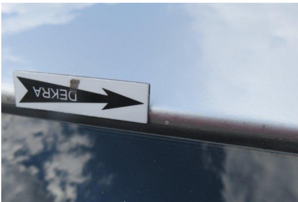
Fot. 31. dach