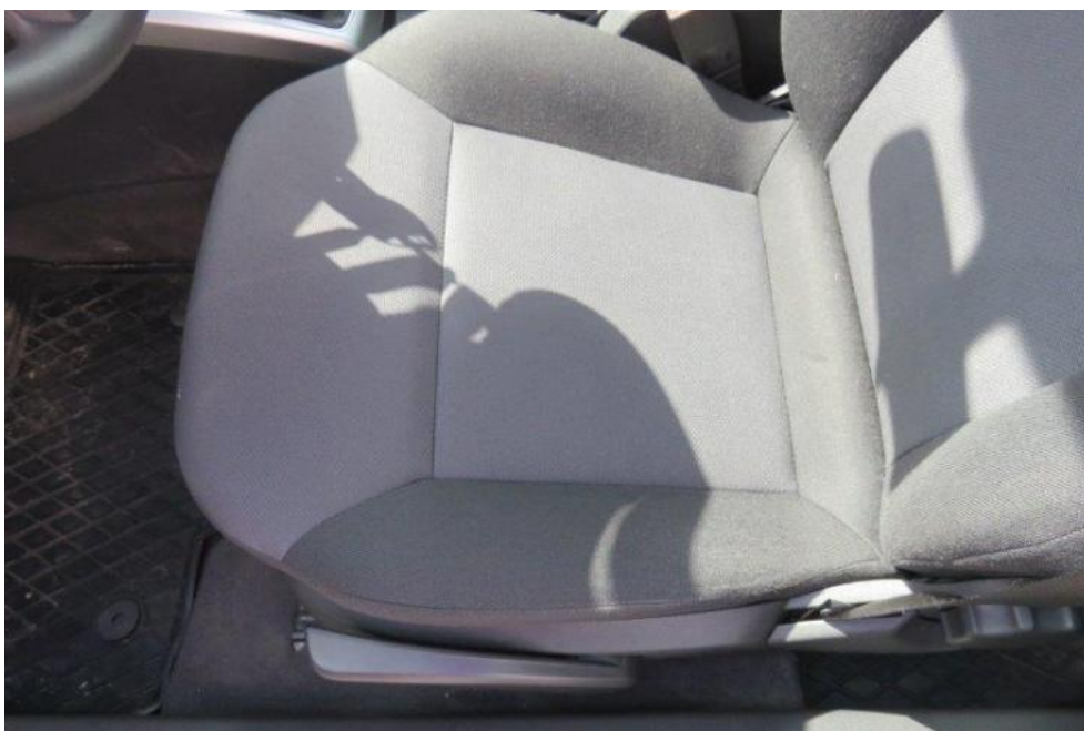
Fot. 22. fotel PL