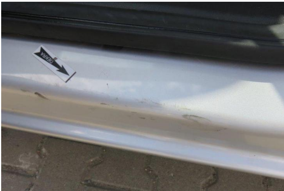
Fot. 21. próg lewy