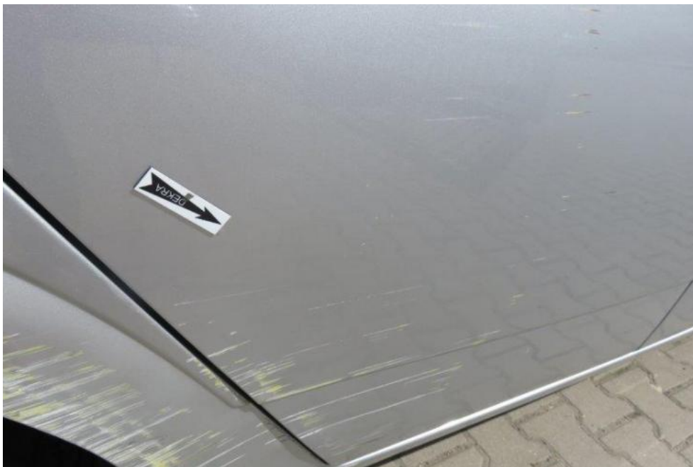
Fot. 51. drzwi TR