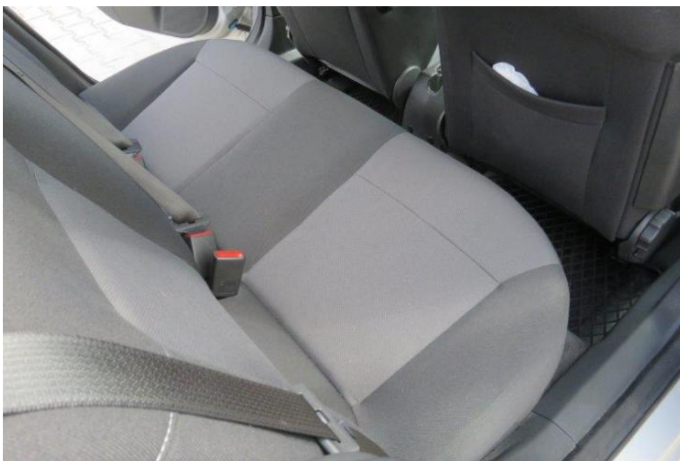
Fot. 19. kanapa tylna