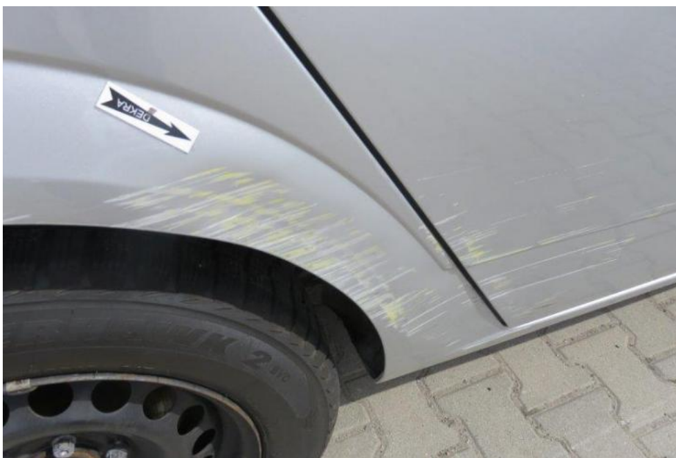
Fot. 49. błotnik TR