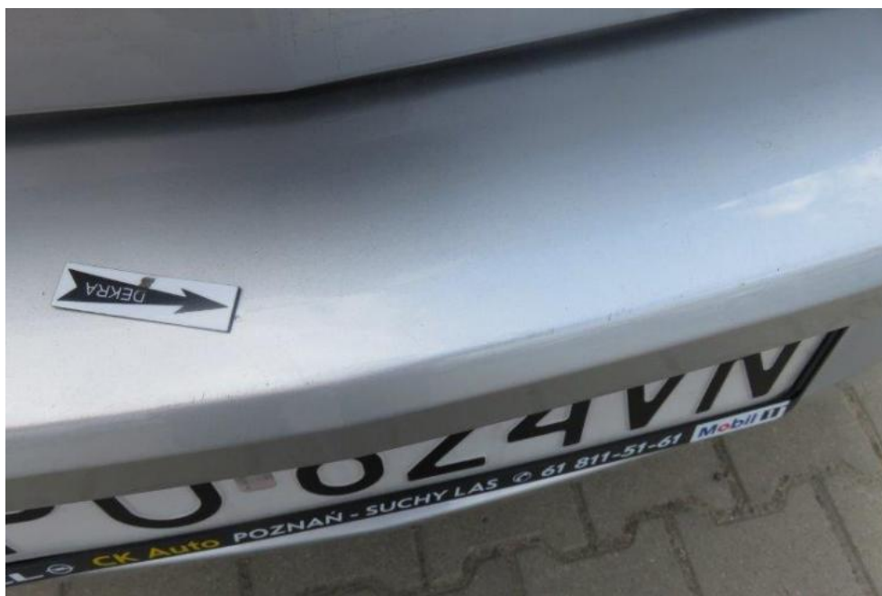
Fot. 45. zderzak tylny