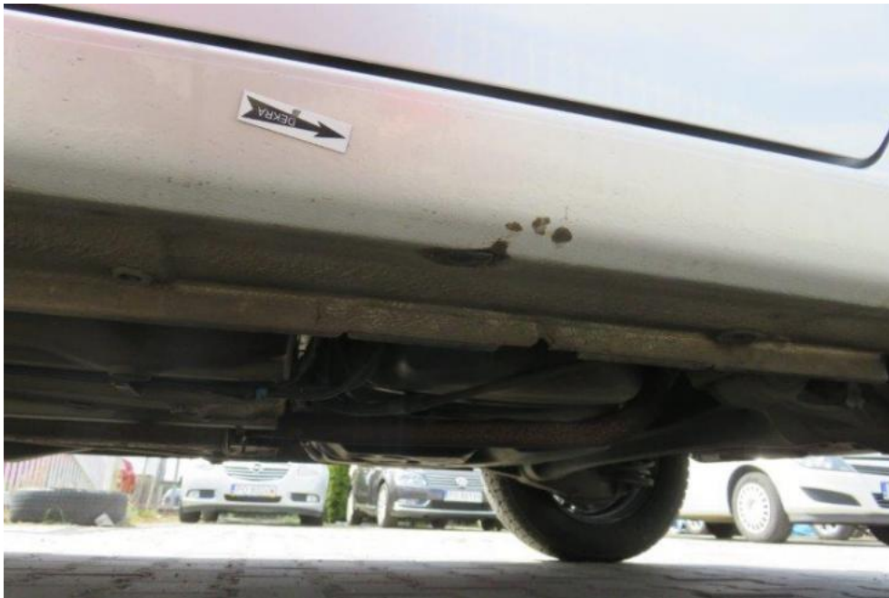
Fot. 61. próg prawy