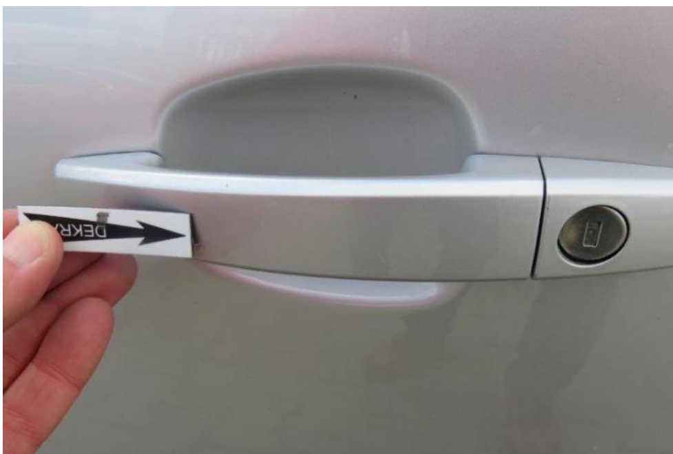
Fot. 34. drzwi PL