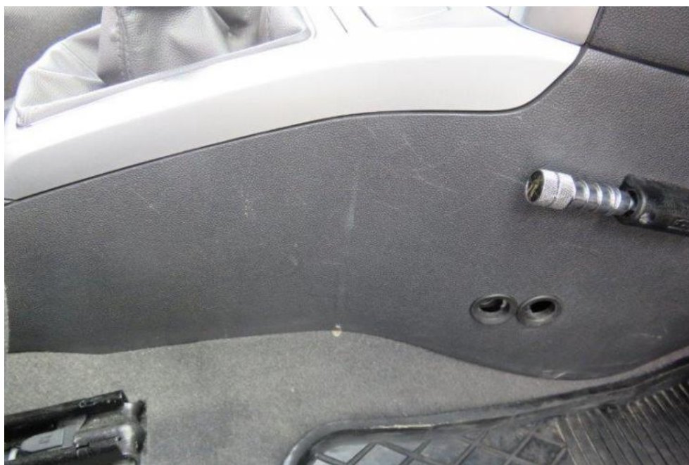
Fot. 18. konsola środkowa