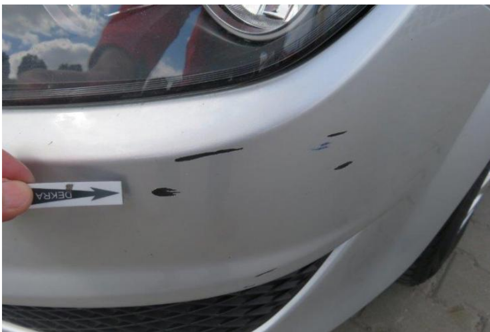
Fot. 24. zderzak przedni