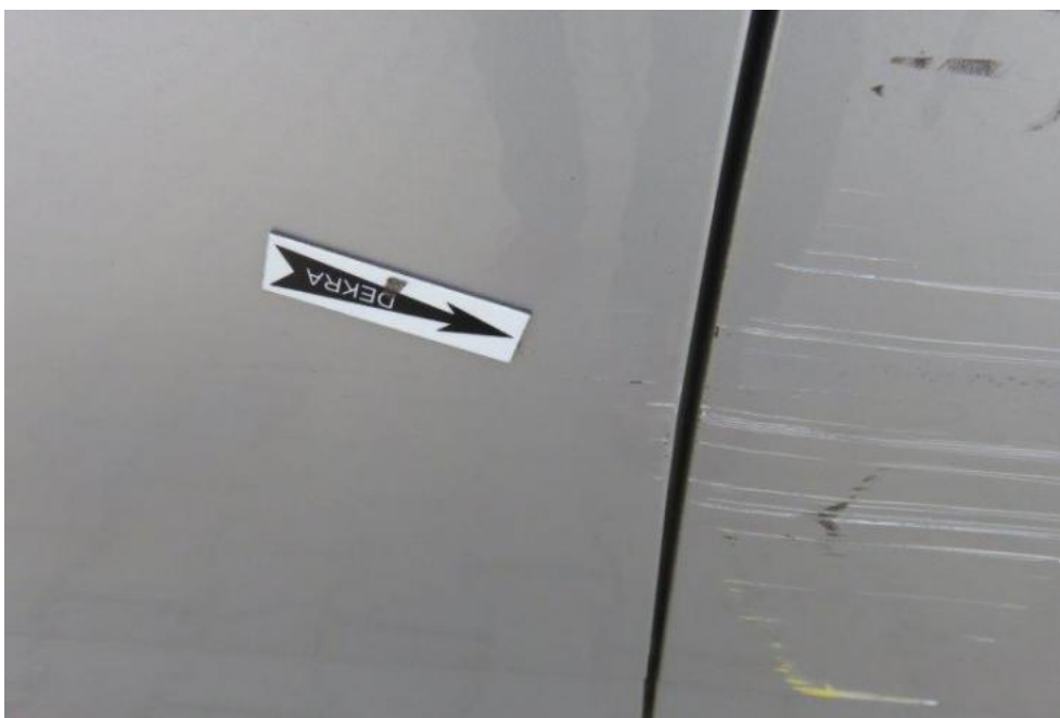
Fot. 33. drzwi PL