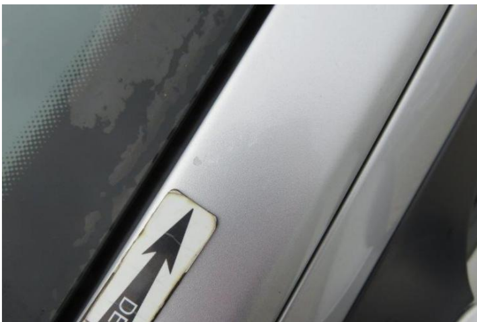
Fot. 34. słupek PL