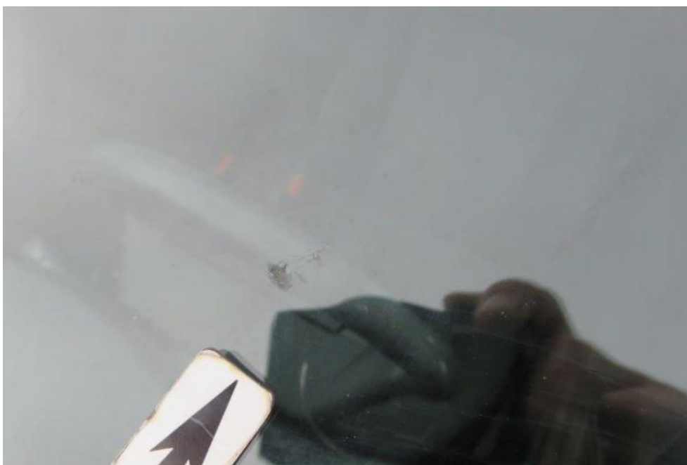
Fot. 35. szyba czołowa