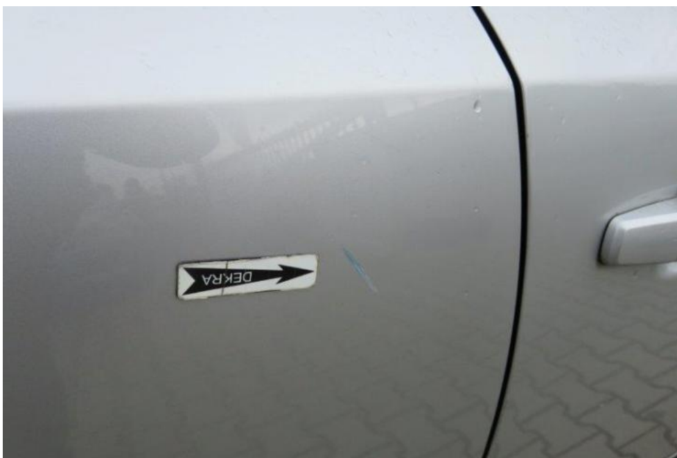
Fot. 49. drzwi TR