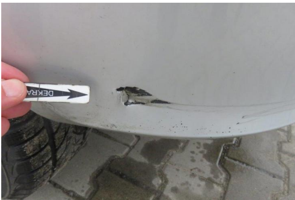
Fot. 45. zderzak tylny