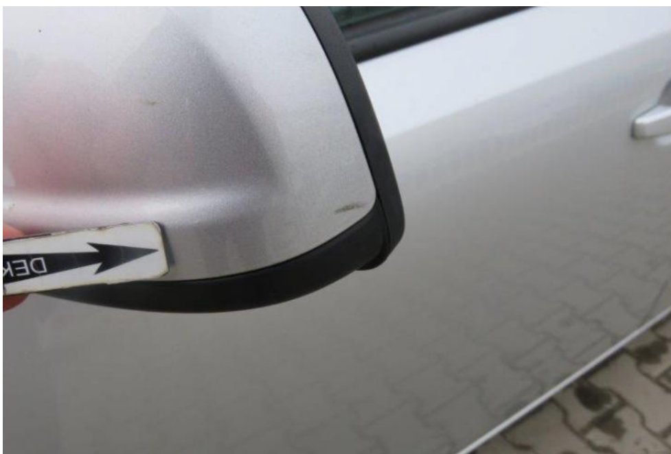
Fot. 33. lusterko zew. lewe