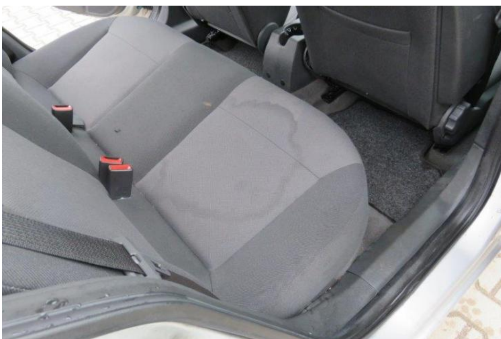
Fot. 20. kanapa tylna