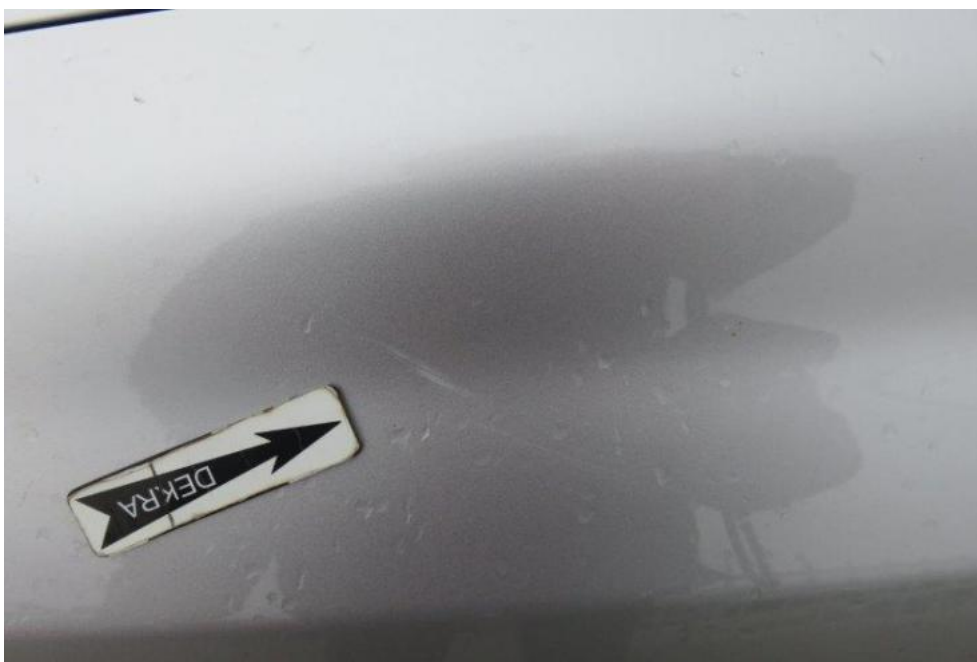
Fot. 31. błotnik PL