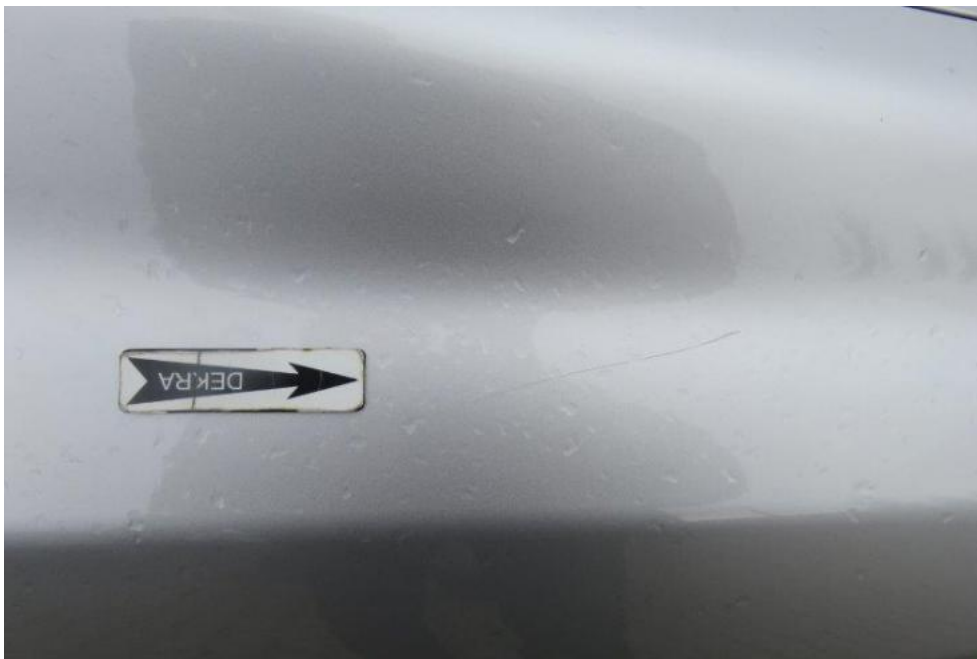
Fot. 59. błotnik PR