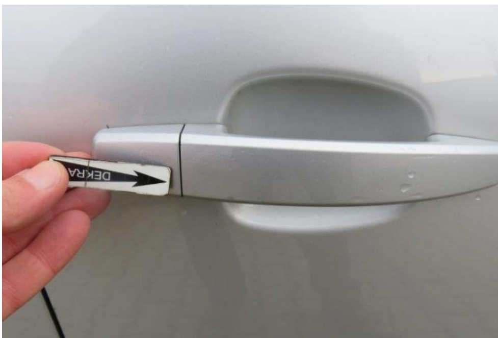
Fot. 53. drzwi PR