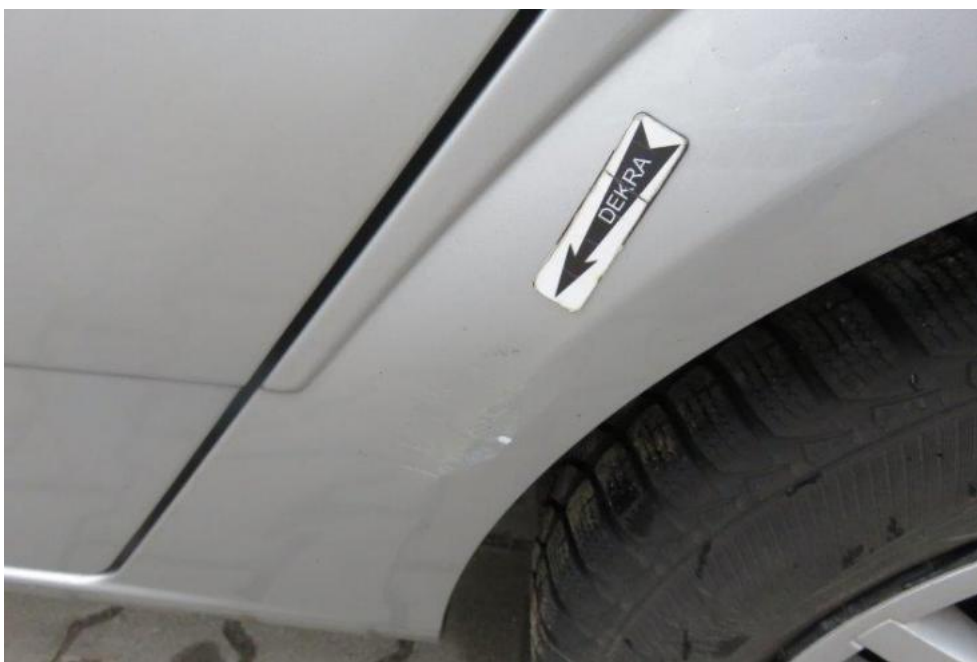
Fot. 43. błotnik TL