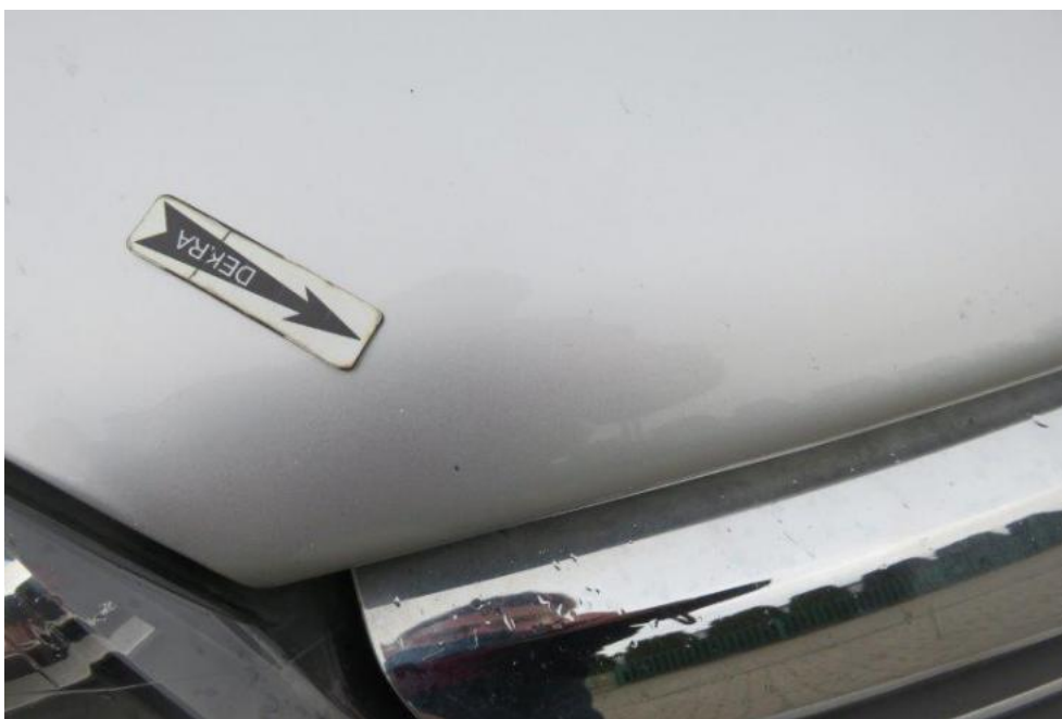
Fot. 29. pokrywa komory silnika