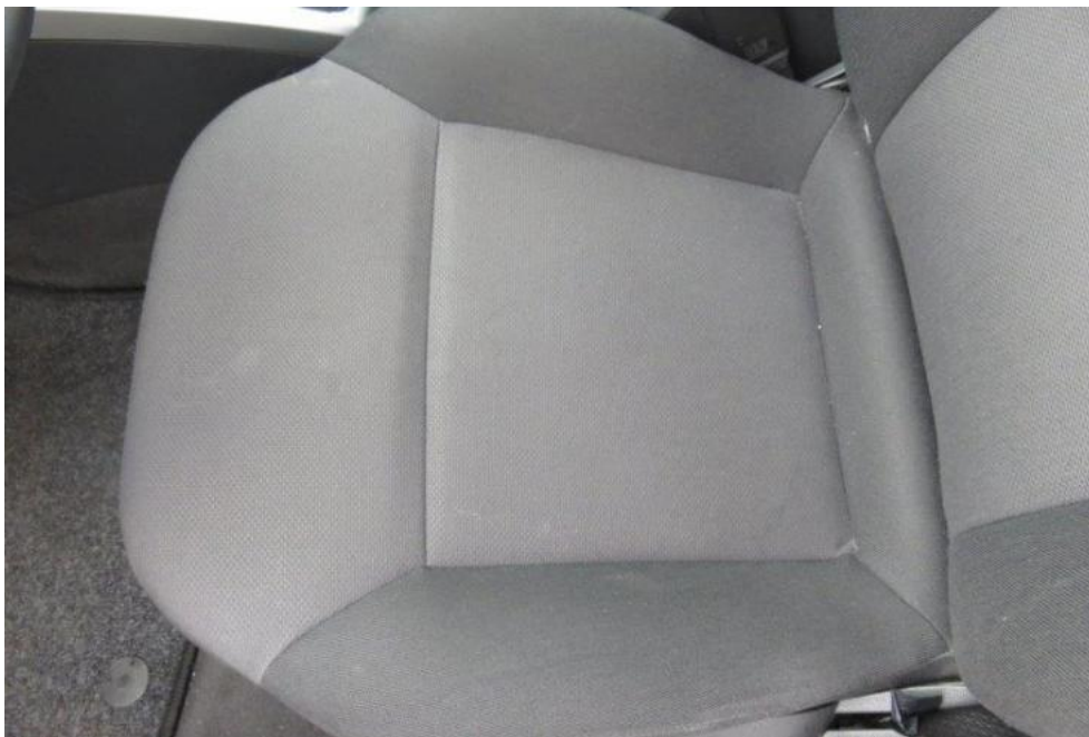
Fot. 25. fotel PL