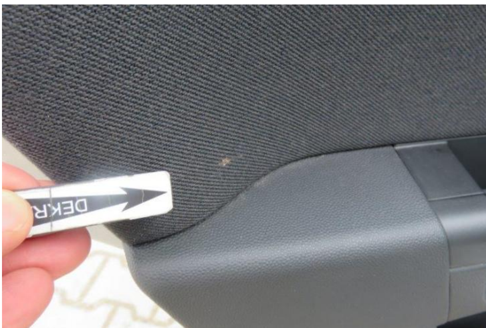
Fot. 22. drzwi TL