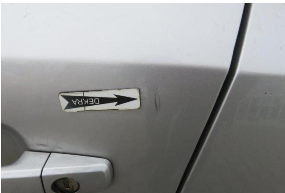
Fot. 37. drzwi PL