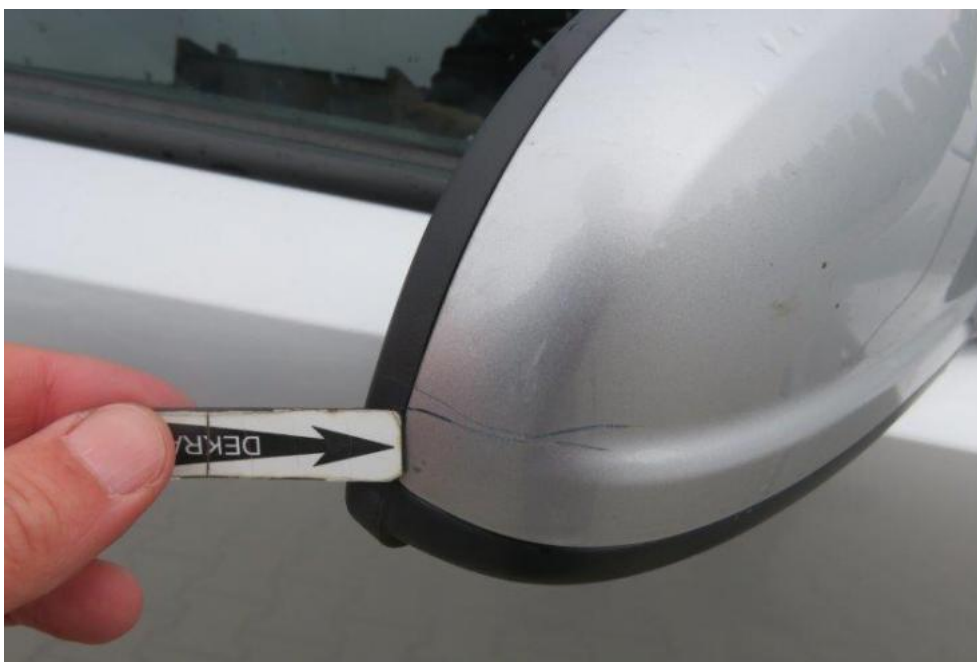
Fot. 57. lusterko zew. prawe