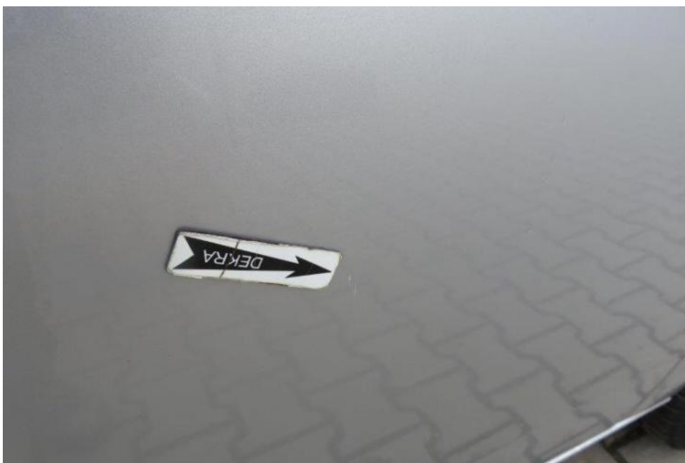
Fot. 52. drzwi PR