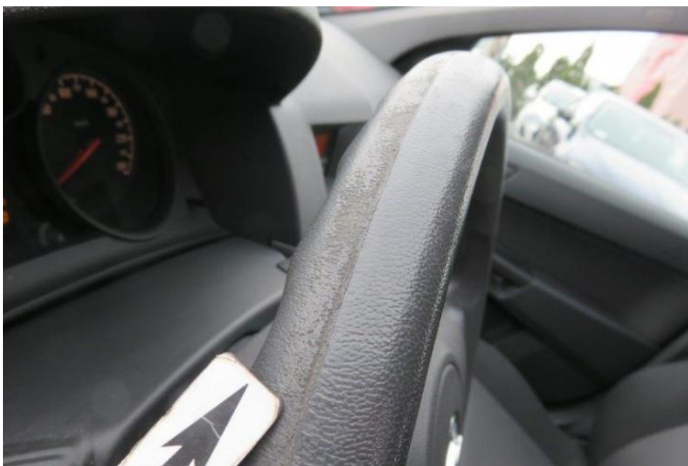
Fot. 26. koło kierownicy