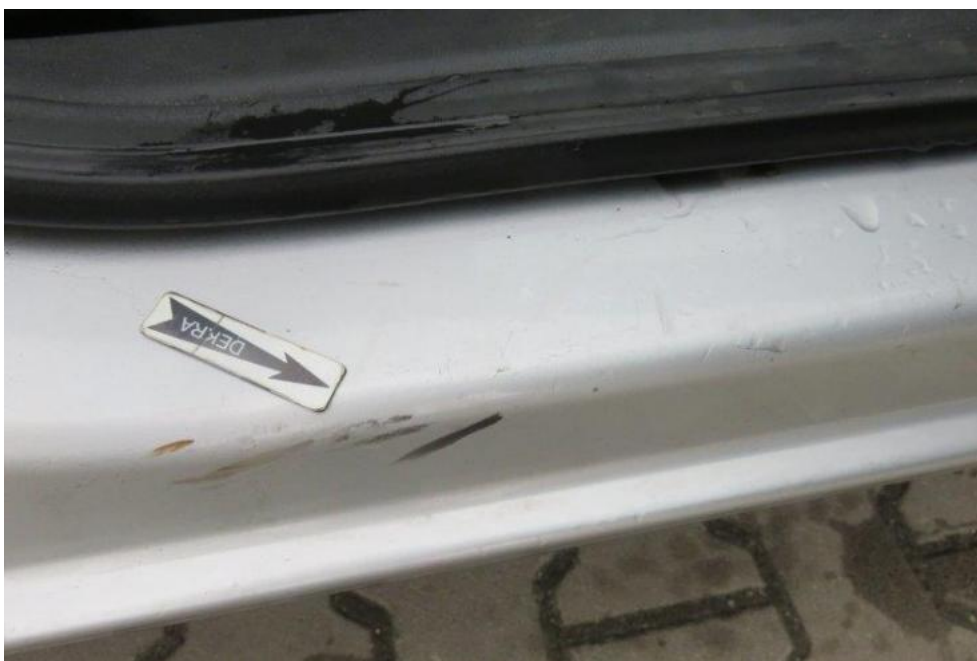
Fot. 18. próg prawy