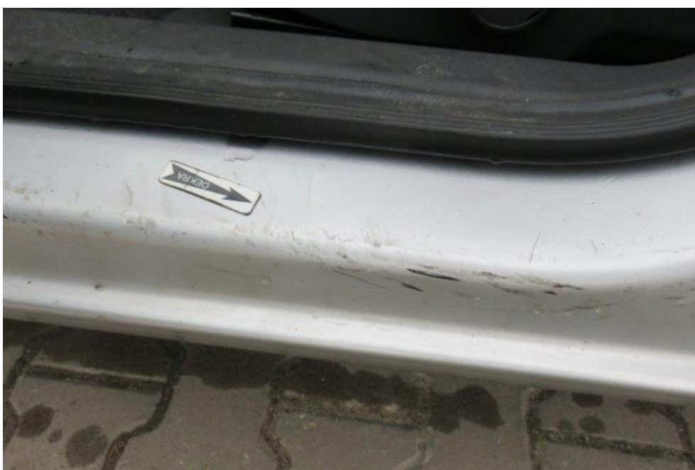
Fot. 24. próg lewy