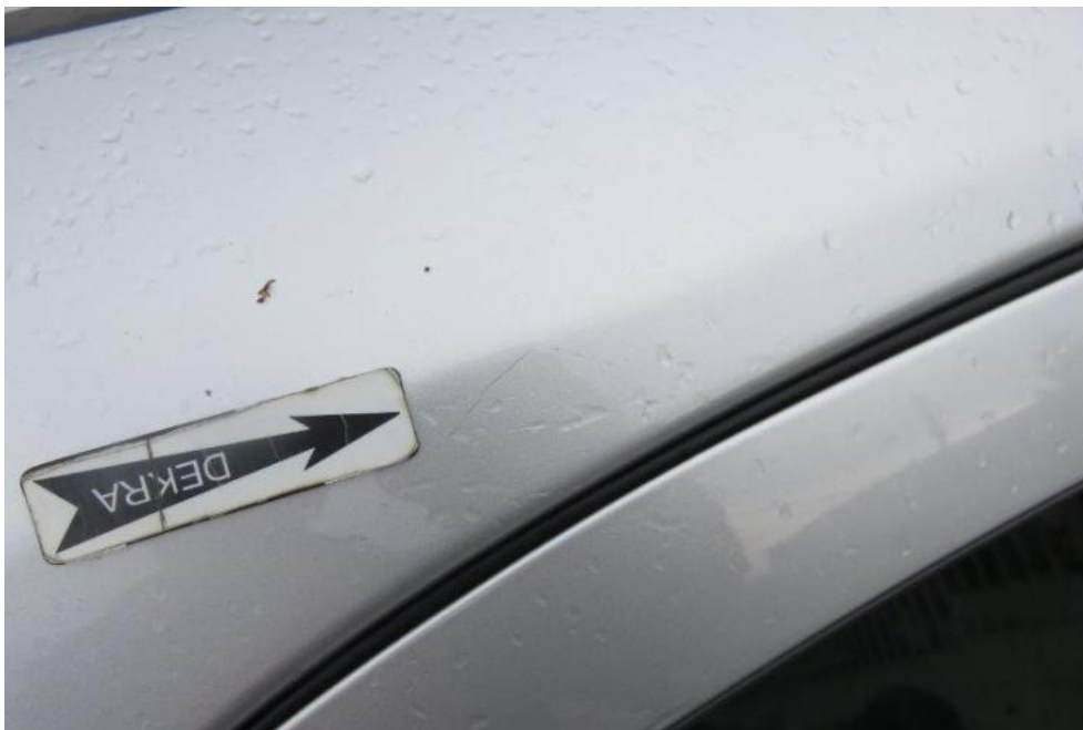
Fot. 55. rama prawa dachu