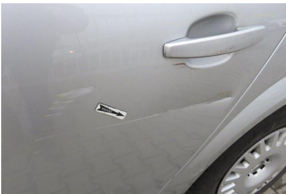
Fot. 40. drzwi TL