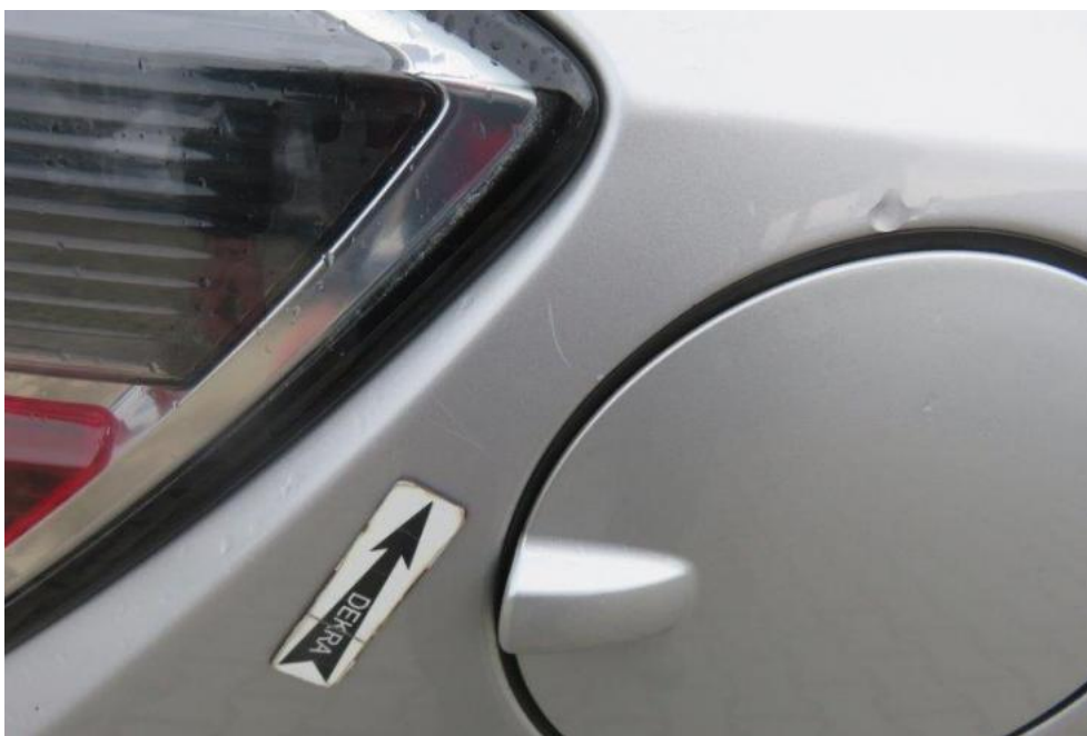
Fot. 47. błotnik TR