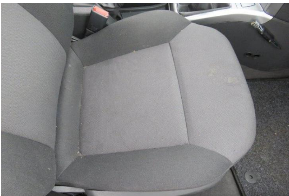
Fot. 19. fotel PR