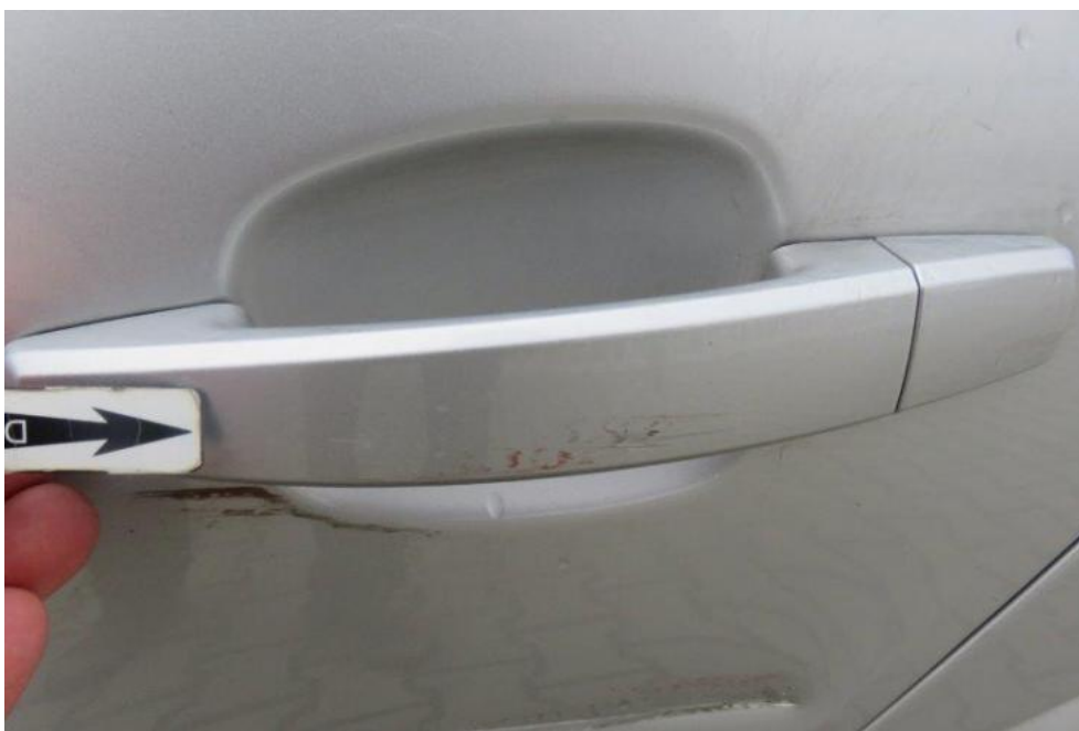
Fot. 41. drzwi TL