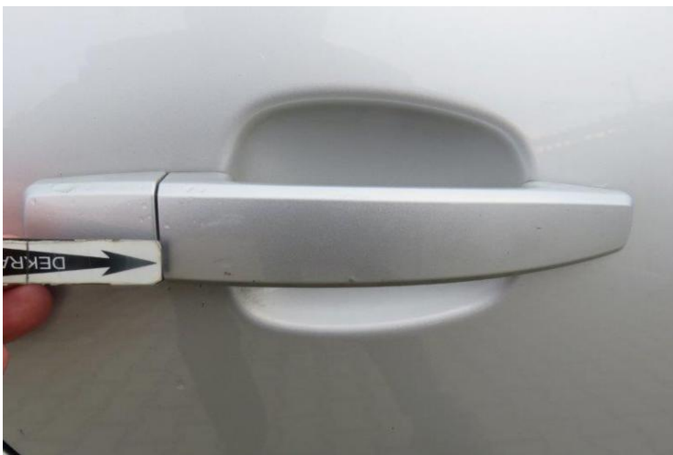
Fot. 50. drzwi TR