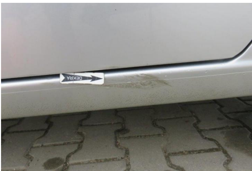
Fot. 38. próg lewy