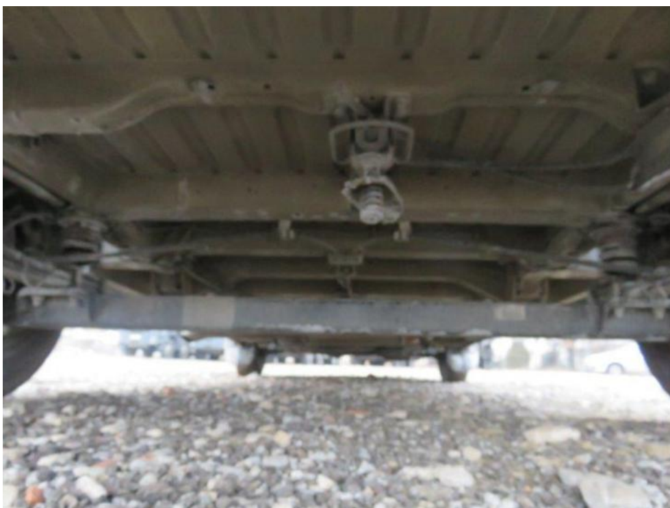
Fot. 14. koło zapasowe