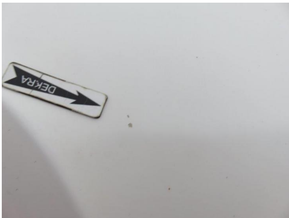
Fot. 24. pokrywa komory silnika