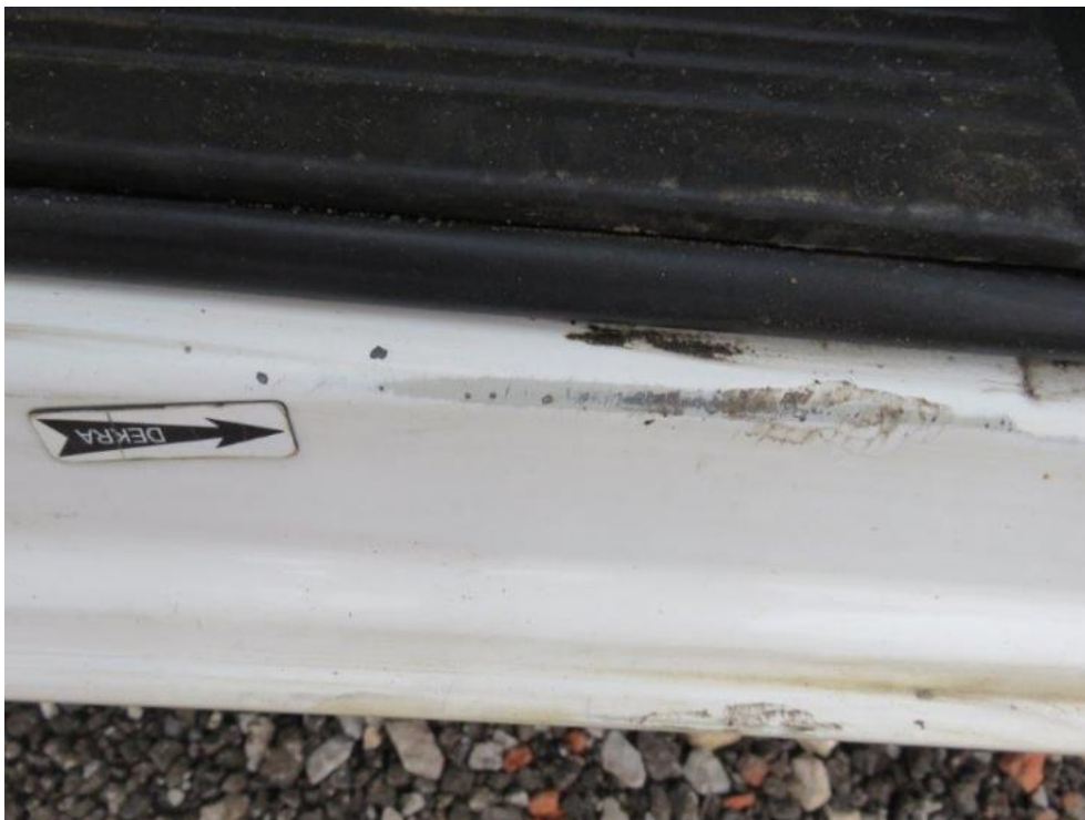
Fot. 19. próg lewy