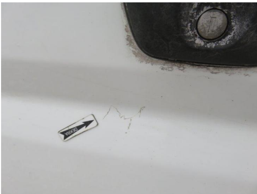
Fot. 44. drzwi PL