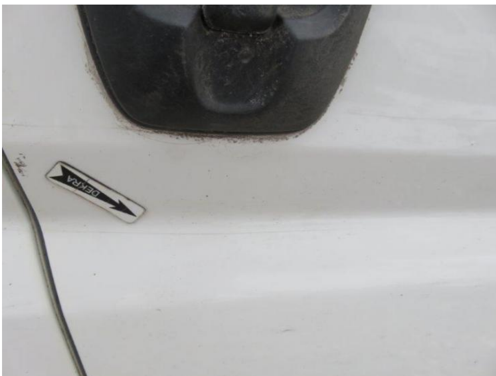
Fot. 28. drzwi prawe