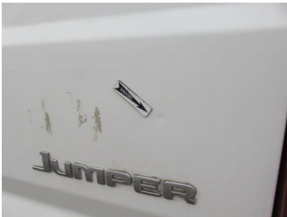
Fot. 39. drzwi TR