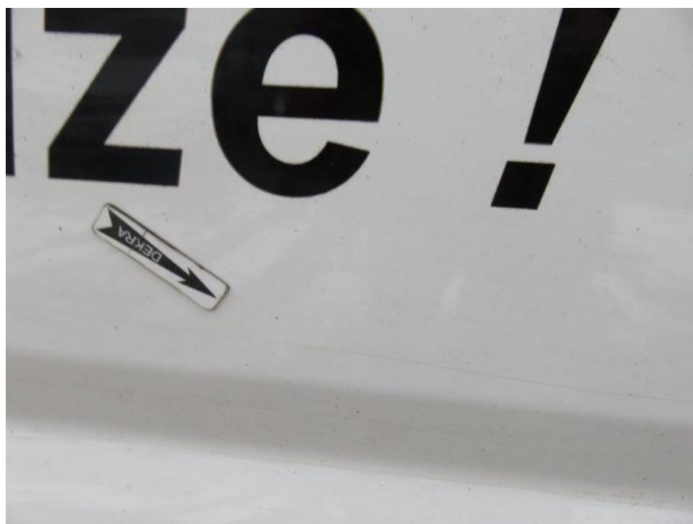
Fot. 30. drzwi suwane prawe