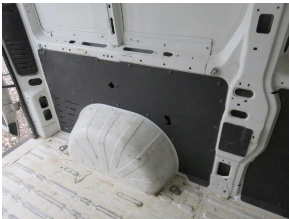
Fot. 37. tapicerka wew. przestrzeni ład.