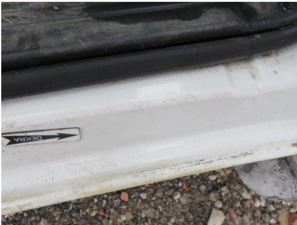
Fot. 17. próg prawy