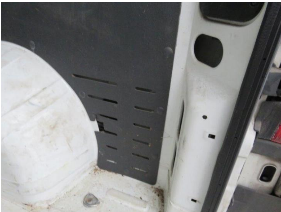
Fot. 35. tapicerka wew. przestrzeni ład.