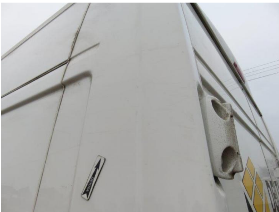
Fot. 42. bok lewy