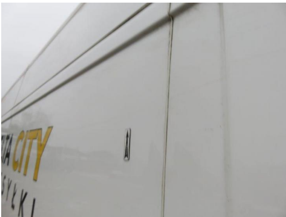
Fot. 41. bok lewy