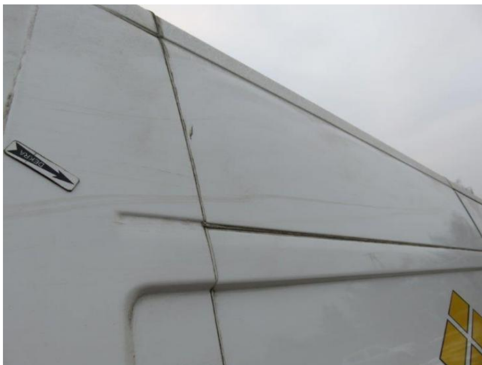
Fot. 32. bok prawy