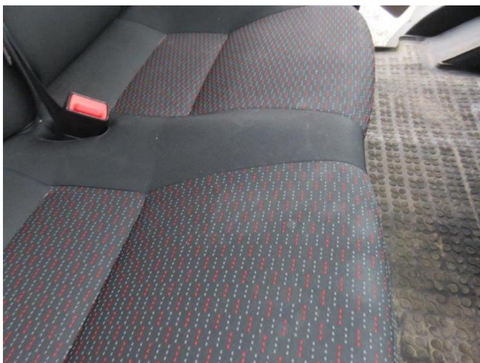
Fot. 16. fotel pasażera