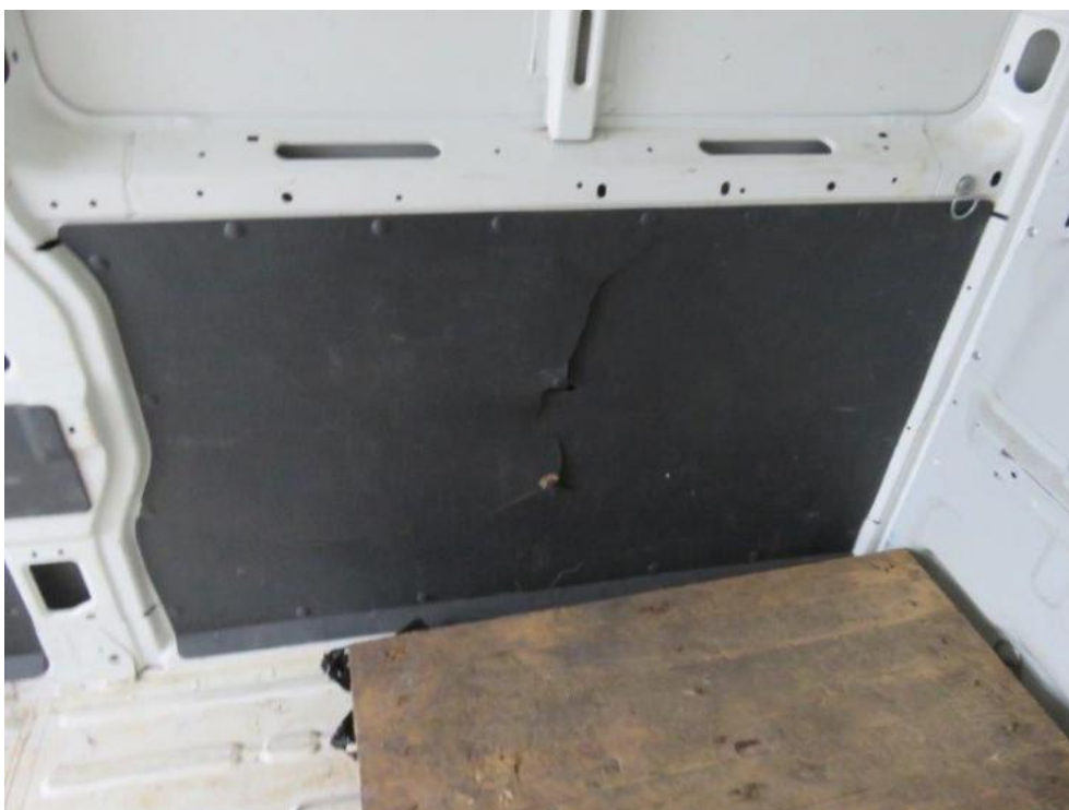
Fot. 36. tapicerka wew. przestrzeni ład.