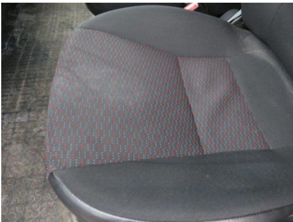
Fot. 20. fotel kierowcy