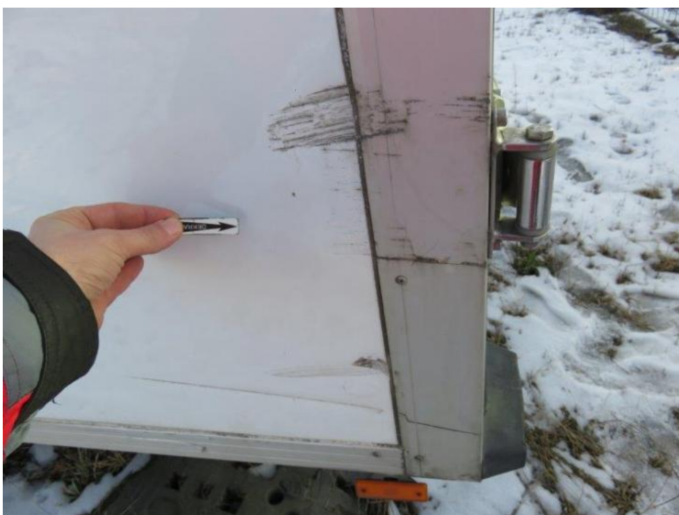
Fot. 40. bok R zabudowy