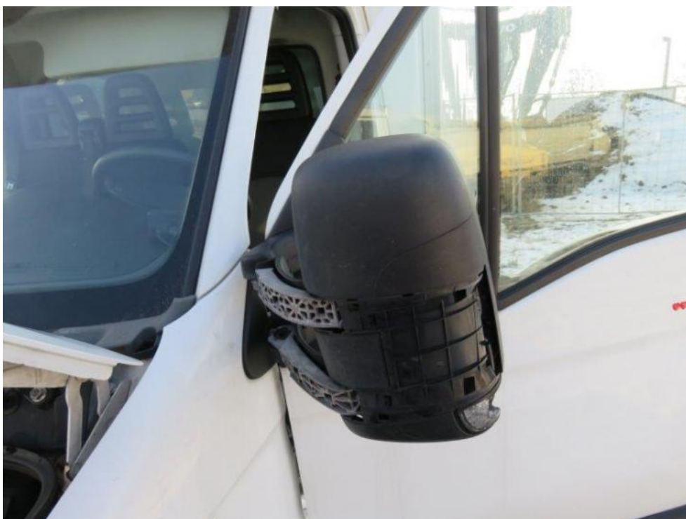
Fot. 30. lusterko zew. lewe