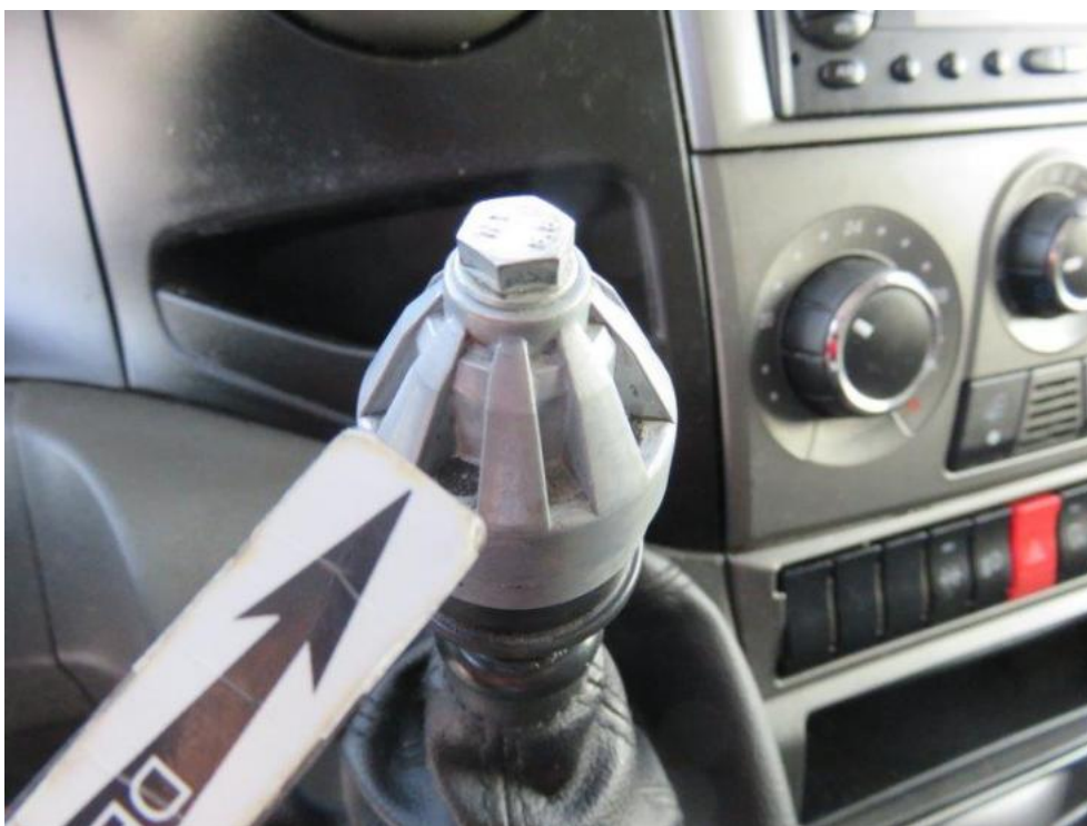
Fot. 36. dźwignia zm. biegów