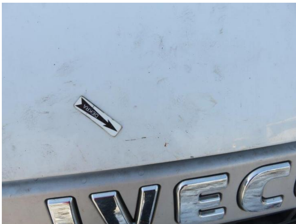
Fot. 53. pokrywa komory silnika