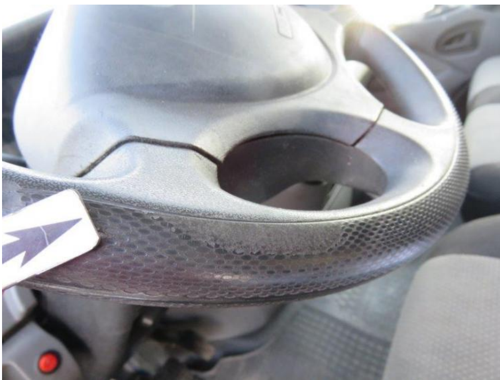
Fot. 35. koło kierownicy