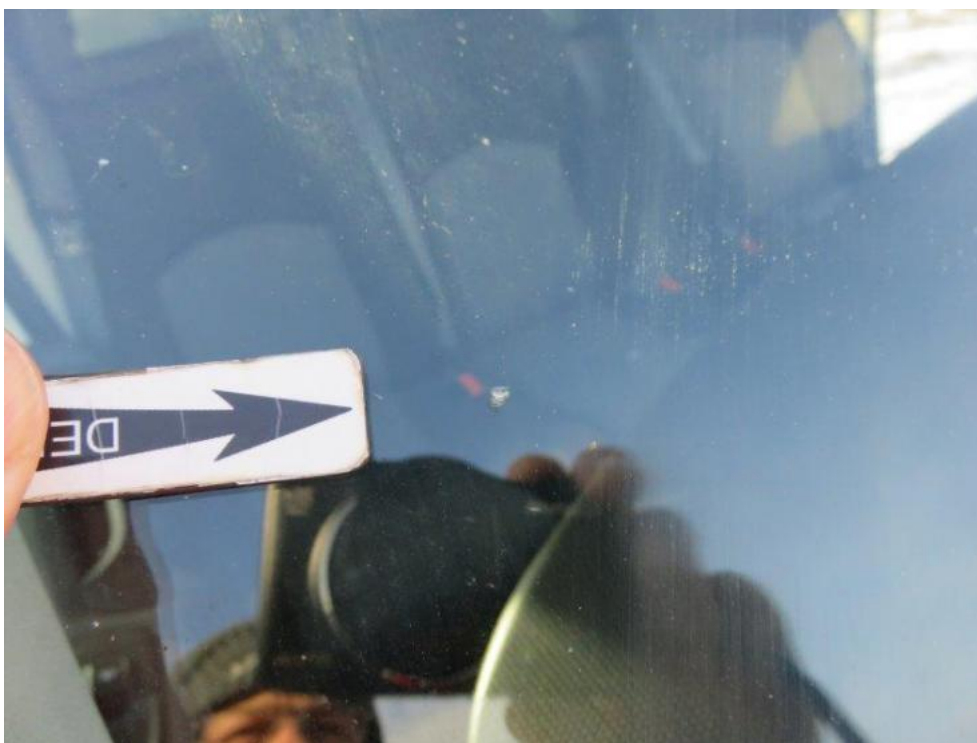
Fot. 25. szyba czołowa