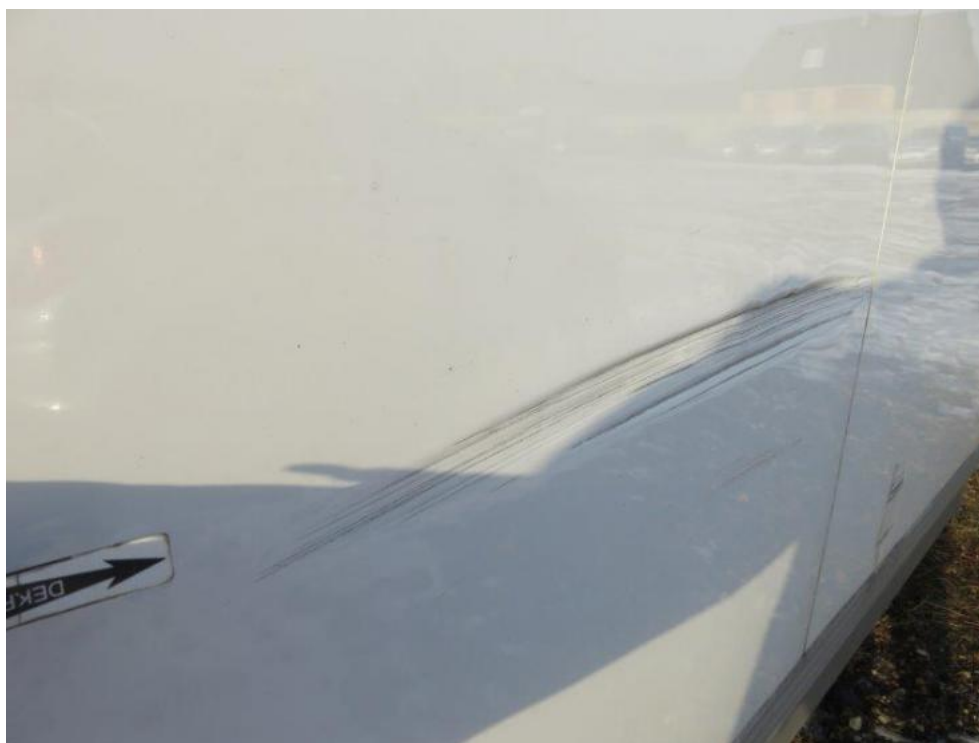
Fot. 45. bok L zabudowy