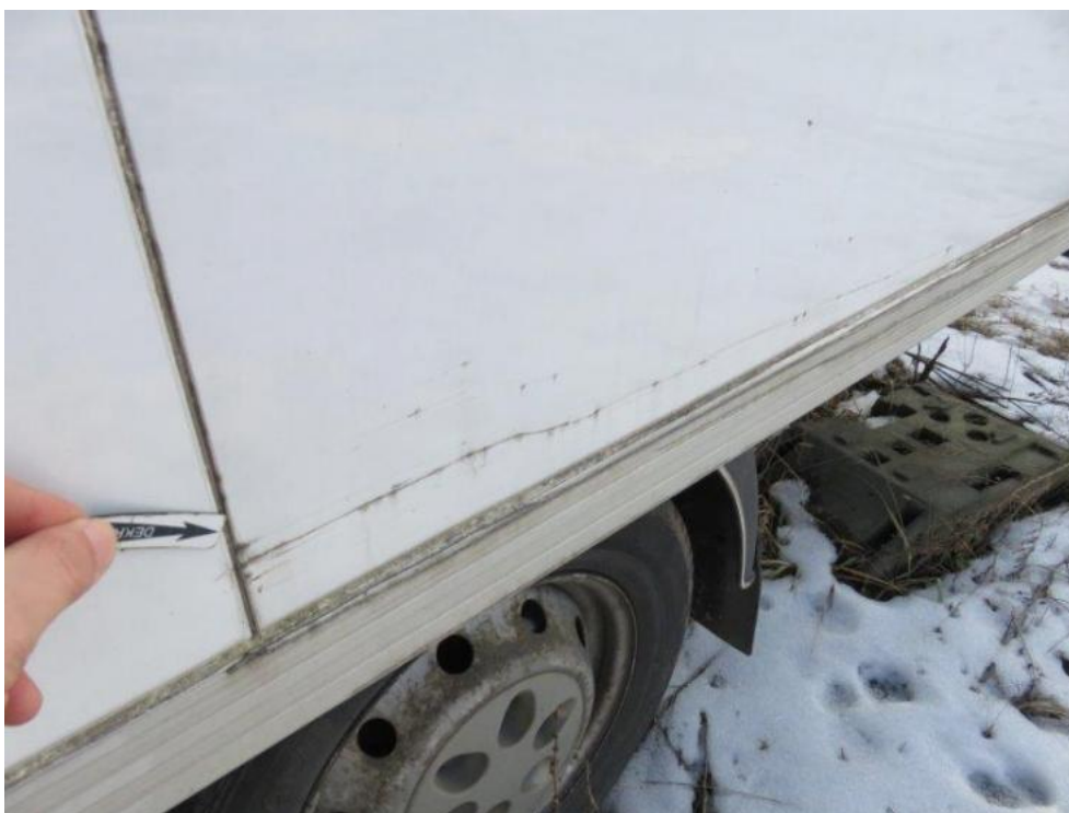
Fot. 39. bok R zabudowy