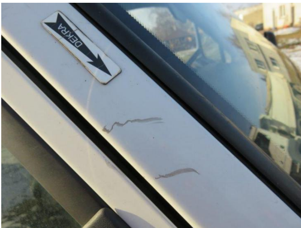
Fot. 24. słupek PR