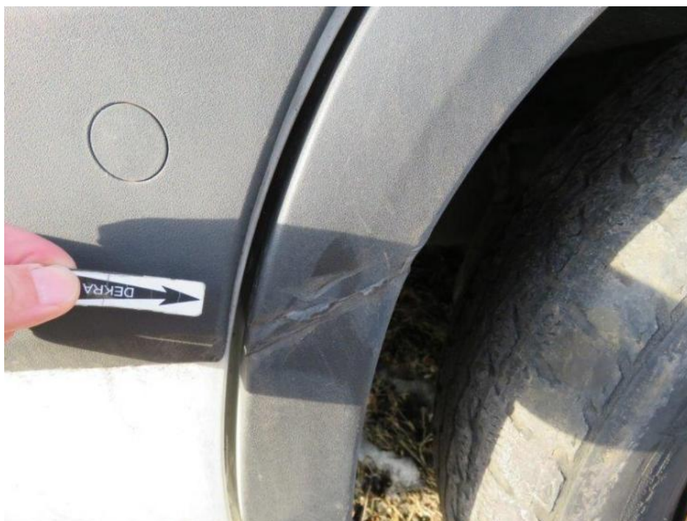
Fot. 28. błotnik PR