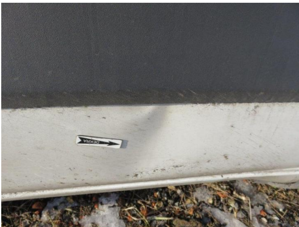
Fot. 20. drzwi prawe