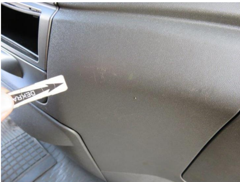
Fot. 17. deska rozdzielcza