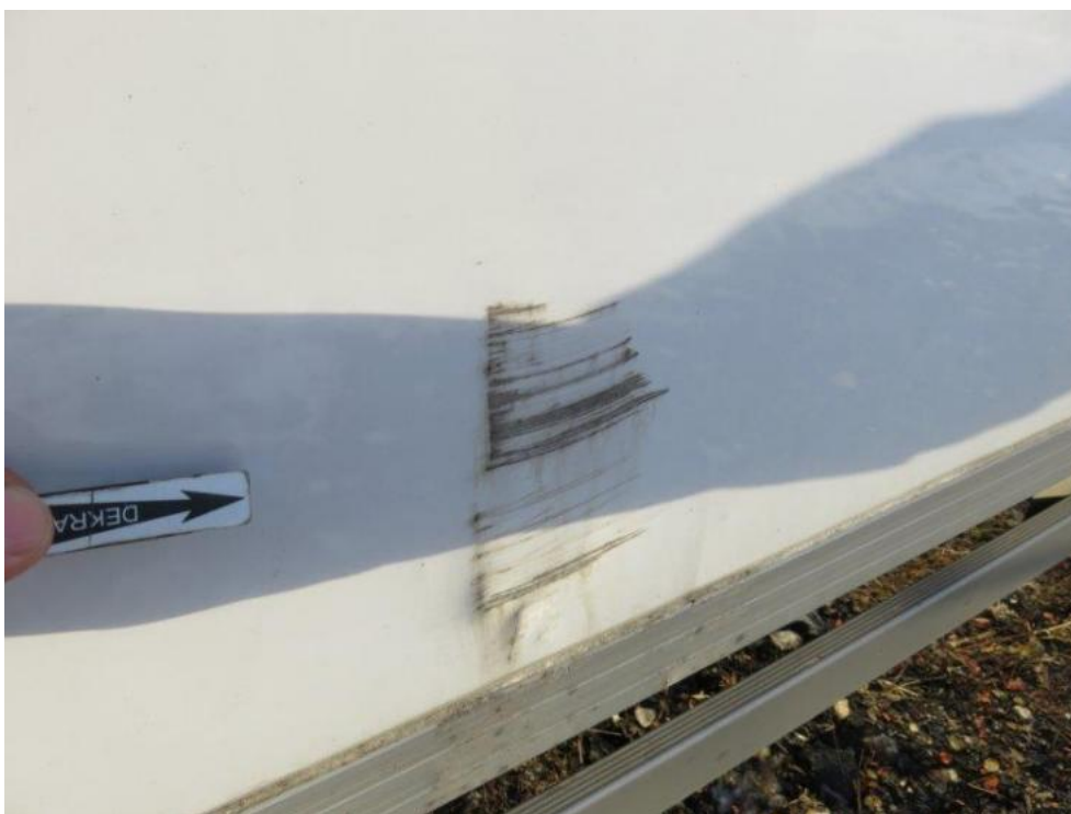
Fot. 47. bok L zabudowy