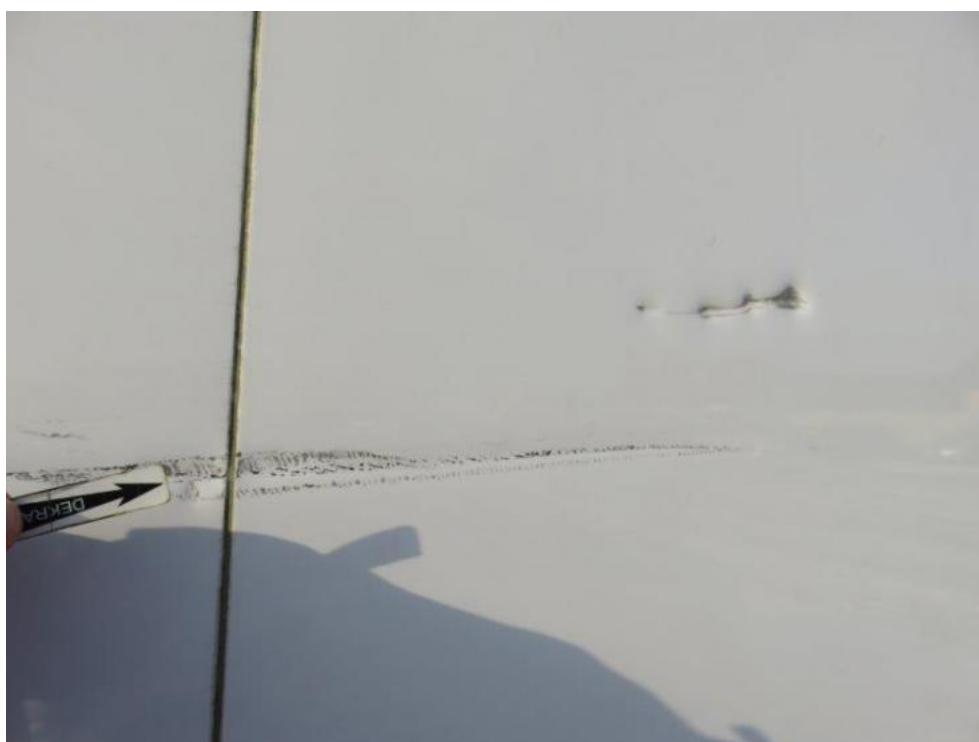
Fot. 46. bok L zabudowy