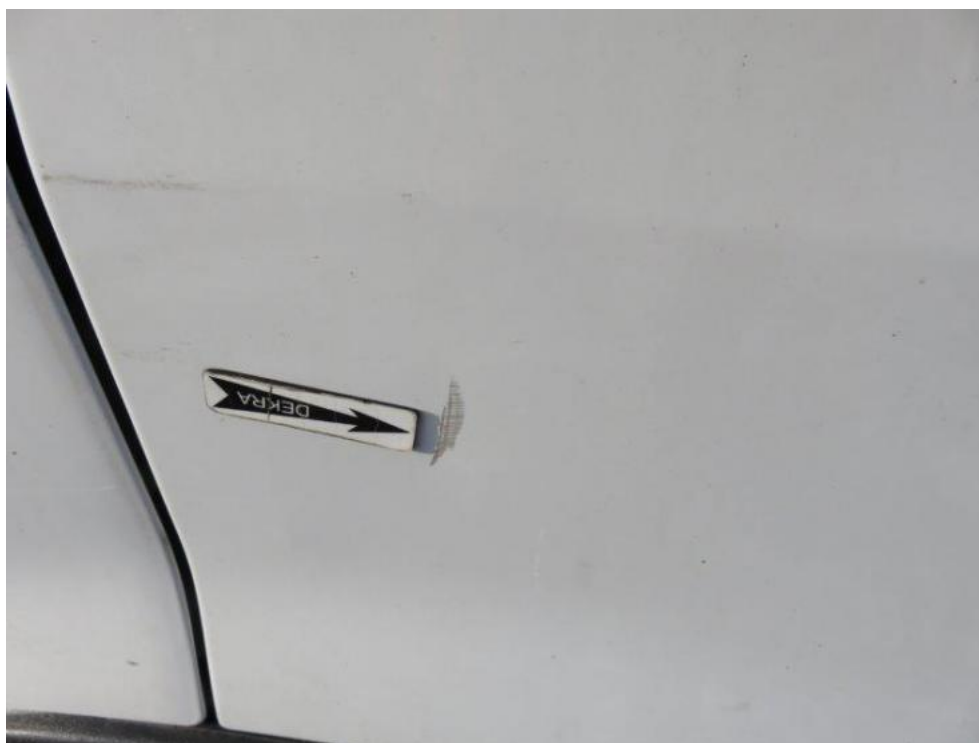
Fot. 27. błotnik PR