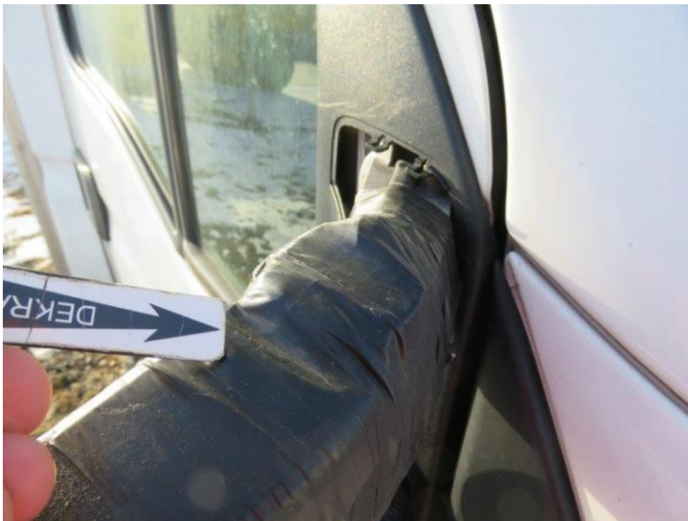
Fot. 29. lusterko zew. prawe