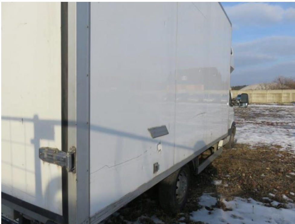
Fot. 43. bok L zabudowy