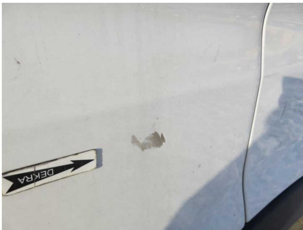
Fot. 21. drzwi prawe