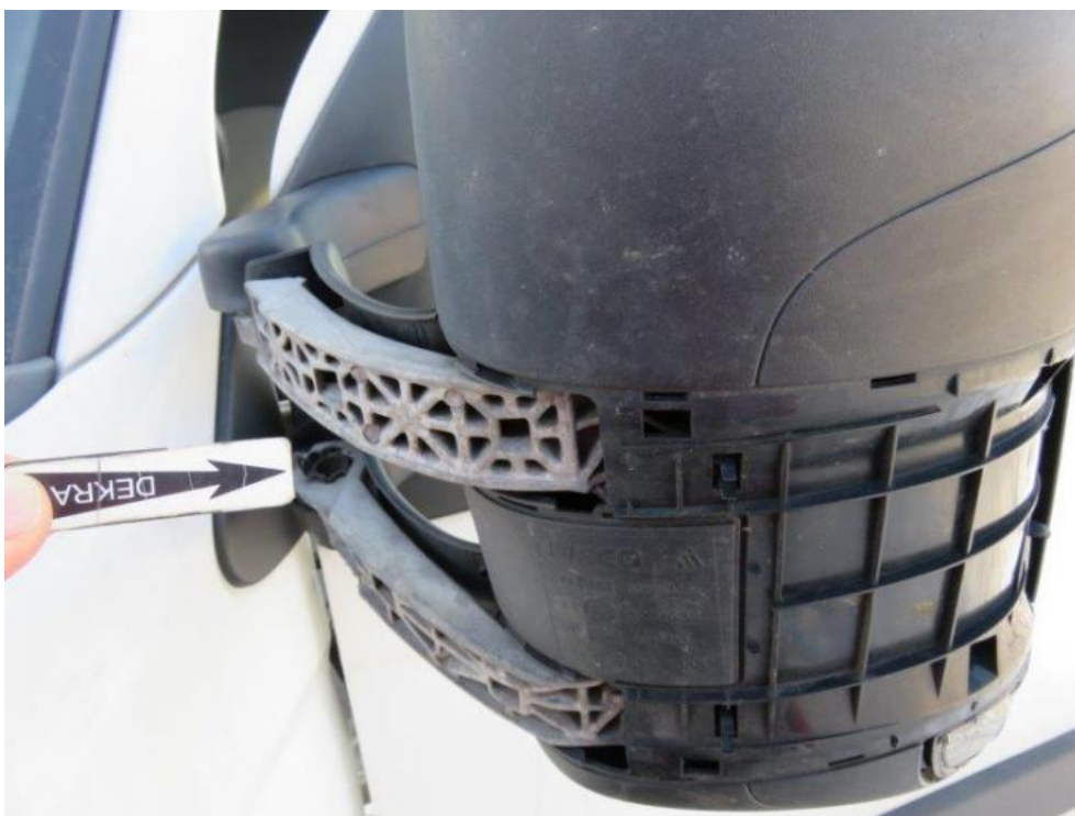
Fot. 31. lusterko zew. lewe