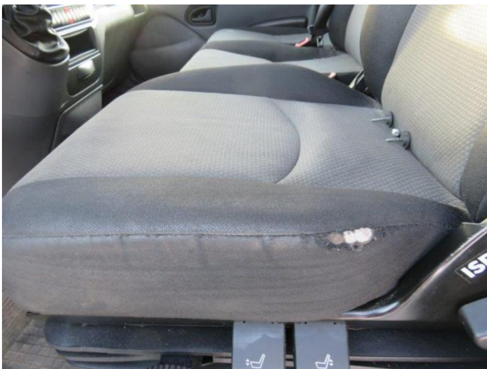
Fot. 34. siedzenie kierowcy