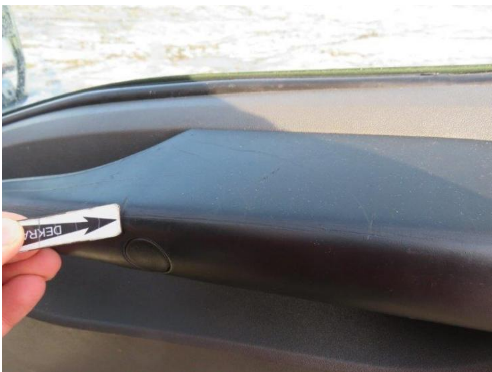
Fot. 14. deska rozdzielcza