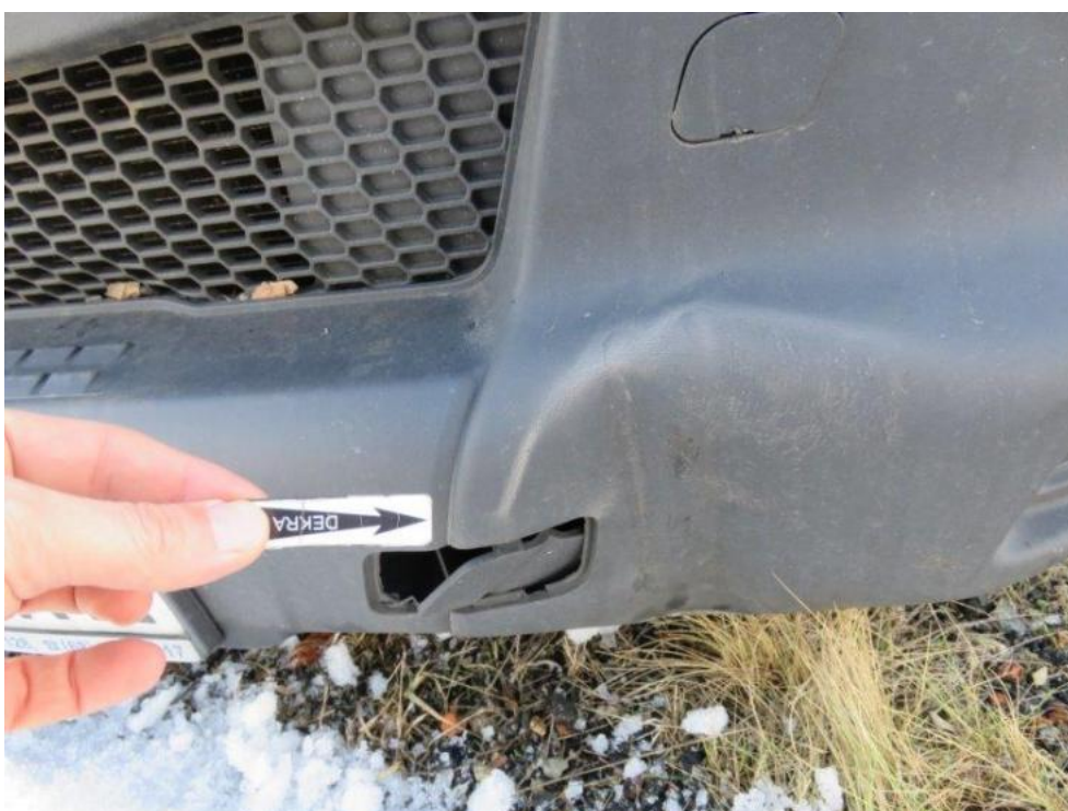
Fot. 50. zderzak przedni