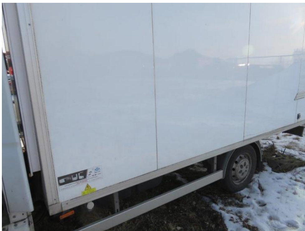
Fot. 37. bok R zabudowy