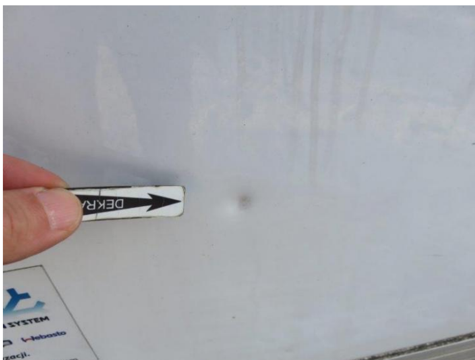
Fot. 38. bok R zabudowy