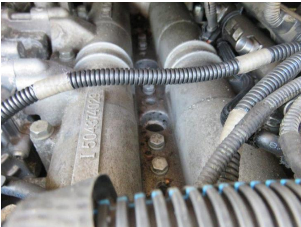
Fot. 57. silnik pojazdu