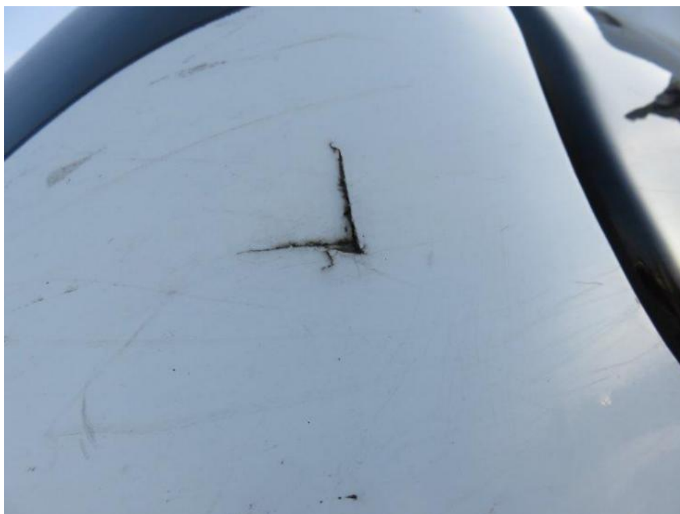
Fot. 56. kabina sypialna