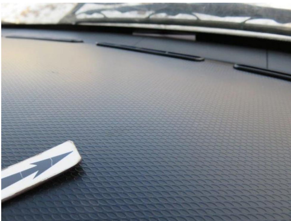
Fot. 18. deska rozdzielcza