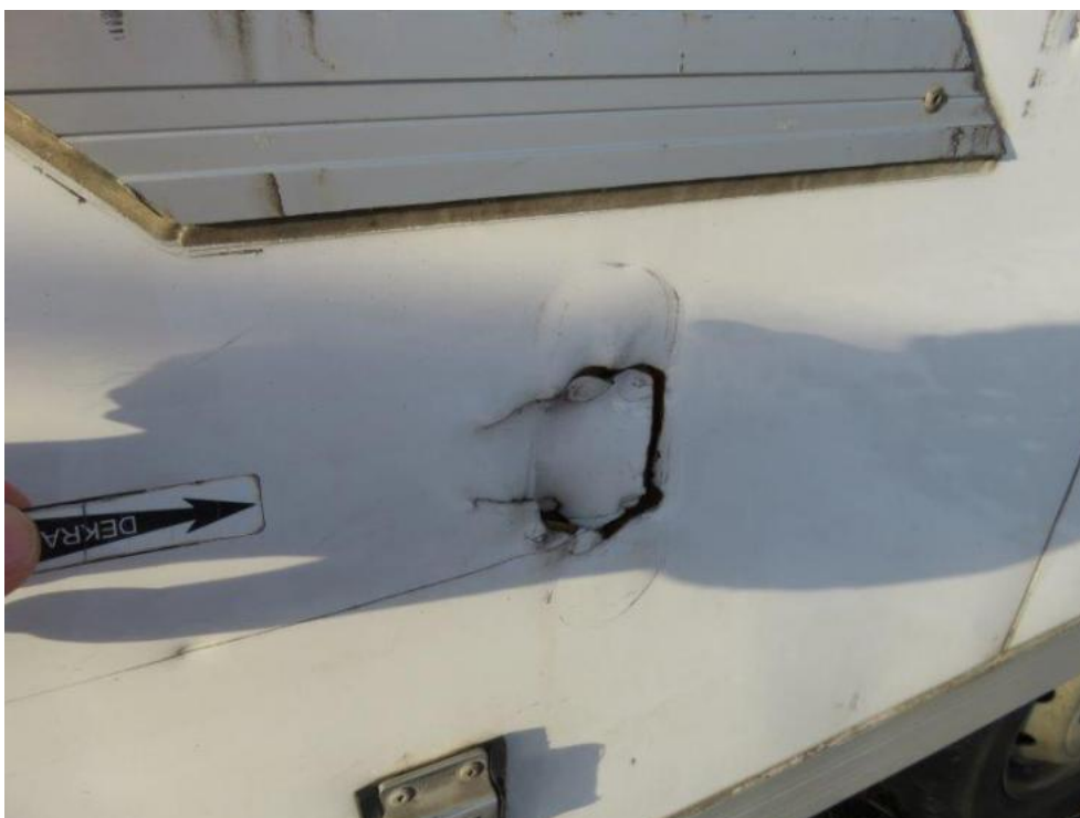
Fot. 44. bok L zabudowy