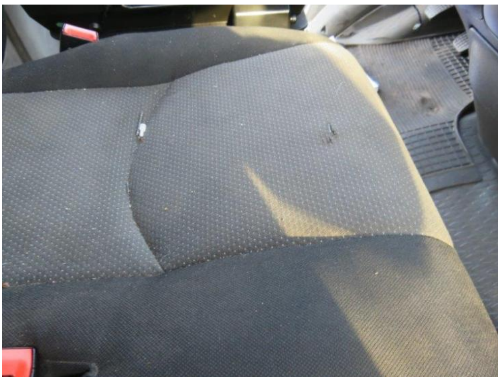
Fot. 16. siedzenie pasażera