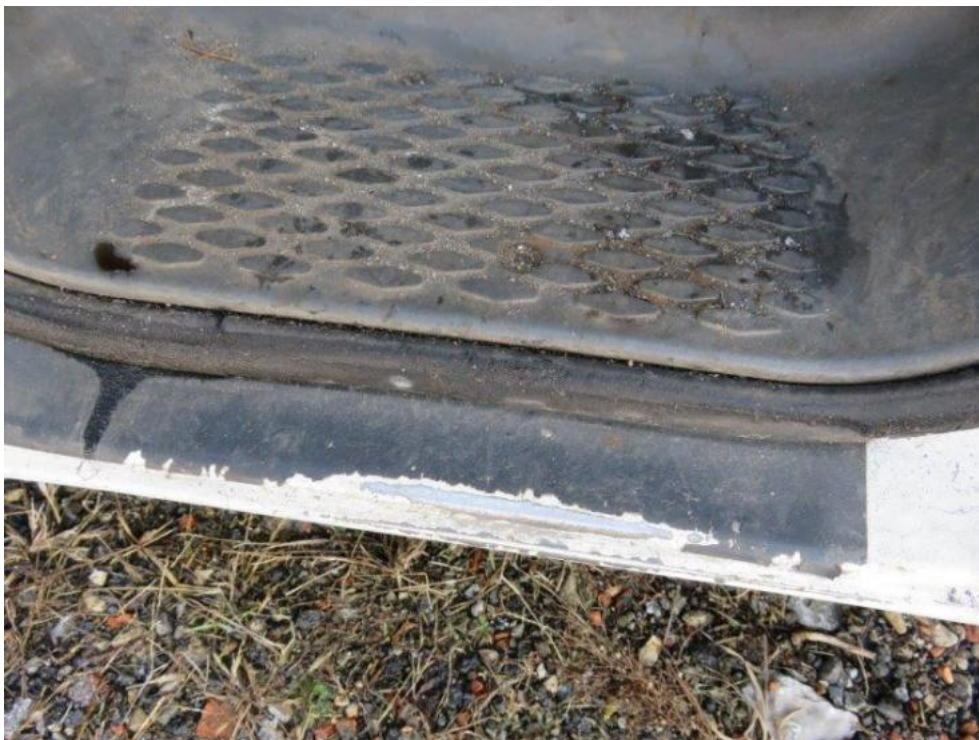
Fot. 33. próg lewy