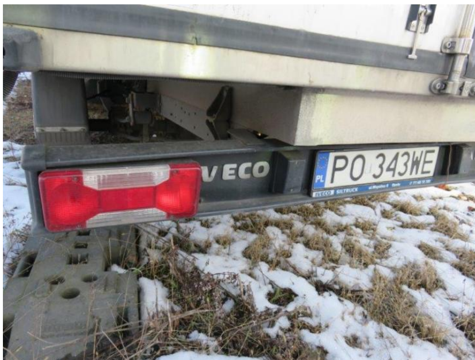
Fot. 41. belka tylna