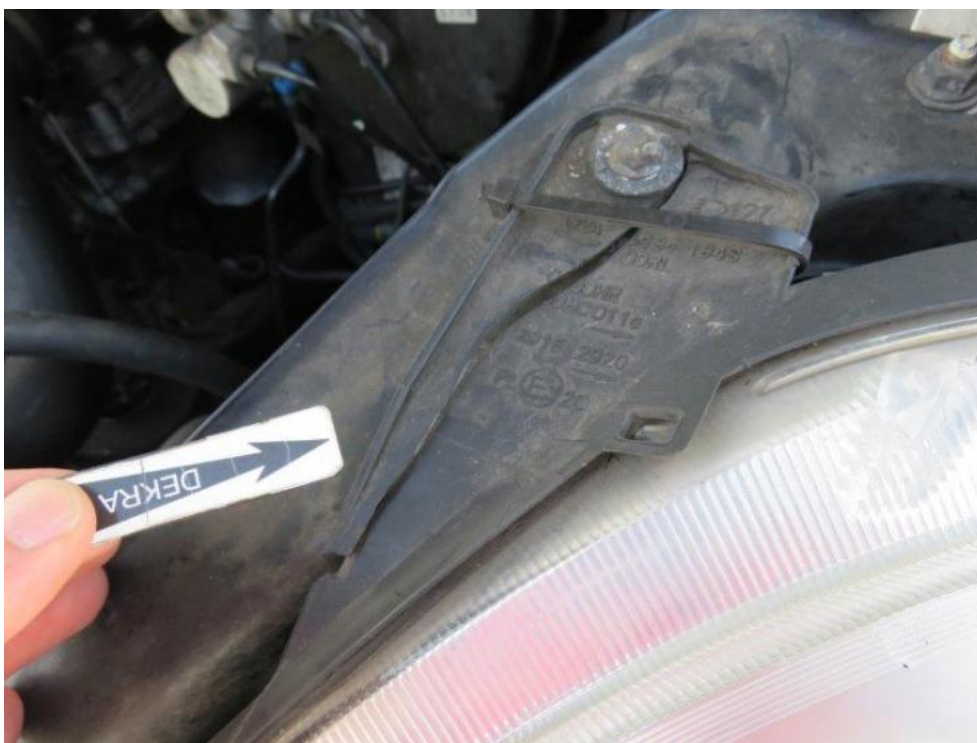
Fot. 49. reflektor lewy