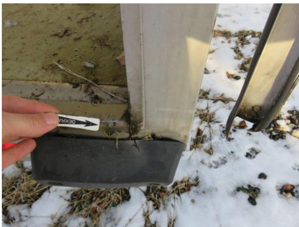
Fot. 42. tył R zabudowy