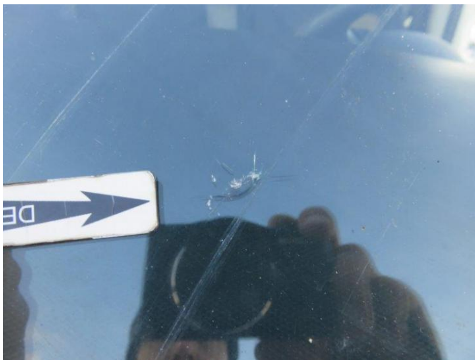
Fot. 54. szyba przednia