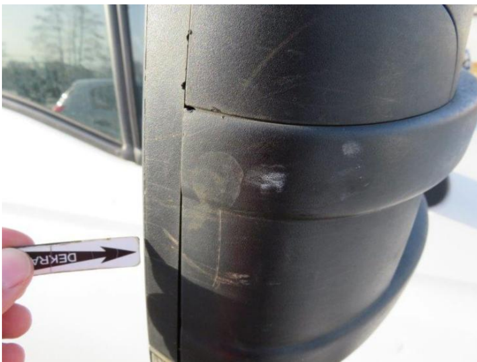
Fot. 23. lusterko zew. prawe