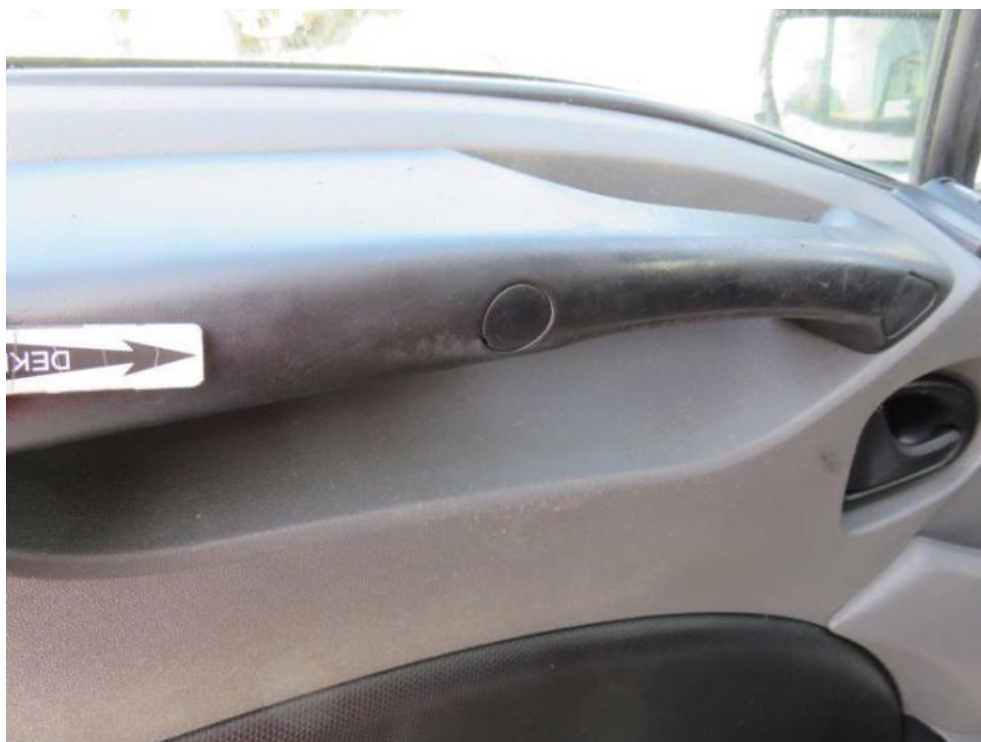
Fot. 52. drzwi lewe