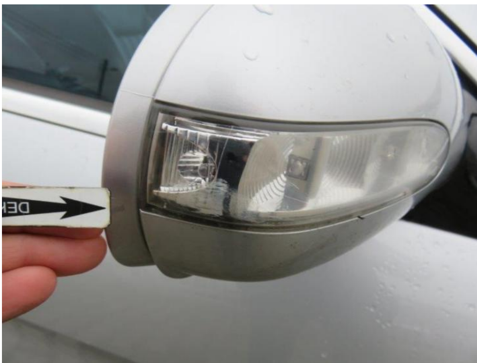
Fot. 47. lusterko zew. prawe