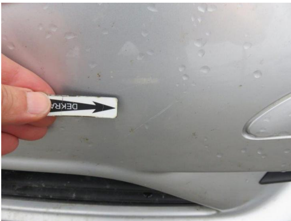
Fot. 21. zderzak przedni