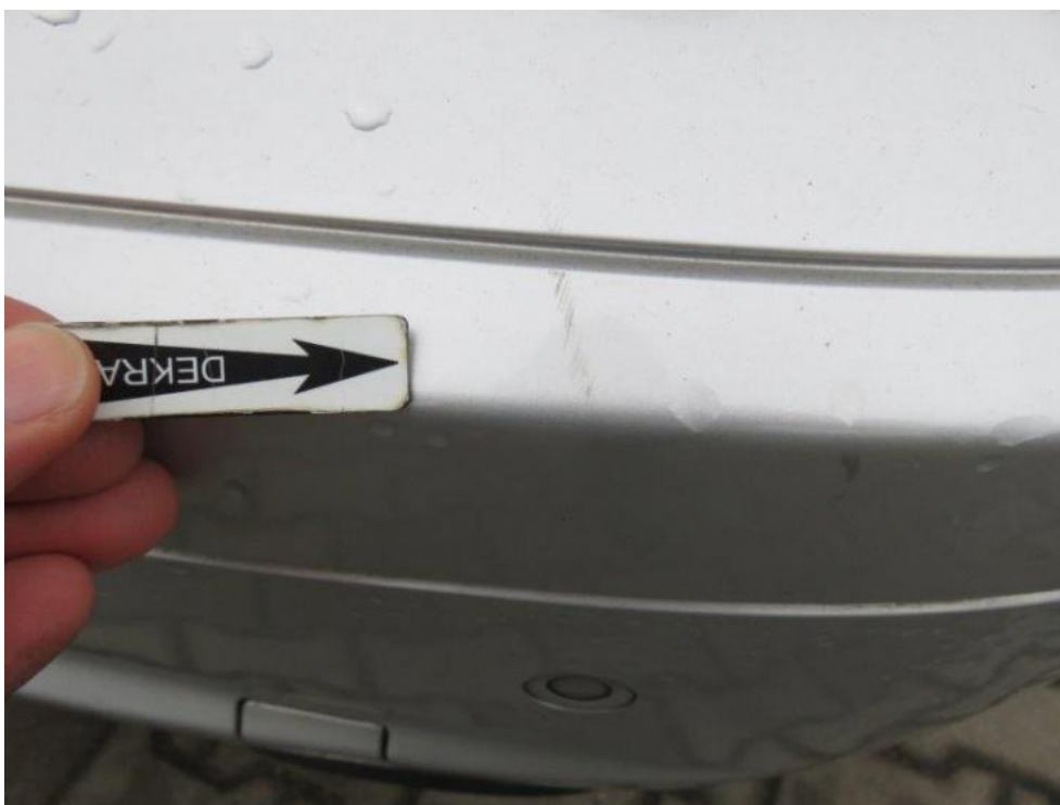
Fot. 36. zderzak tylny