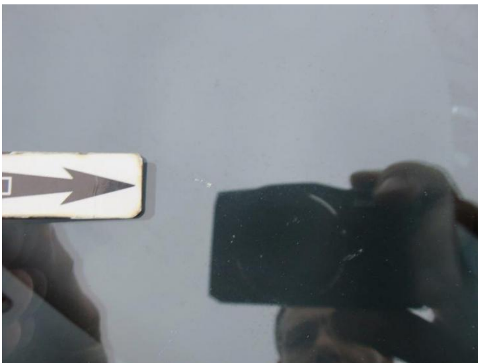
Fot. 28. szyba czołowa