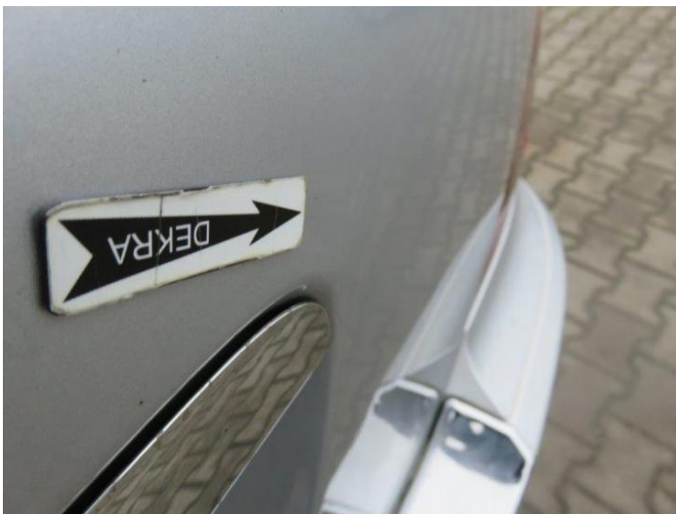
Fot. 35. pokrywa komory bagażnika