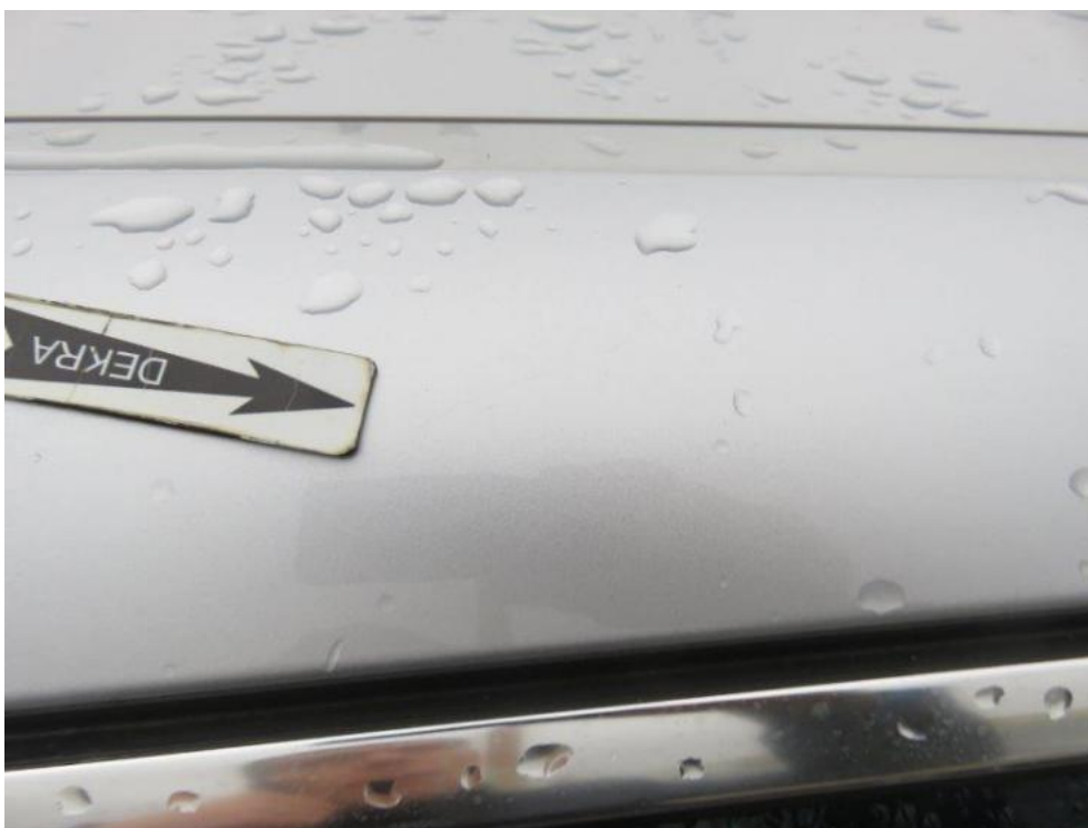
Fot. 45. rama prawa dachu