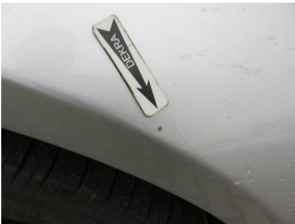
Fot. 49. błotnik PR