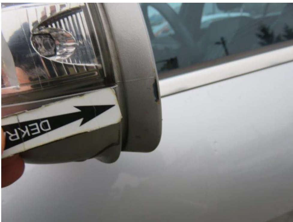
Fot. 27. lusterko zew. lewe