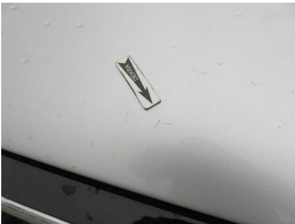
Fot. 19. pokrywa komory silnika