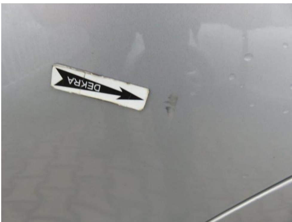
Fot. 30. drzwi TL