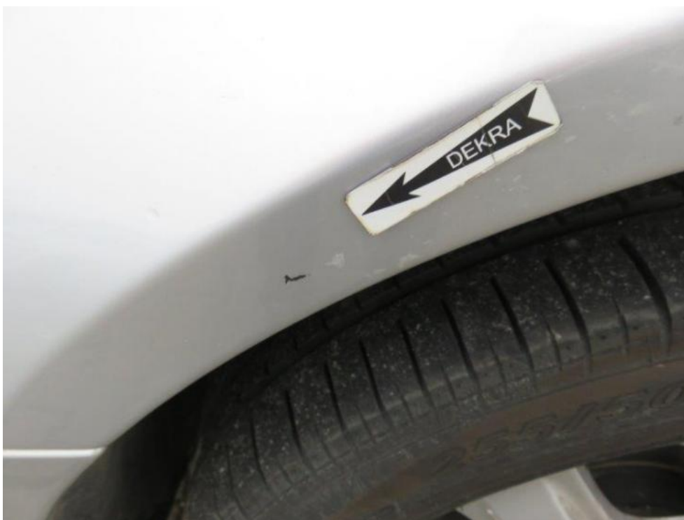
Fot. 23. błotnik PL