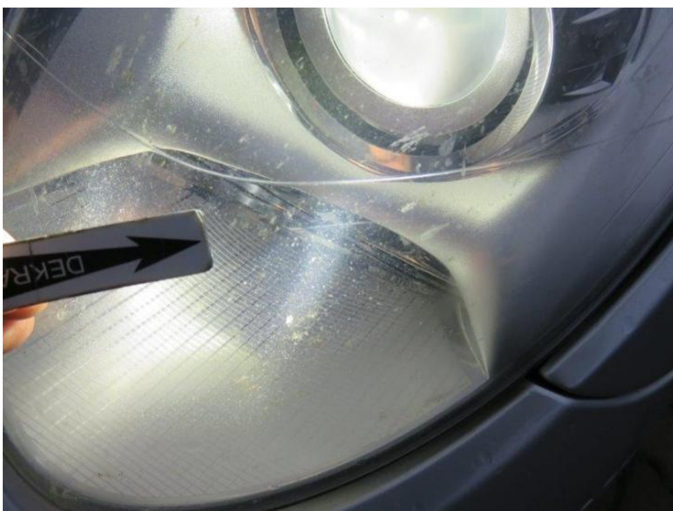
Fot. 18. reflektor lewy