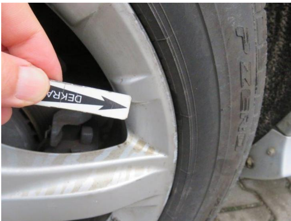
Fot. 39. tarcza koła TR