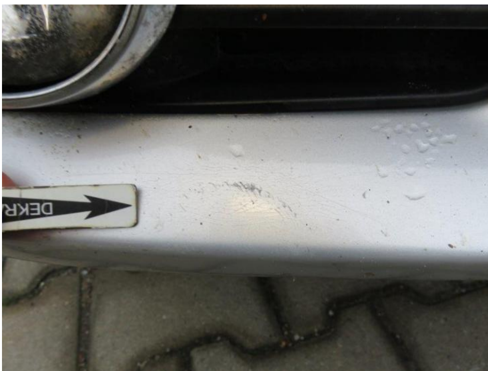
Fot. 20. zderzak przedni