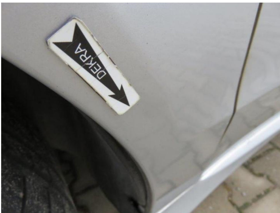
Fot. 25. błotnik PL