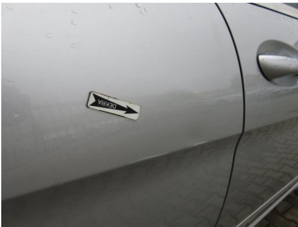
Fot. 41. drzwi TR