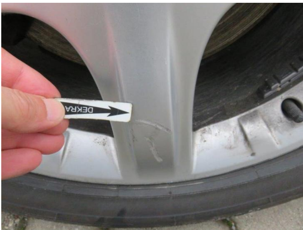
Fot. 33. tarcza koła TL