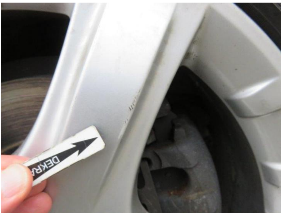
Fot. 24. tarcza koła PL