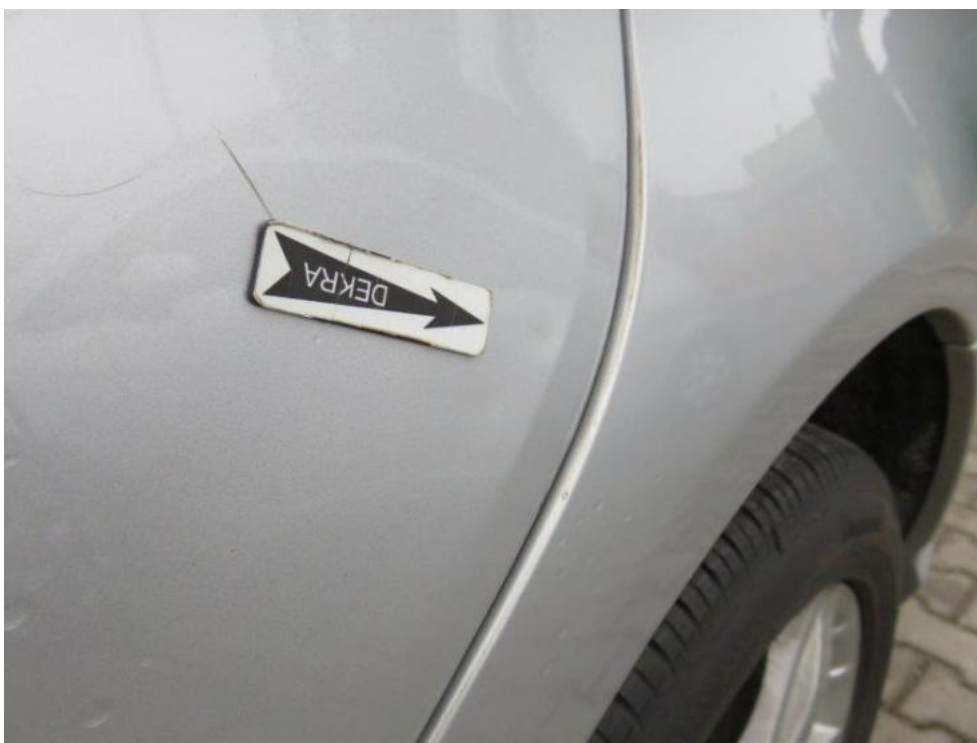
Fot. 31. drzwi TL