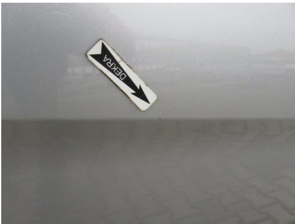
Fot. 43. drzwi PR