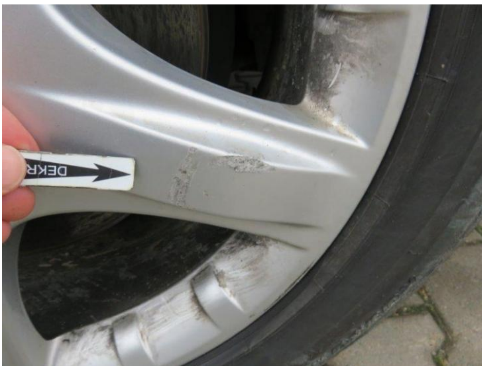
Fot. 50. tarcza koła PR