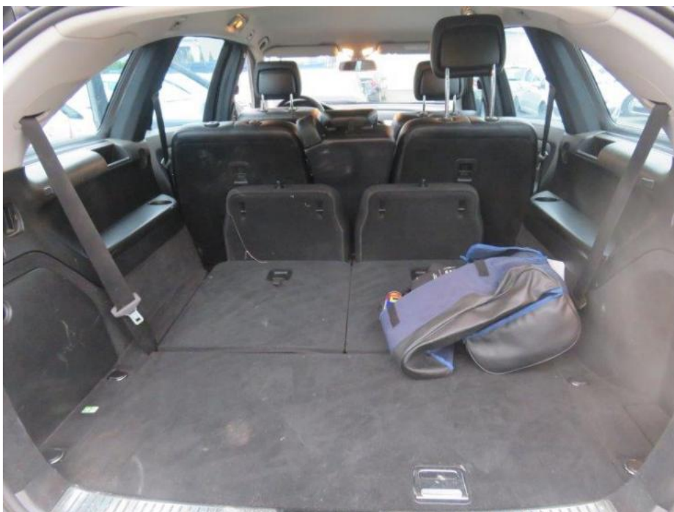
Fot. 51. komora bagażnika