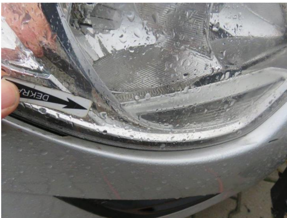
Fot. 65. reflektor prawy