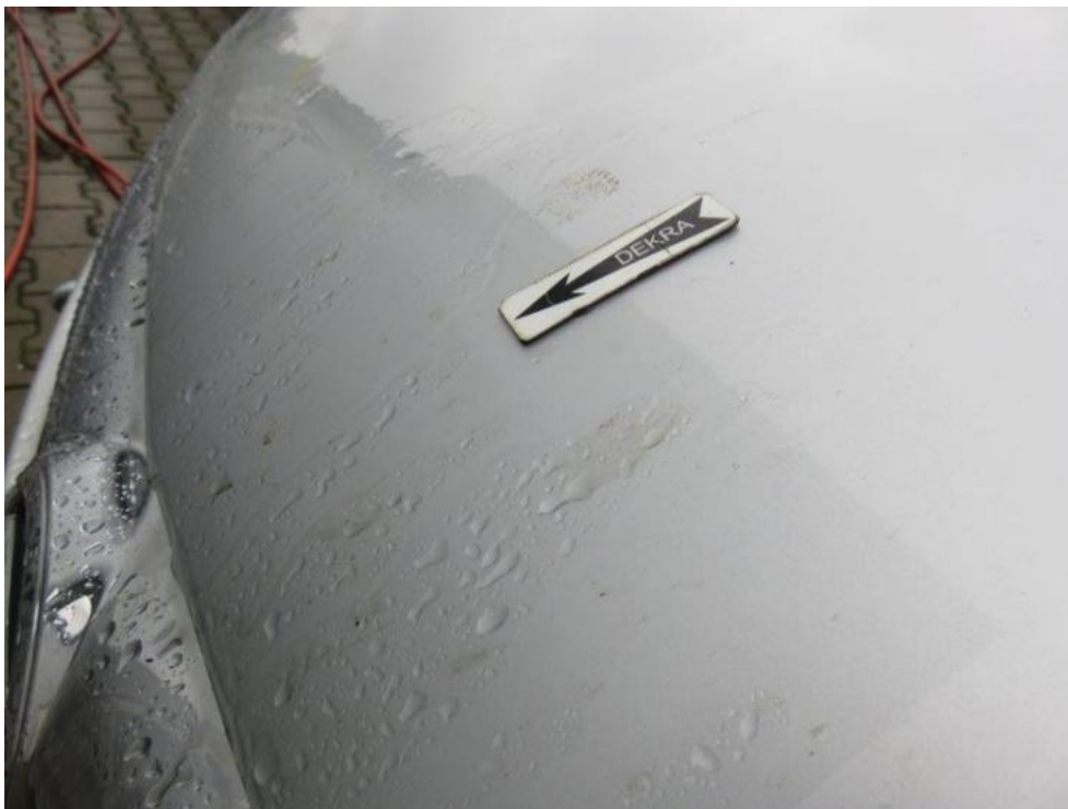
Fot. 67. pokrywa komory silnika