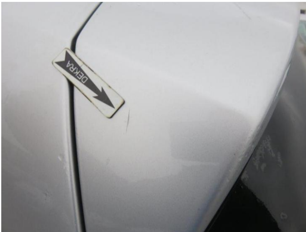
Fot. 49. pokrywa komory bagażnika