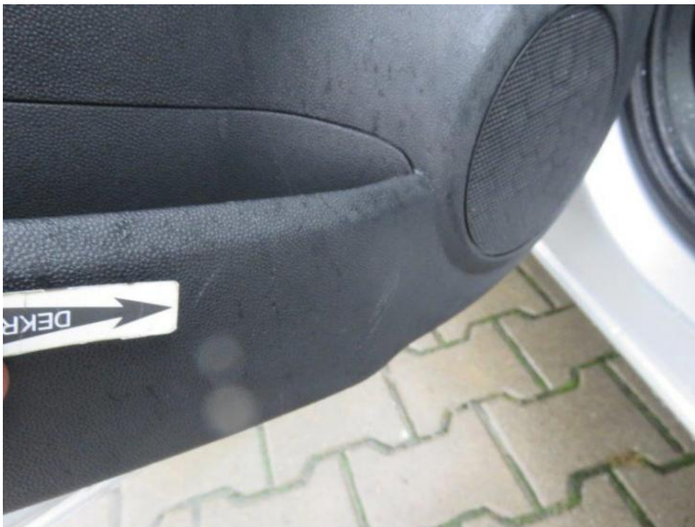
Fot. 25. tapicerka drzwi tylnych lewych