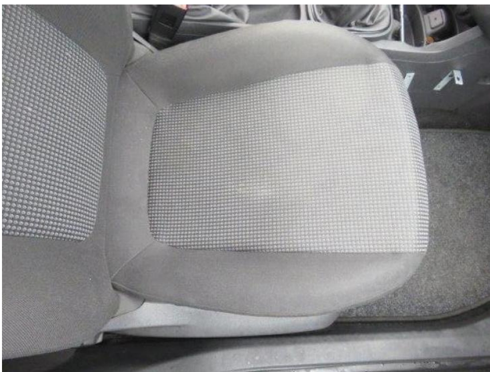
Fot. 17. fotel pasażera