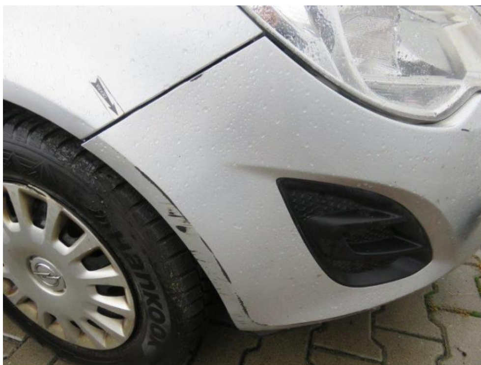
Fot. 64. zderzak przedni