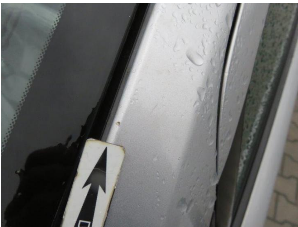
Fot. 37. słupek przedni lewy