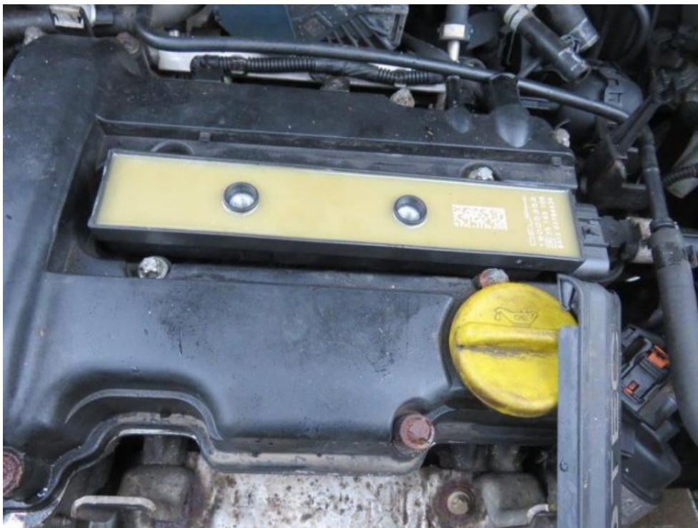
Fot. 29. silnika