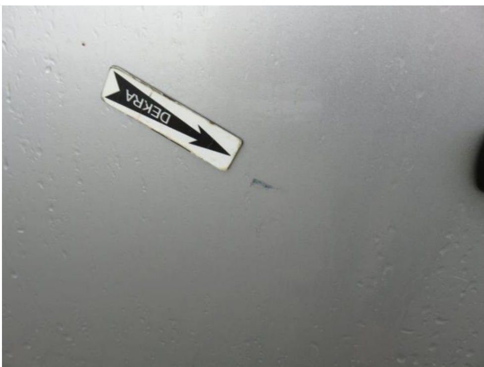
Fot. 42. drzwi tylne lewe