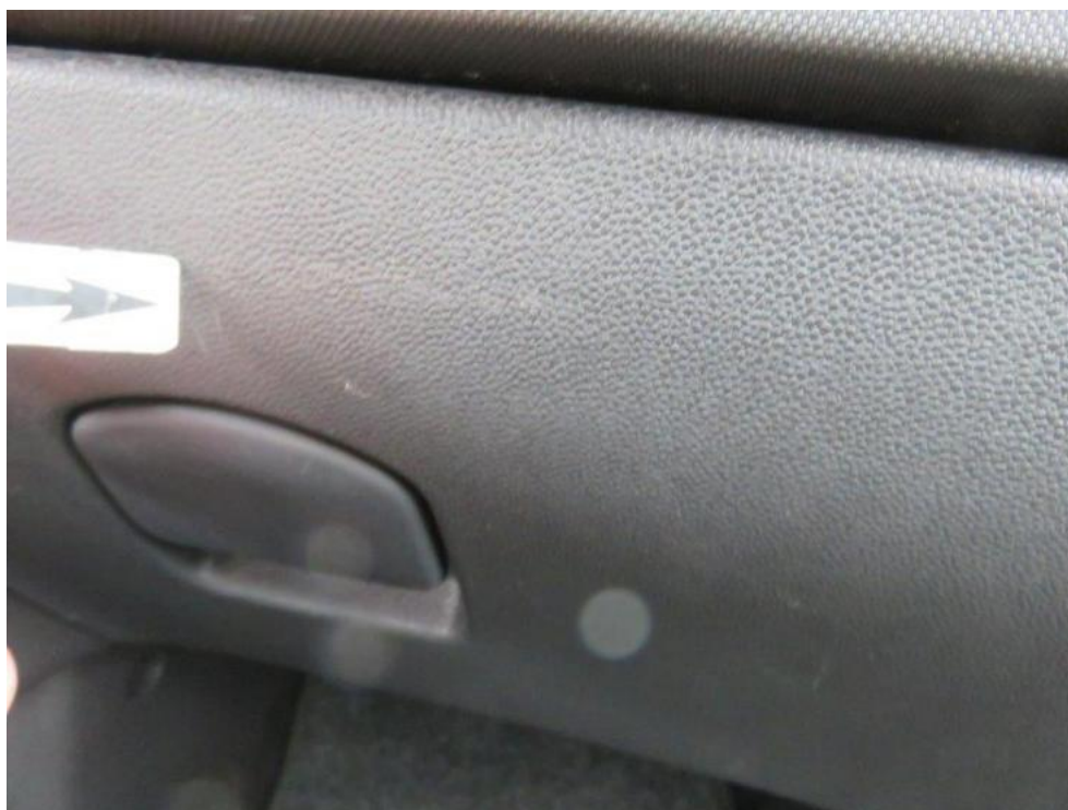
Fot. 19. pokrywa schowka