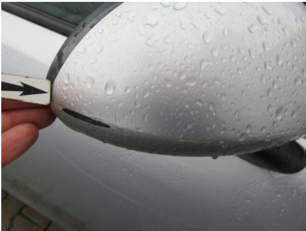
Fot. 61. lusterko zew. prawe