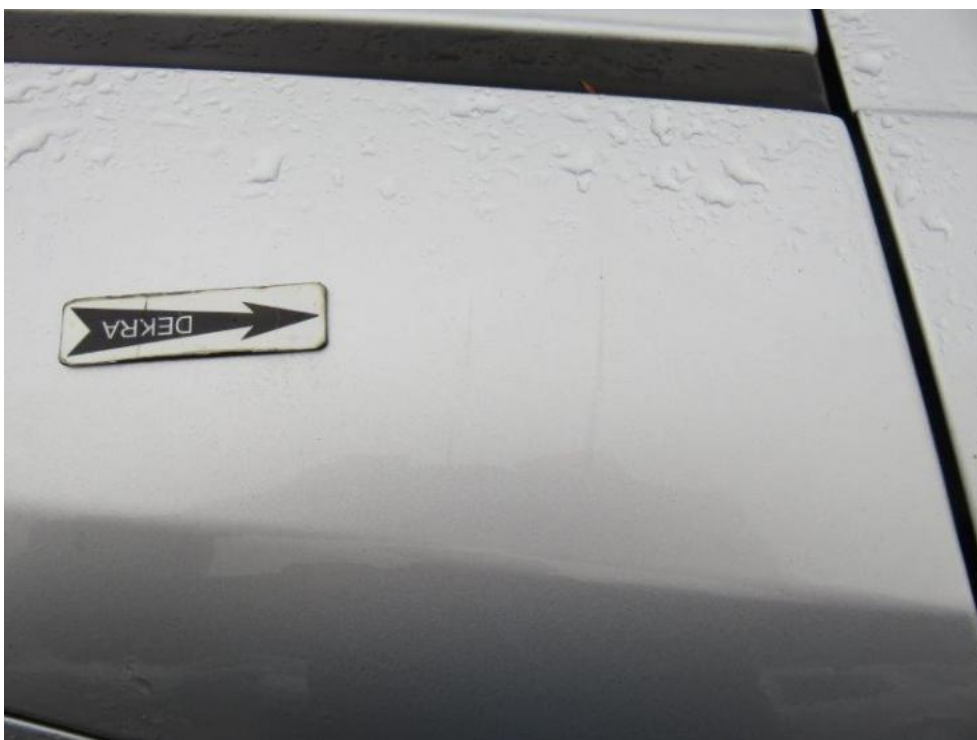
Fot. 46. rama lewa dachu