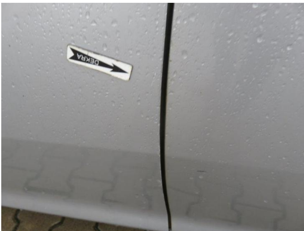
Fot. 40. drzwi przednie lewe