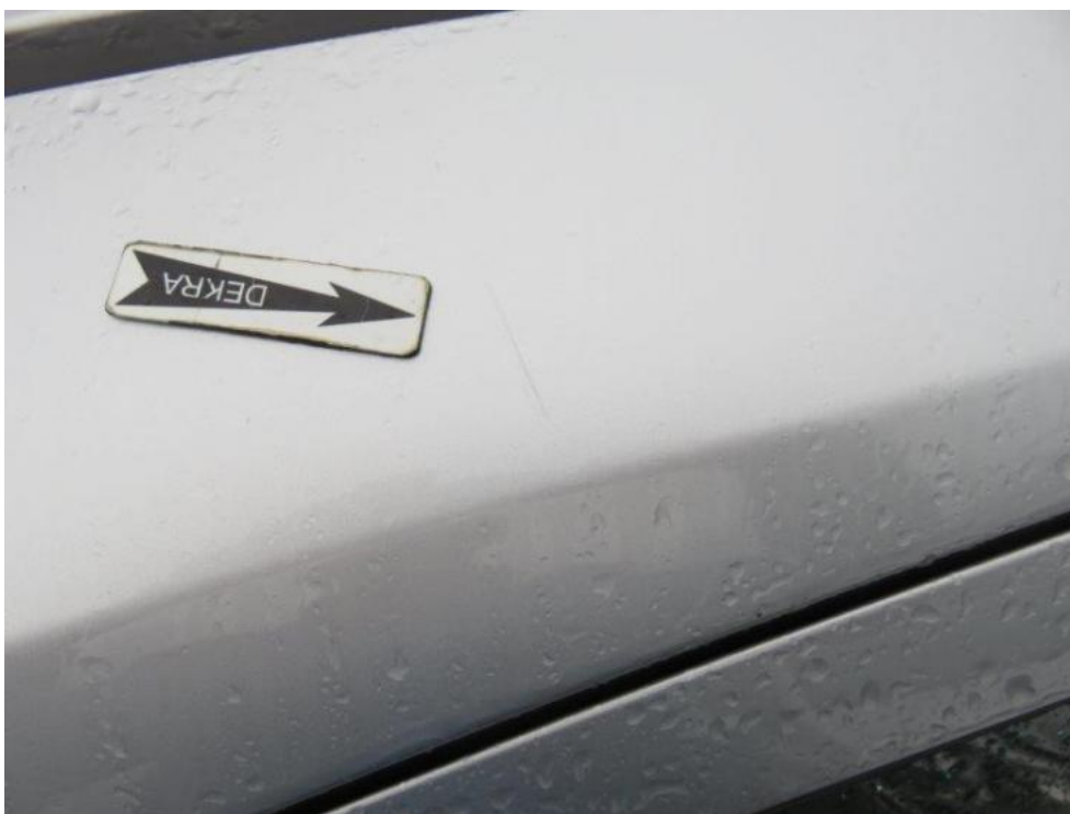
Fot. 59. rama prawa dachu