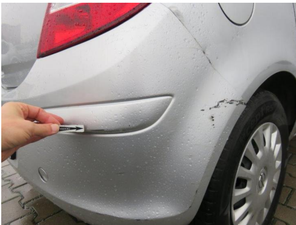
Fot. 51. zderzak tylny