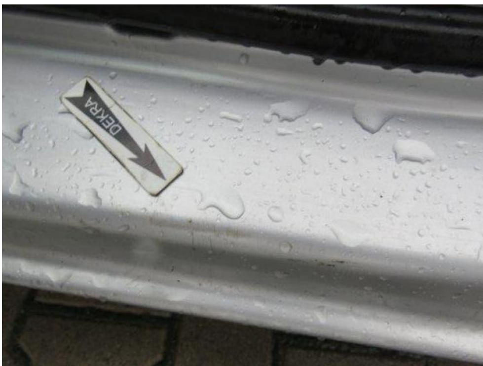
Fot. 28. próg lewy