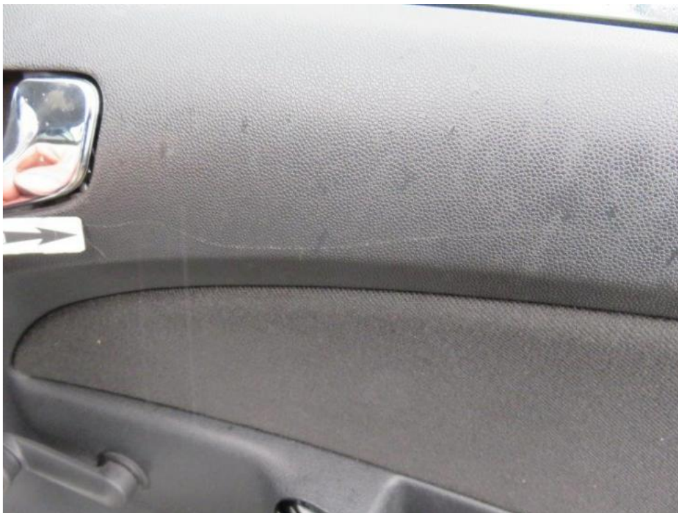
Fot. 23. tapicerka drzwi tylnych prawych