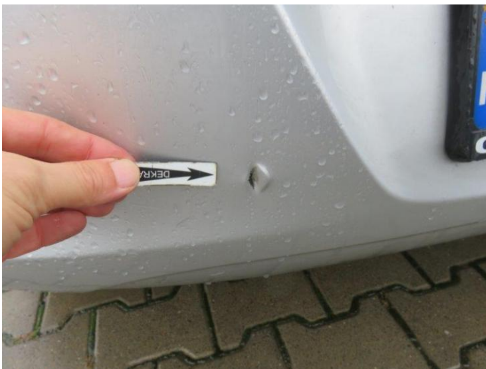
Fot. 50. zderzak tylny