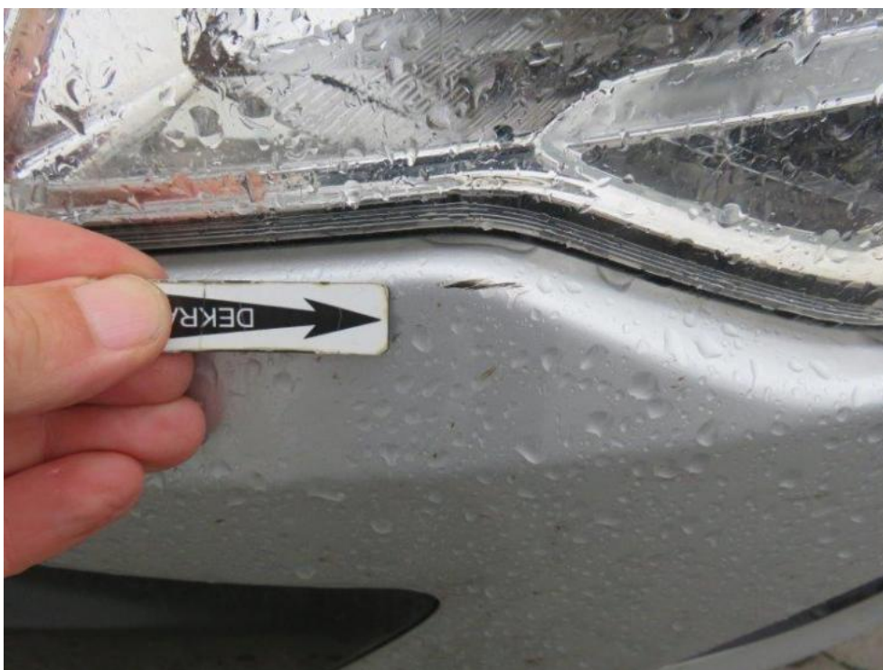
Fot. 32. zderzak przedni