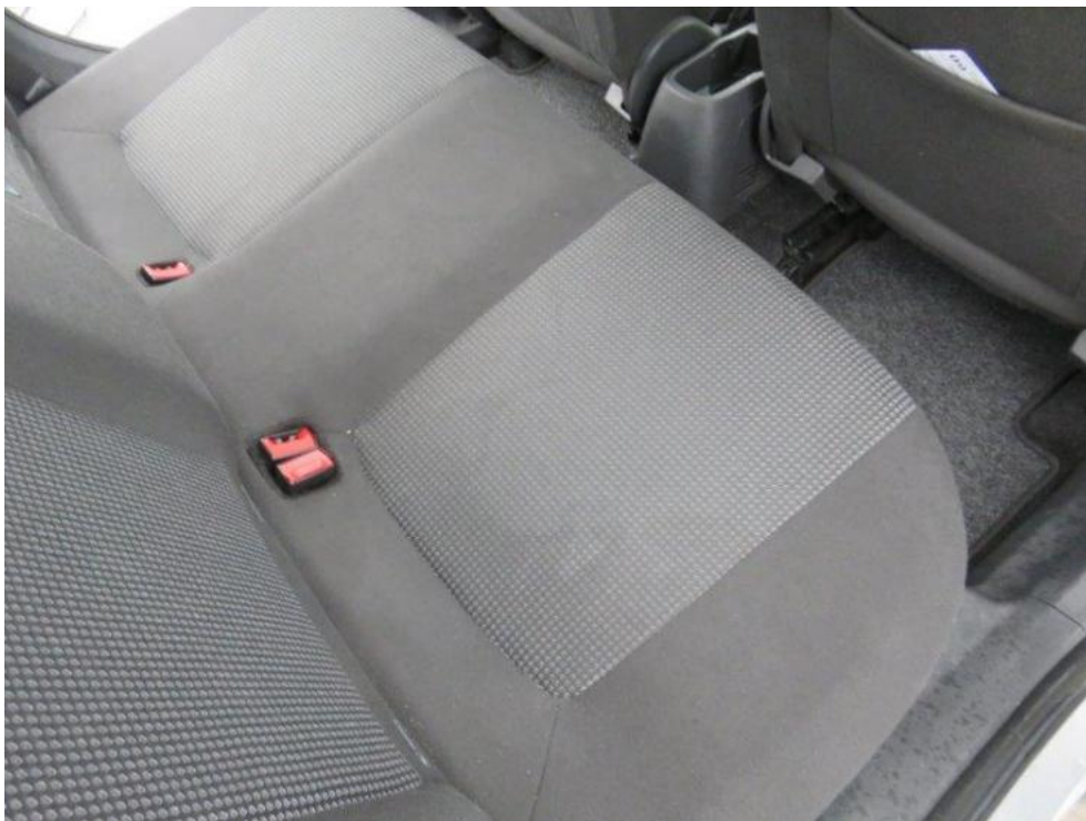
Fot. 21. kanapa tylna