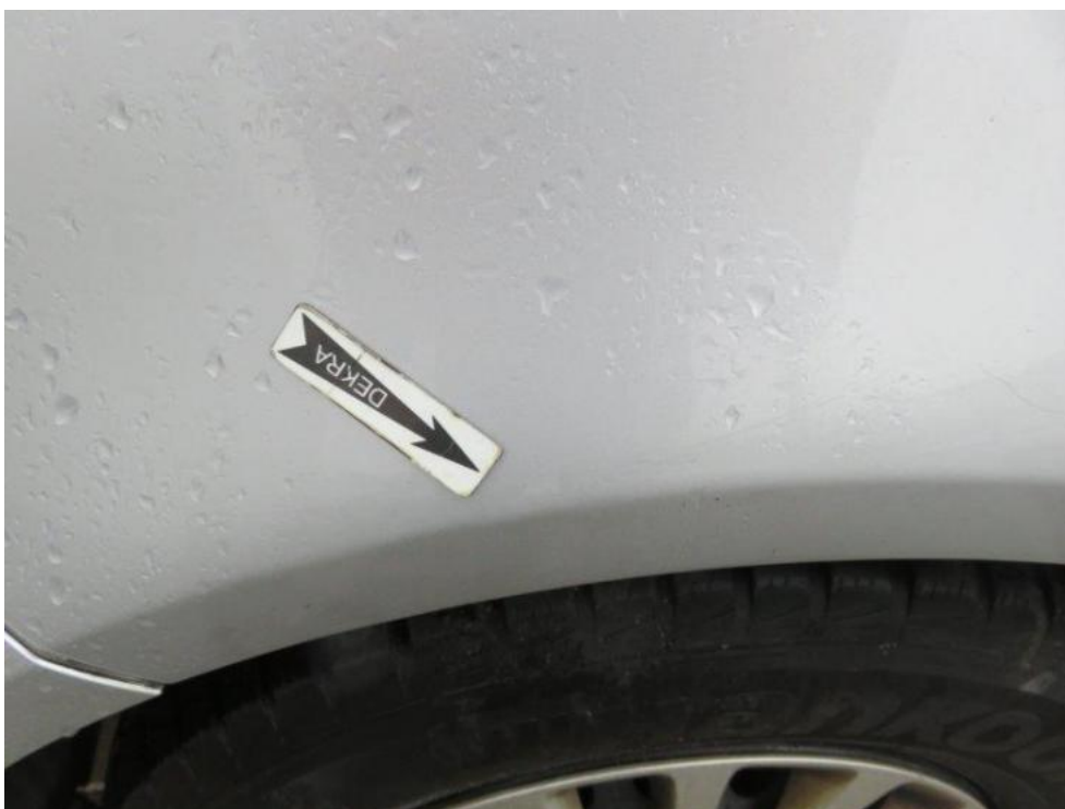
Fot. 34. błotnik przedni lewy