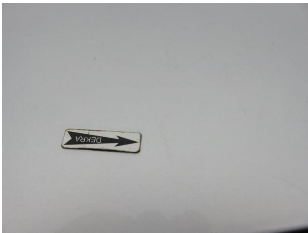
Fot. 47. dach