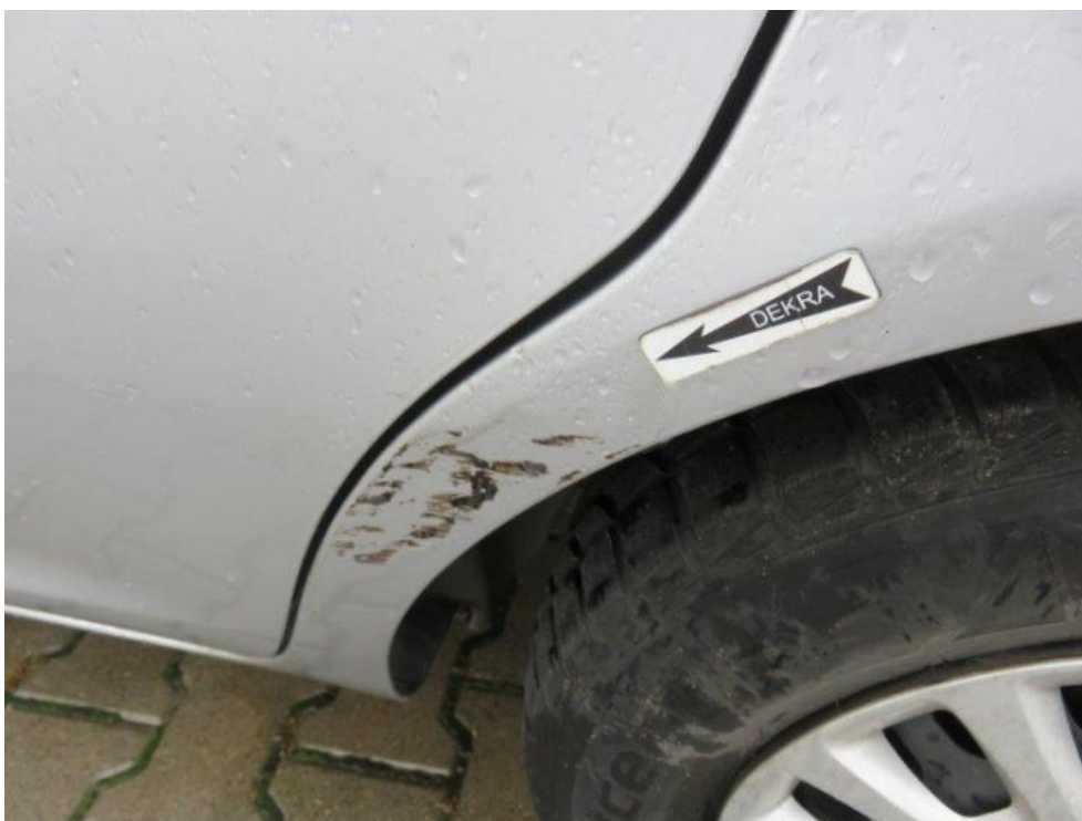
Fot. 44. błotnik tylny lewy