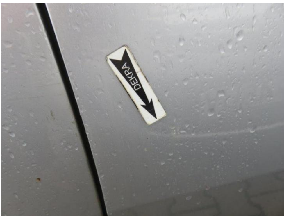
Fot. 57. drzwi przednie prawe