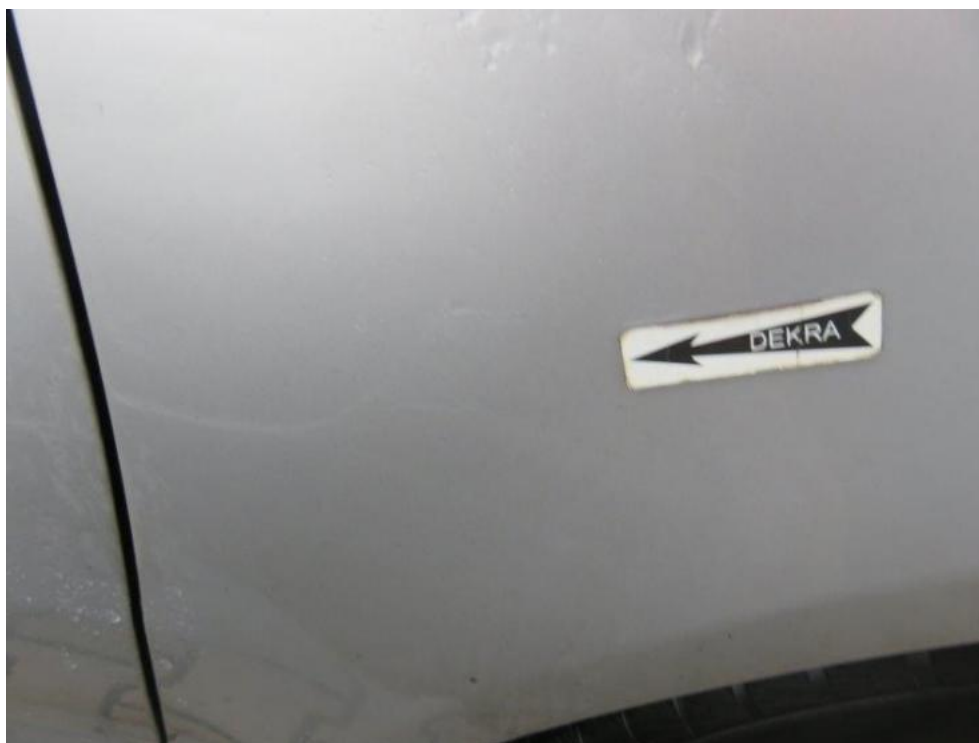
Fot. 63. błotnik przedni prawy