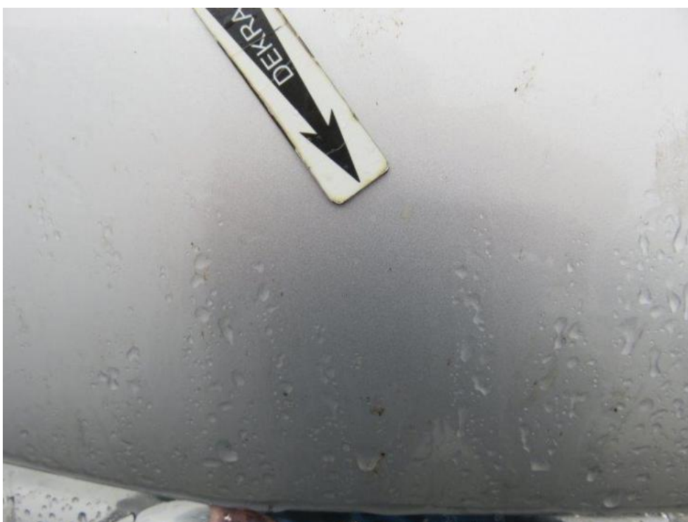
Fot. 66. pokrywa komory silnika