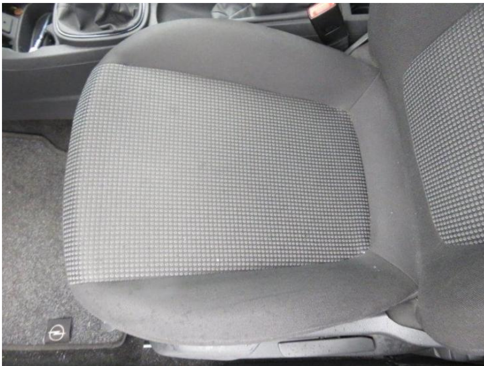
Fot. 27. fotel pasażera