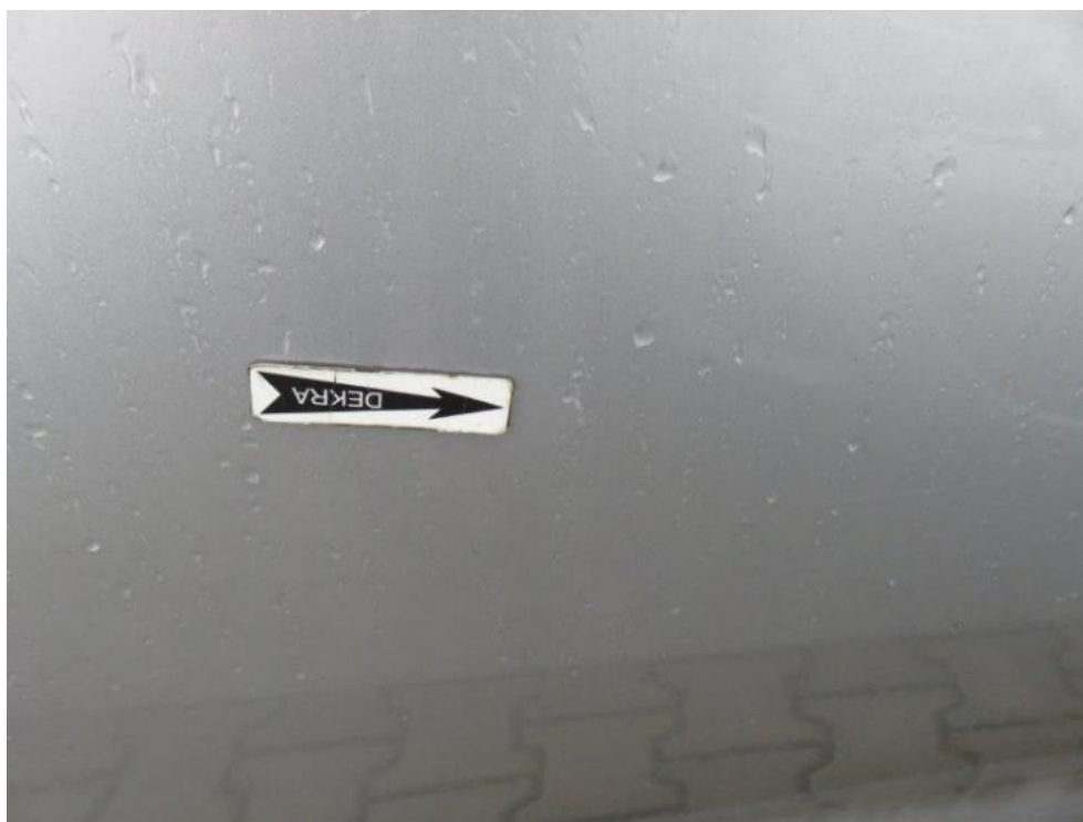
Fot. 55. drzwi tylne prawe