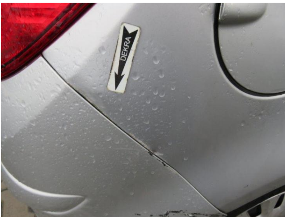
Fot. 53. błotnik tylny prawy