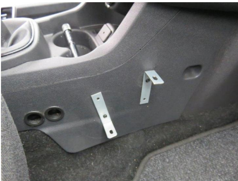
Fot. 18. konsola środkowa