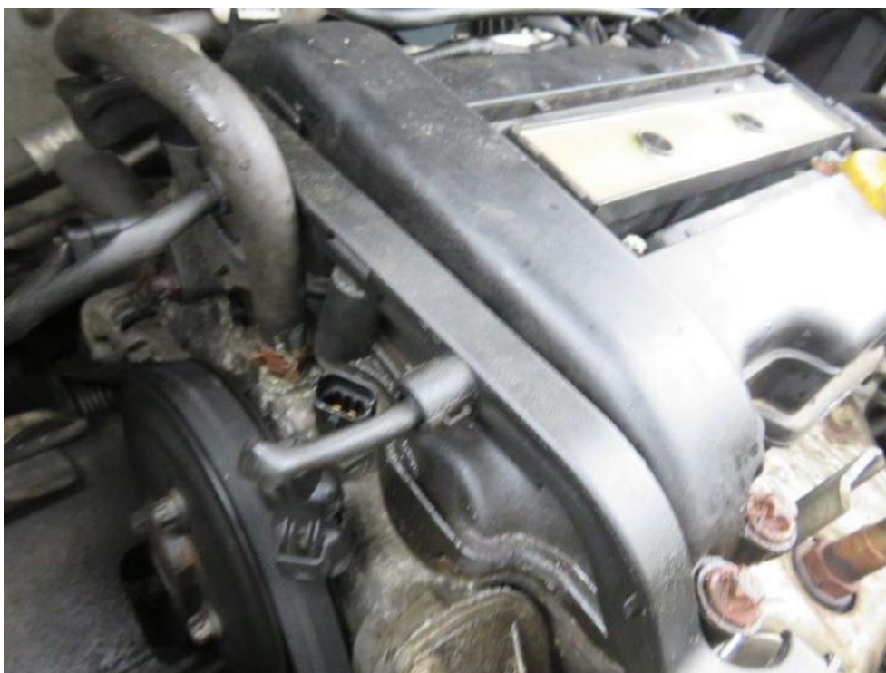
Fot. 30. silnika