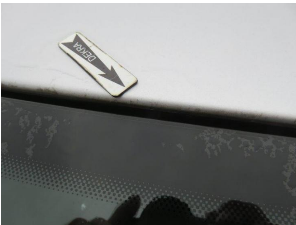
Fot. 38. dach