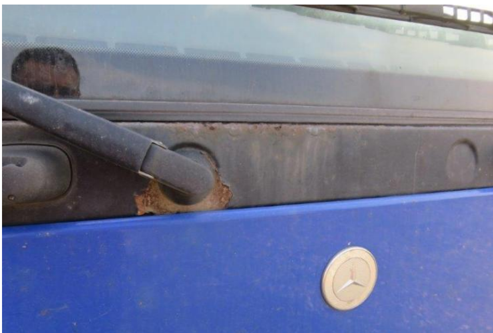
Fot. 24. podszybie