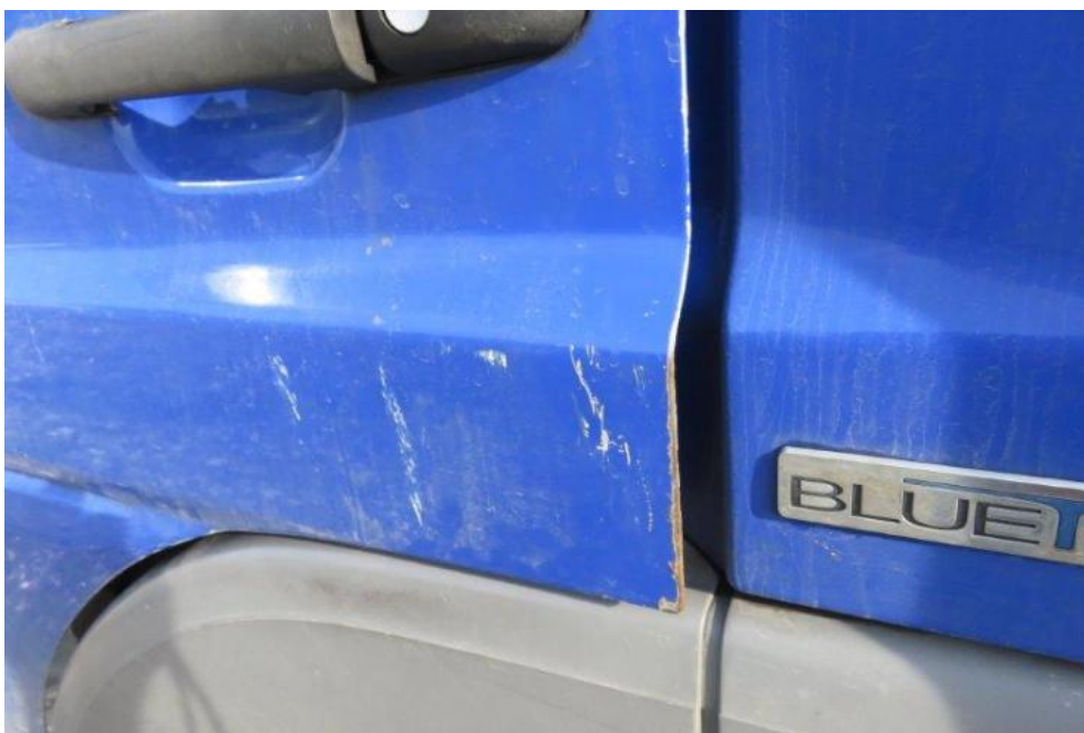
Fot. 37. drzwi lewe