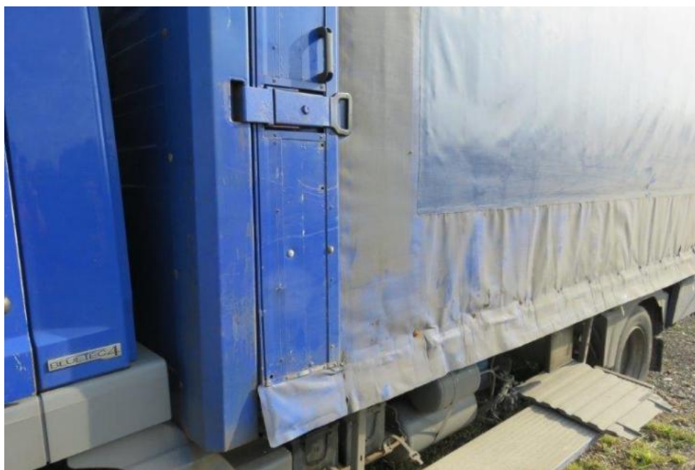
Fot. 41. bok lewy zabudowy