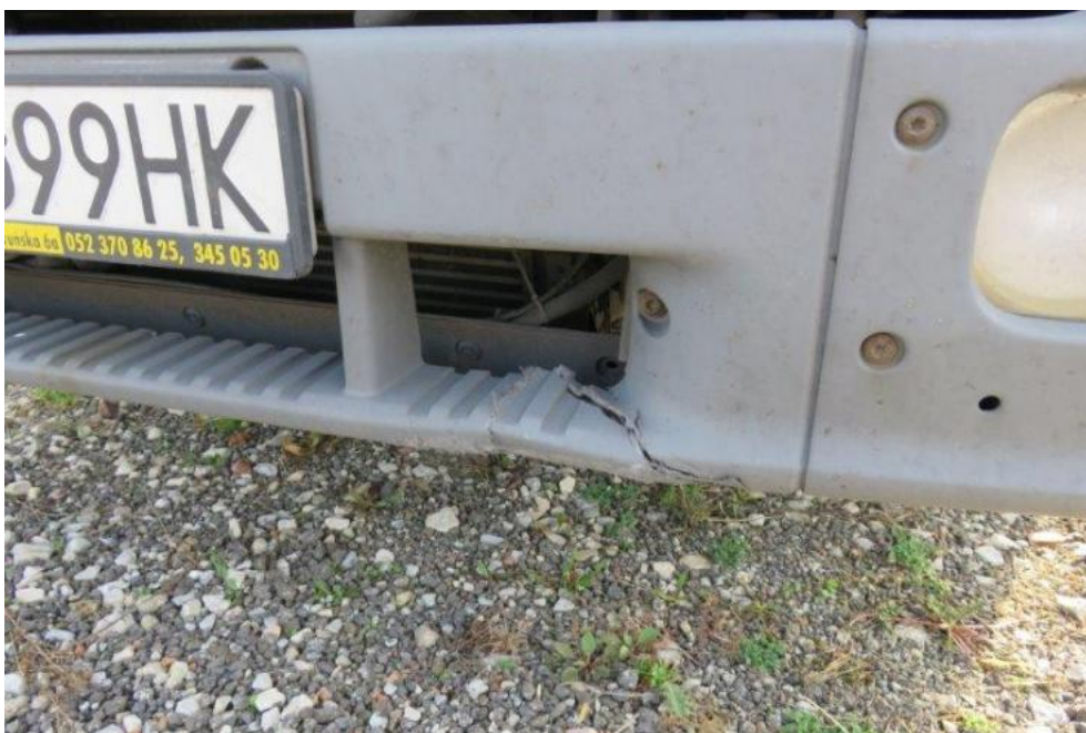
Fot. 28. zderzak przedni