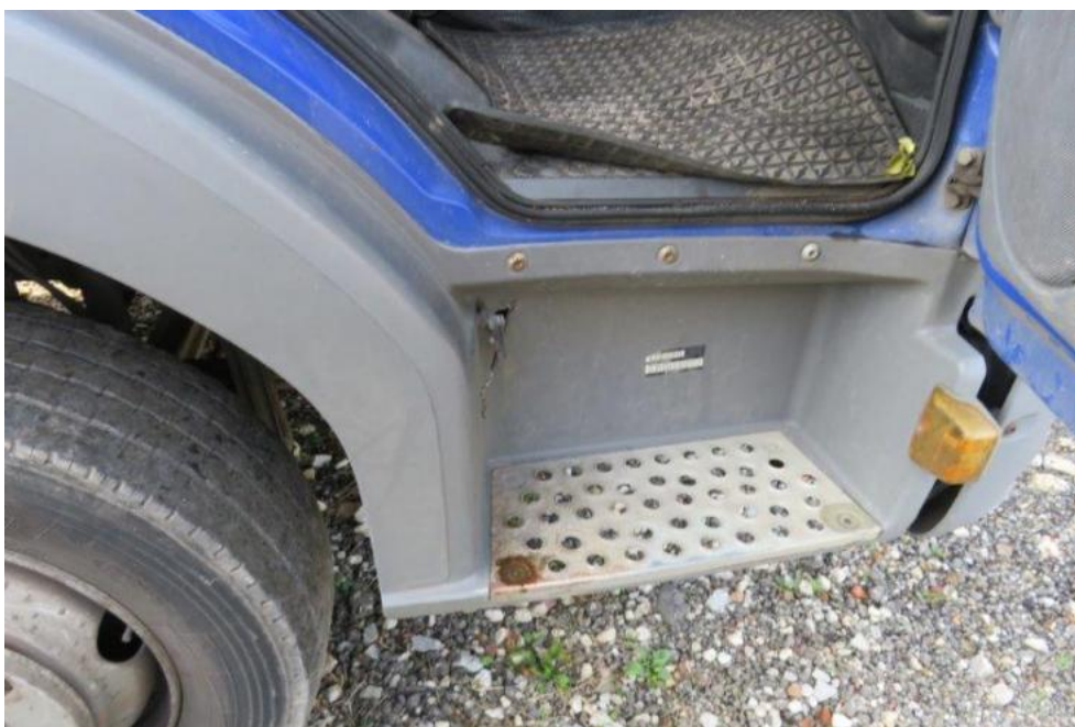
Fot. 14. stopień prawy