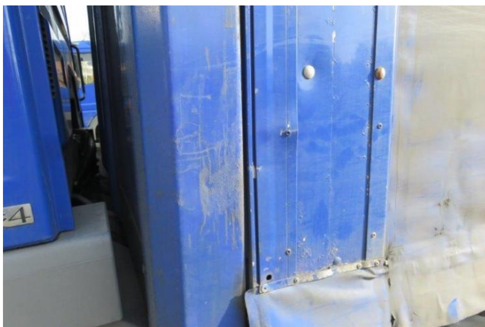
Fot. 42. bok lewy zabudowy