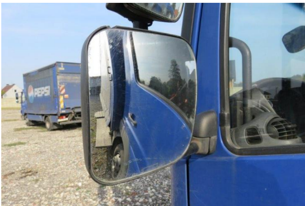
Fot. 40. lusterko zew. lewe