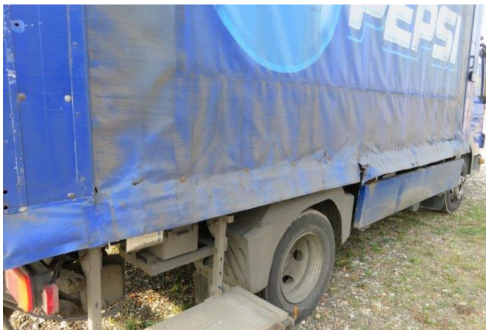
Fot. 49. bok praw zabudowy