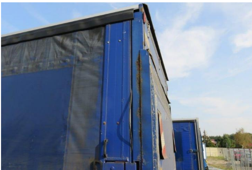
Fot. 46. bok lewy zabudowy