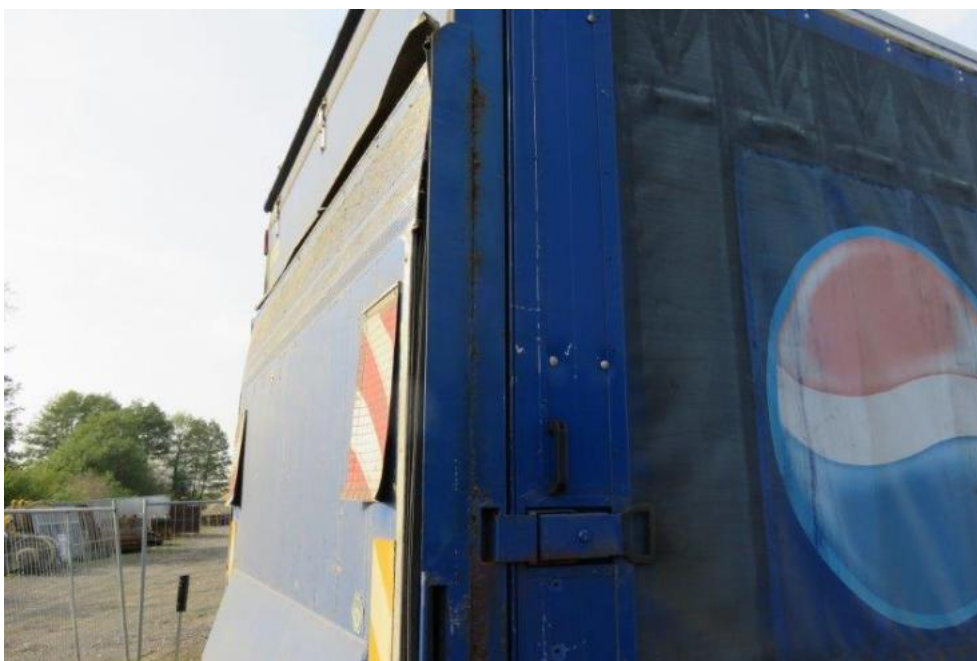
Fot. 48. bok prawy zabudowy