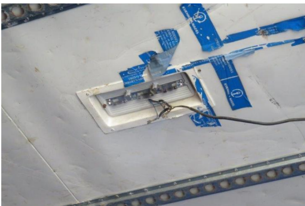
Fot. 52. lampa wew. zabudowy