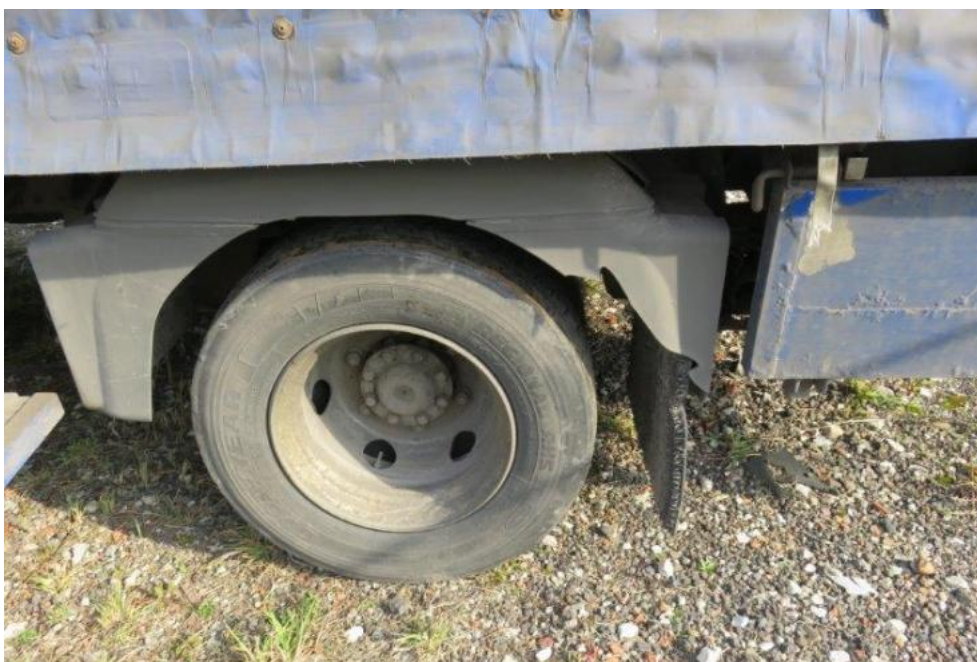
Fot. 43. błotnik TL