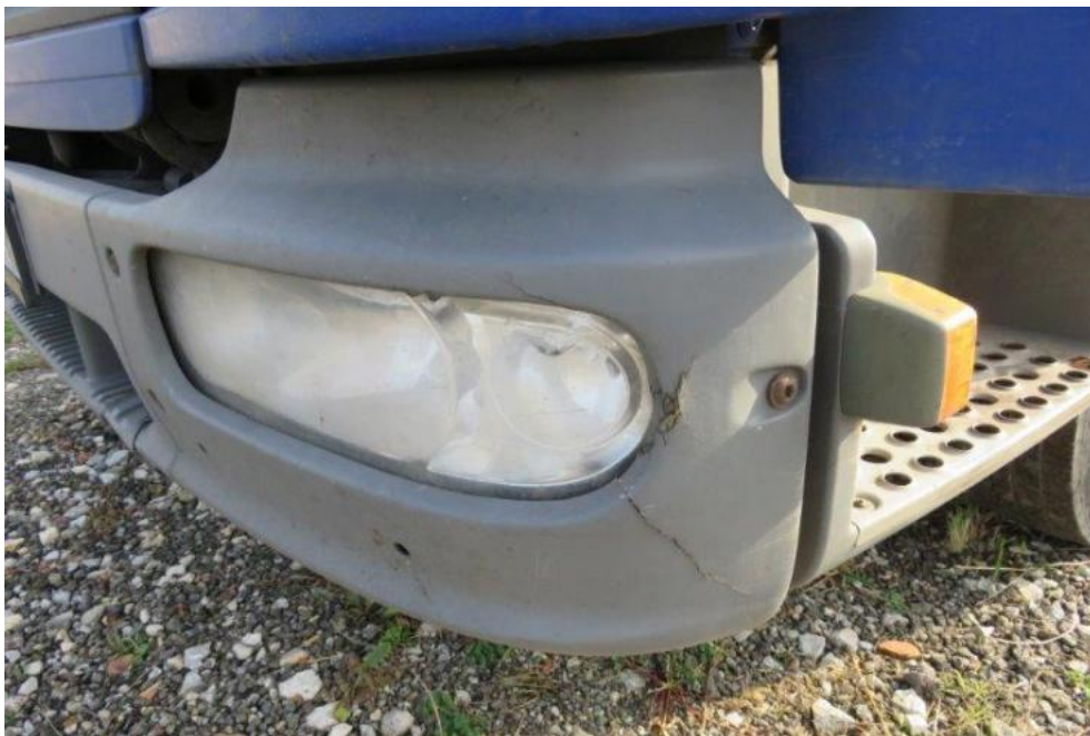
Fot. 29. osłona reflektora lewego