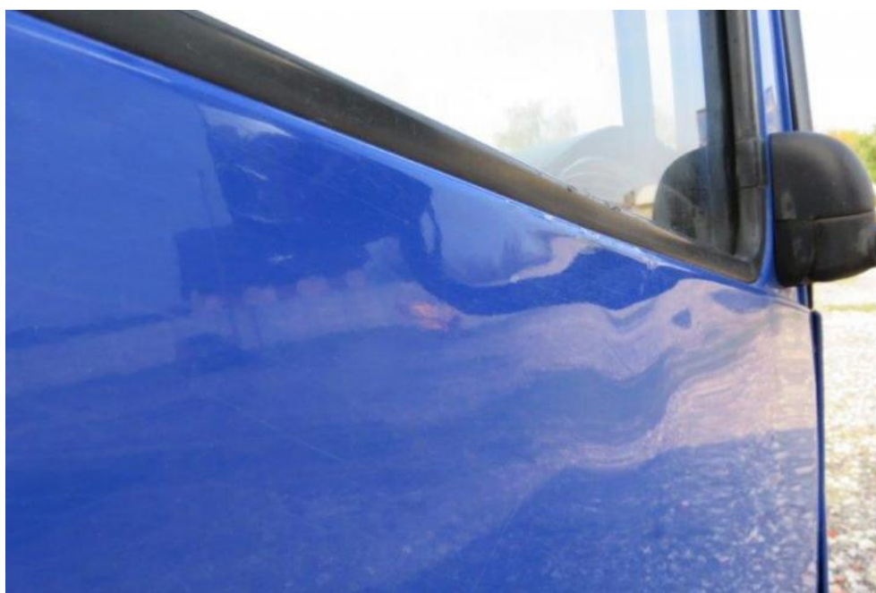
Fot. 18. drzwi prawe