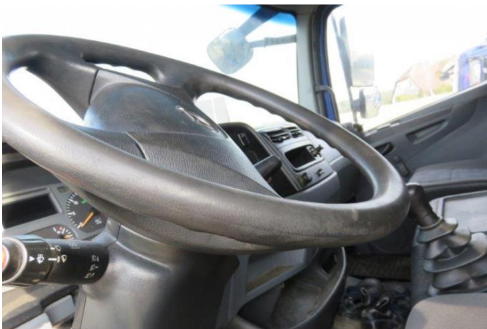
Fot. 34. koło kierownicy