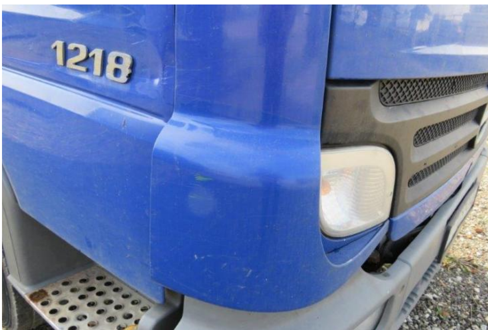
Fot. 22. naroże PR