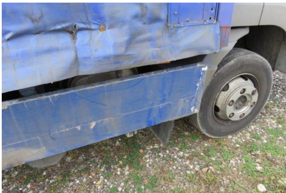
Fot. 50. bok prawy zabudowy i osłona p/najazdowa