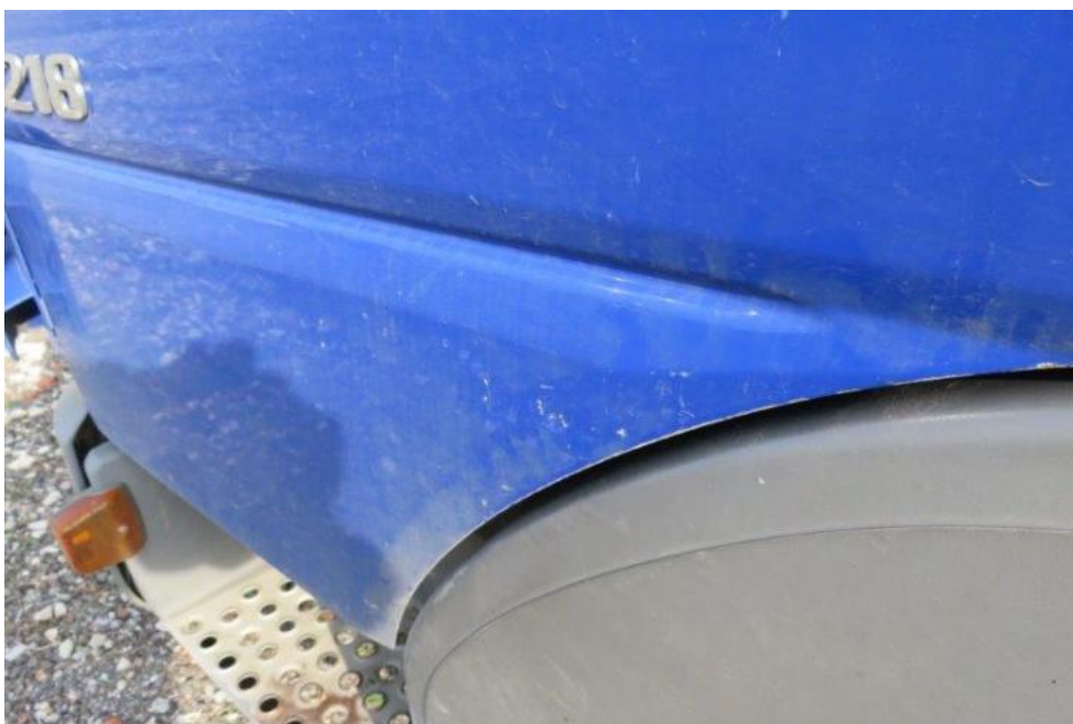
Fot. 38. drzwi lewe