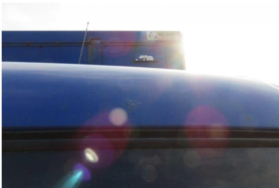
Fot. 26. dach