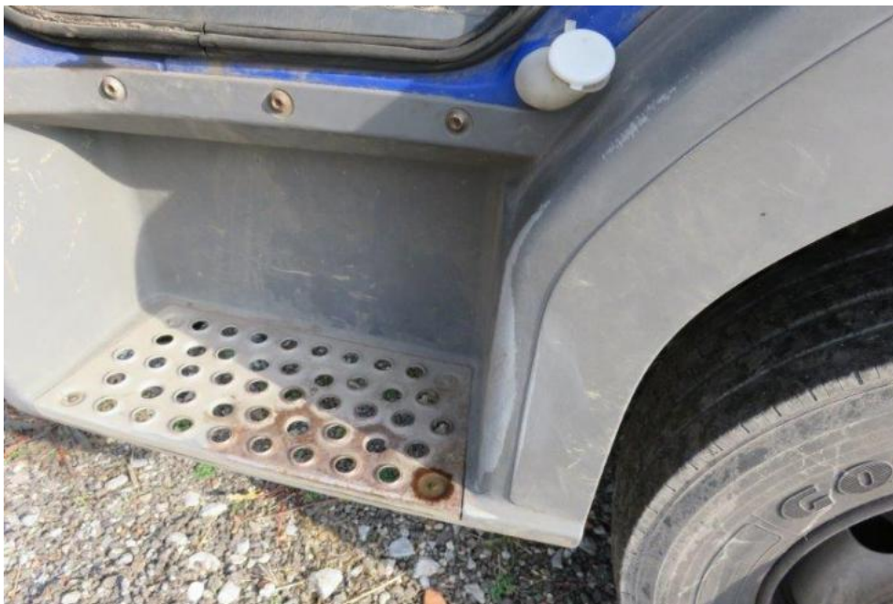
Fot. 33. stopień lewy