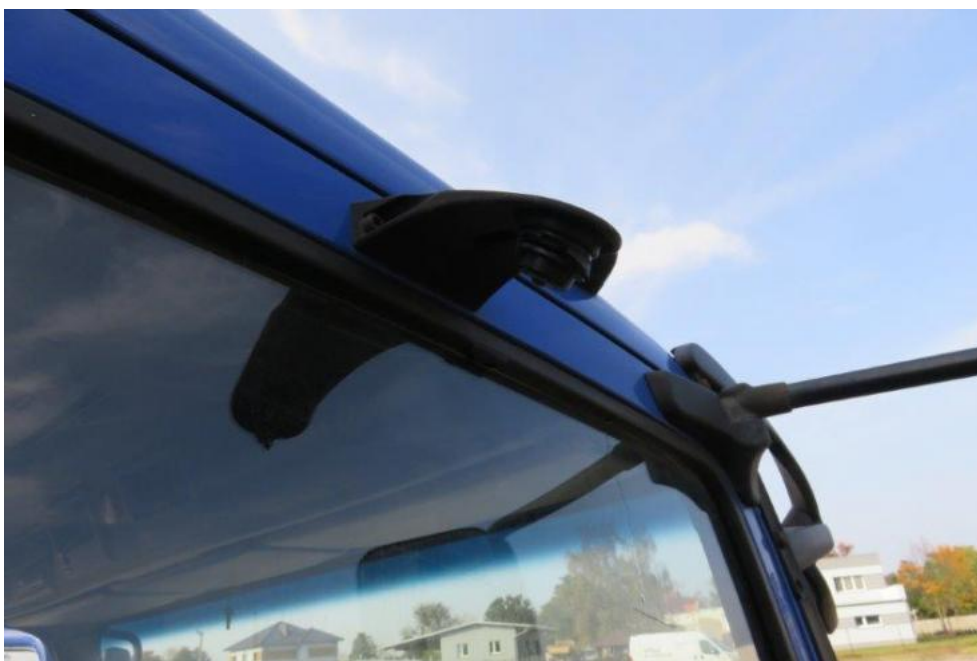
Fot. 20. lusterko zew. prawe