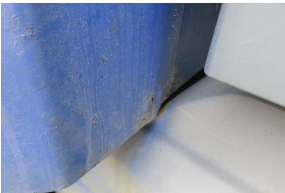
Fot. 16. bok prawy zabudowy