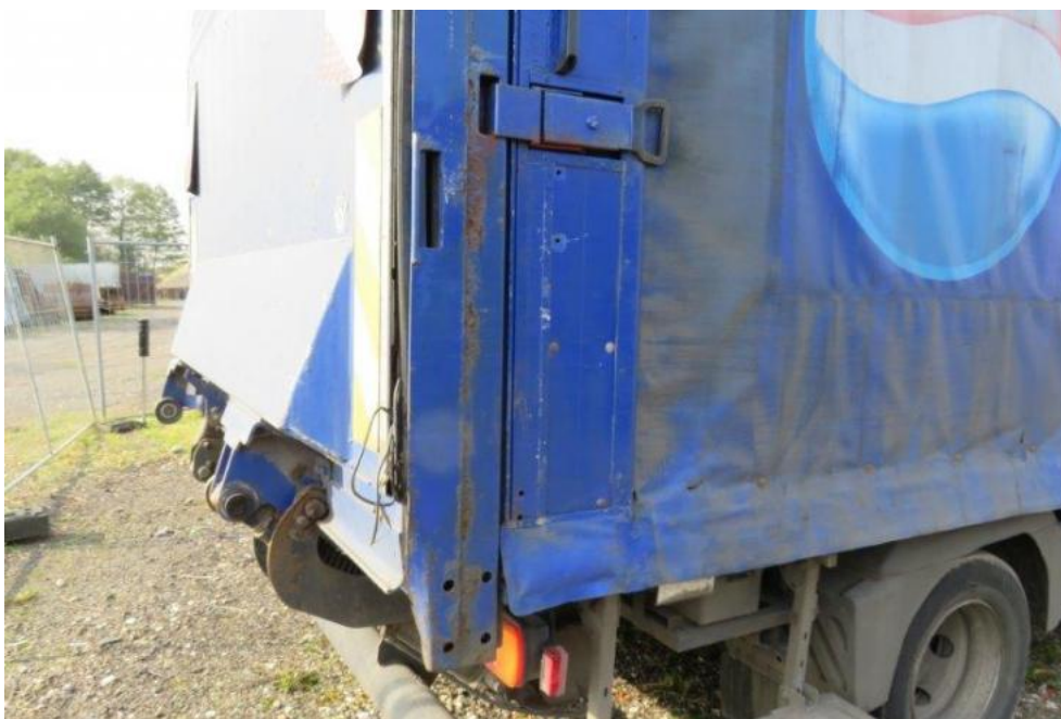
Fot. 47. bok prawy zabudowy