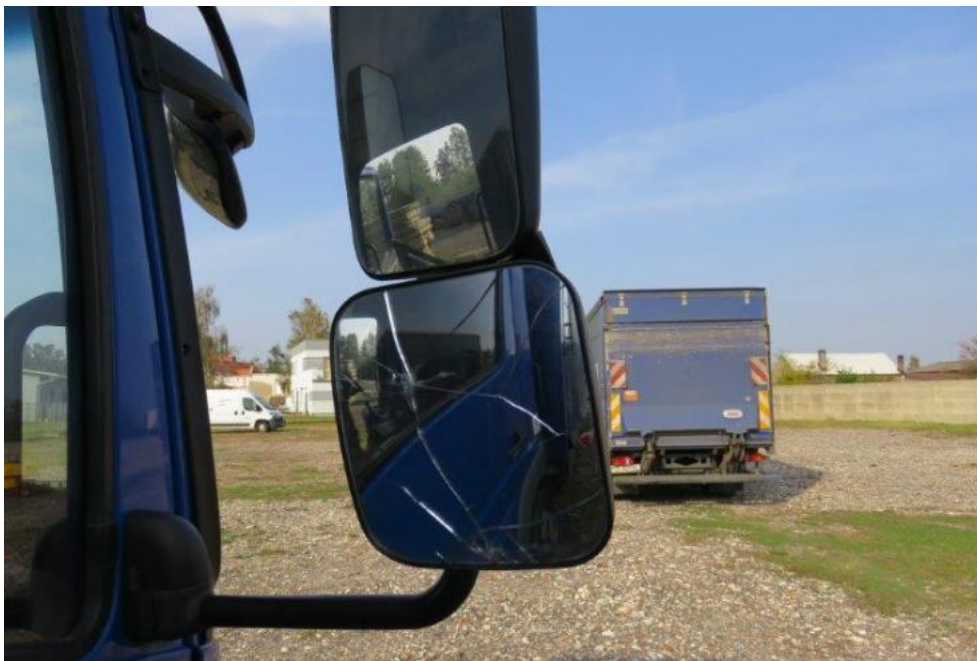
Fot. 19. lusterko zew. prawe