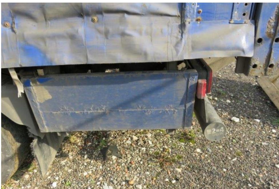
Fot. 44. osłona p/najazdowa TL