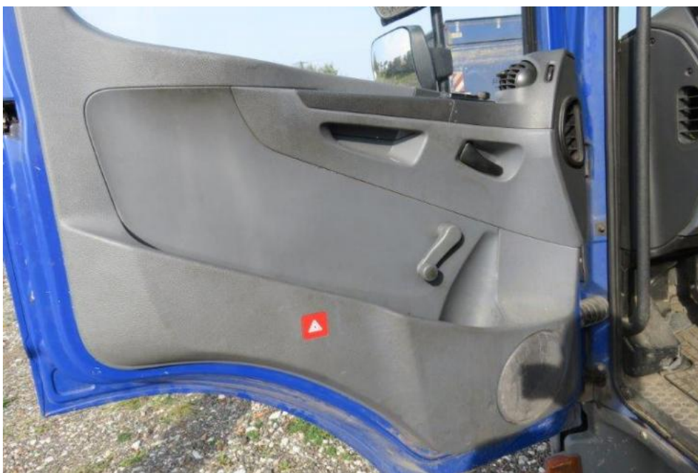
Fot. 35. drzwi lewe