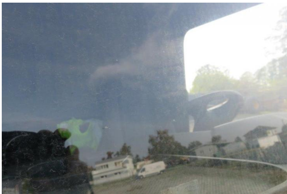
Fot. 25. szyba czołowa