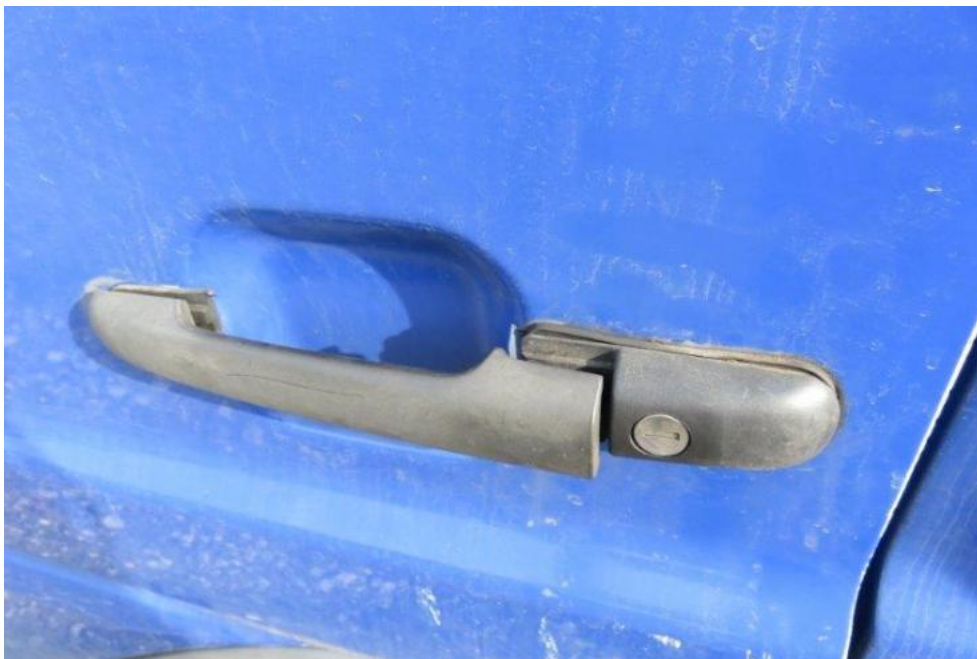
Fot. 39. drzwi lewe