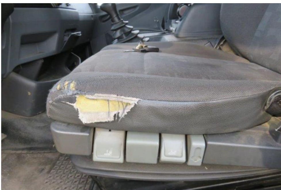
Fot. 32. fotel lewy