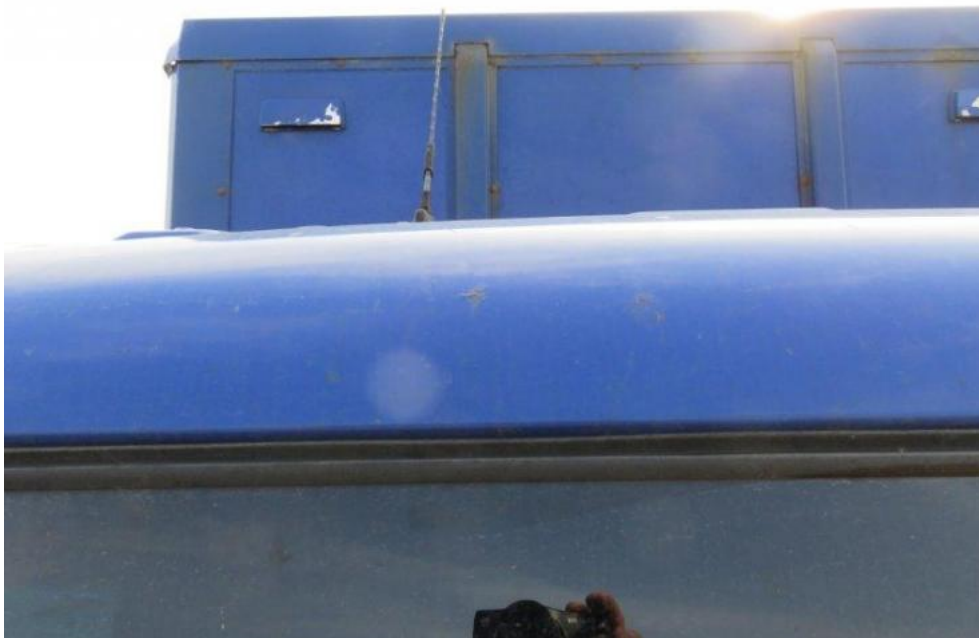
Fot. 27. dach