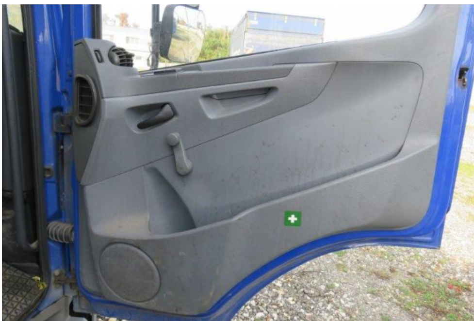
Fot. 13. drzwi prawe