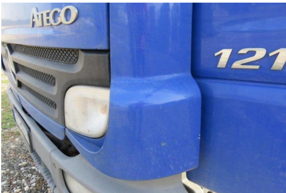
Fot. 30. naroże PL