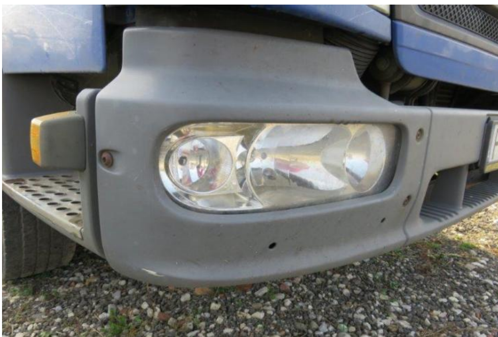
Fot. 23. osłona reflektora prawego