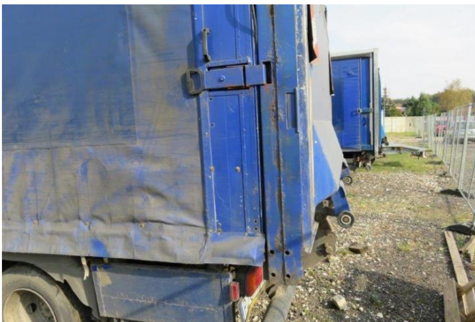
Fot. 45. bok lewy zabudowy